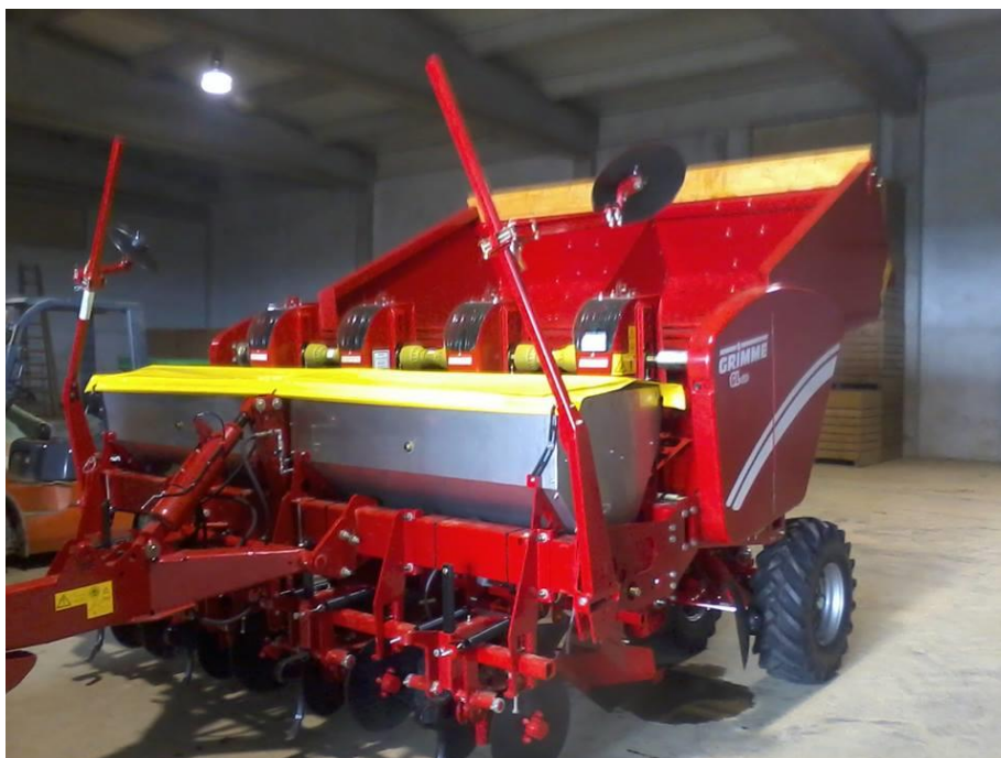
Slika 11. Sadilica za krumpir