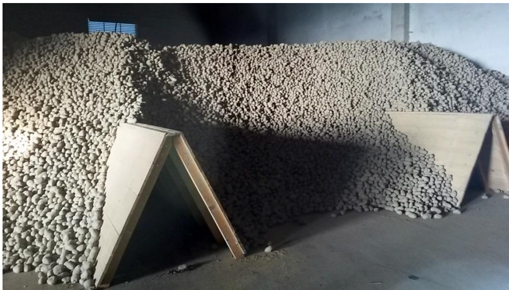
Slika 21. Visina hrpe uskladištenog krumpira s tunelima za ventilaciju

Prilikom hlađenja krumpira hladnim zrakom moramo voditi računa da razlika u temperaturi ne bude prevelika kako se krumpir ne bi "orosio", u vrijeme preniskih temperatura to postizemo miješanjem unutarnjeg i vanjskog zraka. U slučaju da nam se krumpir "orosi" odmah počinjemo sa prozračivanjem kako bi se spriječilo gnjiljenje. Intenzitet disanja krumpira je minimalan pri 7,2°C, dok se iznad i ispod ove temperature značajno intenzivira. Za većinu sorata krumpira temperatura ispod 3,0° i iznad 15,0° izaziva značajno povećanje u respiraciji te ove temperaturne vrijednosti tijekom čuvanja gomolja nikako nisu preporučljive (Canadian Horticultural Council).