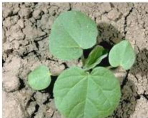
Slika 16. Širokolisni korov ( Abutilon )

Na OPG-u Kolarić aplicirani su herbicidi PLATEEN 2 kg/ha i SENCOR 0,5 kg/ha.