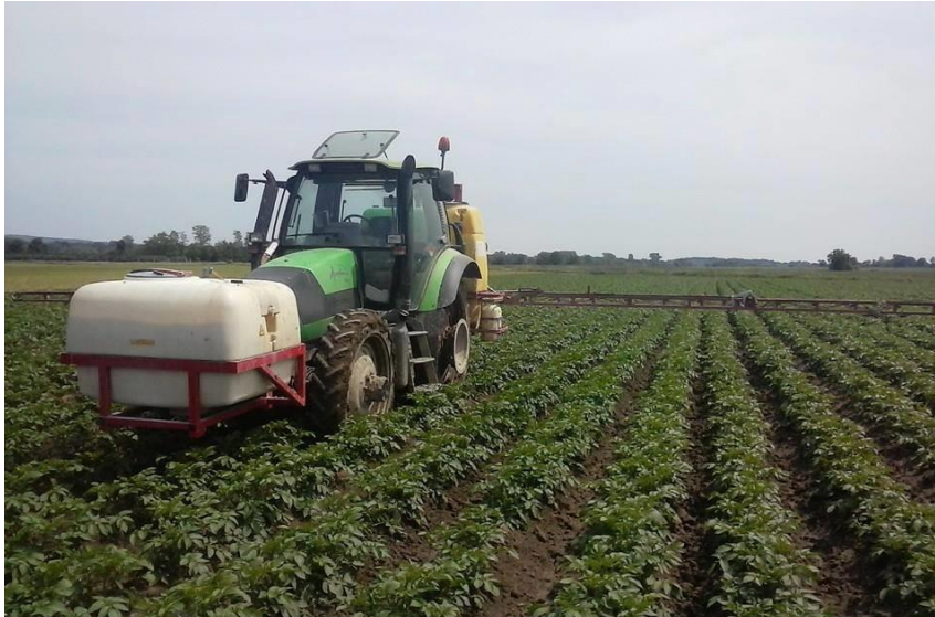
Slika 15. Kemijsko tretiranje nasada