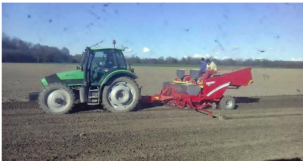
Slika 12. Sadnja krumpira