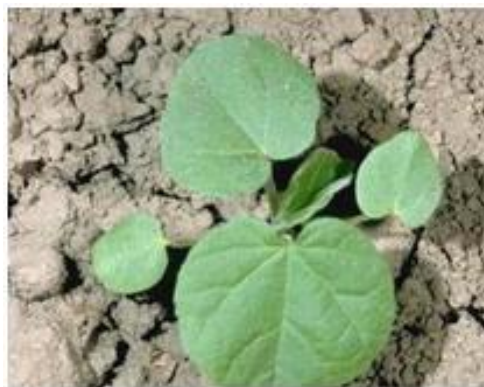
Slika 16. Širokolisni korov ( Abutilon )

Na OPG-u Kolarić aplicirani su herbicidi PLATEEN 2 kg/ha i SENCOR 0,5 kg/ha.