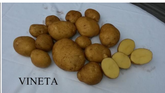
Slika 4. Gomolji sorte Vineta