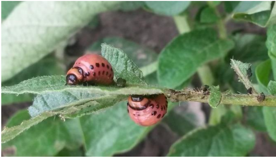
Slika 17. Ličinke krumpirove zlatice