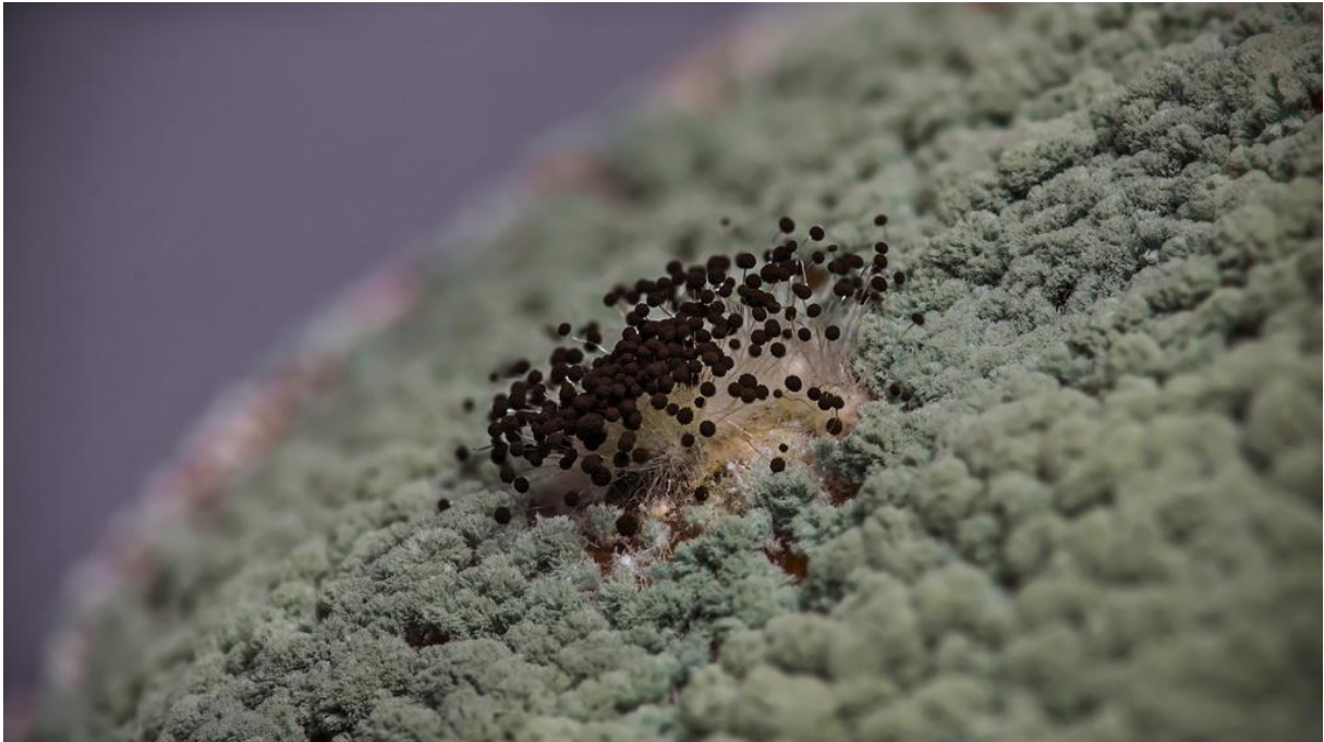
Slika 8. Trichoderma viride

apsorpcije hraniva te na taj način uvjetuje bolji razvoj korijena što na kraju dovodi i do većeg prinosa.( Slika 8.).