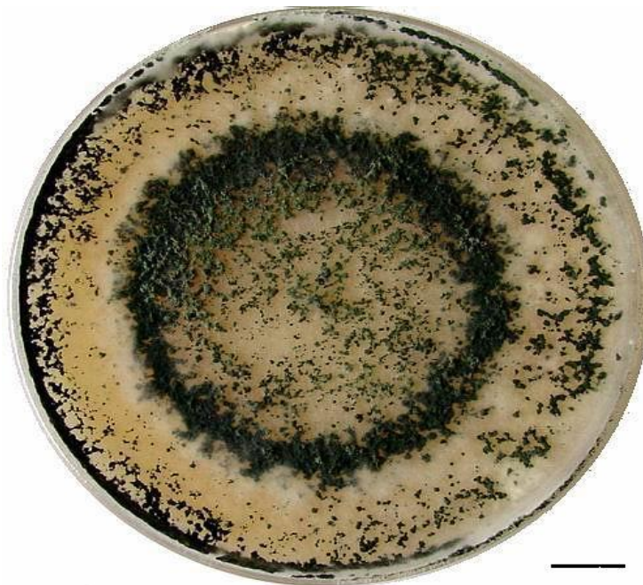
Slika 9. Izgled kolonije T. viride

Trichoderma viride stimulira rast korijena, povećava usvajanje i upotrebu hraniva što dovodi do bujnijeg rasta. Danas se smatra kako je utjecaj T. viride od velike važnosti za poljoprivrednu proizvodnju kao i shvaćanje uloge Trichoderma vrsta u ekosustavu (Topolovec - Pintarić i sur. 2013.).