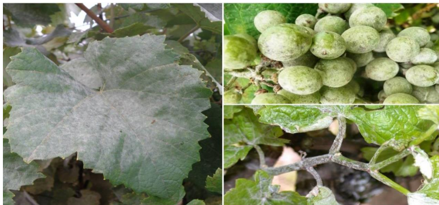
Slika 1. Pepelnica na vinovoj lozi

Napad na bobicama je moguć od zametanja do šaranja, ali je većinom kada su bobice veličine graška. Bobice zaražene odmah nakon oplodnje zaostaju u razvoju, a koža im je deblja i tvrda. One zadržavaju sivo - pepeljastu boju i za suhog vremena se suše, a vlažnog trunu. Zaražene mlade bobice se suše bez pucanja. Optimalna temperatura za infekciju i razvoj bolesti je između 20 i 27°C, dok temperatura iznad 35°C inhibira klijanje konidija (Pinova, 2016.). Na slici 1. vidimo pepelnicu na vinovoj lozi.