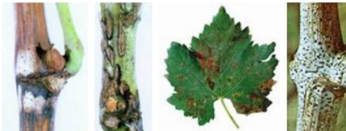
Slika 3. Crna pjegavost na vinovoj lozi

Suzbijanje crne pjegavosti obavlja se već kod rezidbe vinograda tako da se zaraženi dijelovi odrežu i spale. Gnojidba dušikom treba biti umjerena, neophodna je primjena fungicida (Brmež, 2010.). Na slici 3. je prikaz crne pjegavosti na vinovoj lozi.