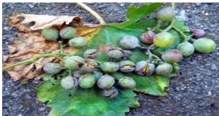
Slika 2. Plamenjača na bobicama vinove loze

Zaraženi dio cvijeta ili cvat pokriva se za vrijeme vlažnog perioda bjelkastom prevlakom sporangiofora da bi ubrzo zatim oboljeli dijelovi dobili tamnu boju i sasušili se (Cvjetković, 2010.). Bobice pak mogu biti zaražene od zametanja do šaranja. Kod zaraze mladih bobica do zaraze dolazi kroz puči na bobicama, javlja se bjelkasta prevlaka, a bobice se kada nastupi suho vrijeme suše i otpadnu. Takve bobice se smežuraju, a kožica postaje kožasta i poprima smeđe - ljubičastu boju (Agrios, 2005.). Na slici 2. vidimo plamenjaču na bobicama.