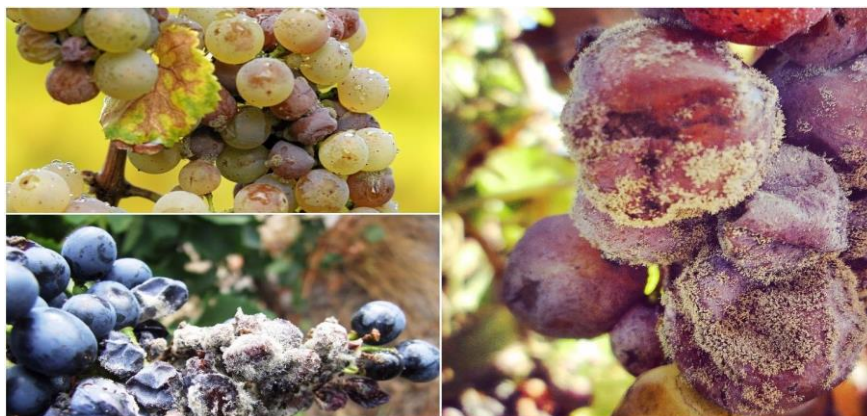
Slika 4. Grozdovi zaraženi gljivicom Botrytis cinerea

U vinogradima se pojavljuje zbog pojačane gnojidbe, visokorodnih sorata zbijenih grozdova, bujnih čokota, zbog ostavljanja velike lisne mase za dovoljnu asimilaciju. Napada listove i mladice, ali najopasniji je napad u vrijeme dozrijevanja grožđa kada uzrokuje sivu trulež bobica i dovodi do propadanja cijelih grozdova. Grozdovi zaraženi gljivicom Botrytis cinerea (slika 4.) se prepoznaju po smeđim pjegama, ako je vrijeme vlažno javljaju se pepeljasto sive prevlake. Pojavljuje se u svim vinogradima i može smanjiti berbu u velikom postotku (u kontinentalnom dijelu i do 60%) te utjecati na kvalitetu vina.