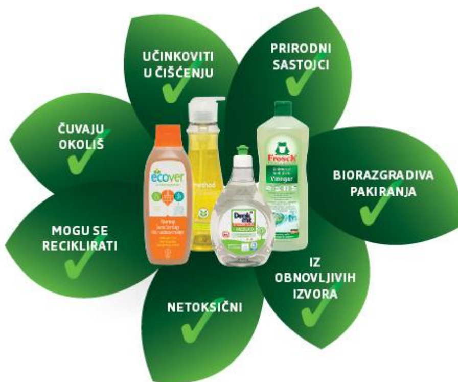
Slika 10. Zeleni proizvod

Proizvod koji ne šteti okolišu ili ima minimalan negativan učinak na okoliš smatra se zelenim proizvodom. On nastaje kao rezultat marketinški odgovornog razmišljanja i ponašanja te primjene usavršene tehnologije proizvodnje. Baterije koje se mogu puniti, štedljive žarulje, aparati koji koriste solarnu energiju poput kalkulatora ili sata samo su neki od primjera mogućih zelenih proizvoda. Također proizvodi u prehrambenoj industriji koji su napravljeni bez primjene pesticida i ostalih štetnih tvari možemo uvrstiti u zelene proizvode, te već tu ulazimo u ekološku proizvodnju.