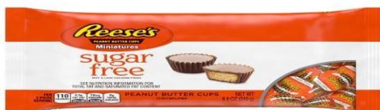
Slika 4. Proizvod bez šećera

Etički problem se može pojaviti u raznim oblicima, a najčešće se javlja u probleme ili pitanja koja se odnose na određeni proizvod ili uslugu koje to poduzeće nudi. Može se primijetiti prilikom etiketiranja proizvoda gdje proizvođači prehrambenih proizvoda na etikete najčešće stavljaju kako je njihov proizvod bez masnoća, sa smanjenom količinom šećera ili bez šećera, itd., a određenom analizom se utvrdi da nije tako te se time obmanjuju potrošači lažnim informacijama.