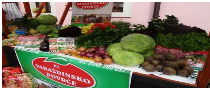
Slika 8. Poljoprivredna zadruga Varaždinsko povrće

Ukoliko poduzeće usvoji koncept društveno odgovornog poslovanja ima dobar izgled za dugoročno poslovanje. Potrošači će radije uvijek izabrati proizvod i usluge za koje vjeruju da se njihovi proizvođači brinu o poduzeću, interesima pojedinaca te cjelokupnoj društvenoj zajednici. Takvi proizvođači stječu određeni ugled među svojim potrošačima, a ugled ima veliku važnost u procesu odlučivanja potrošača u odabiru određenog proizvoda ili usluge. Primjer iz prakse: Poljoprivredna zadruga Varaždinsko povrće iz Varaždina proizvode povrće na svojoj njivi te putem partnera kao što se Gradska tržnica Varaždin, Caritas, Crveni križ i ostale humanitarne udruge pomažu svojoj lokalnoj zajednici. Najviše se donira zelje i krumpir što je karakteristično za to područje. Na taj način putem udruga i institucija pomažu brojnim pojedincima i obiteljima u potrebi na području Varaždinske županije, ali i u ostalim dijelovima Republike Hrvatske.