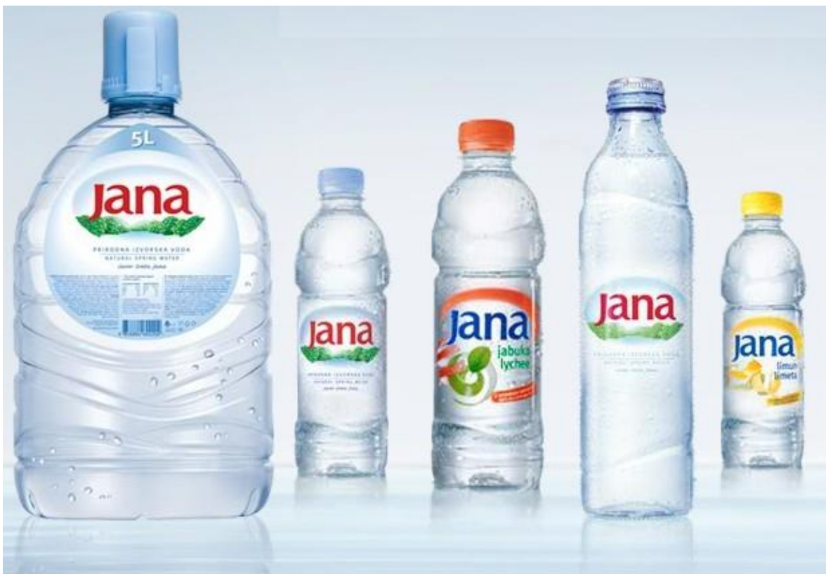
Slika 11. Zelena ambalaža

Taj naziv se pripisuje ambalaži kojoj je negativan utjecaj na okoliš smanjen na najmanju moguću mjeru, što podrazumijeva nekoliko mogućnosti kao što su: manje ambalaže, ambalaža proizvedena iz recikliranog materijala te povratna ambalaža. Vrlo je važno označavati ambalažu odnosno prikazati kako ju treba pravilno reciklirati. Primjer pravilnog i dobrog označavanja mogu biti boce izvorske i aromatizirane vode Jana, čiji proizvođač Jamnica d.d. iz Zagreba je olakšala tako da se etikete mogu vrlo lako odlijepiti te je proces reciklaže brži i učinkovitiji.