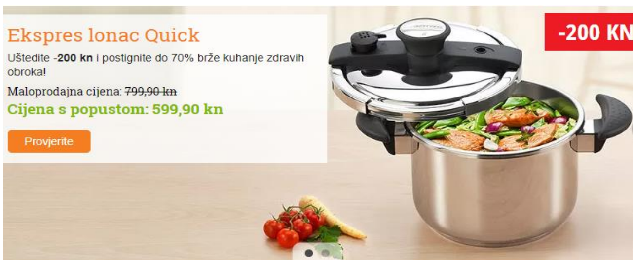
Slika 2. Ušteda za proizvod uz prvotnu umjetnu visoku cijenu

U većini gospodarski razvijenih zemalja zakonom i postojanjem i funkcioniranjem institucija je određeno ponašanje koje se odnosi na politiku cijena ipak postoje tajni dogovori konkurenata o podjeli određenog tržišta i određivanju cijena i tu se pojavljuje potencijalni etički problem. Istovremeno su neetičke, diskriminirajuće i ilegalne situacije za potrošače po pitanju cijena. Ova strategija također obuhvaća postupak gdje se prvo odredi umjetno visoka cijena, a zatim se određeni proizvod ili usluga nude uz uštedu. U bankarstvu se susrećemo s time da male štediše plaćaju veću cijenu za usluge naspram velikih klijenata koji plaćaju znatno manju. Takvim ponašanjem žele privući više velikih klijenata, a tom prilikom male štediše plaćaju troškove poslovanja.