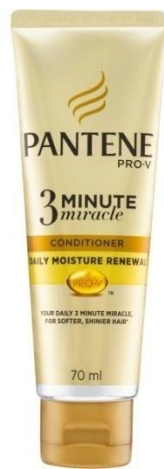
Slika 5. Zavaravajuće oglašavanje

Prema hrvatskom Zakonu o potrošačima svako oglašavanje koje dovodi u zabludu osobe kojima je upućeno i zbog kojeg će utjecati na ekonomsko ponašanje osobe naziva se zavaravajuće oglašavanje. Stvara se zabuna kod osoba kojima je upućeno te ih vrijeđa ili će povrijediti konkurente na tržištu. Mnogi oglašivači su na tankoj liniji između onog što se smatra zavaravajućim oglašavanjem, ali to zakonom nije izričito zabranjeno