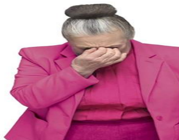
Slika 6. Komparativno oglašavanje