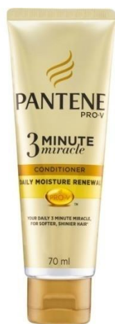
Slika 5. Zavaravajuće oglašavanje

Prema hrvatskom Zakonu o potrošačima svako oglašavanje koje dovodi u zabludu osobe kojima je upućeno i zbog kojeg će utjecati na ekonomsko ponašanje osobe naziva se zavaravajuće oglašavanje. Stvara se zabuna kod osoba kojima je upućeno te ih vrijeđa ili će povrijediti konkurente na tržištu. Mnogi oglašivači su na tankoj liniji između onog što se smatra zavaravajućim oglašavanjem, ali to zakonom nije izričito zabranjeno