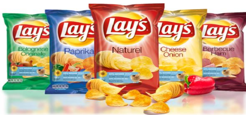
Slika 1. Pakiranje manjeg sadržaja proizvoda u veću ambalažu

Problem etike uz proizvod se najčešće javlja kada je potrošač nezadovoljni kvalitetom proizvoda. Vrlo često proizvod nije određene trajnosti i kvalitete kako proizvođač reklamira. Ukoliko se za određeni proizvod utvrdi da je takav poduzeće se obično javno ispriča te poduzima sve mjere kako bi umanjili nezadovoljstvo potrošača iako time ne mogu u potpunosti ukloniti neetično ponašanje. Nažalost poduzeća u Republici Hrvatskoj još uvijek nisu spremna se suočiti sa takvim etičkim problemom. Etički problem se može javiti vezano i za ambalažu proizvoda kada proizvođač proizvod pakira u veću ambalažu od konkurencije koja zauzima više mjesta na polici u prodavaonici čime potrošač ima dojam da se nudi veća količina proizvoda naspram konkurencije.