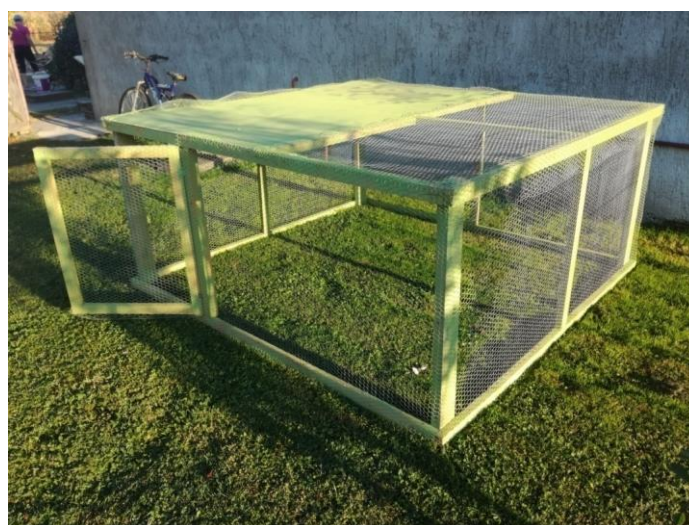
Slika 5. Privremene volijere.

Za izradu volijera u kojima će biti smještene trčke na terenu korištene su drvene letve. Dužina i širina volijere je 2x2 m, visine 80 cm. Visina volijere na 80 cm je izrađena kako ptice koje budu smještene u njima ne bi zbog mogućeg polijetanja oštetile krila te nakon puštanja u prirodu ne bi bile u mogućnosti letjeti. Drvena konstrukcija obložena je metalnom žicom sa otvorima 1x1 cm čime se sprječava ulazak predatora koji mogu naštetiti pticama ili uzrokovati njihov pomor. Na gornji dio konstrukcije postavljen je plastični krov dimenzija 2x1 m kako bi se ptice imale gdje sakriti od nepovoljnih vanjskih utjecaja (kiše, tuče ili jakog sunca). Postavljene volijere u prirodi stabilizirane su i učvršćene metalnim klinovima kako ne bi došlo do pomicanja ili ulaza predatora u iste.