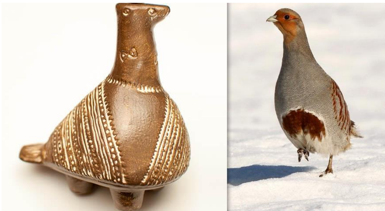
Slika 1. Vučedolska golubica i trčka skvržulja

Trčka skvržulja ( Perdix perdix L. ) u našim krajevima oduvijek je bila prepoznatljiva kao simbol u agrokulturnom eko sustavu kao jedna od vrsta koja je regulirala brojnost nametnika i štetnika na usjevima. Osim svog ekološkog značaja trčka skvržulja također ima veliki kulturni značaj, posebice na području Vukovarsko-srijemske županije. U današnje vrijeme malo ljudi zna da je vučedolska golubica zapravo poljska jarebica, odnosno trčka skvržulja. Za vrijeme eneolitika (bakrenog doba) i razvoja metalurške proizvodnje u Vučedolu za potrebe rata trčka skvržulja, odnosno poljska jarebica, bila je simbol kovača koji su u to vrijeme nažalost oboljevali od hromosti. Udisajući otrovne plinove u tvornicama simptomi hromosti manifestirali su se tako što su radnici šepali na jednu nogu. Tadašnji radnici kao svoj simbol uzeli su trčku skvržulju zbog sličnosti u tome što mužjak odvrćući predatora od svoje ženke i potomstva također „šepa“ na jednu nogu te se pretvara da je ranjen. Nakon što odvrti pozornost predatora i uspije ga odvući podalje od gnijezda mužjak se i sam daje u bijeg.