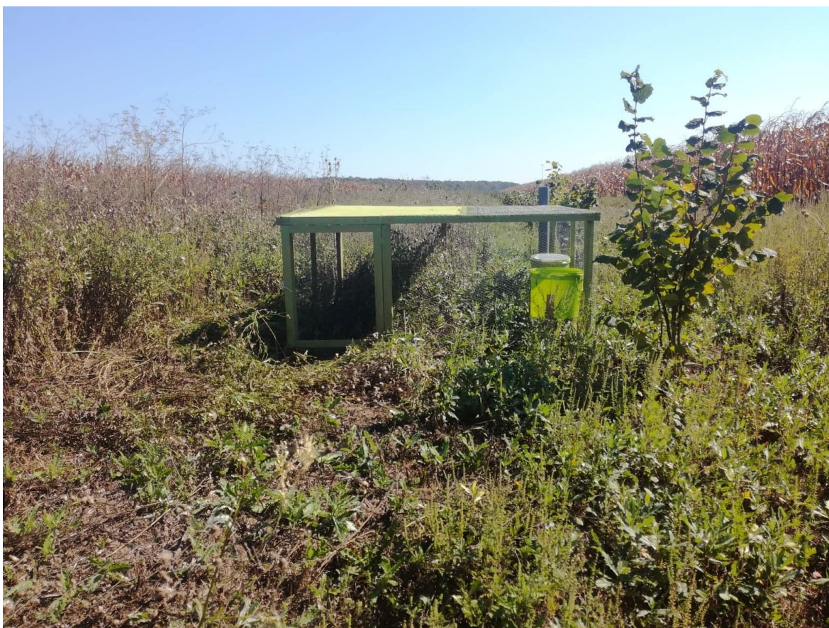
Slika 9. Volijera na prvoj lokaciji.

Prva volijera smještena je na području sela Hrastovac u zarasloj i neobrađivanoj parceli na kojoj se nalaze lješnjaci. Parcela obiluje korovnim vrstama i travama te predstavlja idealno mjesto za prebivanje trčki. Mjesto na kojemu se nalazi volijera okružena je manjim oraničnim parcelama na kojima su posijane žitarice te će stoga imati dovoljno raznolike hrane. Također, uz parcele se nalaze i kanali koji su obrasli branjevinom i živicom koji su idealan zaklon za ptice.