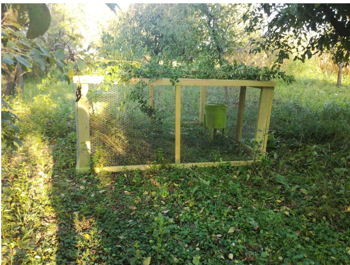
Slika 11. Volijera na trećoj lokaciji.

Smještena je na području sela Vuka u starom voćnjaku koji se nalazi uz neobrađivanu parcelu pašnjaka. Pašnjak je zarastao mnogobrojnim korovnim vrstama i livadnim biljem. Mjesto na kojemu će biti postavljena volijera nalaze se i stari čardaci koji se tijekom godine pune kukuruzom te će on biti dodatna hrana pticama koja se ne mora iznositi. Područje obiluje divljači poput fazana i zeca što ukazuje na to da postoje povoljni uvjeti za obitavanje i trčki.