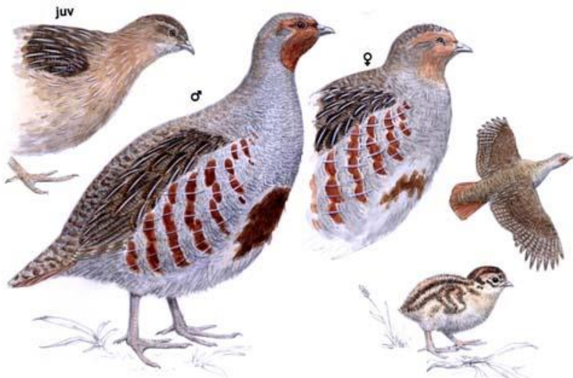
Slika 2. Izgled mužjaka, ženke i pileta trčke skvržulje.

Boja perja je zaštitna pa tako trčku i čitavo jato, kada mirno leži na goloj oranici bez vegetacije, ne možemo uopće primijetiti jer im se boja toliko prilagodila i podudara se s bojom okoline. Temeljna boja trčke skvržulje je rđasto smeđa, mjestimično sivkasta s bjelkastim uzdužnim i poprečnim šarama (Srđić, 1962.).