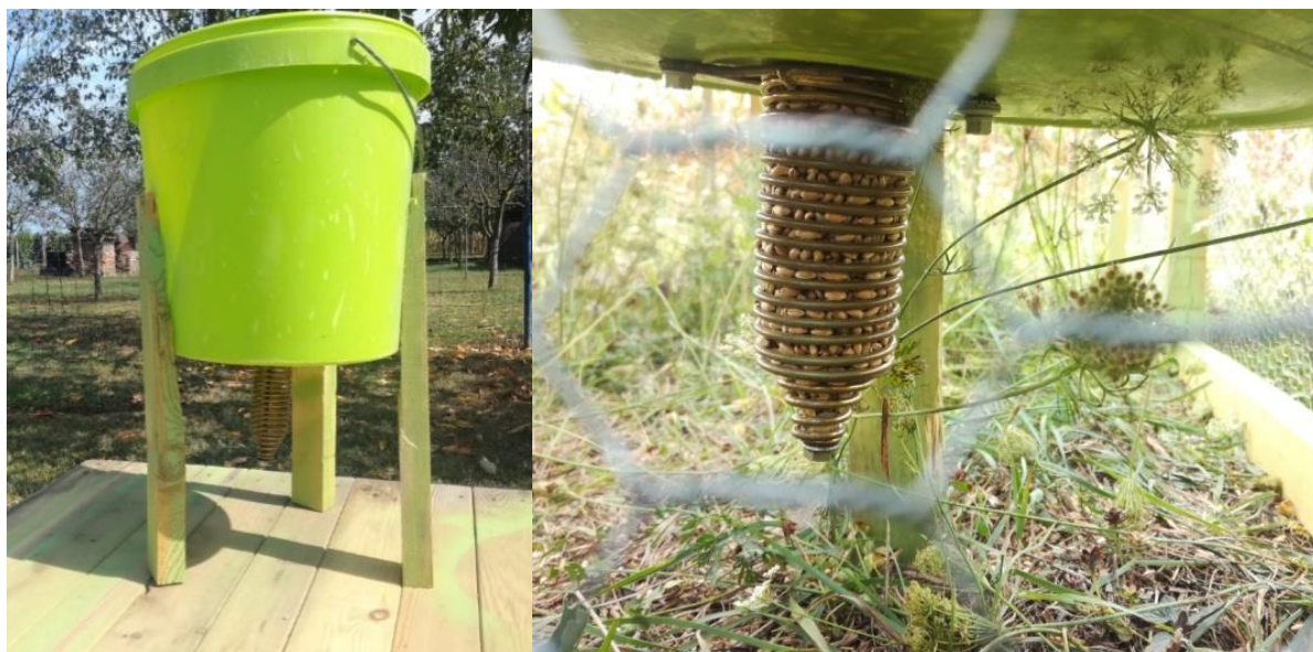
Slika 6. Hranilišta unutar volijera (autor: Juraj Pikec).

Izvan volijera postavljena su hranilišta kojima će se koristiti ptice koje će prve biti ispuštane u prirodu na privikavanje, a napravljena su od plastičnih cijevi duljine 1 m (radi veće zapremine sjemena). Postavljene su u blizini volijera u prirodi (na stupovima).