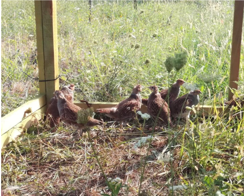
Slika12. Priprema za ispuštanje prvih parova trčki (autor: Juraj Pikec).