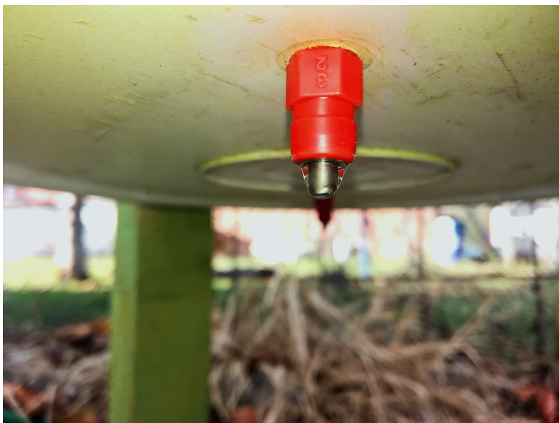
Slika 7. „Nipl“ pojilica (autor: Juraj Pikec).

Pojilice su također napravljene od plastičnih kanti sa poklopcem da ne bi došlo do zagađivanja vode, zapremine 20 l te su na njih stavljene „nipl“ pojilice (kap na kap) kako bi jedinke imale dostatne količine vode za nekoliko dana. Radi lakšeg uzimanja vode postavljene su na 20 cm od tla. Osim nipl pojilica u jednoj volijeri postavljena je kalasična pojilica koja se koristi u peradarstvu. Prvi parovi trčki koji budu ispuštani na privikavanje imaju dostatne količine vode u prirodi koju mogu koristiti te se ne moraju stavljati dodatne pojilice izvan volijera. Ispuštene jedinke će za napajanje moći koristiti rosu koja se javlja ujutro na biljkama ili vodu iz lokvi i kanala.