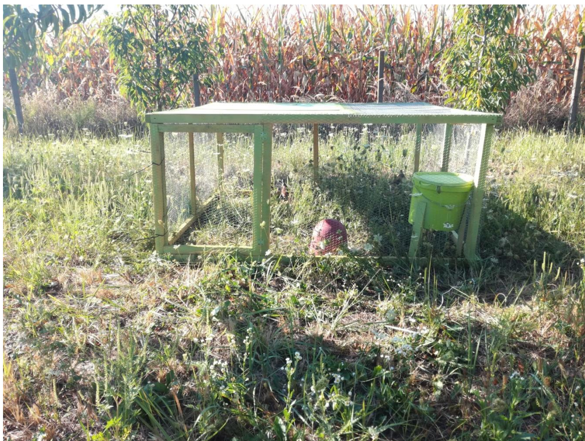
Slika 10. Volijera na drugoj lokaciji (autor: Juraj Pikec).

Za lokaciju postavljanja druge volijere izabran je privatni voćnjak smješten na području sela Hrastovac. Prednost kod postavljene volijere biti će u tome što je voćnjak ograđen metalnom žicom te će ptice na taj način biti dodatno zaštićene od predatora koji bi potencijalno mogli uznemiravati i ugrožavati život pticama. Kao i prethodna volijera i ova je okružena manjim oraničnim parcelama na kojima su zasijane žitarice te će hranidba biti olakšana.