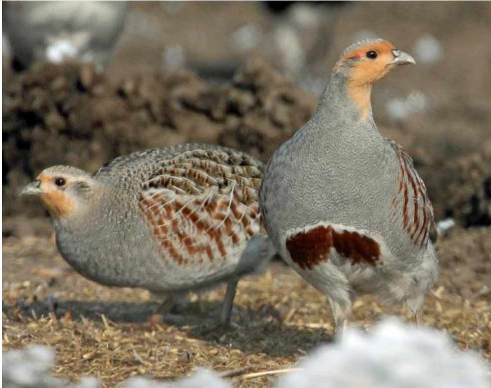
Slika 3. Ženka i mužjak trčke skvržulje.

Posebno oštre zime s dubokim i dugotrajnim snijegom u kontinentalnoj klimatskoj zoni vraćaju se periodički nakon izvjesnog niza godina, a kada nastupe mogu jako smanjiti gustoću populacije. Kada se očekuju takve zime, treba se pobrinuti i organizirati zimovališta, hvatanje i smiještaj živih poljskih jarebica u njima čime se smanjuju gubici i sprječava migracija (Srđić, 1962.).