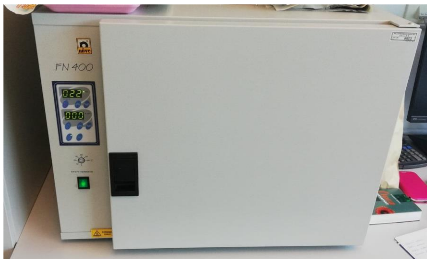
Slika 5. Uređaj za sušenje

Staklene posude volumena 720 ml ispunjene su s 300 g pšenice te je introducirano 200 odraslih jedinki obaju spolova različite starosti (slika 7.). Staklene posude prekrivene su perforiranim poklopcima, kako bi bilo moguće disanje. Nakon kopulacije u trajanju od 7 dana, roditelji su uklonjeni iz uzgojne podloge, a nakon 63 dana pojavljuju se prve odrasle jedinke F1 generacije, koji su se koristili u istraživanju.