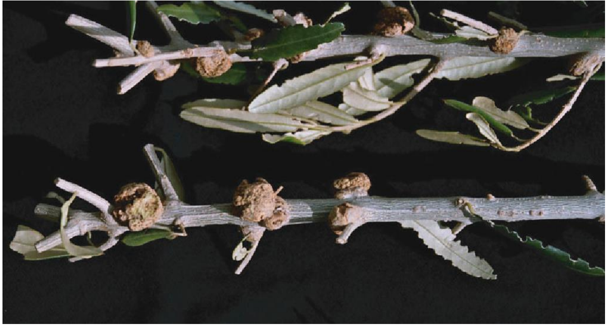
Slika 6. Bakterijski rak masline