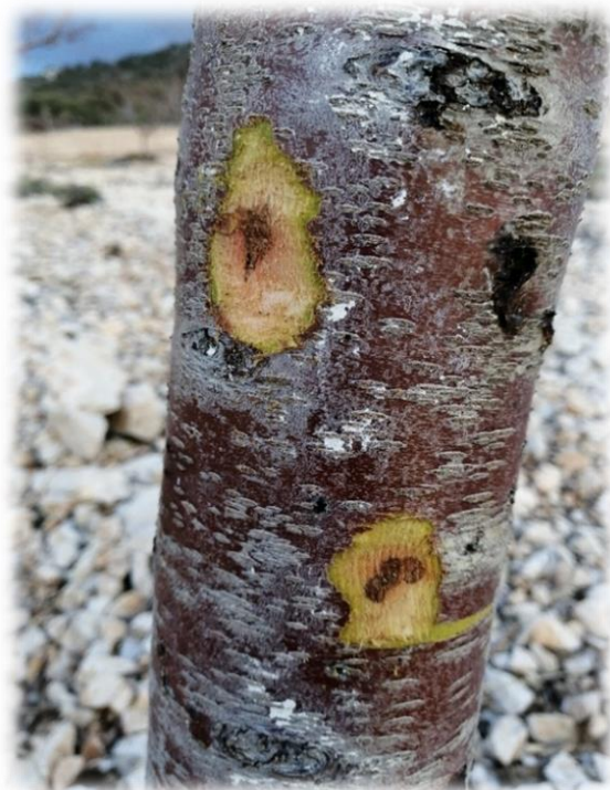
Slika 3. Štete na deblu