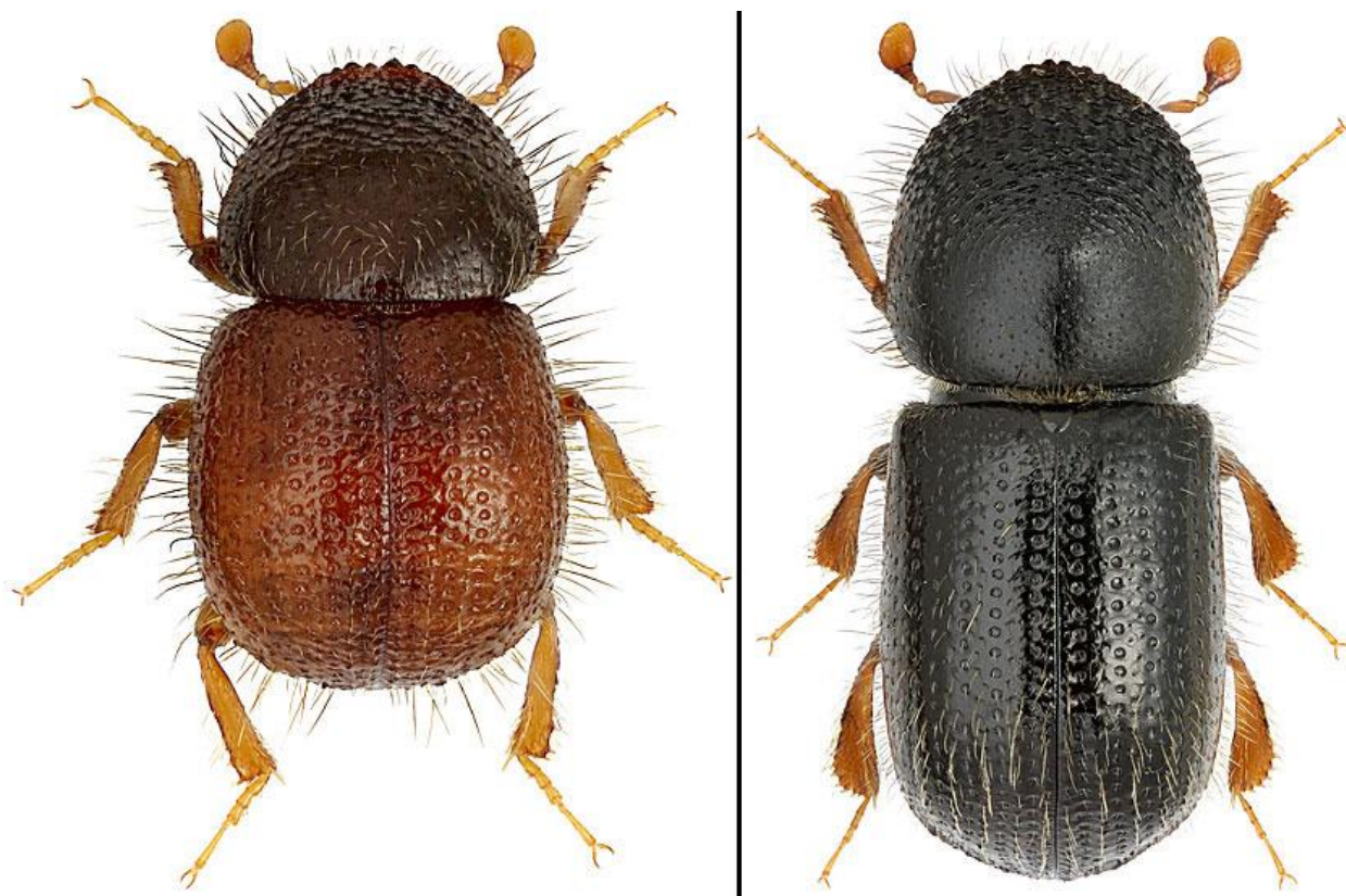
Slika 5. Odrasle jedinke voćnog sipca ( Xyloborus dispar ), lijevo - mužjak, desno – ženka

Prvi detaljan opis larve i jaja voćnog sipca predstavio je Lekander (1968.), a nakon njega i Kalina (1970.). Jaja su ovalna, bijele boje s izraženim sjajem, dimenzija 0.8 – 0.9 mm x 0.4 mm. Kod odraslih jedinki postoji vidljiva morfološka razlika među spolovima. Mužjaci su znatno manji od ženki, obično 1.8 -2.4 mm dužine, tijelo im je konveksno (trup relativno malen, a zadak kratak). Ženke su veće, 3.2 – 3.7 mm dužine, tijelo im je izduženije od mužjaka i cilindričnog oblika (Kalina, 1970.). Tijelo im je tamnosmeđe do crne boje, noge i antene su svijetlo smeđe. Thorax i elytra (pokrilce) su prekriveni rijetkom prevlakom dlačica (Kalina, 1970.).