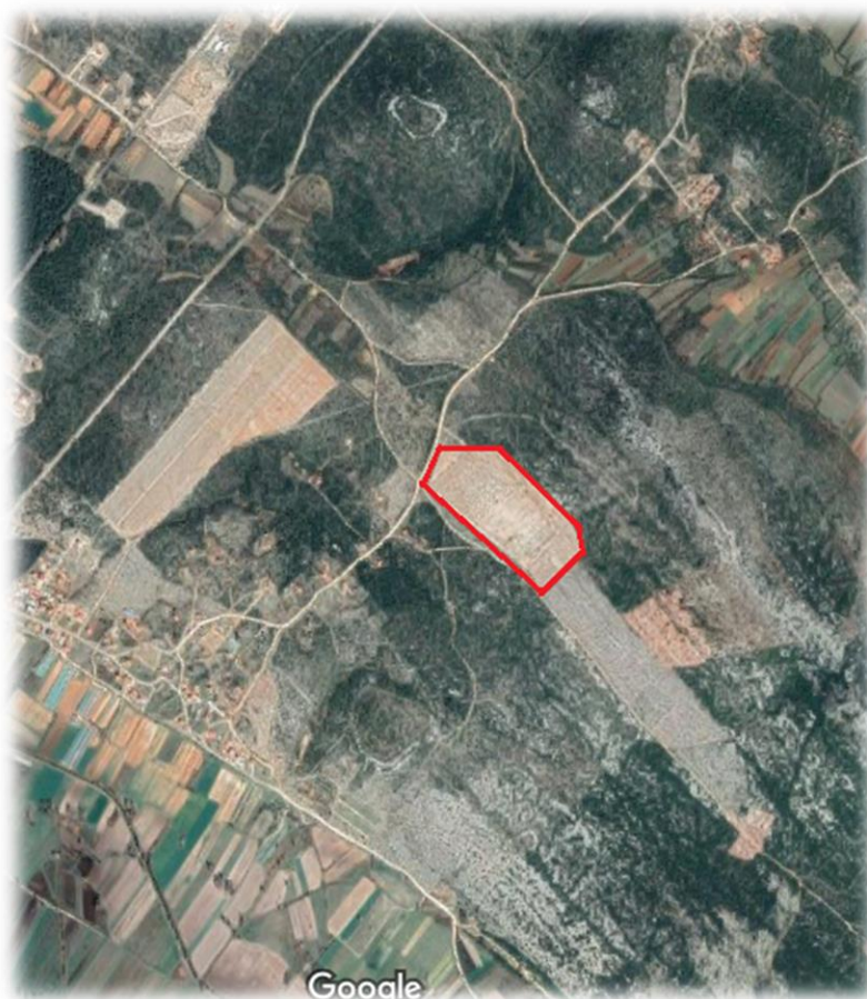
Slika 7. Lokacija nasada na području općine Polača

Istraživanje je provedeno tijekom 2019. godine u nasadu badema Poljoprivredne zadruge „Vrisak“ (49°59'29 N, 15°30'36 E) na području općine Polača , središnjem dijelu Ravnih kotara. Nasad je nalazi na nadmorskoj visini od 200 m s nagibom od cca. 5% i južnom ekspozicijom. Na površini od 2 ha prisutno je 800 stabala badema starosti 10 godina, posađenih u sklopu 6 m x 6 m. U nasadu je prisutno 30.000 sadnica smilja kao podkultura bademu. U godini istraživanja obavljeno je zimsko prskanje crvenim uljem (koncentracije 3%), prihrana je obavljena organskih stajskim gnojivom Stallatico Pelletato (1000 kg/ha). Vodeća sorta je Ferragnese (50%), zatim Tuono (30%) i Texas (20%).