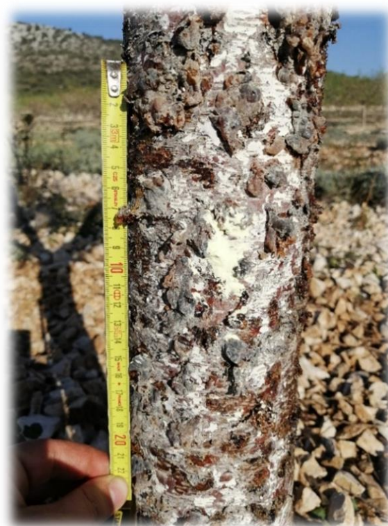
Slika 2. Štete na deblu