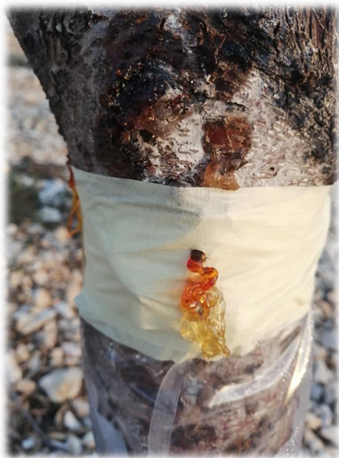
Slika 11. Obrambena reakcija badema na bušenje

Na deblo je pričvršćena prozirna plastična folija za praćenje eventualnog izlaska štetnika. Prvo injektiranje je obavljeno 15. veljače, zatim je ponovljeno istom koncentracijom nakon 7 te nakon 14 dana. Prosječno je bilo potrebno 24 do 48 sati da biljka usvoji sredstvo. Nakon svakog injektiranja plastične folije su skinute te pregledavane. Također je praćena pojava novih rupa djelovanjem voćnog sipca.