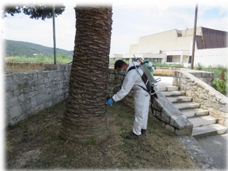
Slika 9. Injektiranje na palmama

Metoda injektiranja se sve više koristi u Hrvatskoj , uglavnom za suzbijanje štetnika na ukrasnom bilju. Dokazana je učinkovitost formulacije emamektin benzoata u suzbijanju crvene palmine pipe ( Rfynchphorus ferrugineus ) na palmama, kestenovog moljca minera ( Cameraria ohridella ) na divljem kestenu te borovog četnjaka ( Taumatopoea pityocampa ). Razvoj metode injektiranja kontinuirano napreduje, istraživaju se nove formulacije i sredstva posebno za takvu primjenu te se može očekivati povećanje primjene na ostalo kulturno bilje (Jelovčan i Ivačić, 2008.).