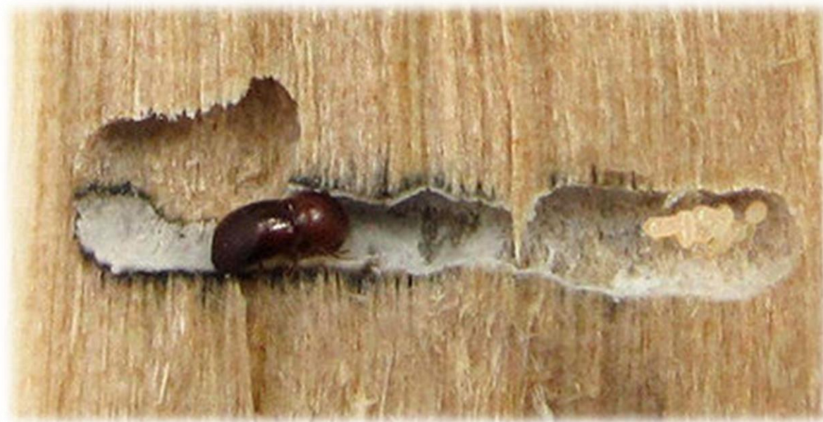
Slika 6. Ubušavanje tunela i razvijanje gljive Ambrosiella hartigii

mužjaci nemaju sposobnost letenja, ostaju u galeriji i ugibaju. Omjer mužjaka i ženki često varira, Egger (1973.) je u svojim istraživanjima zaključio da je brojnost ženki veća, u omjeru od 1:5 do 1:15. Proječno je 25 jedinki po galeriji, maksimum je do 40 (Egger, 1973.).