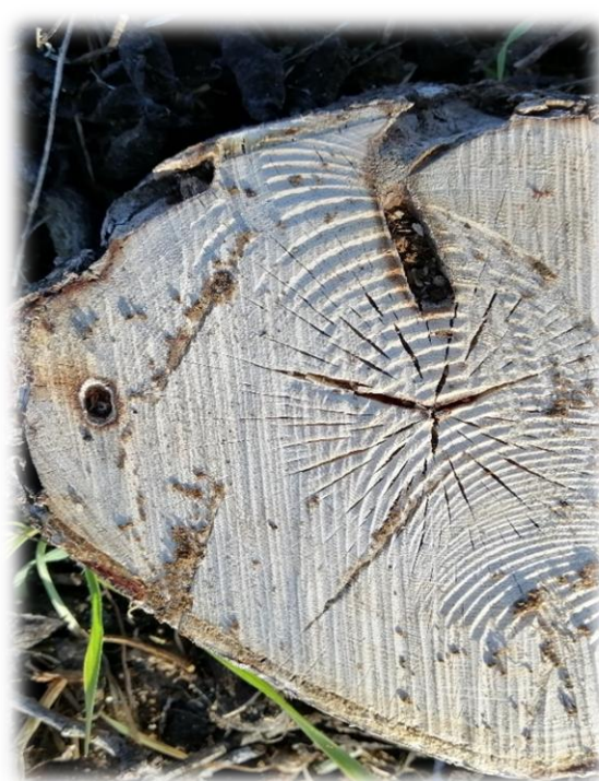
Slika 4. Štete na deblu