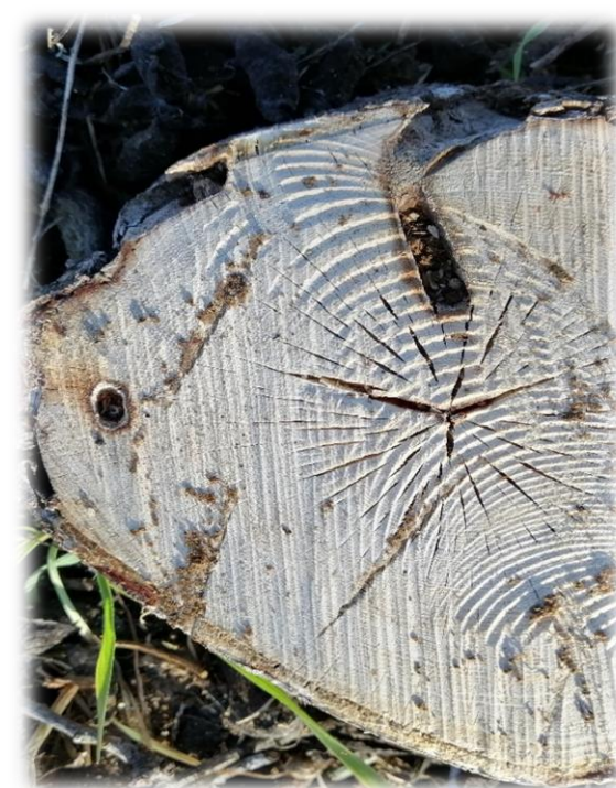
Slika 4. Štete na deblu