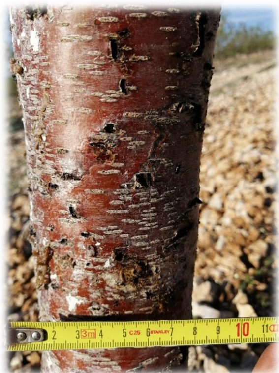
Slika 1. Štete na deblu