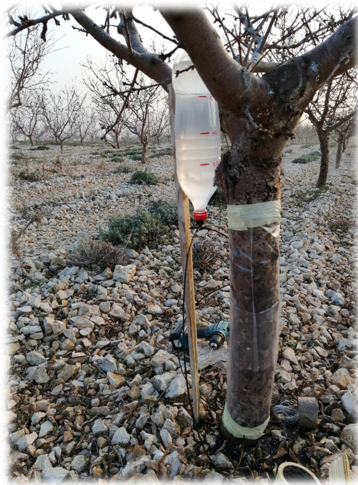
Slika 10. Injektiranje na stablu badema

0,1 % (2 g /2 l vode). Karate Zeon spada u skupinu piretroida, djelatna tvar je Lambda cihalotrin u koncentraciji 50 g/kg. Switch je kombinirani sistemski fungicid s djelatnim tvarima fludioksonil (25 %) i ciprodinil (37,5 %). Kombinacija insekticida i fungicida je nužna zbog kombiniranog djelovanja na larvu i odrasle jedinke voćnog sipca kao i djelovanje na simbiotsku gljivu Ambrosiella hartigii kojom se hrani larva.