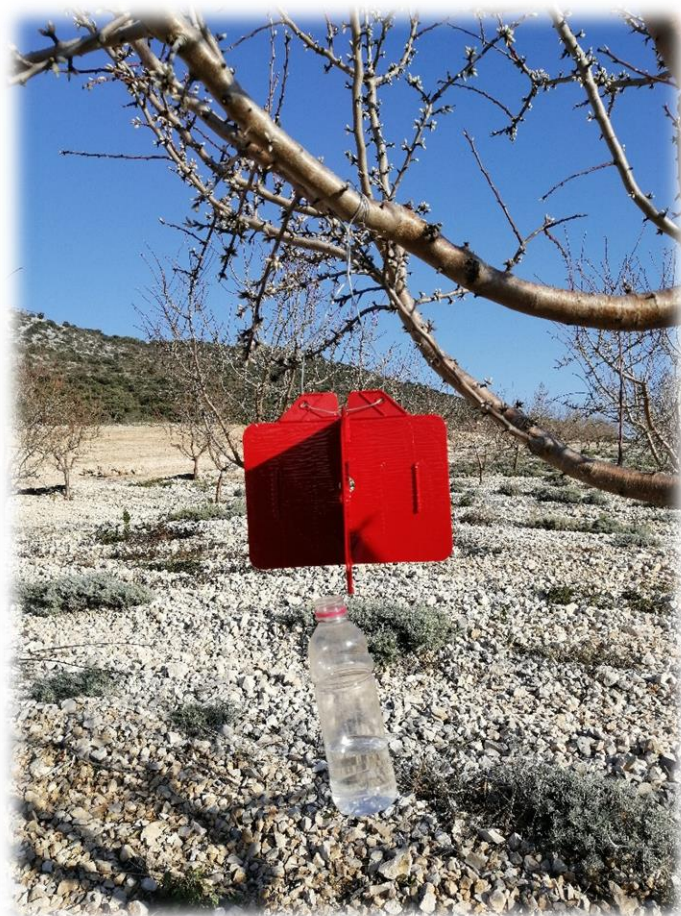
Slika 8. Postavljanje lovnih ploča u nasadu