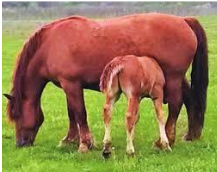
Slika 4. Hrvatski hladnokrvnjak

Na području Hrvatske uzgajaju se tri autohtone hladnokrvne pasmine konja (hrvatski hladnokrvnjak, hrvatski posavac i međimurski konj). Hladnokrvne kobile pogodne su za proizvodnju mlijeka zbog svoje veličine i mirnog temperamenta, pogodnosti za poluintenzivne i ekstenzivne sustave držanja i redovite reprodukcije. Posavske kobile dobro podnose ekstenzivni sustav držanja na pašnjacima u području rijeke Save. Hladnokrvne kobile dnevno proizvode prosječno oko 17 kg mlijeka (od 12,4 do 27,4 kg), što je više u odnosu na toplokrvne kobile. Toplokrvne pasmine konja također su pogodne za proizvodnju kobiljeg mlijeka. Dnevno prosječno proizvedu oko 14,3 kg mlijeka (od 8,0 do 21,5 kg) (Ivanković i sur., 2014.).