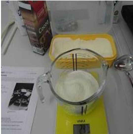
Slika 17. Mlijeko u prahu (Janković, 2019.)