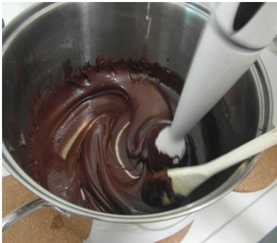
Slika 23. Miješanje smjese (Janković, 2019.)