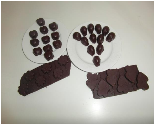
Slika 25. Čokolada od kobiljeg mlijeka (Janković, 2019.)