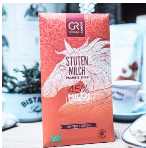
Slika 12. GR čokolada od kobiljeg mlijeka