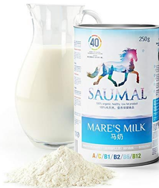
Slika 7. Mlijeko kopitara u prahu

Mlijeko u prahu može biti sirovina za preradu ili se koristi za konzumaciju, jer mu se na taj način produžuje rok upotrebljivosti, jednostavniji je transport te manji troškovi skladištenja. Za proizvodnju praha iz mlijeka kopitara koristi se nekoliko metoda. Najpoznatija metoda je „spray drying“. Ovom metodom se dobije prah, koji se teže topi u vodi. Temperatura mlijeka diže se na preko 80°C, dolazi do koagulacije bjelancevina i degeneracije masnih kiselina te umanjene funkcije svih sastojaka mlijeka. Bolja metoda je vakumsko sušenje, koje manje zagrije mlijeko u tijeku postupka sušenja, ali isto dolazi do smanjenja biološke vrijednosti u odnosu na sirovo mlijeko kopitara. Najbolja i najskuplja metoda sušena je „freeze drying“ metoda u kojoj se dobije prah niske specifične mase, bijele boje i sa svojstvima koje se ne razlikuju od svježeg sirovog mlijeka kopitara. Mlijeko kopitara u prahu se pakira u vrećice od 200 do 250 g ili u kapsule (Alatrović i sur., 2017.).