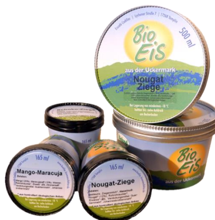
Slika 10. Pakiranje sladoleda

Proizvodnja kobiljeg mlijeka počela se razvijati u drugoj polovici prošlog stoljeća. U Njemačkoj je registrirano oko 40 gospodarstava koji se bave proizvodnjom kobiljeg mlijeka (Gregić i sur., 2018.a). Njemački slastičar Koller u svoje proizvode dodaje kobilje mlijeko. Proizvodi sladoled i distribuira ga na tržište po cijeloj Njemačkoj. Njegov asortiman sadrži više od 60 različitih vrsta sladoleda koji se proizvodi ručno prema staroj tradiciji. Koller koristi prirodne sirovine od ekoloških uzgoja kao što su voće i povrće za veganske sladolede. Proizvodi sladoled od ovčjeg, kozjeg i kobiljeg mlijeka. Mlijeko za pripremu sladoleda nabavlja izravno s poljoprivrednih gospodarstava, koja su specijalizirana za proizvodnju organskog mlijeka. Koller proizvodi razne kreacije sladoleda kao što su maline s fermentiranim kobiljem mlijekom ili sladoled od ovčjeg mlijeka s ružičastim paprom. Sladoled se pakira u šalice kapaciteta 500 i 165 ml ( https://koeller-organic-manufactory.de/koeller.icecream.html ).