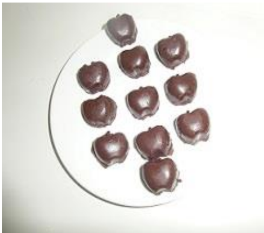
Slika 27. Čokolada kalup jabuke (Janković, 2019.)