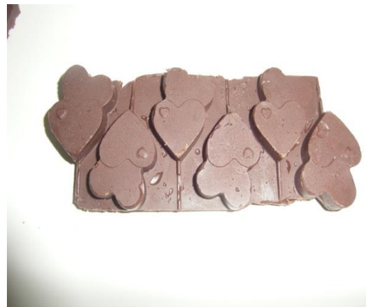
Slika 28. Čokolada u velikom kalupu (Janković, 2019.)

Čokolada sadrži veliki udio suhe tvari kakovih dijelova. Polifenoli u kakaovom zrnu imaju pozitivne učinke na zdravlje ljudi, zbog čega se kakao ubraja u glavnu namirnicu svake čokolade. Na tržištu se sve više pojavljuju čokolade s manjim udjelom šećera, te bogatim funkcionalnim sadržajem. U proizvodima čokolade koriste se termolabilne sirovine, različitih aroma i tekstura, te je za izradu kvalitetnog proizvoda bitan svaki detalj.