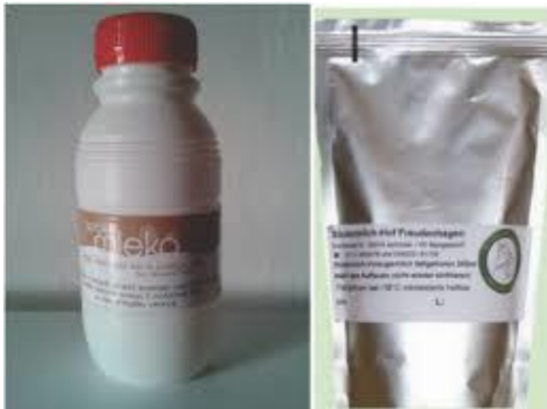
Slika 3. Pakiranje kobiljeg mlijeka

Nakon završetka mužnje pristupa se zbrinjavanju mlijeka. Zbrinjavanje mlijeka uključuje iznošenje posude s mlijekom iz izmuzišta, dopremanje mlijeka u prostoriju za obradu i pakiranje, procjeđivanje i hlađenje mlijeka, te njegovo pakiranje u odgovarajuću ambalažu. Prvi korak u zbrinjavanju mlijeka je njegovo iznošenje iz prostorije gdje se odvijala mužnja radi prevencije kontaminacije mlijeka bakterijama, stranim mirisima ili drugim onečišćivačima. Poznato je da mlijeko kobilica sadrži određene inhibitorne tvari (lizozimi, laktoferini) koje omogućavaju inicijalno brzo umnažanje mikroorganizama. Zatim slijedi faza procjeđivanja mlijeka. Mlijeko se procjeđuje dok je još toplo iz posude u koju je mlijeko sabirano tijekom mužnje u drugu čistu posudu. Procjeđivanje se vrši kroz više čistih preklopljenih mljekarskih gaza na kojima se zadržavaju nečistoće. Nakon faze procjeđivanja slijedi faza hlađenja mlijeka. Mlijeko je potrebno ohladiti na temperaturi od + 4 °C, kako bi se usporilo razmnožavanje mikroorganizama. Hlađenje se može vršiti u laktofrizu. Nakon hlađenja mlijeko se treba pakirati za plasman ili preradu. Mlijeko se pakira u plastične ili staklene posude ili se prodaje kao konzumno svježe mlijeko. Tijekom sezone, dio mlijeka koji se ne može plasirati za potrošnju u svježem obliku zamrzava se na -20 °C i tako čuva do 6 mjeseci. Znatno bolje je šok zamrzavanje u ambalaži na – 40 °C (Ivanković i sur., 2014.).