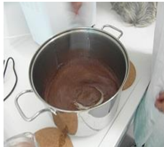
Slika 20. Smjesa nakon dodanog mlijeka u prahu i kakaa (Janković, 2019.)