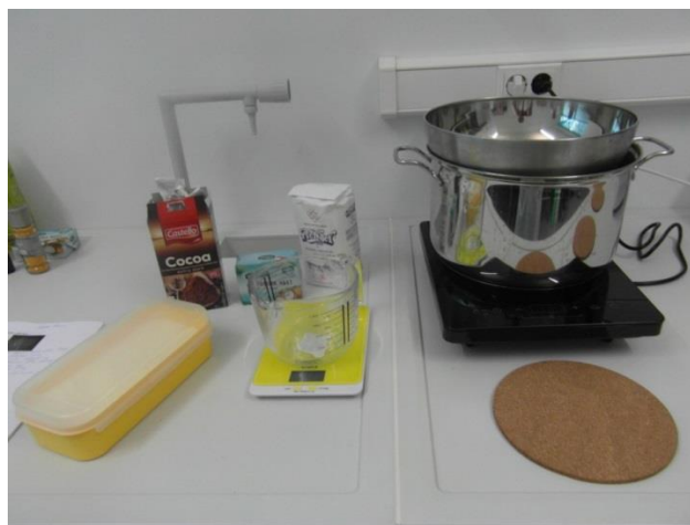
Slika 13. Sastojci za pripremu čokolade od kobiljeg mlijeka (Janković, 2019.)