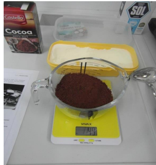
Slika 18. Vaganje kakaa (Janković, 2019.)