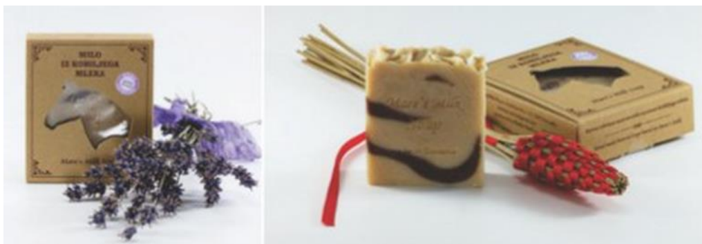
Slika 9. Sapun od kobiljeg mlijeka napravljen hladnim postupkom

Proizvodnja sapuna se izrađuje putem dva postupka: saponifikacija masti i ulja i karbonatna saponifikacija slobodnih masnih kiselina. Za izradu sapuna se koristi kaustična soda, nagrizajuće i otrovno sredstvo. Osnovu sapuna čine ulja: kokosovo, palmino, kikirikijevo, sojino, maslinovo, ricinusovo, avokado i bademovo ulje. Koriste se za sapune jer imaju veliki udio vitamina E, A i B kompleksa. Djeluju na kožu umirujuće, te ju čiste i hidratiziraju (Sekulić, 2018.).