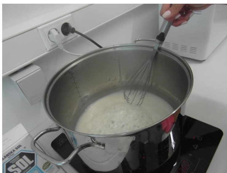
Slika 16. Kuhanje šećera i mlijeka (Janković, 2019.)

Prvi korak u izradi čokolade od kobiljeg mlijeka je nauljiti i zagrijati posudu. Zatim se odvažuje 1 del mlijeka i \frac{1}{2} kg šećera. Šećer i mlijeko treba kuhati dok se šećer ne otopi i smjesa ne bude vrela (Slika 16.). Smjesu treba maknuti s vatre i dodati 250 g kobiljeg mlijeka u prahu (Slika 17.) i 50 g kakaa (Slika 18.) koje smo prethodno pomiješali (Slika 19.). Potrebno je brzo miješati jer se smjesa brzo stegne. Nakon miješanja potrebno je dodati 250 g kokosove masti (Slika 22.), te dodatno miješati dok se kokosova mast ne otopi (Slika 23.). Gotovu smjesu treba uliti u kalupe i ostaviti da se stegne (Slika 24.).