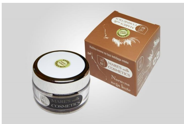
Slika 8. Krema od kobiljeg mlijeka

Kobilje mlijeko u kremama smanjuju bore, povećava elastičnost i hidrataciju kože, te smanjuje pigmentiranost pojedinih dijelova kože. Kreme od kobiljeg mlijeka upotrebljavaju za smanjenje crvenila kože i manje upale. Dobre su za kožu lica jer hidratiziraju suhu i ispucanu kožu, te joj vraćaju elastičnost (Brezovečki i sur., 2014.). Kreme se izrađuju spajanjem masne i vodene faze. Na tržištu postoje mnoge kreme. Deklariraju se kao kreme za lice ili tijelo. Izrađuju se zagrijavanje masne faze (ulje, maslac, vosak) s dodatkom emulgatora na temperaturi oko 50°C, te se na istoj temperaturi zagrijava i vodena faza. Masnoj fazi se dodaje vodena faza, te se miješanjem smjesa homogenizira. Zatim se dodaju konzervansi, vitamini, esencijalna ulja. Na kraju postupka, topla homogenizirana smjesa ulijeva se u posudice za kreme (Ivanković i sur., 2014.).