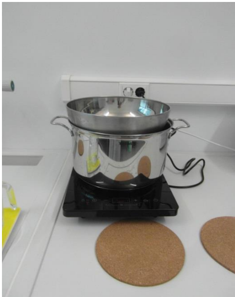
Slika 14. Pribor (Janković, 2019.)