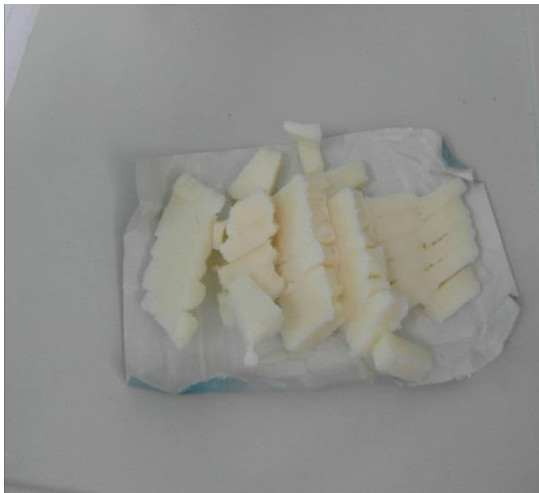
Slika 21. 250 g kokosove masti (Janković, 2019.)