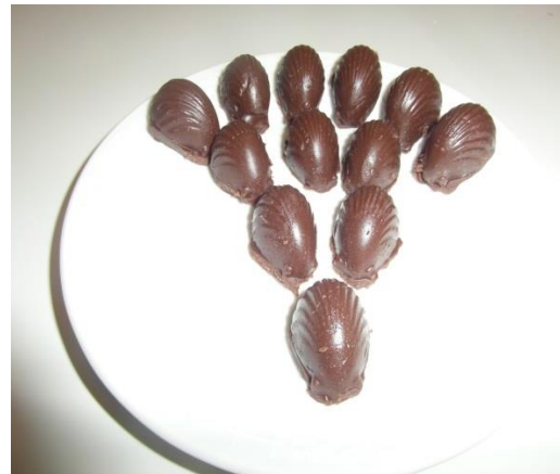
Slika 26. Čokolada kalup praline (Janković, 2019.)