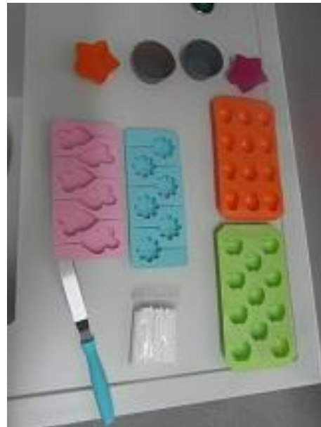
Slika 15. Kalupi (Janković, 2019.)

Prvi korak u izradi čokolade od kobiljeg mlijeka je nauljiti i zagrijati posudu. Zatim se odvažuje 1 del mlijeka i \frac{1}{2} kg šećera. Šećer i mlijeko treba kuhati dok se šećer ne otopi i smjesa ne bude vrela (Slika 16.). Smjesu treba maknuti s vatre i dodati 250 g kobiljeg mlijeka u prahu (Slika 17.) i 50 g kakaa (Slika 18.) koje smo prethodno pomiješali (Slika 19.). Potrebno je brzo miješati jer se smjesa brzo stegne. Nakon miješanja potrebno je dodati 250 g kokosove masti (Slika 22.), te dodatno miješati dok se kokosova mast ne otopi (Slika 23.). Gotovu smjesu treba uliti u kalupe i ostaviti da se stegne (Slika 24.).