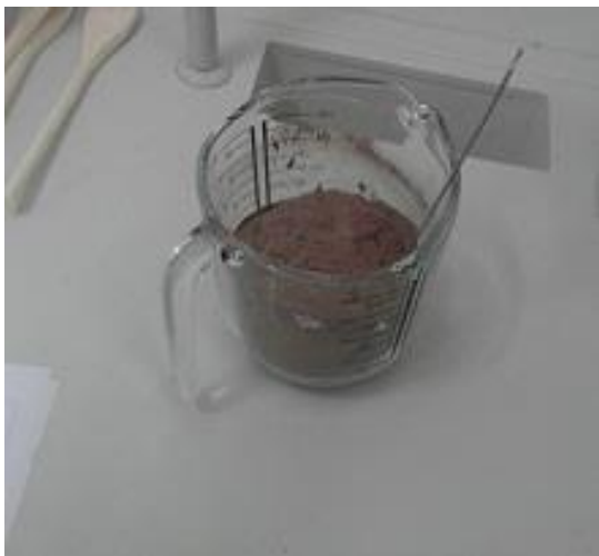
Slika 19. Pomiješano kobilje mlijeko u prahu i kakao (Janković, 2019.)