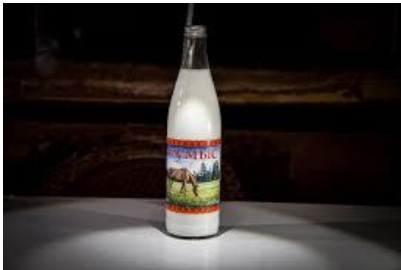
Slika 6. Fermentirano kobilje mlijeko - Kumis

Kobilje mlijeko je zdrava namirnica koja može ublažiti ili potpuno spriječiti simptome mnogih bolesti. Ima važna hranidbena i terapijska svojstva, koja vrlo povoljno djeluju na zdravlje ljudi. Osim u prehrambenoj, ima važnu ulogu u kozmetičkoj i farmaceutskoj industriji. Kobilje mlijeko oduvijek je bilo cijenjeno zbog svojih ljekovitih svojstava. U farmaceutskoj industriji koristi se kao preventivna terapija koja se dobiva regeneriranjem kobiljeg mlijeka u prahu. Kobilje mlijeko se može na različite načine dehidrirati, te se dobiju proizvodi različite kvalitete. Najbolji način je sušenje zamrzavanjem (Brezovečki i sur., 2014.). Svježe ili zamrznuto mlijeko je najjednostavniji način plasmana na tržište. Prerađeno mlijeko za kozmetičke ili druge svrhe iziskuje veliko iskustvo i znanje, opremu za preradu, sustav kontrole kvalitete svih sastavnica gotovog proizvoda te deklariranje proizvoda. Od prerađevina kobiljeg mlijeka najpoznatiji je kumis, koji je već tisućljećima poznat u prehrani. Zadnjih desetljeća proizvode se različiti proizvodi u kojima je kobilje mlijeko glavni sastojak ili samo sekundarni dodatak, upravo radi poboljšavanja svojstava finalnog proizvoda po pitanju funkcionalnog djelovanja na organizam potrošača (Ivanković i sur., 2014.).