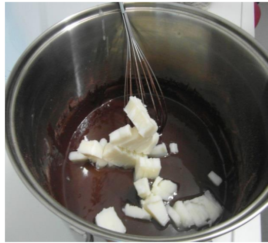
Slika 22. Dodavanje kokosove masti (Janković, 2019.)