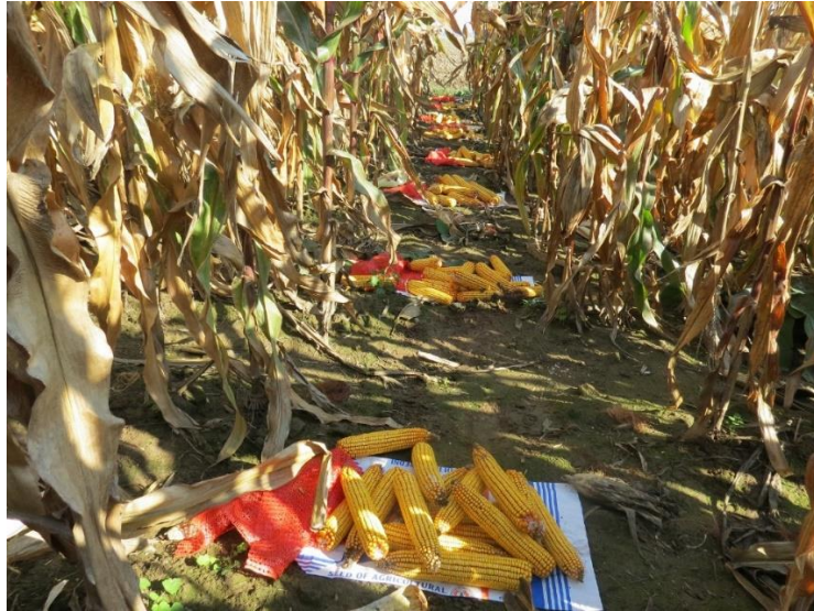
Slika 6. Ručna berba pokusa