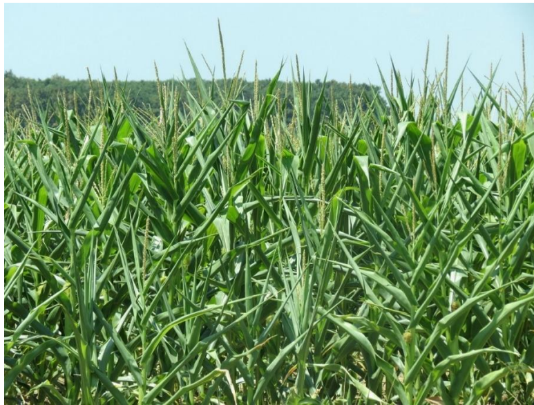
Slika 5. Uvijanje listova kukuruza

Tijekom vegetacije kukuruza provođena su različita fenološka i morfološka zapažanja. Bilježili su se podaci o vremenu cvatnje metlice i klipa i zriobe prema standardnim protokolima, a izražavani su u broju dana od sjetve do nastupa pojedine faze. Mjerena je visina biljaka po ulasku u zriobu kao pokazatelj bujnosti ili zaostajanja u razvoju uslijed suše. Također, utvrđivali su se specifični simptomi suše ocjenom stupnja uvijanja, sušenja i odbacivanja lišća prema standardnim skalama kao i postotak polijeganja i loma stabljike.