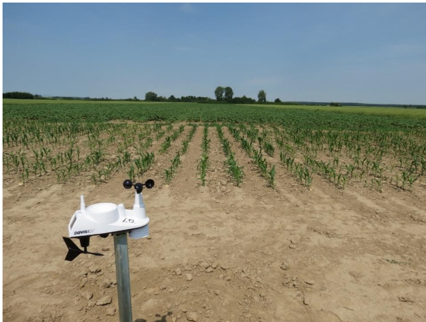
Slika 3. Meteo-stanica na pokusu u Gorjanima

Vremenske prilike u 2017. godini analizirane su na temelju srednjih dekadnih i mjesečnih temperatura zraka, te na dekadnim i ukupnim mjesečnim količinama oborina za vegetacijsko razdoblje kukuruza. Podaci su uspoređivani s referentnim višegodišnjim prosječnim vrijednostima za razdoblje 1961. - 1990. godine.