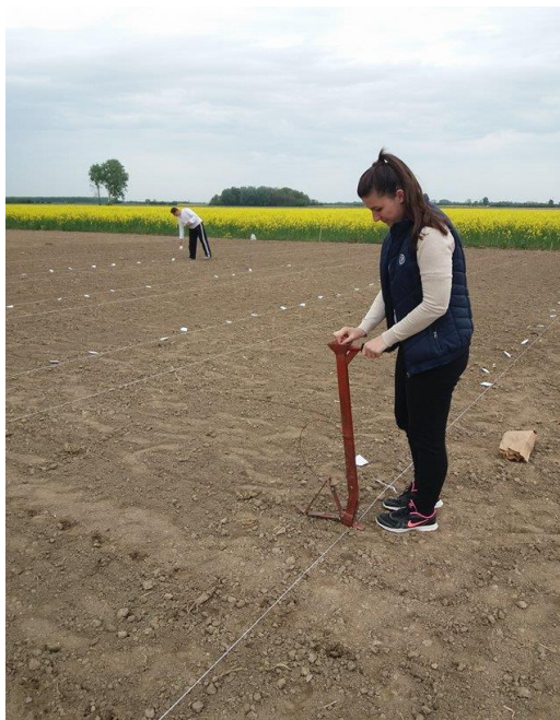
Slika 4. Sjetva planterima (D. Ilkić)

Na lokaciji pokusa je provedena standardna (optimalna) agrotehnika za kukuruz. U jesen je obavljena osnovna obrada tla na 25-30 cm dubine te je izvršena gnojidba ureom 122 kg/ha. U proljeće je zatvorena zimska brada te se obavila pravilna priprema tla za sjetvu. Ručna sjetva planterima obavljena je u proljeće 27. 4. 2017. godine (Slika 4.). Sijana su po dva zrna kako bi se osigurao željeni sklop te je u fazi ranog porasta obavljeno prorjeđivanje usjeva. Nakon sjetve obavljena je standardna zaštita od korova.