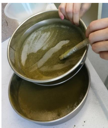
Slika 14. Prašivo carske paulovnije

Razlog navedenih omjera kod alkoholnog i vodenog ekstrakta je dobivanje tzv. mekane paste (slika 15.) koja se prosijavala kroz mlinsko platno. Gotovi ekstrakti su aplicirani pri dozi od 200 \mu\text{l} na 100 g pšenice. Uzeto je po 100 g sterilne pšenice u svaku staklenu posudu s 3 % loma pšenice. Za primjenu ekstrakata korištena je Kartell mikropipeta. Nakon postavljanja pokusa posude su stavljene u kontrolirane uvjete ( 29\pm 1 °C, rvz 70-80 %). Očitanje mortaliteta vršilo se nakon 7. i 14. dana ekspozicije.