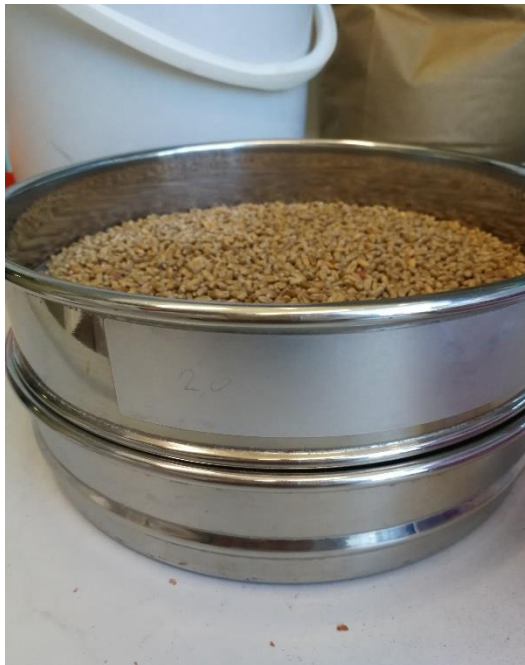
Slika 10. Prosijavanje pšenice

Uzgoj testnih kukaca F1 generacije (slika 9.) obavljen je u kontroliranim uvjetima pri temperaturi od 29\pm 1 °C, pri relativnoj vlazi zraka 70-80 % u klima komori. Korištene su odrasle jedinke starosti 7-21 dan. Kao uzgojni medij korištena je pšenica s 14 % vlage. Pšenica je prosijana kroz sito promjera 2,0 mm (slika 10.) te sterilizirana u sušioniku na 60 °C (slika 8.) u vremenskom periodu od jednog sata. Sterilizacija je postupak kojim se potpuno odstranjuju svi mikroorganizmi i njihove spore s predmeta, instrumenta ili materijala. Sadržaj vlage pšenice izmjereno je uređajem Dickey-John® GAC 2100. U staklene posude volumena 750 ml stavljano je 300 g pšenice te je introducirano 200 odraslih jedinki kestenjastog brašnara oba spola različite starosti. Posude su zatvarane perforiranim poklopcima. Nakon kopulacije od 7 dana, roditelji su uklonjeni (slika 11.) iz uzgojne podloge, a nakon 63. dana se pojavljuju prve odrasle jedinke F1 generacije, koje su se koristile u istraživanju.