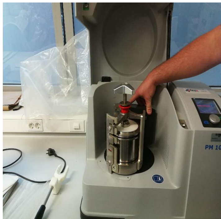
Slika 6. Cilindrični mlin Retsch PM 100 ®

Biljni materijal sakupljen je na području Osječko-baranjske županije, a osušen je pri laboratorijskim uvjetima.