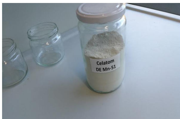
Slika 3. Dijatomejska zemlja Celatom Mn-51®

ličinki i odraslih oblika kestenjastog brašnara. Tri dijatomejske zemlje od kojih je jedna poboljšana s abamektinom, a ostale su SilicoSec® i Protect-It® primjenjene kao same ili u raznim kombinacijama, pri temperaturi od 28-32 °C i vlazi zraka od 60-65 %. Mortalitet se bilježio nakon 7 i 14 dana ekspozicije, a zabilježena je i pojava potomstva. Na mortalitet ličinki i odraslih je značajno utjecala vrsta dijatomejske zemlje i koncentracija. Dijatomejska zemlja s abamektinom je znatno jače djelovala od komercijalnih formulacija SilicoSec® (slika 4.) i Protect-It®. Čak je i potisnula stvaranje novog potomstva za razliku od ove dvije komercijalne dijatomejske zemlje.