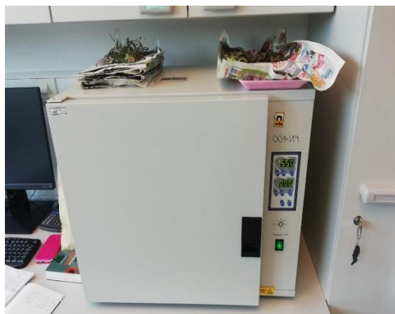
Slika 8. Sterilizator PN 400