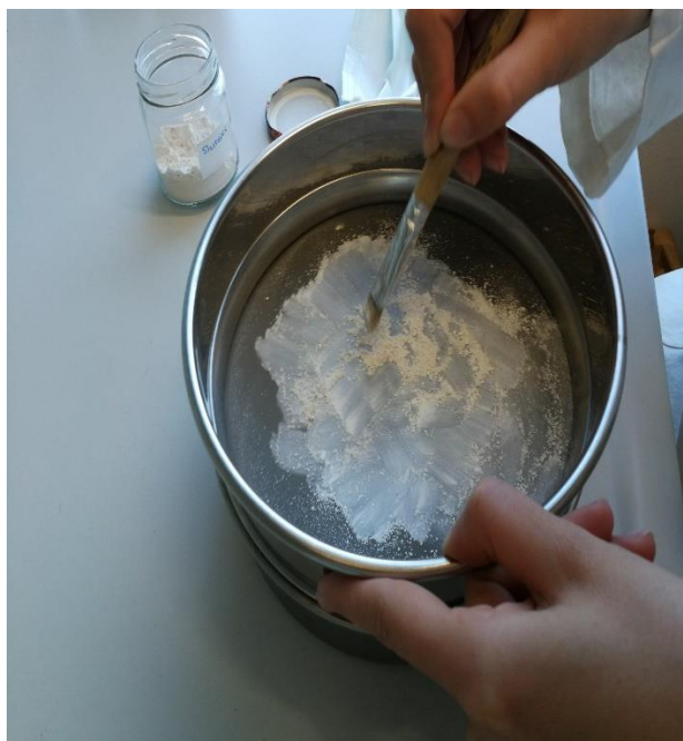
Slika 12. Priprema inertnih prašiva