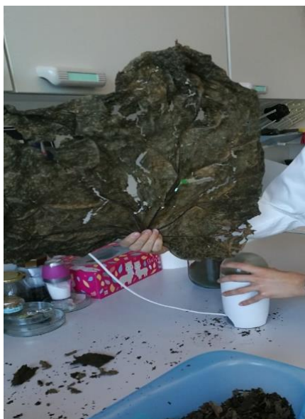
Slika 5. Osušeni list carske paulovnije

Istraživanja koja je proveo Lucić (2018.) pokazuju da je slaba učinkovitost carske paulovnije kao prašiva u suzbijanju skladišnih štetnika na pšenici. Kod žitnog kukuljičara prašivo carske paulovnije u najvećim dozama i pri najduljim ekspozicijama pokazuje mortalitet od tek 1 %, zatim kod rižinog žiška tek pri najduljoj ekspoziciji i najvećoj dozi od 8000 mg kg -1 pokazuje mortalitet od 5 % što je i dalje premalo za uspješno suzbijanje rižinog žiška. Kod kestenjastog brašnara zabilježen je mortalitet tek od 0,5 % nakon 4 dana ekspozicije pri najmanjoj dozi od 2000 mg kg -1 , a povećanjem doze mortalitet se nije mijenjao. Istraživanja su provedena i na građevinskim površinama (keramika, obrađeno drvo, neobrađeno drvo i staklo) gdje je ekstrakt carske paulovnije postigao najviši mortalitet od 5 % pri ekspoziciji od 48 h na staklenoj površini, dok na drugim građevinskim površinama nije zabilježen statistički značajan mortalitet ni pri ekspoziciji od 48 h.