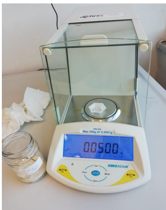
Slika 13. Vaga za odvagu inertnih prašiva