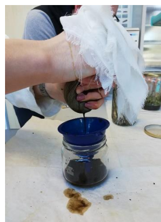
Slika 15. Cijeđenje ekstrakta