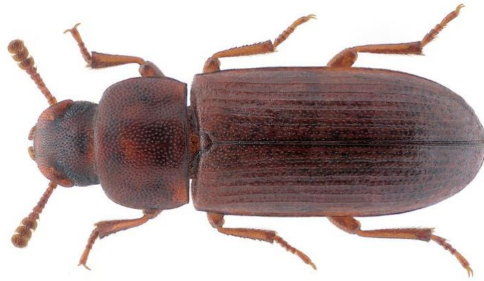
Slika 1. Imago kestenjastog brašnara