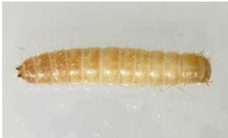
Slika 2. Ličinka kestenjastog brašnara