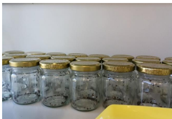
Slika 9. F1 generacije testnog štetnika