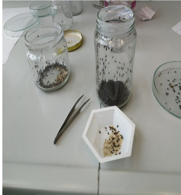
Slika 11. Odvajanje štetnika po vrstama