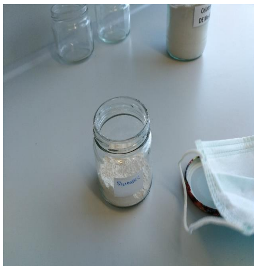
Slika 4. Dijatomejska zemlja SilicoSec®