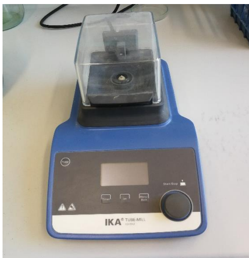
Slika 7. Mlin IKA tube mill 8829