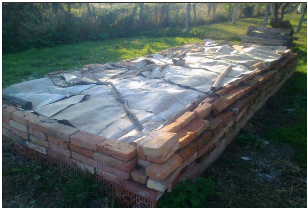
Slika 13. Gredica za proizvodnju lumbriposta

U procesu humifikacije se potpuno gubi organska tvar, a nastaje organsko gnojivo koje u sebi sadrži zreli humus vrhunske kvalitete. Proizvodnja lumbriposta nije kompliciran proces. Proizvodi se tako da se stajski gnoj slaže u posebne gredice koje su zaštićene plastičnom folijom od ulaska krtica, u gredice se unose legla kalifornijskih glista.