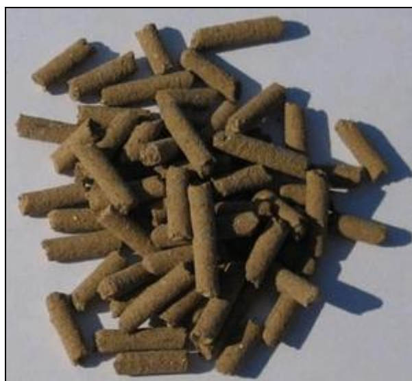
Slika 21. Dehidrirani pileći gnoj u peletiranom obliku

ITALPOLLINA – dehidrirani pileći gnoj u peletiranom obliku. Formulacija N : P : K = 4 : 4 : 4 i 0,5 MgO. Ovo gnojivo peradi je bogato hranjivim tvarima, humificiranim aktivnim organskim tvarima, mikroelementima i korisnim mikroorganizmima. Humificirana i aktivna organska tvar poboljšava mikrobiološka, fizikalna (struktura i zadržavanje vode) i kemijska svojstva tla. Rezultat toga je izostanak gubitaka ispiranjem ili neotapanjem dušika, fosfora i mikroelemenata u otopini tla. Može se primjenjivati u voćnjacima, vinogradima, povrću, cvijeću, u ratarstvu se primjenjuje u pšenici u količini 0,5 – 0,8 t/ha. Pogodna je za osnovnu gnojidbu, gnojidbu tla prije sjetve, jesensku gnojidbu. Kako bi se u potpunosti iskoristilo djelovanje organske tvari ovo gnojivo je potrebno unijeti na dubinu od 15 centimetara.