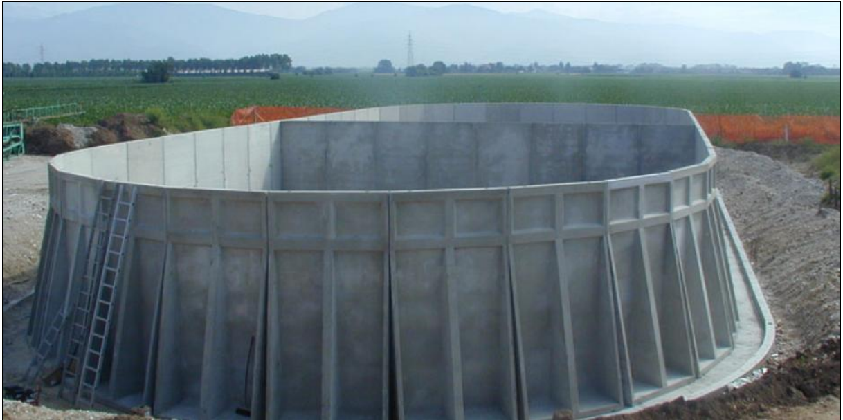
Slika 8. Laguna za gnojnicu

U Danskoj je gnojovka smještena u velike plastične kontejnere gdje ju mješalica homogenizira i u nju unosi kisik, što omogućuje aerobne procese razgradnje. Gnojnica se dozira sa 100 do 200 hl/ha uz pretpostavku da sadrži 0,2 % dušika. Za primjenu gnojnice su najbolji neleguminozni krmni usjevi na oranici. Na travnjak se iznosi rano u proljeće, a na pašnjak prije početka vegetacije trave. Unošenjem tekućih gnojiva u tlo uporabom ulagača (injektora) gubici dušika isparavanjem su minimalni, na ovaj način se izbjegava i gubitak amonijaka i širenje neugodnih mirisa.