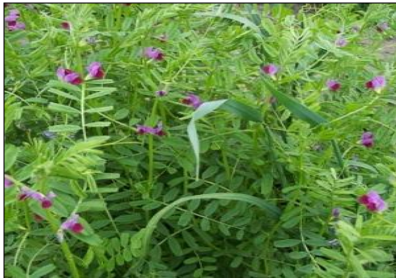
Slika 19. Grahorica

Leguminozni siderati: lupine, grahorice, bob, smiljkita, seradela.