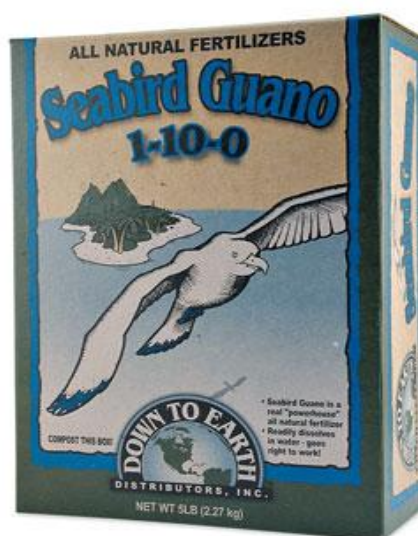
Slika 20. Pakiranje gnojiva Guano

GUANO – organsko gnojivo sa značajnim sadržajem i visokom raspoloživošću dušika i fosfora. Ovo gnojivo nastaje taloženjem izmeta morskih ptica Južne Amerike, može imati naglašen sadržaj dušika (formulacija 8 : 4 : 1) ili naglašen sadržaj fosfora (formulacija 3 : 8 : 1) uz nizak sadržaj kalija. Ekskrementi ptica se preradom oblikuju u granule različitih veličina pa su pogodni za raspodjelu po poljoprivrednom tlu. Unošenjem ovoga gnojiva u tlo ono se obogaćuje biljnim hranivima, ali osim toga, guano povoljno djeluje na fizikalna svojstva tla. Guano se u Europi rijetko primjenjuje zbog visoke cijene transporta.