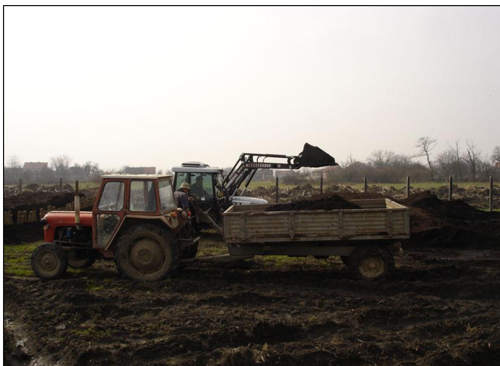
Slika 4. Utovar krutog stajskog gnoja

Kada je stajski gnoj dovoljno zreo za uporabu na poljoprivrednoj površini on se odvozi s gnojišta. Utovar stajskog gnoja se vrši strojevima. Pražnjenje gnojišta je poželjno izvoditi po oblačnom i prohladnom vremenu bez oborina i vjetra.