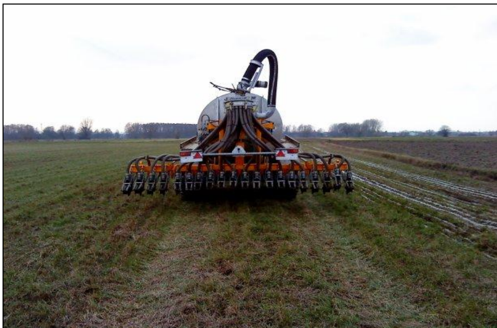
Slika 9. Injektor za gnojnicu

U Danskoj je gnojovka smještena u velike plastične kontejnere gdje ju mješalica homogenizira i u nju unosi kisik, što omogućuje aerobne procese razgradnje. Gnojnica se dozira sa 100 do 200 hl/ha uz pretpostavku da sadrži 0,2 % dušika. Za primjenu gnojnice su najbolji neleguminozni krmni usjevi na oranici. Na travnjak se iznosi rano u proljeće, a na pašnjak prije početka vegetacije trave. Unošenjem tekućih gnojiva u tlo uporabom ulagača (injektora) gubici dušika isparavanjem su minimalni, na ovaj način se izbjegava i gubitak amonijaka i širenje neugodnih mirisa.