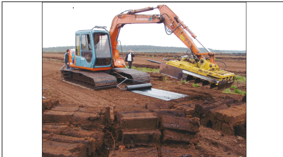
Slika 14. Treset

Ova vrsta komposta se proizvodi u zemljama s mnogo treseta (Rusija, Finska, Poljska), Hrvatska je uvoznik ovog treseta. Kod nas se treset koristi kao supstrat u stakleničkoj i plasteničkoj proizvodnji.