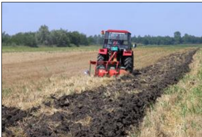
Slika 17. Unošenje posliježetvenih ostataka u tlo