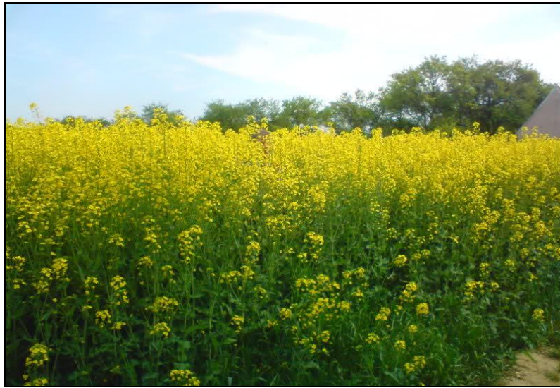
Slika 18. Uljana repica

Leguminozni siderati: lupine, grahorice, bob, smiljkita, seradela.