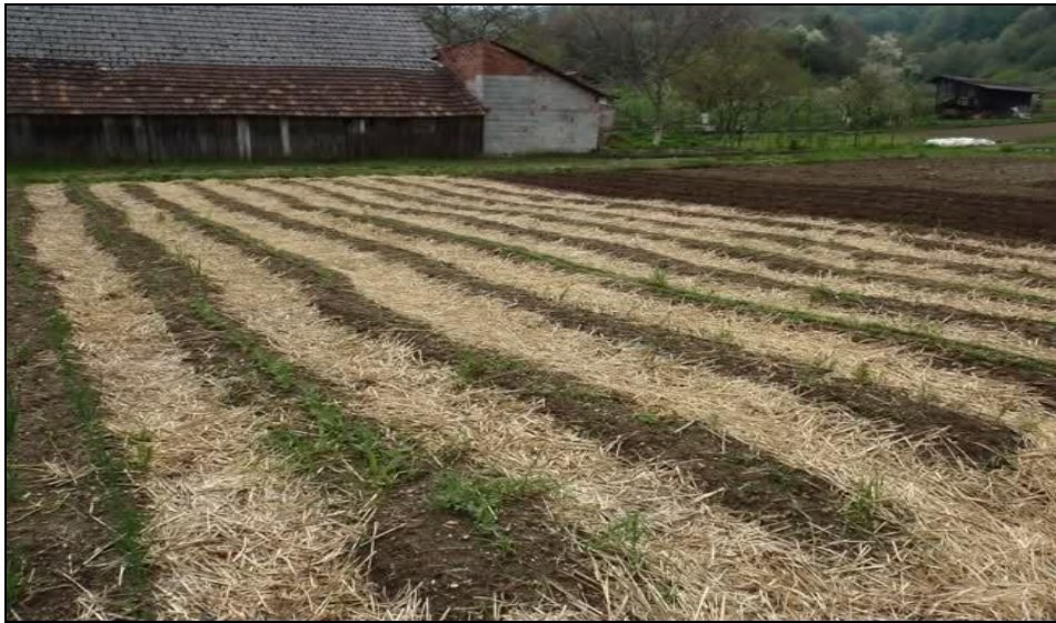
Slika 16. Malčiranje posliježetvenim ostacima

UNOŠENJE POSLIJEŽETVENIH OSTATAKA U TLO – ovaj postupak s posliježetvenim ostacima dakako ima veću prednost u odnosu na spaljivanje. Posliježetveni ostaci mogu biti: slama, kukuruzovina, lišće šećerne repe, cima krumpira, rozgva vinove loze i dr., a za nas je najvažnija slama strnih žitarica i kukuruzovina. Posliježetveni ostaci će biti najkorisniji nakon razgradnje, a za razgradnju organske tvari je važan odnos ugljika i dušika. Pokazalo se da su prinosi viši i stabilniji ako se prilikom unošenja posliježetvenih ostataka u tlo provede gnojidba dušikom. Za gnojidbu su povoljna gnojiva koja sadrže kalcij, a pritom ne zakiseljavaju tlo. Vrijednost posliježetvenih ostataka kao humusne sirovine je veća što je odnos ugljika i dušika uži. Najširi odnos ugljika i dušika ima slama strnih žitarica, uži ima kukuruzovina, a najuži lišće šećerne repe. Dubina unosa nadzemnih ostataka mora biti takva da do zaorane mase prodire kisik, jer je proces razgradnje aeroban. Dubina unosa na srednje teškom tlu i za manje količine ostataka iznosi od 10 do 20 centimetara.