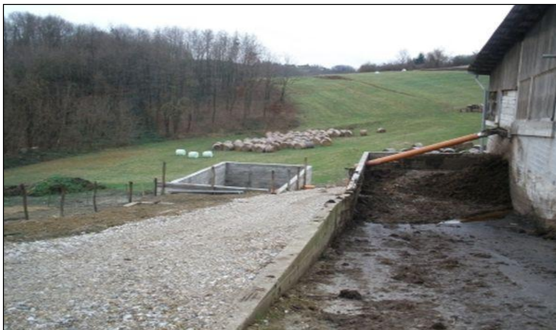
Slika 3. Gnojište za kruti stajski gnoj

Gnojište je prostor u koji se odlažu ekskrementi životinja i stelja i gdje će se odvijati proces humifikacije. Najpovoljniji je položaj gnojišta u blizini staje radi lakše manipulacije na gnojištu i na kraju radi lakšeg odvoženja zreloga stajskog gnoja na mjesto uporabe. Za gnojište je najbolje postaviti betonsku podlogu i napraviti pravokutni oblik.