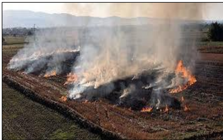
Slika 15. Spaljivanje žetvenih ostataka

SPALJIVANJE – je najlošiji način postupanja s posliježetvenim ostacima. Osim što nije uvijek uspješno, traži dosta posla i troškova. Posliježetveni ostaci su jedan od izvora hraniva i organske tvari, a spaljivanjem se organska tvar gubi u potpunosti, a za gnojidbu ostaje samo pepeo.