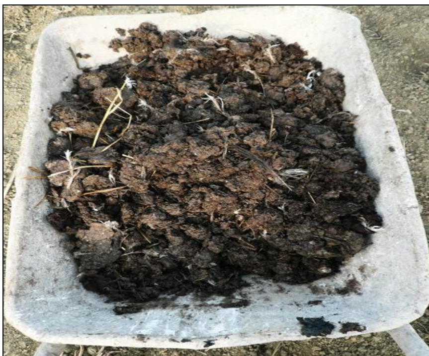
Slika 10. Kokošji gnoj

Gnoj peradi je organski domaći gnoj, jedine razlike između njega i krutoga stajskog gnoja su: u gnoju peradi nema tekućih izmetina, a stelja je različita (za stelju se koriste ljuške suncokreta, piljevina).