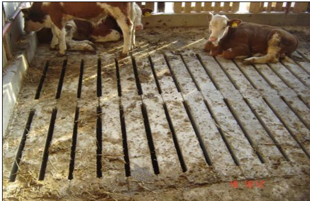
Slika 6. Staja s rešetkastim podom

Tekući stajski gnoj ili gnojovka nastaje pri držanju stoke bez stelje, odnosno kada se kruti ekskrementi spremaju bez stelje. Pri ovom načinu prikupljanja gnoja ima manje posla nego kod krutog stajskog gnoja, ima manje posla oko spremanja – moraju se izgraditi staje s rešetkastim podom, tako da svi ekskrementi izravno padaju u bazen ispod ležišta stoke.