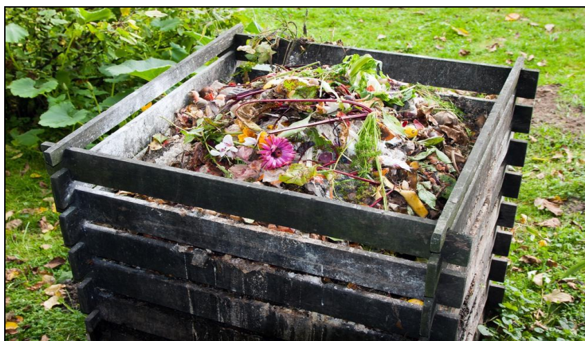
Slika 11. Kompostiranje kućnih otpadaka

Obični domaći kompost proizvodi se kompostiranjem različitih otpadaka iz kućanstva. Trajanje kompostiranja i na kraju kvaliteta samog komposta najviše ovise o sirovinama koje se kompostiraju. Osim brzo razgradljivih organskih tvari u kompostnu hrpu se odlažu i teško i sporo razgradljive organske tvari kao što su npr. kosti, dlake, perje, čekinje, tvari s velikom sposobnošću vezanja vode i hraniva (tlo mulj i pepeo), tvari koje potiču kompostiranje (fekalije, vapno, gnoj domaćih životinja).