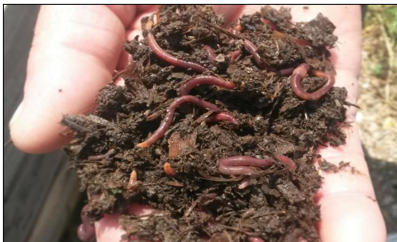
Slika 12. Kalifornijske gliste ( Eisenia foetida )

Kod ove vrste kompostiranja karakteristično je to što se humifikacija stajskog gnoja provodi do kraja, humifikaciju obavljaju kalifornijske gliste ( Eisenia foetida ).