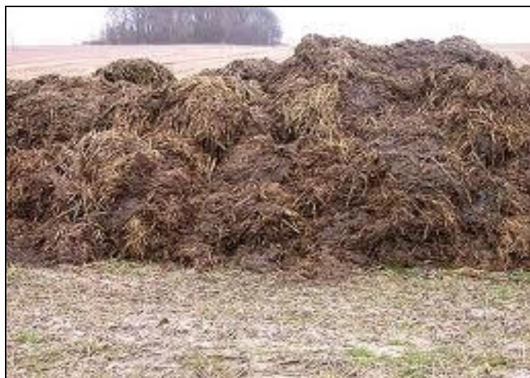
Slika 2. Kruti stajski gnoj

Ova smjesa se humificira u gnojišnoj jami aktivnošću mikroorganizama. Humifikacija u našem podneblju traje tri do četiri mjeseca ili čak do godinu dana.