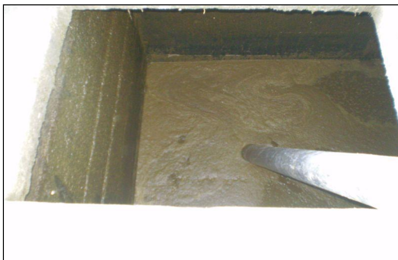
Slika 7. Gnojovka

U gnojovki je slijedeći odnos glavnih biljnih hraniva ( N : P_2O_5 : K_2O ) = 1 : 0,39 : 1,58. Kao što se vidi, gnojovka je najbogatija kalijem, nešto manje fosforom, zbog toga se gnojovka smatra kalijsko – dušičnim gnojivom i gnojidba gnojovkom se mora korigirati dodavanjem fosfora. Za primjenu gnojovke je najpovoljnija doza od 20 do 25 m 3 po hektaru. Gnojovka se obično primjenjuje na: pašnjacima (10 – 20 t/ha), livadama (30 – 40 t/ha). Najbolje ju je primijeniti u rano proljeće. Osim na pašnjacima i livadama, gnojovka se može primijeniti i u žitaricama (6 – 10 t/ha), te okopavinama (20 – 30 t/ha) i kukuruzu (30 – 40 t/ha). Na oranicama ju je najbolje primijeniti prije sjetve, ili u proljeće po razvijenim biljkama.