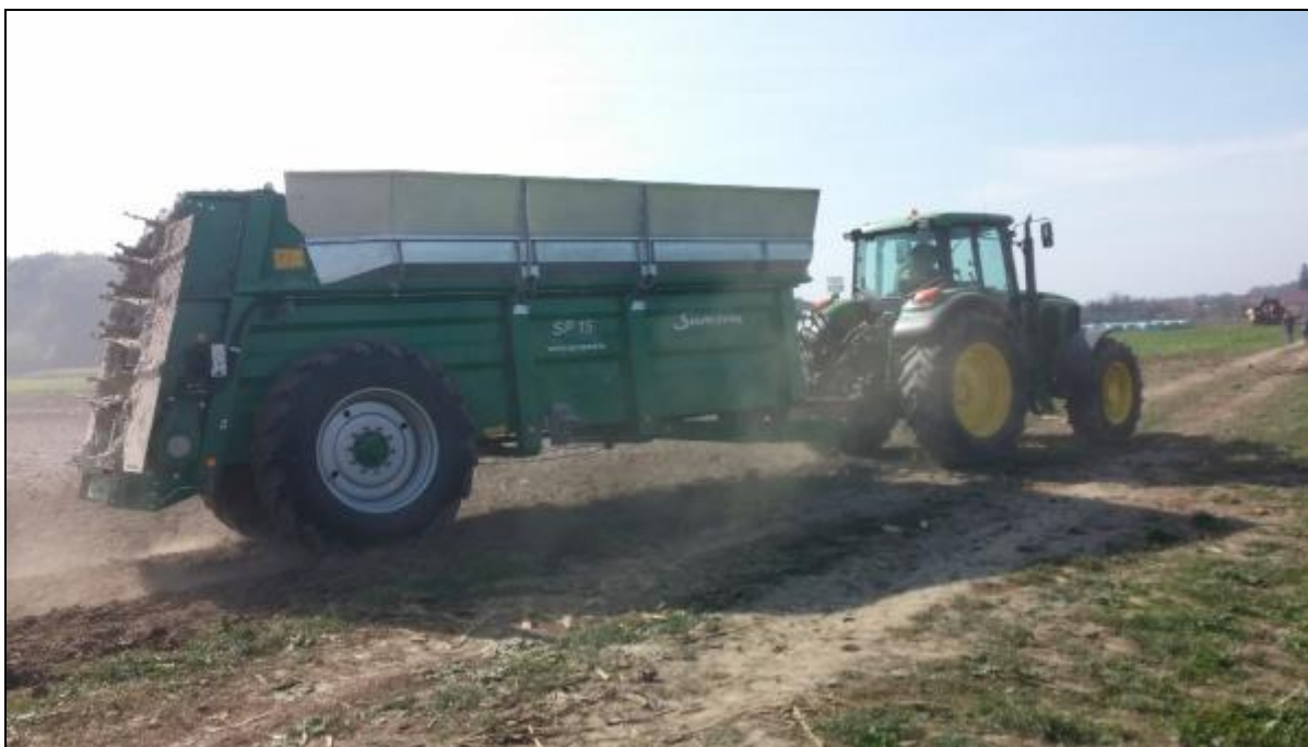
Slika 5. Razbacivanje krutog stajskog gnoja

Ako ga nije moguće odmah unijeti u tlo onda se ostavlja na hrpama i prekriva tlom kako bi se spriječio gubitak hraniva. Postoji i praksa korištenja svježega stajskog gnoja (ona je česta u SAD – u), u ovom slučaju gnoj prolazi buran proces razgradnje u tlu i zato se ovakav način gnojidbe provodi kada je vremenski razmak između primjene i korištenja svježega stajskog gnoja i sjetve ili sadnje dulji. Vrijeme unošenja zreloga stajskog gnoja varira, ovisno o plodoredu, klimi i teksturi tla.