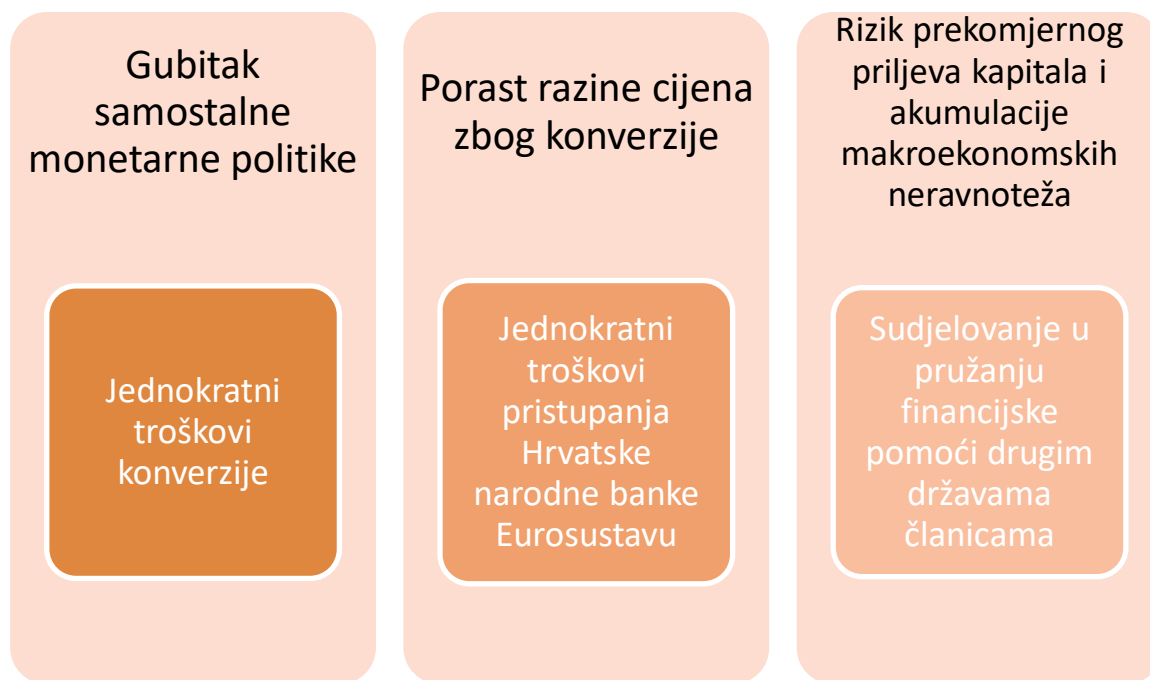
Slika 3. Troškovi uvođenja eura u Hrvatskoj