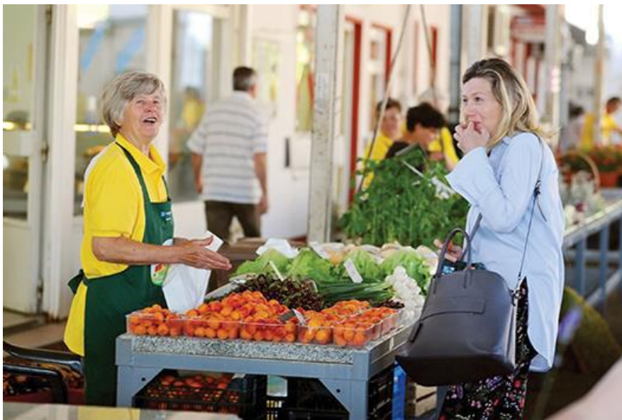
Slika 5. Osobna prodaja

Osobnu prodaju čine prodavači koji su u osobnom kontaktu s potencijalnim kupcima. Radi se o izravnoj prodaji u kojoj je prodavač u trostrukoj ulozi: prenosi poruke potencijalnom kupcu, prima poruke od potencijalnog kupca te daje povratne informacije potencijalnom kupcu.