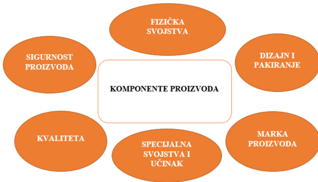
Slika 2. Komponente proizvoda

Komponente proizvoda prikazane su na slici 2.