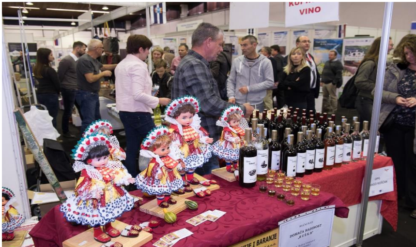
Slika 6. Besplatni uzorci vina