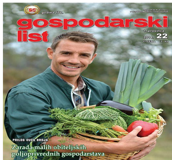
Slika 4. Gospodarski list

Primjerice, poljoprivrednici se mogu reklamirati putem poljoprivrednih časopisa. Jedan od njih je Gospodarski list koji je svojim sadržajem okrenut obiteljskim poljoprivrednim gospodarstvima, velikim i malim poljoprivrednicima donoseći napise iz svih grana poljoprivredne struke.