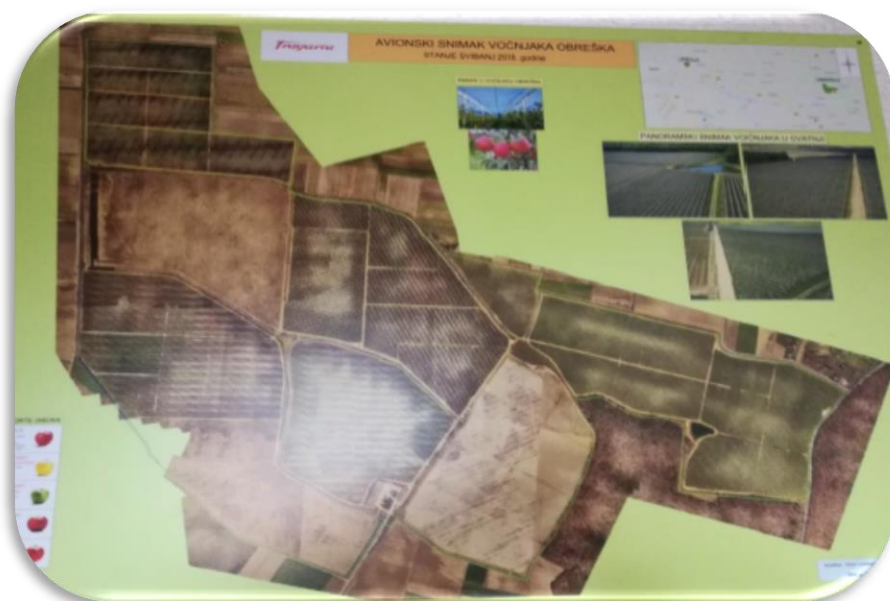
Slika 10. Planski prikaz voćnjaka Obreška