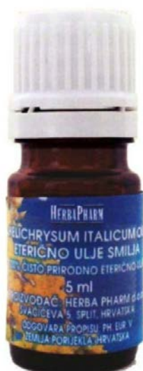
Slika 4. Eterično ulje smilja