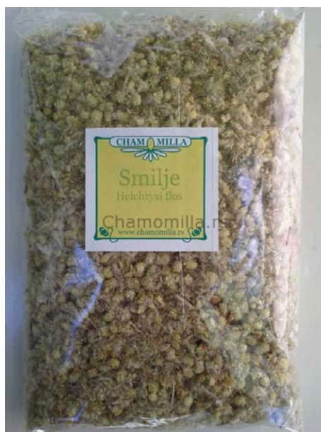
Slika 5. Čaj od smilja