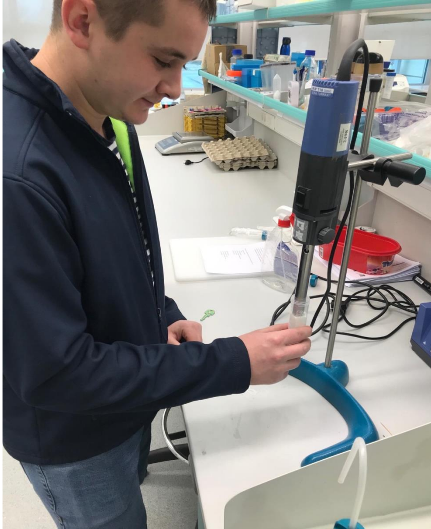
Slika 3. Rad na ultrazvučnom homogenizatoru T18 basic Ultra Turrax, IKA®

Tako pripremljena emulzija je dalje homogenizirana uz pomoć ultrazvučnog homogenizatora (T18 basic Ultra Turrax, IKA®) (Slika 3.) (jačina 4/5, u trajanju od 5 min) kako bi se dobila nanoemulzija.