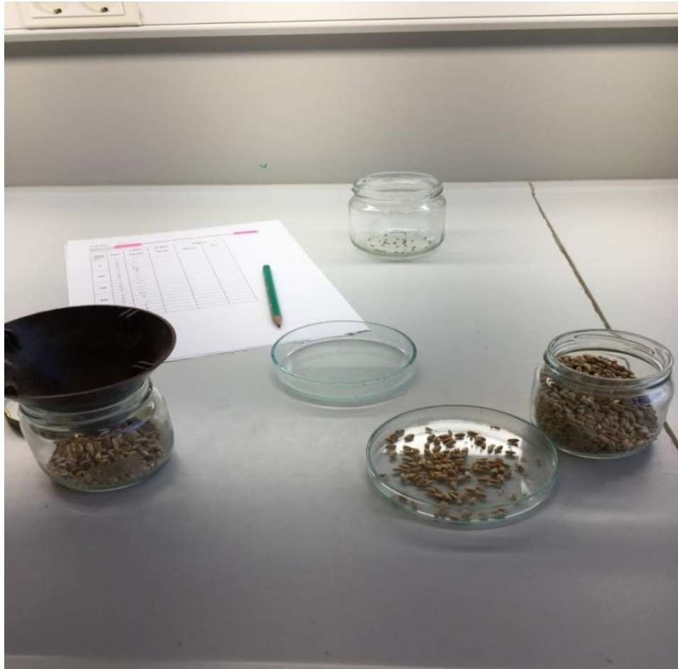
Slika 6. Očitanje broja uginulih jedinki rižinog žiška