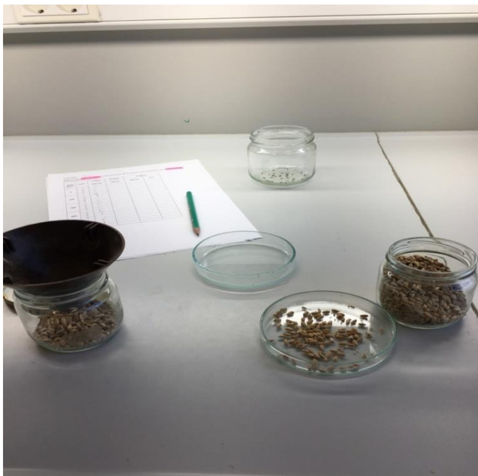
Slika 6. Očitanje broja uginulih jedinki rižinog žiška