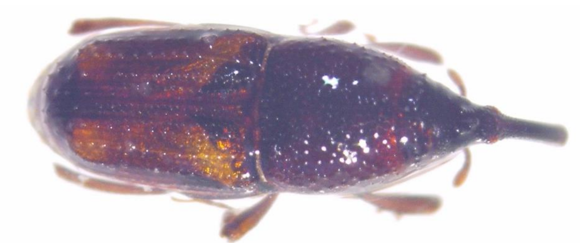
Slika 1. Rižin žižak

Rižin žižak – Sitophilus oryzae (L.) (Slika 1.) je primarni štetnik iz porodice Curculionidae (pipe). Najčešće oštećuje cijelo i zdravo zрно žitarica, a rasprostranjen je diljem svijeta. Jaja polažu pojedinačno u zrnju a izlegle ličinke su nepokretne te žive i hrane se u zrnju. Tijelo odraslog kornjaša je dužine 2,5 - 4,5 mm, a, kao i kod svih pipa, karakteristična im je glava produžena u rilo koje pomaže pri ubušivanju u zrnju. Na pokriltju imaju 4 ovalne crvene pjege te mogu letjeti. Imaju 2 do 4 generacije godišnje, a ženka može u godini dana položiti 400 do 600 jajašaca.