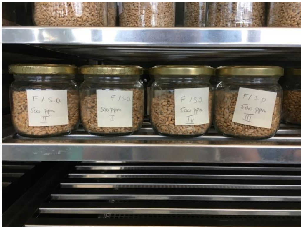
Slika 5. Hermetički zatvorene posude u kontroliranim uvjetima