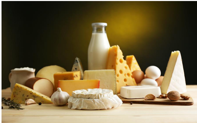
Slika 4. Horizontalna diversifikacija - mlijeko i mliječne preradevine

se tamo susreću s iznimno velikom konkurencijom, a zbog malih proizvodnih jedinica koje posjeduju ne uspijevaju specijalizirati proizvodnju te na taj način osigurati profitabilnu proizvodnju. Mnogo je mogućnosti rješenja ove krizne poslovne situacije, a jedno od njih je diversifikacija poljoprivredne proizvodnje, što zapravo predstavlja nadogradnju primarne poljoprivredne proizvodnje raznim poljoprivrednim i nepoljoprivrednim aktivnostima. Diversifikacija poljoprivrednih proizvoda podrazumijeva širenje proizvodnog asortimana, primjerice poljoprivredno gospodarstvo uz prodaju sirovog mlijeka može proširiti djelatnost na proizvodnju raznih sireva, vrhnja, kiselog mlijeka i slično. Uz primarnu proizvodnju voća uvodi se i proizvodnja voćnih preradevina poput alkoholnih pića, džemova, kompota i sokova, a uz uzgoj cvijeća vrlo je uobičajeno početi se baviti i prodajom aranžmana. Na ovaj način može se povećati prihod po jedinici primarne proizvodnje (litra mlijeka, kilogram voća i drugo), a ujedno se stvaraju i nove mogućnosti zapošljavanja jer prerada zahtijeva veću količinu radne snage, što ima iznimno važno značenje za ublažavanje nepoželjnih procesa depopulacije ruralnih područja (Zmaić i sur. 2011.).