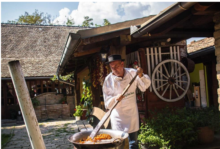
Slika 5. Manifestacija – Čvarak fest u Karancu