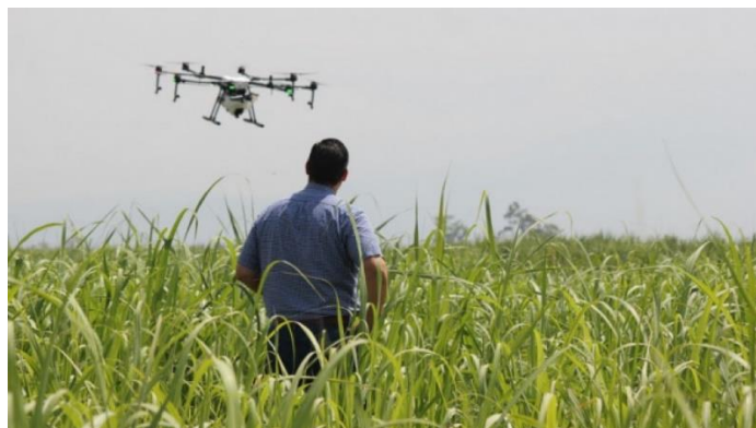
Slika 2. Primjer primjena inovacija u biotehnologiji

poduzeća mogu proizvesti važne informacije potrebne za koordinaciju svih svojih odjela – prodaje, marketinga, usluga korisnicima te kako bi se brže i bolje služilo potrebama klijenata.