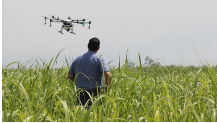
Slika 2. Primjer primjena inovacija u biotehnologiji

poduzeća mogu proizvesti važne informacije potrebne za koordinaciju svih svojih odjela – prodaje, marketinga, usluga korisnicima te kako bi se brže i bolje služilo potrebama klijenata.