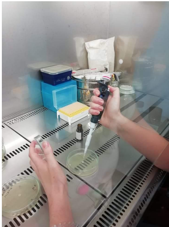
Slika 3. Primjena eteričnih ulja

Nakon što su se gljive razvile postavili smo pokus u 4 ponavljanja za svaku varijantu. Prije postavljanja pokusa komoru za rad u čistom je potrebno dezinficirati etilnim alkoholom. Nakon toga, na sredinu svake Petrijeve zdjelice se pincetom postavi okrugli isječak filter papira (5 mm) na koji se mikro pipetom nakapa određena količina eteričnog ulja (5, 15 ili 25 \mu l). Na 4 mjesta koja su dijagonalno raspoređena 10 mm od ruba nacijepi se čista kultura gljive. Kružni isječki podloge s micelijem gljive izvađeni su pomoću sterilnog bušaća promjera 5 mm. U kontrolnoj varijanti umjesto aplikacije eteričnog ulja na filter papir apicira se sterilna destilirana voda. Nakon toga Petrijeve zdjelice postavljene su u termostat komoru na temperaturu od 22 °C i režim svjetla 12 sati dan / 12 sati noć.