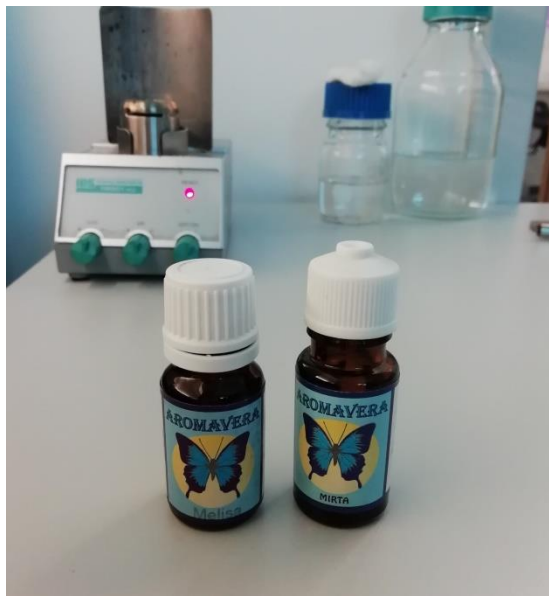
Slika 2. Eterična ulja matičnjaka i mirte

Istraživanje antifungalnog djelovanja eteričnih ulja matičnjaka i mirte na porast micelija osam fitopatogenih gljiva provedeno je u Centralnom laboratoriju za fitomedicinu Fakulteta agrobiotehničkih znanosti Osijek. Cilj je bio utvrditi antifungalno djelovanje eteričnih ulja matičnjaka i mirte koje smo primjenili u tri količine (5, 15 i 25 \mu l). Prilikom rada korišteno je sterilizirano posuđe, metalna pinceta, plamenik, metalni kružni rezač i 96 % etilni alkohol.