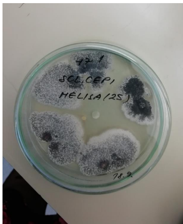
Slika 5. Porast micelija uz primjenu ulja matičnjaka (25 \mu l)