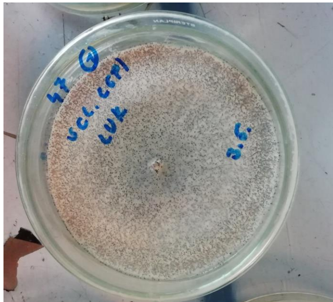
Slika 6. Čista kultura gljive Sclerotinia cepivorum

Eterično ulje mirte nije imalo negativan učinak na rast micelija gljivice Macrophomina phaseolina pri temperaturi 22 °C i količinama 5 i 15 \mu l dok statistički vrlo značajno inhibira rast micelija gljive u odnosu na kontrolu primjenom u količini 25 \mu l. Ulje mirte je sedmi dan od nacjepljivanja imalo statistički vrlo značajan inhibicijski utjecaj na rast micelija gljive Sclerotium cepivorum kada je prijenjeno u količinama 5 i 25 \mu l u odnosu na kontrolu, a primjenom ulja u količini 5 \mu l micelij gljive je potpuno prerastao Petrijevu zdjelicu.