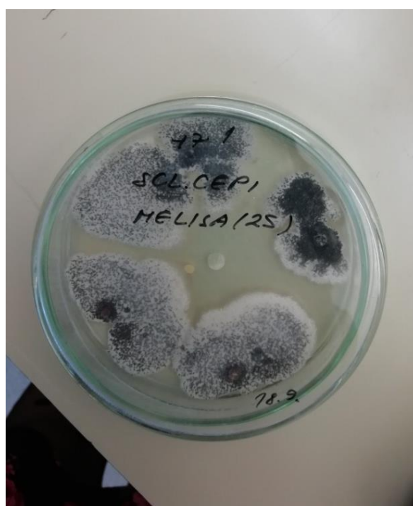
Slika 5. Porast micelija uz primjenu ulja matičnjaka (25 \mu l)