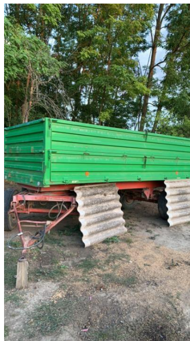
Slika 3. Traktor i priključci OPG-a „Srimac Matej“