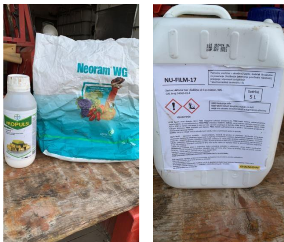
Slika 10. Sredstva za zaštitu od bolesti koja se koriste na OPG-u „Srimac Matej“

Vađenje šećerne repe: obavilo se uslužno preko kooperacije sa tvrtkom Anabella d.o.o. koja surađuje sa Osječkom šećeranom pa su tako oni organizirali vađenje i odvoz.