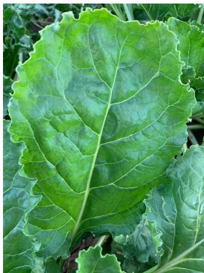
Slika 11. List šećerne repe na kojem nema pojave bolesti

Unazad nekoliko godina Cercospora beticola je postala rezistentna na fungicide te se na ovom OPG-u u sezoni od sredine lipnja pa sve dok su uvjeti za nju tretira svakih 15-20 dana. U 2019. godini su tretirali 6 puta preventivno protiv cercospore. Dakle, na OPG-u „Srimac Matej“ Cercospora beticola je izrazito veliki problem tj. nije problem pojava same bolesti, njezine pojave apsolutno nema ni u najmanjoj količini, jer se na vrijeme i preventivno tretira nego je problem trošak zbog fungicida koji su dosta skupi. Na okolnim zemljištima bila je alarmantna pojava bolesti Cercospora beticola , tretirali su 3 do eventualno 4 puta te ju nisu mogli suzbiti jer su štedjeli na sredstvima i znatno im je smanjen prinos sa oko 67-70 t/ha, no Matej smatra da si takve štete i gubitke ne smije priuštiti, te dodaje kako cercosporu na svom OPG-u tretira sa dva fungicida te dodaje okvašivač zbog ljepljenja.