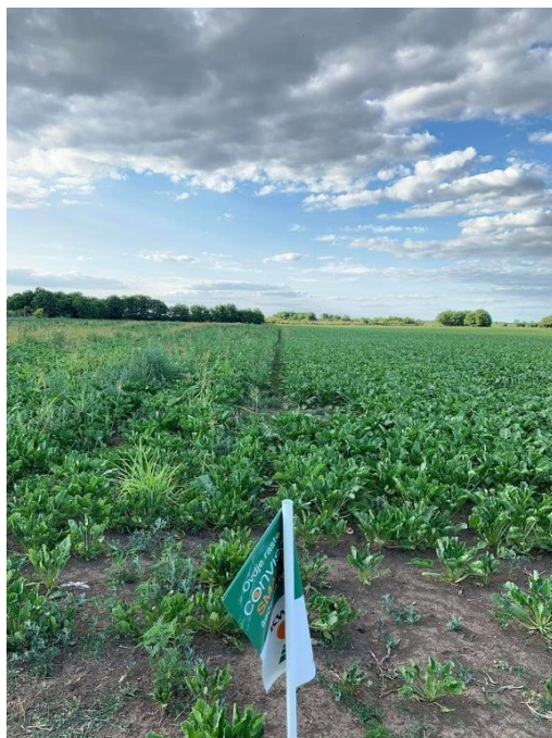
Slika 9. Conviso Smart šećerna repa iz KWS-a

Sjetva: Sjetva šećerne repe na OPG-u „Srimac Matej“ obavljena je u optimalnom roku, početak sjetve bio je 11.03.2019., sjetva je trajala 3 h, a predusjev je bila pšenica. Toga dana temperatura je bila 3 °C i dnevna 11 °C. Sijana je Conviso Smart šećerna repa iz KWS-a pod nazivom Bellamia . Sjetva je obavljena uslužno preko Anabella d.o.o.