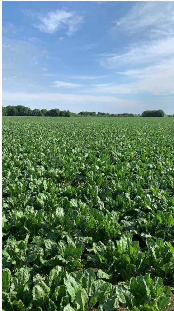
Slika 5. Šećerna repa na OPG-u „Srimac Matej“ (Autor: Anna Ištvanović)

Šećerna repa dvogodišnja je biljka i uzgaja se za proizvodnju šećera te je jedna od najvažnijih usjeva (slika 5.). Korijen je vretenast, a sastoji se od glave na kojoj se formiraju listovi, vrata, tijela (najvažniji dio, vadi se i prerađuje te u njemu ima najviše šećera) i repa. Korijen je veličine 10-15 cm, dug 20-25 cm, a težak 0,5-1 kg. Plojka lista je srcolikog ili ovalnog oblika i neravne površine, a njezina duljina iznosi 20-30 cm. Stabljika je rebrasta i uspravna, a može narasti i do 2 m. Iz pazuha listova oblikuje postrane grane prvog reda iz kojih se oblikuju grane drugog reda itd. Oprašivanje obavljaju insekti, a cvjetovi se nalaze u pazuhu listova grana zadnjeg reda. Plod šećerne repe je srasli orašac (Gagro,1998.).