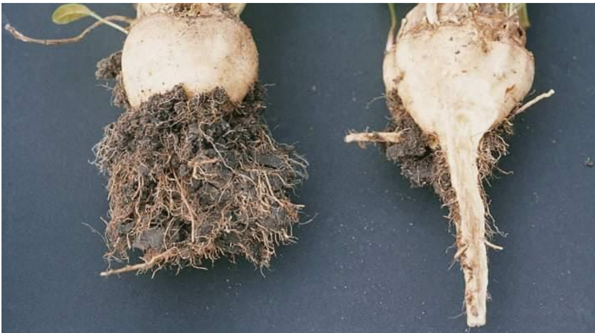
Slika 7. Rizomanija

trebala sijati barem 8 godina. Pojava ove bolesti smanjuje prinos i za 70%, a digestiju za skoro 50%.