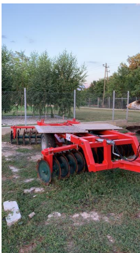
Slika 4. Mehanizacija OPG-a „Srimac Matej“