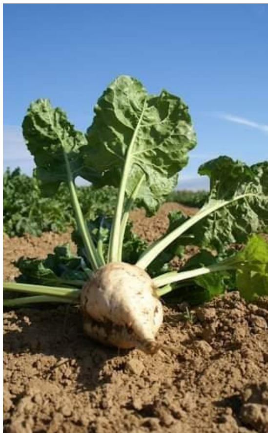
Slika 1. Šećerna repa