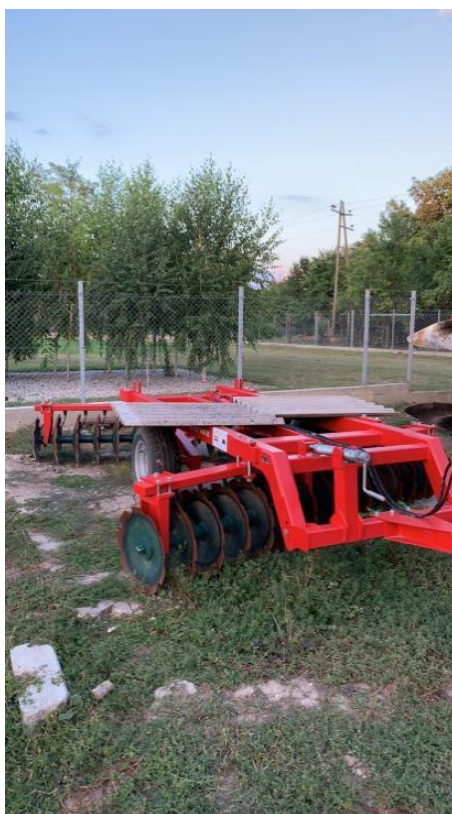
Slika 4. Mehanizacija OPG-a „Srimac Matej“