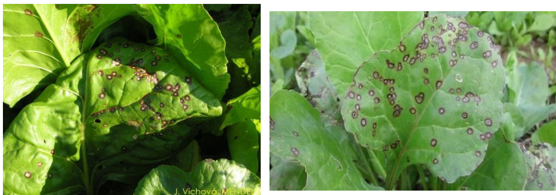
Slika 6. Pjegavost lista šećerne repe

stoga se na ovom OPG-u tretiranje provodi preventivno. Biljka na ovu bolest reagira tako što odbacuje stare listove koji su zaraženi i koje je ova gljiva napala i uništila i tjera nove listove (retrovegetacija), a time se automatski izdužuje glava korijena što dovodi do problema pri vađenju.