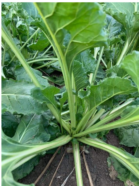
Slika 2. Šećerna repa na Obiteljskom poljoprivrednom gospodarstvu „Srimac Matej“