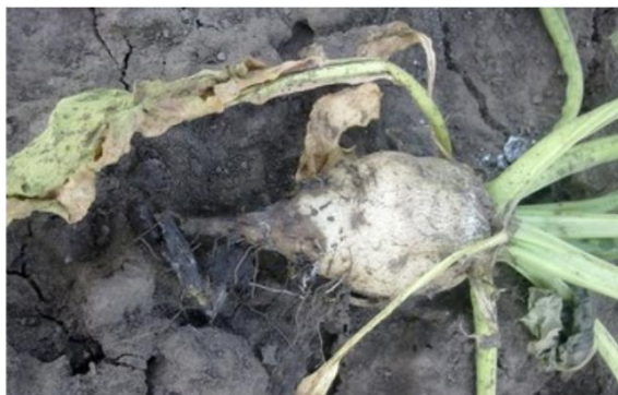
Slika 8. Rizoctonia solani