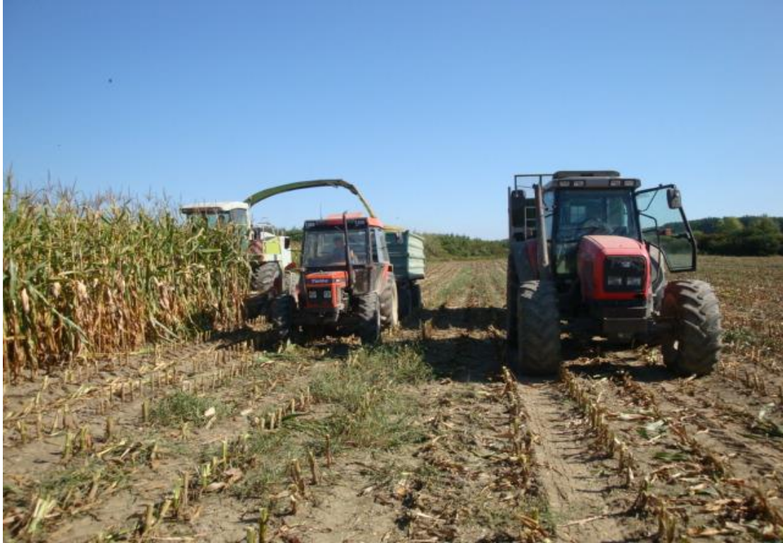
Slika 2 Košnja silažnog kukuruza Foto: Matej Kovaček, 2019.