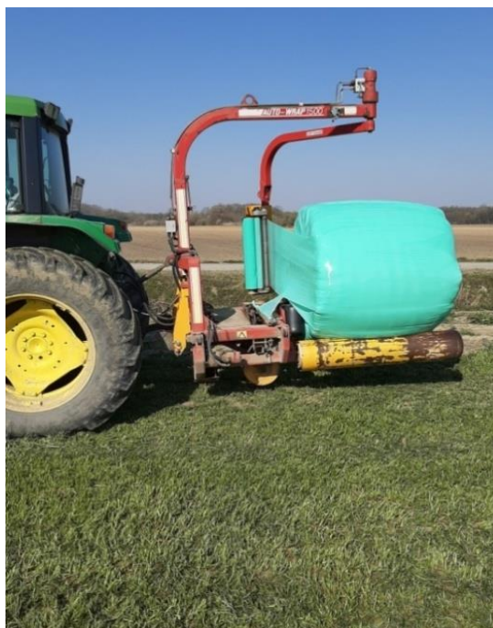
Slika 8 Umatanje bala talijanskog ljujla Foto: Matej Kovaček, 2020