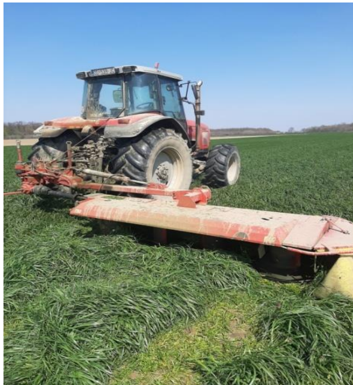
Slika 5 Košnja ljulja na OPG-u Foto: Matej Kovaček, 2020.

Baliranje provenute mase obavljeno je balirkom za okrugle bale (Slika 7.). i oblikovane bale omotane su folijom (Slika 8.), kako bi se omogućila anaerobna fermentacija silaže.