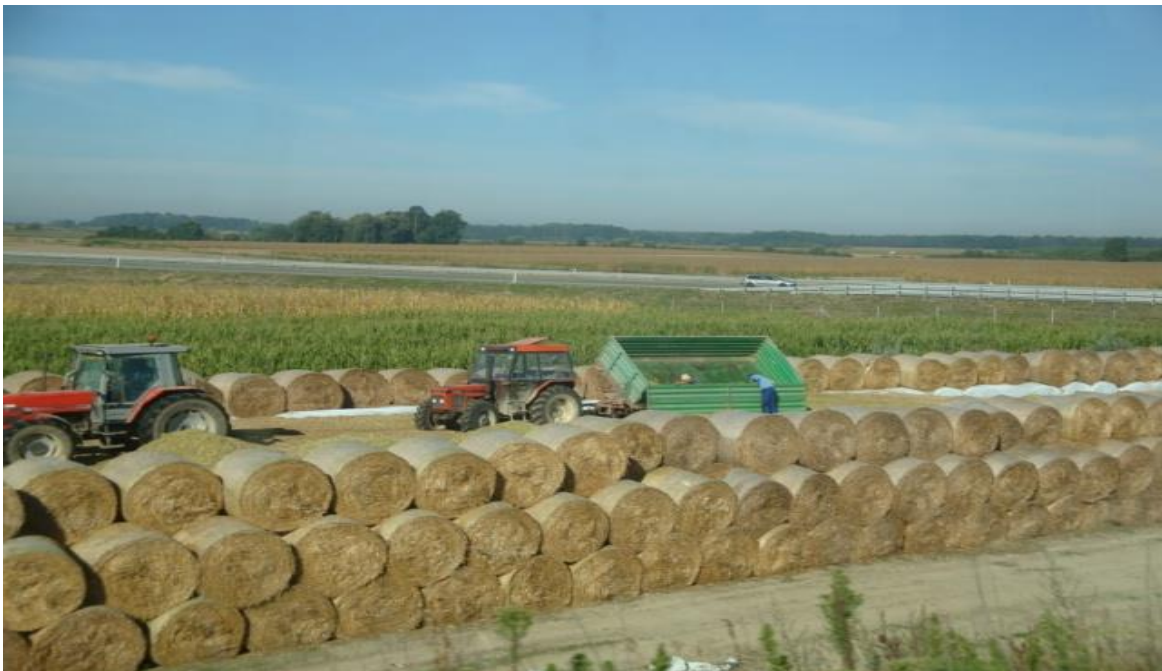
Slika 3 Improvizirani silosi na istraživanom OPG-u