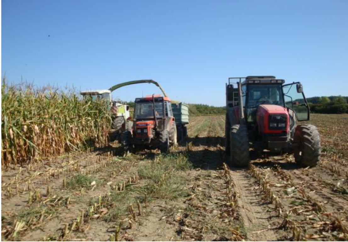
Slika 2 Košnja silažnog kukuruza Foto: Matej Kovaček, 2019.