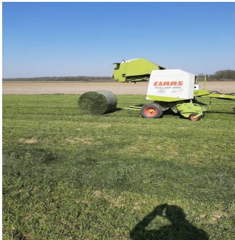
Slika 7 Baliranje talijanskog ljujla