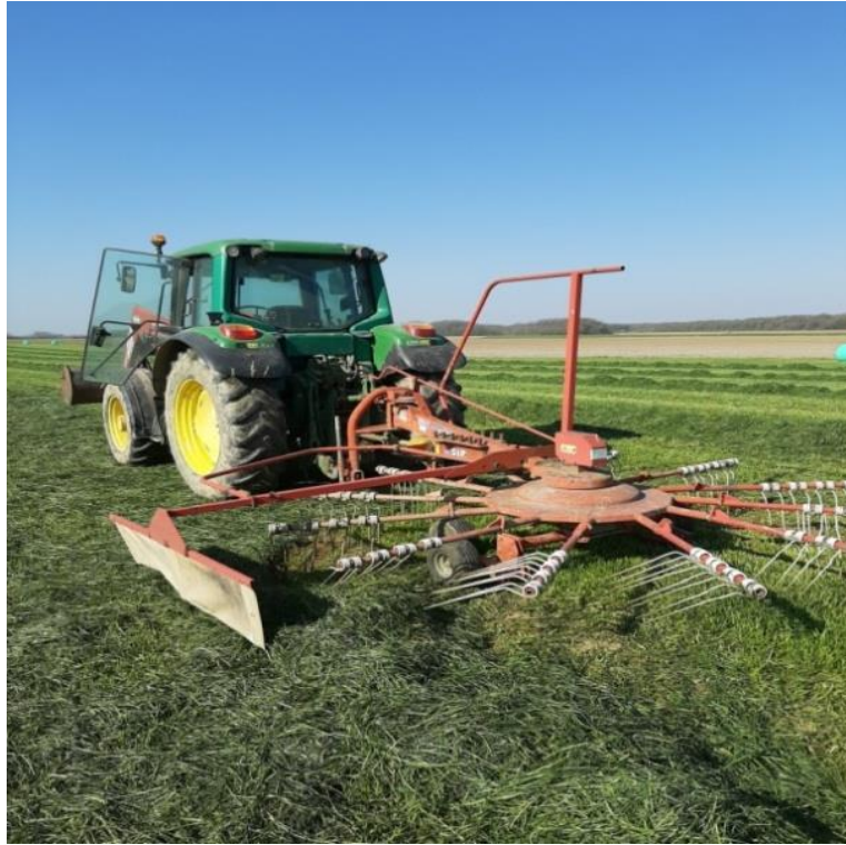
Slika 6 Sakupljanje pokošene mase ljujla Foto: Matej Kovaček, 2020