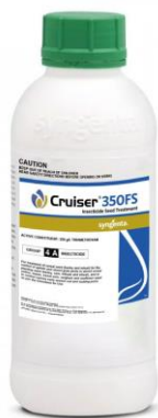
Slika 4. Insekticid Cruiser 350FS

Sredinom travnja kukuruz je tretiran Laudisom 2l/ha. Laudis je sistemski herbicid za suzbijanje nekih jednogodišnjih travnih i širokolisnih korova u merkantilnom kukuruzu te kukuruzu za zrno i silažu. Tretiranje je obavljeno prskalicom marke Agromehanika 1000 l priključenom na traktor Deutz fahr. Od mjera njege treba spomenuti samo jednu međurednu kultivaciju koja je obavljena je 10. svibnja 2017. i 14. svibnja 2018.godine kultivatorom koji obuhvaća 4 reda.