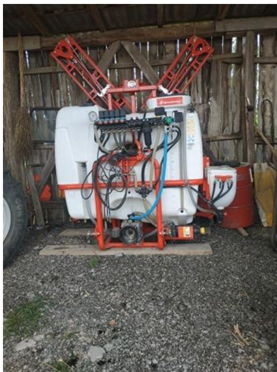
Slika 6. Prskalica Agromehanika