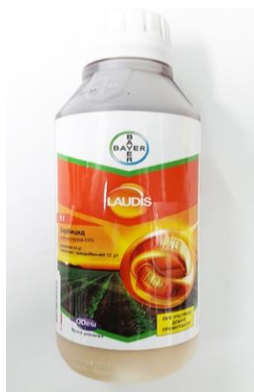
Slika 5. Zaštitno sredstvo Laudis

Sredinom travnja kukuruz je tretiran Laudisom 2l/ha. Laudis je sistemski herbicid za suzbijanje nekih jednogodišnjih travnih i širokolisnih korova u merkantilnom kukuruzu te kukuruzu za zrno i silažu. Tretiranje je obavljeno prskalicom marke Agromehanika 1000 l priključenom na traktor Deutz fahr. Od mjera njege treba spomenuti samo jednu međurednu kultivaciju koja je obavljena je 10. svibnja 2017. i 14. svibnja 2018.godine kultivatorom koji obuhvaća 4 reda.