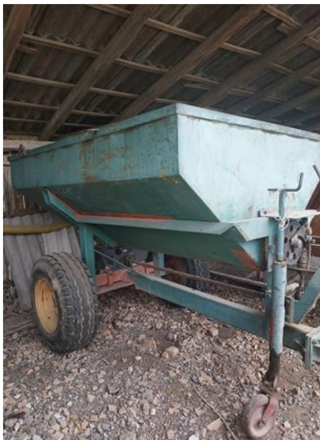
Slika 2. Rasipač