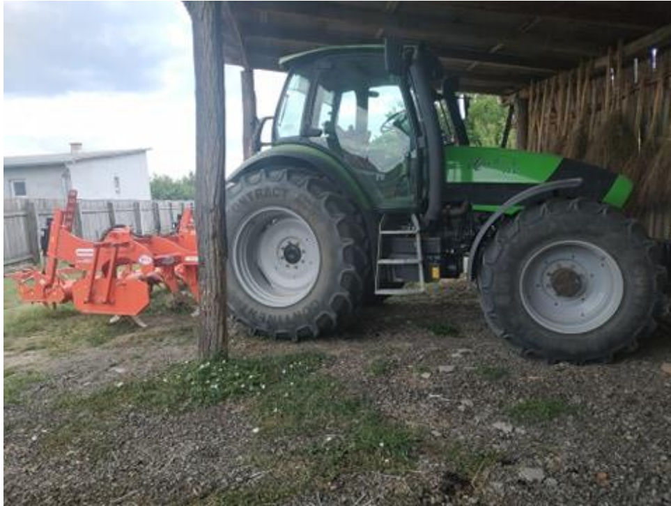
Slika 1. Traktor Deutz Fahr