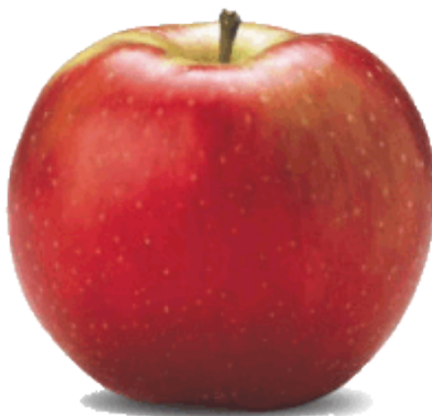
Slika 6. Sorta Idared

Sorta je dobivena križanjem sorte Jonata x Wagener uzgojio L Vernar u istaživačkoj stanici Moscow u američkoj saveznoj državi Idaho. U proizvodnju uvedena 1942. godine. Najrasprostranjenija je sorta u našim plantažnim nasadima. U kontinentalnom dijelu Hrvatske idealna za proizvodnju. Visoko produktivna sorta koja sazrijeva početkom listopada. Odličnih karakteristika za čuvanje bez posebnih prohtjeva. Meso je bjelkasto do kremasto i čvrsto, krhkog, sočnog i prijatno kiselkastog okusa bez posebne arome. Dobar je oprašivač drugim sortama. (Ibid.)