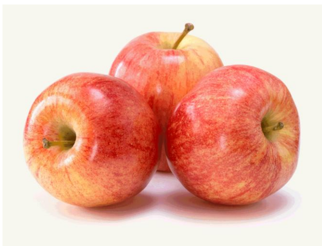
Slika 3. Sorta Fuji

Fuji je dobiven križanjem dobro poznate sorte Red Delicious i mnogo manje poznate Ralls Janet koja je vjerojatno razlog atraktivnog ružičastog preljeva. To je aromatična, vrlo sočna, hrskava jabuka. Njeno se meso lagano grize i čini kao nešto posebno od prvog zalogaja dok ispunjava usta sokom i slatkoćom. Okus je naglašeno sladak i vrlo osvježavajuć (posebice ako je malo ohlađena). Također od svih ‘slatkih’ sorata najbolje se čuva i plodovi dugo vremena zadržavaju svoju čvrstoću. (Pinova 2019.)