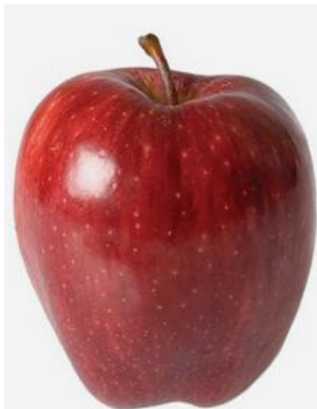
Slika 4. Sorta Red Delicious

Crveni Delišes intenzivno se uzgaja u modernim nasadima i ima mnogo potomaka, od kojih je Fuji potencijalno najzanimljiviji. Okus je istovremeno sladak i umjereno blag sa hrskavim i sočnim mesom, visokim sadržajem šećera i niskim postotkom kiseline. (VolimJabuke 2019.)