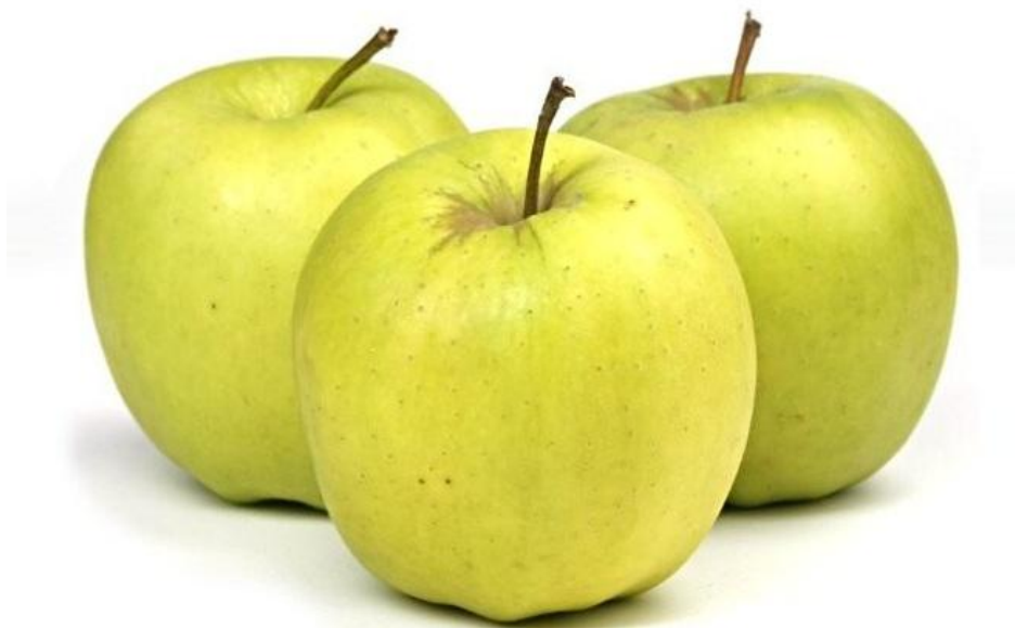
Slika 5. Sorta Gold Delicious

"Sorta je dobivena kao slučajni sjemenjak oko 1890. godine koji je otkrio Anderson H. Mullins u američkoj saveznoj državi West Virginija. 1914. godine rasadničar Paul Stark otkupio je pravo na proizvodnju za 5.000 dolara i preimenovala u Golden delicious, te je 1916. godine uveo u proizvodnju. Danas je najraširenija sorta u svijetu. Visoko produktivna plantažna sorta sa početkom berbe krajem prvog dijela rujna. Pogodna za proizvodnju u svim dijelovima Hrvatske. Skladištenje zahtjevnije, karakteristična za čuvanje u hladnjačama. Meso je sočno, kiselkastoslatkastog okusa i fine arome. Dobar je oprašivač drugim sortama." 2