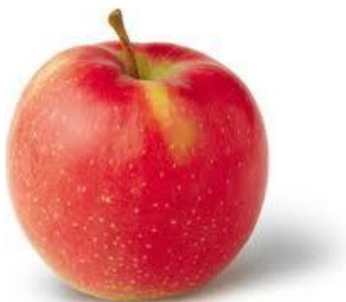
Slika 2. Sorta Jonagold

Triploidna sorta nastala križanjem Golden Delicious i Jonathan 1943. godine u SAD-u. Odlikuje se bujnim stablom i preporučuje se za uzgoj u hladnijim dijelovima. U proizvodnju je uvedena 1968. i otada je postala vrlo popularna u Europi. Osjetljiva je na krastavost, pepelnicu i bakterijsku palež. Stablo je vrlo bujno pa se preporučuje uzgoj na slabo bujnim vegetativnim podlogama kao što su M 9 i M 27. Cvate srednje kasno. Rano prorodi te obilno i redovito rađa. Dozrijeva od 15. do 30. rujna. Plodovi su izduženog koničnog oblika krupni do vrlo krupni, težine 180 do 250 g. Pokožica je tanka, osnovne zelenkastožute boje koja na osunčanoj strani prelazi u sekundarnu svijetlocrvenu koja prekrije 40 do 50% površine ploda. Plodovi su prevučeni voštanom prevlakom i imaju tanku i dugačku peteljku te se dobro drže na grani. Meso je kremaste boje, vrlo sočno, slatkokiselog okusa, hrskavo i ugodne arome. Odlična je jabuka za jelo, voćne salate i pečenje. Dobro se može čuvati nakon berbe do 3,5 mjeseca. (Pinova 2019.).