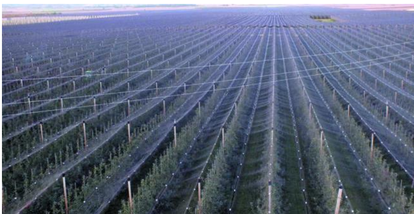
Slika 8. Nasadi jabuka tvrtke Rabo d.o.o. u Kneževim Vinogradima