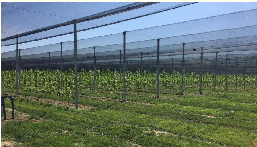
Slika 1. Nasad jabuka u Baranji

Rezidba rodni stabala obavlja se u razdoblju mirovanja voćki i u doba vegetacije. Zimskom rezidbom može se održavati uzgojni oblik zamišljenih svojstava i usmjeravati uravnoteženi odnos vegetativnog i generativnog rasta. Ljetnom rezidbom uklanjaju se nepotrebne mladice (time se poboljšava osvjetljenost unutarnjeg dijela krošnje i omogućuje bolja kakvoća prskanja), a hraniva koja se troše za rast nepotrebnih mladica preusmjeravaju se u rast skeleta krošnje, rast plodova i rodni pupova. Međuredni prostor zatravljuje se tek nakon 2 - 3 godine nakon podizanja nasada. Košnjom (malčiranjem) tratine povećava se sadržaj organske tvari, poboljšavaju fizikalna, kemijska i biološka svojstva tla. Tratina omogućuje bolje upijanje kiše i snijega na padinama. Smanjuju se nagla kolebanja temperature tla, pa je ljeti tlo ispod tratine hladnije (uz visoke temperature tla korijen slabije prima hranu), a zimi toplije (pa teško dolazi do izmrzavanja gornjega korijenja). Otpali plodovi prije berbe i u berbi manje se oštećuju i prljaju. Iz tla ispod tratine smanjuje se gubitak dušika. Poslije košnje trave taj dušik se vraća u tlo, ali tada u organskom obliku. Time se voćnjaci mogu štedljivije gnojiti dušikom, pa ne dolazi do zagađenja vodotokova. Nedostatak je u tome što u razdobljima suše, travni pokrov oduzima potrebnu vlagu korijenu jabuke. Da bi se to ublažilo, tratina u voćnjaku mora se redovito kositi 6 - 8 puta tijekom vegetacije. (Pinova 2018.)