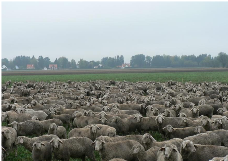
Slika 4. Württemberg ovce

Za poluintenzivnu proizvodnju najbolje su njemačka Württemberg ovca (Slika 4.) ili Jezersko Solčavska jer su to pasmine većih gabarita i dobro iskorištavaju pašu. Cilj proizvodnje je uzgoj mesa, ali s zadovoljavajućom kvalitetom vune.