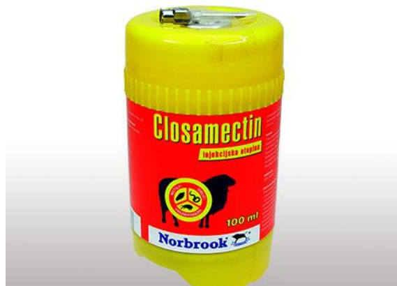
Slika 11. Cijepivo Closamectin

Od cijepiva koje koristim tu su Fascoverm i Closamectim (Slika 11.) koji se daju injekcijom potkožno, a imaju velik obujam djelovanja, a daje se u količini 1 ml na 25 kilograma tjelesne mase, te postoje cijepiva koja se daju peroralno kao što su Monil 5% i Valbazen 2.5%. Primjena kod Valbazena ili Monila ne ide odjednom, nego se daje u razmaku od 2 tjedna. Tada djelovanje bude učinkovito. Količina koja se daje iznosi 1 ml na 10 kg tjelesne mase.