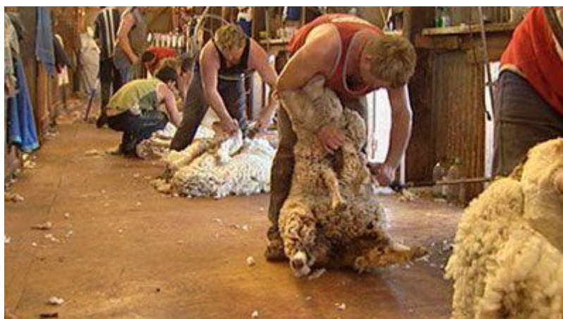
Slika 9. Striža ovaca

Kod striže sa ručnim škarama, gotovo je nemoguće ošišati ovcu ako vuna nije „podrasla“. U velikom stadu prvo se šišaju ovnovi i jalove ovce jer im vuna prije „podraste“, a kasnije ovce koje su se janjile.