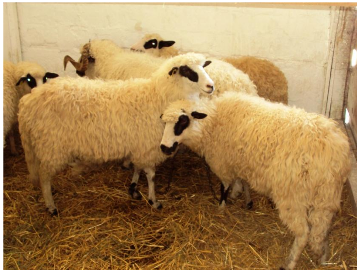
Slika 5. Krčka ovca

Zbog nepovoljnih uvjeta držanja, njege i ishrane taj sustav podrazumijeva uzgoj autohtonih pasmina, pasmina koje su upravo uzgojene u takvim uvjetima. Ove pasmine odlikuju se otpornošću, skromnošću u ishrani i izdržljivošću jer moraju prijeći velike površine u potrazi za hranom. Primjer ovce koja se uzgaja u takvim ekstenzivnim uvjetima je Krčka ovca koja je izuzetno otporna. To su većinom kombinirane pasmine koje su namjenjene proizvodnji mesa, mlijeka i vune.