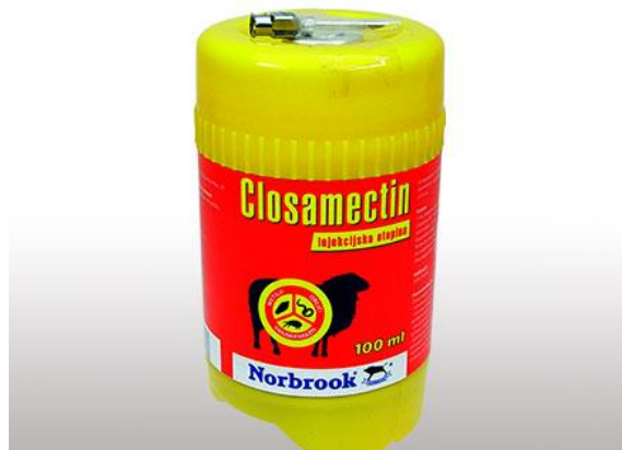
Slika 11. Cijepivo Closamectin

Od cijepiva koje koristim tu su Fascoverm i Closamectim (Slika 11.) koji se daju injekcijom potkožno, a imaju velik obujam djelovanja, a daje se u količini 1 ml na 25 kilograma tjelesne mase, te postoje cijepiva koja se daju peroralno kao što su Monil 5% i Valbazen 2.5%. Primjena kod Valbazena ili Monila ne ide odjednom, nego se daje u razmaku od 2 tjedna. Tada djelovanje bude učinkovito. Količina koja se daje iznosi 1 ml na 10 kg tjelesne mase.