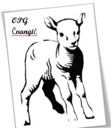
Slika 13. Figurativni žig Opg-a Čvangić

U cilju što učinkovitije promocije i komunikacije s kupcima planiramo brendirati proizvodnju i zaštititi figurativni žig. Prijava ž1 nalazi se u privitku.