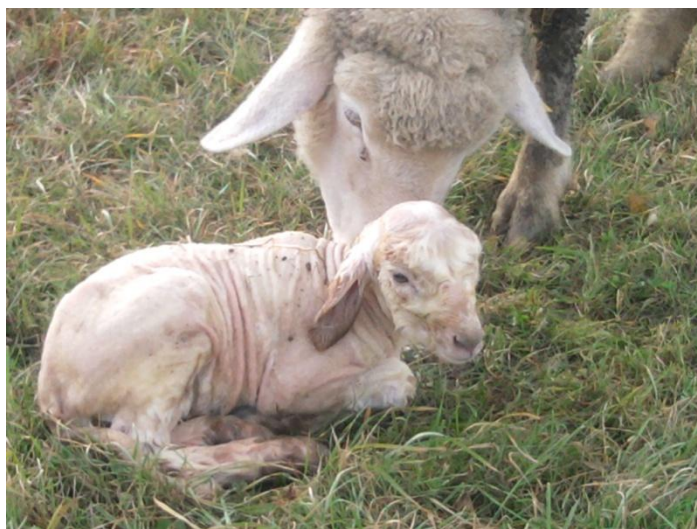
Slika 8. Netom ojanjeno janje

Ovčarstvo samo po sebi nije zahtjevan posao, ali zahtjeva puno pažnje. Kada krene janjenje potrebno je 24 satno prisustvo među ovcama da bi se na vrijeme moglo pomoći pri janjenju ako zatreba, te također pošto ovce ne razvrstavamo po boksovima prije janjenja, nego tek neposredno nakon janjenja potrebna je stalna prisutnost.