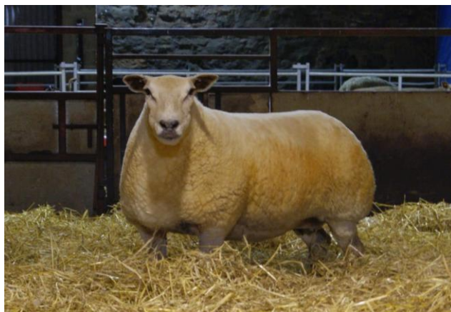
Slika 3. Charollais ovan