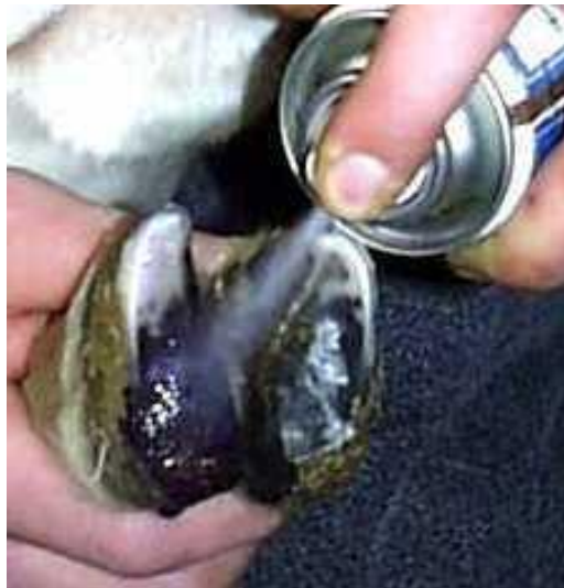
Slika 10. Dezinfekcija papka

Najjednostavniji način održavanja papaka zdravih je redovita, tj svakodnevna kontrola stada te vizualno treba uočiti koja ovca šepa te je uhvatiti i izvršiti dezinfekciju papka (Slika 10). Najjednostavnije je na izlazu iz ovčarnika postaviti dezinfekcijsku barijeru preko koje ovce prelaze svaki dan kada se vode na ispašu te tako dezinfekciju odrade same, ali to je ipak nešto skuplji način.