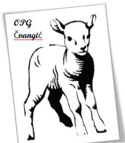
Slika 13. Figurativni žig Opg-a Čvangić

U cilju što učinkovitije promocije i komunikacije s kupcima planiramo brendirati proizvodnju i zaštititi figurativni žig. Prijava žl nalazi se u privitku.