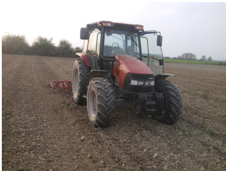
Slika 12. Priprema zemlje za sjetvu

Čišćenje se obavlja dvaput godišnje. Dio se čisti strojevima, a dio se obavlja ručno zbog ne mogućnosti ulaska strojeva u objekt. Čisti se pred zimu, tj. pred početak sezone janjenja, te se čisti nakon što se ovce prestanu hraniti i odbiju se od janjadi te vode na ispašu.