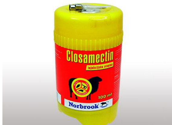
Slika 11. Cijepivo Closamectin

Od cijepiva koje koristim tu su Fascoverm i Closamectim (Slika 11.) koji se daju injekcijom potkožno, a imaju velik obujam djelovanja, a daje se u količini 1 ml na 25 kilograma tjelesne mase, te postoje cijepiva koja se daju peroralno kao što su Monil 5% i Valbazen 2.5%. Primjena kod Valbazena ili Monila ne ide odjednom, nego se daje u razmaku od 2 tjedna. Tada djelovanje bude učinkovito. Količina koja se daje iznosi 1 ml na 10 kg tjelesne mase.