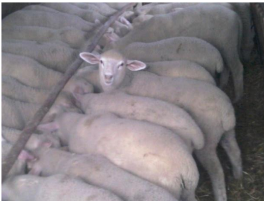
Slika 7. Gužva na jelu