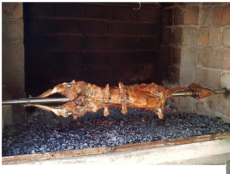
Slika 6. Janjetina na ražnju

Energetska vrijednost janječeg mesa iznosi oko 230 kcal, odnosno 961 kJ na 100 g. U 100 grama janječeg mesa nalazi se 65g vode, 15g masti, 18 g bjelančevina i 0g ugljikohidrata.