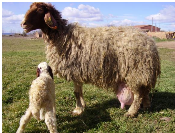
Slika 2. Awassi ovca sa janjetom

Specijalizacija proizvodnje je meso ili mlijeko. Vrlo popularna pasmina kod nas koja služi za proizvodnju mlijeka u ovom sustavu uzgoja je Awassi pasmina te na primjer Charollais pasmina koja je dobar „proizvođač“ mesa.