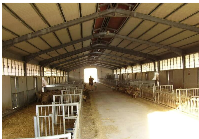
Slika 1. Suvremena staja za ovce

Objekti moraju biti funkcionalni da bi se osigurali normalni uvjeti proizvodnje u smještaju ovaca, zdravstvenoj kontroli, ishrani. Moraju biti izgrađeni od materijala koji će im osigurati što dulji vijek trajanja, a da istodobno ne budu skupi. Objekti moraju biti izgrađeni u blizini poljoprivrednih površina da bi se izbjegli prazni hodovi u pripremi i dovozu hrane.