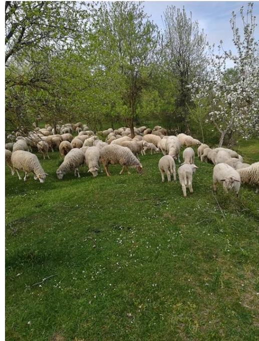
Slika 4. Ovce na paši