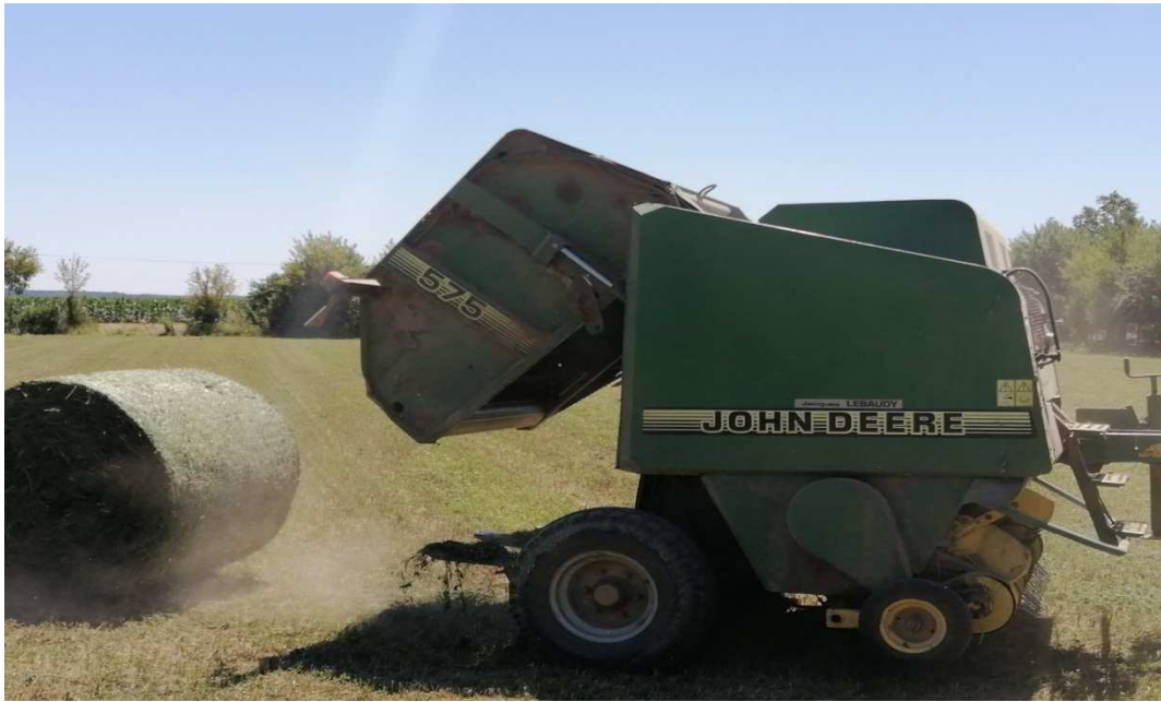
Slika 14: Preša za valjčaste bale. Foto: Marija Vidić (2020.)

U preši s komorom stalnog oblika ista od početka namatanja bale zadržava dimenzije gotove bale. Konačni promjer bale nije moguće mijenjati, a zbijenost, odnosno gustoća bale povećava se kako se komora puni navode Zimmer i sur. (2009.). Jezgra unutar bale je prozračna dok je vanjski dio zbijen da štiti od oborina. Vlaga kod ovakvih bala se tolerira do 15%.