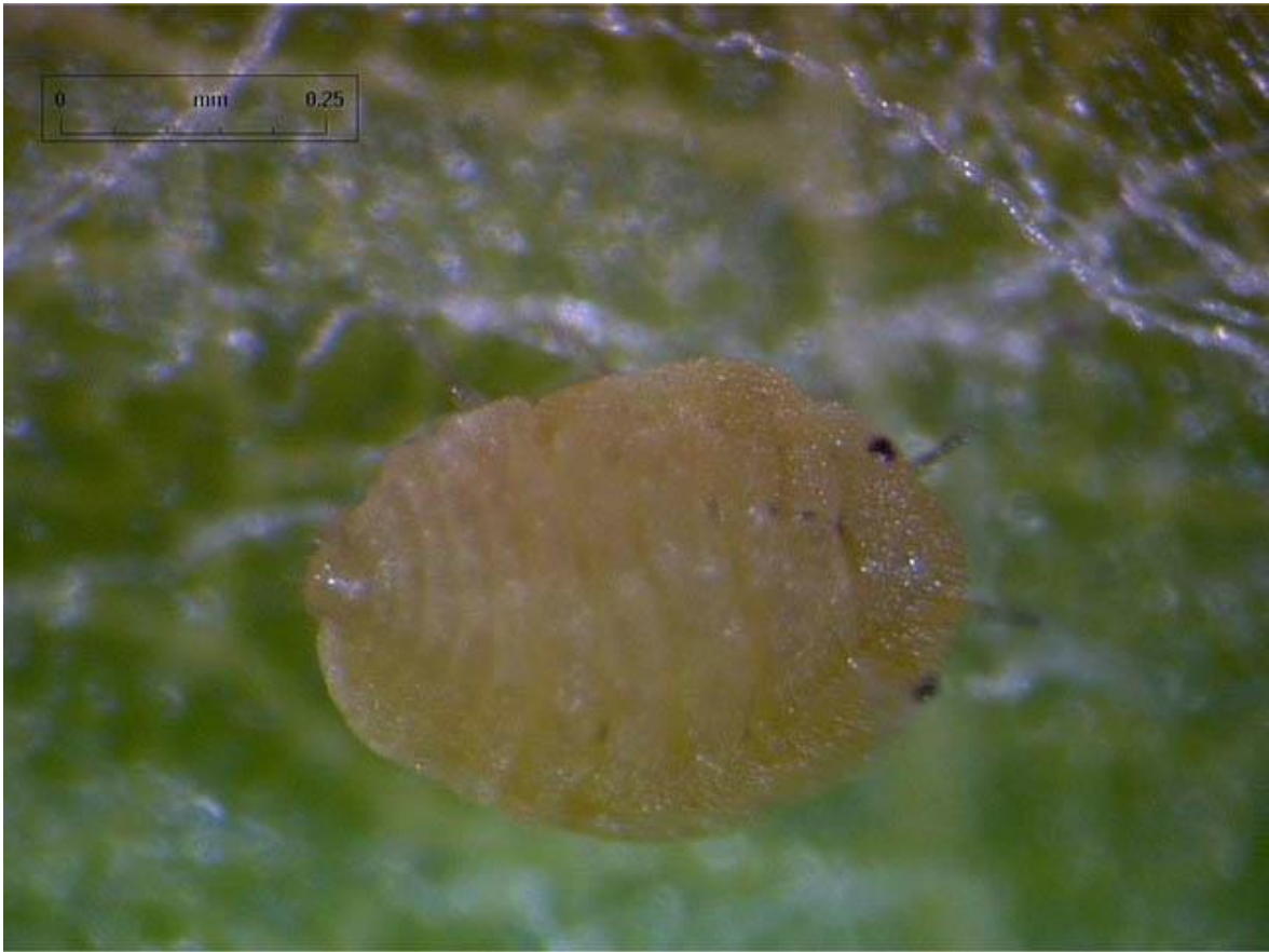
Slika 3. Trsni ušenac ( Daktulosphaira vitifoliae )