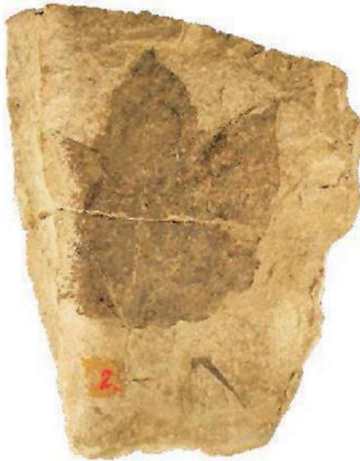
Slika 1. Fossil lista Vitis Teutonica , Radoboj