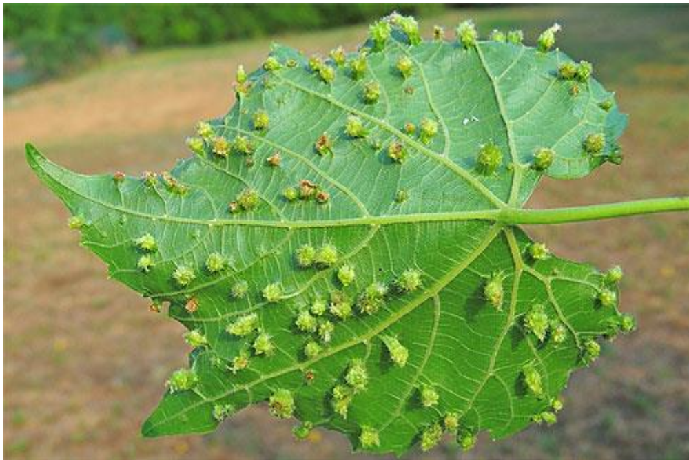
Slika 6. Naličje lista zaraženog filokserom ( Érsek, 2015.).