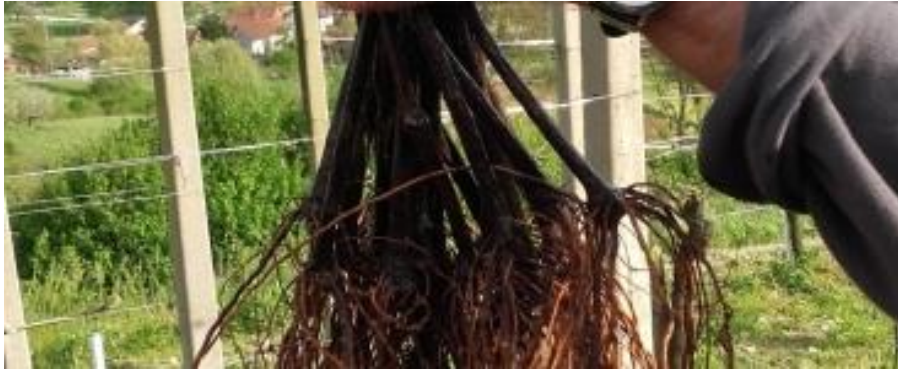
Slika 8. Lozni cijep

Cijepljene europske plemenite loze na podlogu je ustvari jedini racionalni način borbe protiv trsnog ušenca jer na korijenu američke loze ne čini štetu. Osim cijepljenja loze, vinogradari u želji da spase svoj vinograd pribjegli su očajnim mjerama poput plavljenja vinograda vodom. Korištenje insekticida na bazi cijanida koja su bila neizmjereno skupa također su bila jedna od mjera borbe protiv filoksere