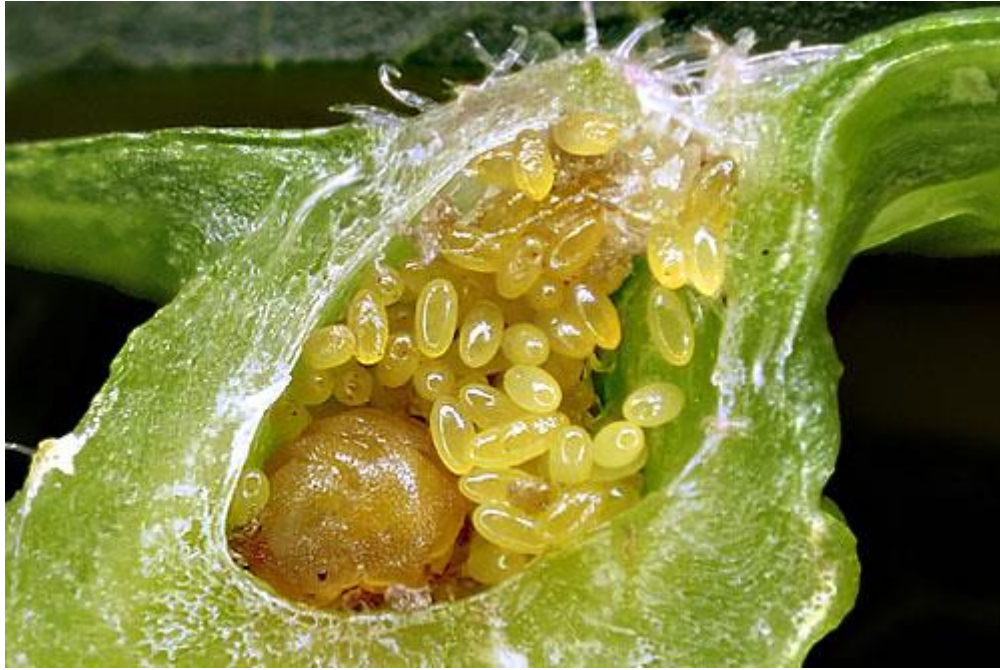
Slika 7. Ženka i jaja, (Érsek, 2015.)

Početak proljeća biljka počinje rasti i korijen počinje uzimati hranu za rast i razvoj. Trsni ušenac koji prezimi na trsu kreće izlaziti van nakon otvaranja lišća. Nakon hranjenja na lišću, oko insekta se počinju stvarati nabrekline. Formiranje nabrekline je posljedica reakcije biljke na hranjenje i prisutnost filoksera. Filoksera ne uzrokuje pojavu nabrekline. Čim filoksera postigne stadij zrelosti ona počinje rađati unutar te nabrekline. To potomstvo će se također krenuti hraniti lišćem i tvoriti nabrekline. Nekoliko generacija se mogu stvoriti na lišću. Neki listovi mogu pasti na zemlju i doseći do korijena. Jednom kada dođe do korijena, filoksera uzrokuje karakteristične korijenske nabrekline koje također mogu biti domaćin više generacija. Pred kraj godine krilati oblici napuštaju zemlju i polažu jajašca na vinovu lozu. Iz jajašaca se razvijaju u muške i ženske individue i dolazi do parenja. Svaka oplodena ženka polaže jedno jaje na trs vinove loze, koje prezimljuje da bi moglo nastaviti ciklus iduće godine. (Izvor: http://entoweb.okstate.edu/ddd/insects/grapephylloxera.htm ).