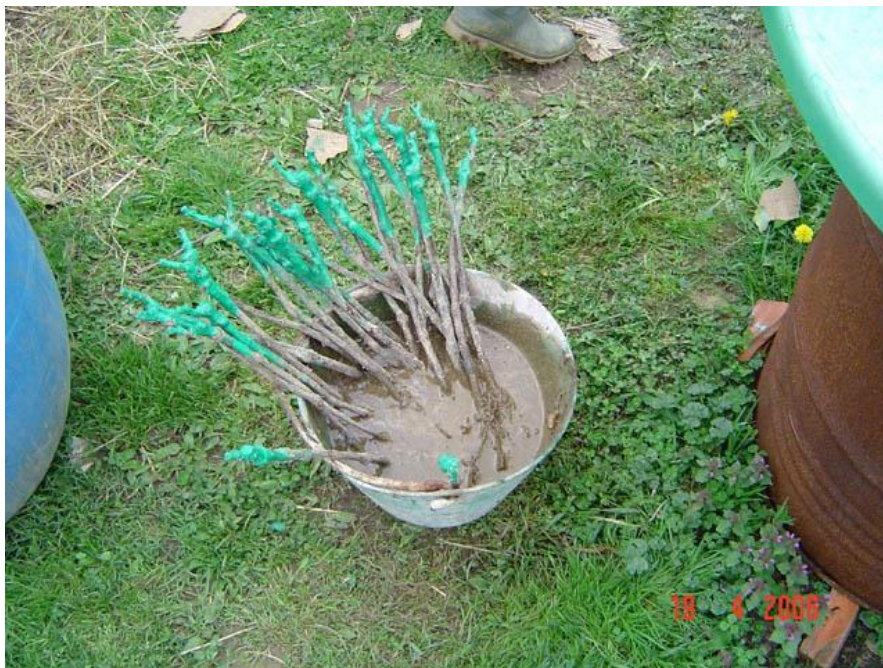
Slika 9. Priprema cijepa za sadnju

Cijepljene europske plemenite loze na podlogu je ustvari jedini racionalni način borbe protiv trsnog ušenca jer na korijenu američke loze ne čini štetu. Osim cijepljenja loze, vinogradari u želji da spase svoj vinograd pribjegli su očajnim mjerama poput plavljenja vinograda vodom. Korištenje insekticida na bazi cijanida koja su bila neizmjereno skupa također su bila jedna od mjera borbe protiv filoksere