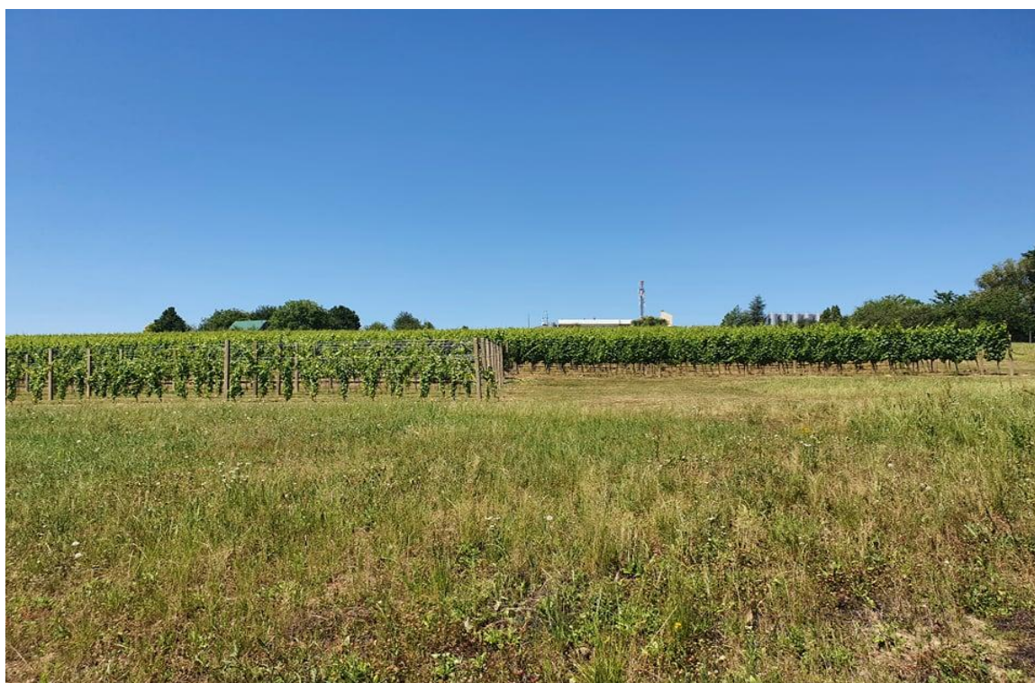
Slika 1. Mandićevac

Fakultetsko pokušalište Mandićevac (Slika 1.) na kojem je postavljen pokus za izradu ovog završnog rada nalazi se u vinogorju Đakovo na 208 m nadmorske visine i prostire se na 3,3 ha. Od 2012. godine je u vlasništvu Fakulteta agrobiotehničkih znanosti u Osijeku. U 2013. godini zasađeno je osam sorata preporučenih za istočnu Hrvatsku, a to su: Graševina, Traminac mirisavi, Rizling rajnski, Chardonnay, Sauvignon bijeli, Merlot, Cabernet sauvignon i Frankovka.