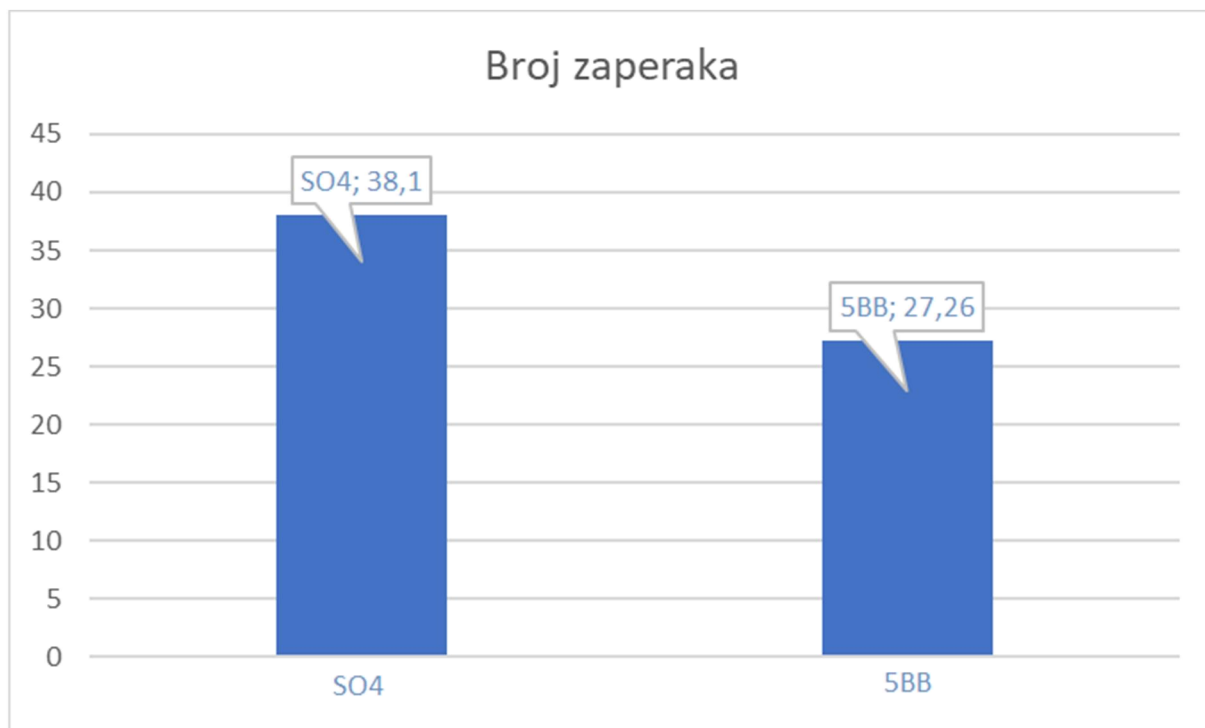
Grafikon 2. Broj zaperaka SO4 i 5BB

Kako bismo utvrdili utjecaj podloga na broj i masu zaperaka plemke napravljen je t test. Osnovna pretpostavka je da se dvije podloge (Kober 5BB i SO4) ne razlikuju između sebe u produkciji broja i mase zaperaka.