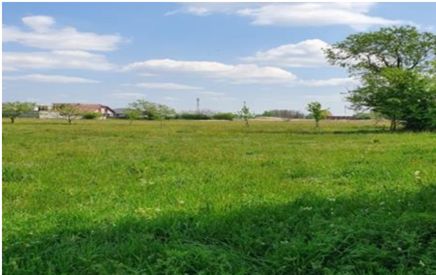
Slika 6. Prikaz trajnog pašnjaka

biljke. Problem se javlja ako pokosimo livadu na kojoj rastu štetne biljke bez da ih izdvojimo, tada može doći do trovanja konja.