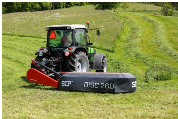
Slika 13. Pikaz roto kose SIP 260

Lucerna se proizvodi na oko jedan hektar za potrebe hranidbe konja najviše tijekom zimskog perioda. Intenzivno se iskorištava 3 godine. U prosjeku se kosi 5 puta godišnje u fazi početka cvatnje košnja se obavlja rotacijskom SIP kosom (slika 13.), a proizvodnja sijena je oko 17 tona godišnje. Sušenje se odvija na polju. Kod sušenja bitno je u pravo vrijeme pokupiti sjeno iz razloga što može doći do značajnih gubitaka (Tablica 9.). Razlog tome je što list puno brže gubi vlagu od stabljike te ako se presuši otpada. Prema Rotzu (1988.) gubitci prilikom sušenja sjena lucerne mogu biti preko 80 %. Najveći utjecaj na sušenje ima vlaga i temperatura. Lucerna se ne koristi u svježem stanju jer uzrokuje nadimanje, jedan od glavnih uzroka nadimanja su saponini.