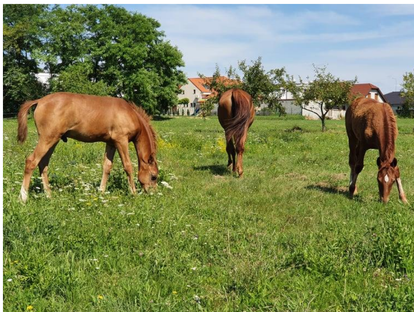
Slika 1. Ispaša konja na prirodnom travnjaku

U ovom radu opisati će se važnost krmiva u hranidbi konja, te njihove potrebe ovisno o dobi konja (ždrijebe, odrasli konj i gravidna kobila) i o namjeni konja (sportski konj, radni konj i konj za rekreativno jahanje). Ukratko će se opisati značajke konja kao životinje te njihov značaj kroz povijest i danas. Navest će se tehnike iskorištavanja i pripreme krmiva te ih opisati (ispaša, silaža, sjenaža, sjeno). Također će se iznijeti plan hranidbe za vlastite konje istraživanog subjekta te proizvodnja i način iskorištavanja krme s vlastitih poljoprivrednih površina. Ujedno će se navesti prednosti kontinuirane ispaše kroz godinu, te prednosti i mane prirodnih travnjaka za ispašu. Podatke dobivene iz literature usporedit će se podacima s istraživanog gospodarstva te će se utvrditi postoje li razlike u dnevnoj konzumaciji, preporučenom sadržaju hranjiva, te koje su kulture najbolje, i u kojoj fazi, za hranidbu konja. Ujedno je bitan i sadržaj suhe tvari te njihov nutritivni sastav (odnos bjelančevina, ugljikohidrati-vlakna, masti i pepela) s stvarnim sadržajem. I ako je to moguće optimizirati ishranu konja prema preporukama struke. Ovaj rad autorici znači mnogo jer obuhvaća njenu najveću ljubav, a to je uzgoj i rad s konjima. (Slika 1.)