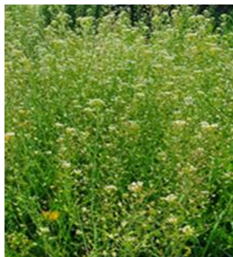
Slika 8. Rusomača