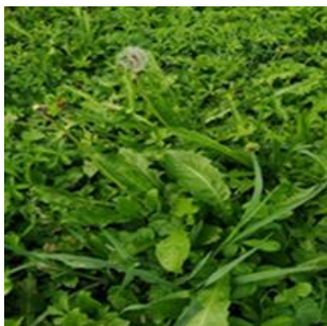
Slika 9. Uskolisni trputac (Izvor: Mesarić,2020.) Slika 10. Maslačak (Izvor: Mesarić,2020.)