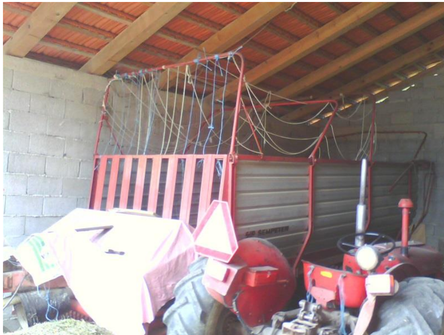
Slika 5. Prikaz samoutovarne prikolice i traktora

Obitelj Mesarić ima više od 50 godina iskustva u uzgoju i dresiranju konja. Sve je započeo autoričin pradjed, Luka Mesarić, koji je koristio konje za rad u polju i šumi. Tu strast prenio je na autoričinog oca. Autoričin otac Ivan Mesarić bavio se preponskim jahanjem te je bio poslovođa u uzgajalištu konja u Križevcima. Danas se bavi uzgojem i dresurom konja na vlastitom gospodarstvu. Ljubav prema konjima prenesena je i na autoricu. Istraživano gospodarstvo trenutačno uzgaja 12 grla. Od gospodarskih objekata tu je koral površine 0.2 hektara, staje kapaciteta 30 grla, silos kapaciteta 10 tona te prostor za skladištenje sijena kapaciteta 2000 bala. Od strojeva gospodarstvo raspolaže s jednim traktorom (IMT 539), 2 samoutovarne prikolice (SIP) i 1 rotokosa. (slika 5.)