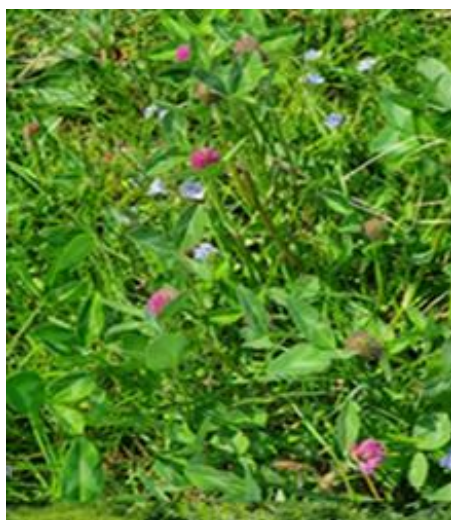
Slika 7. Crvena djetelina