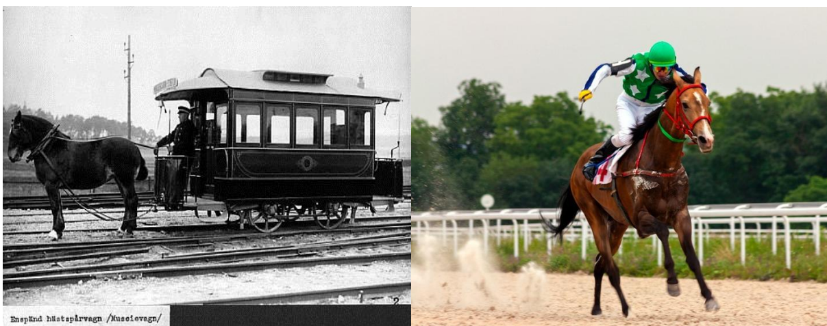
Slike 3. i 4. Prikaz konjske zaprege i sportskog konja

Rekreacijski konj služi u amaterske svrhe njihovim uzgajivačima, oni se najčešće uzgajaju iz ljubavi prema konjima i konjogojstvu, za njih nisu najvažnije vrhunske performanse i savršena građa kao kod sportskih konja. Ova skupina je najbrojnija.