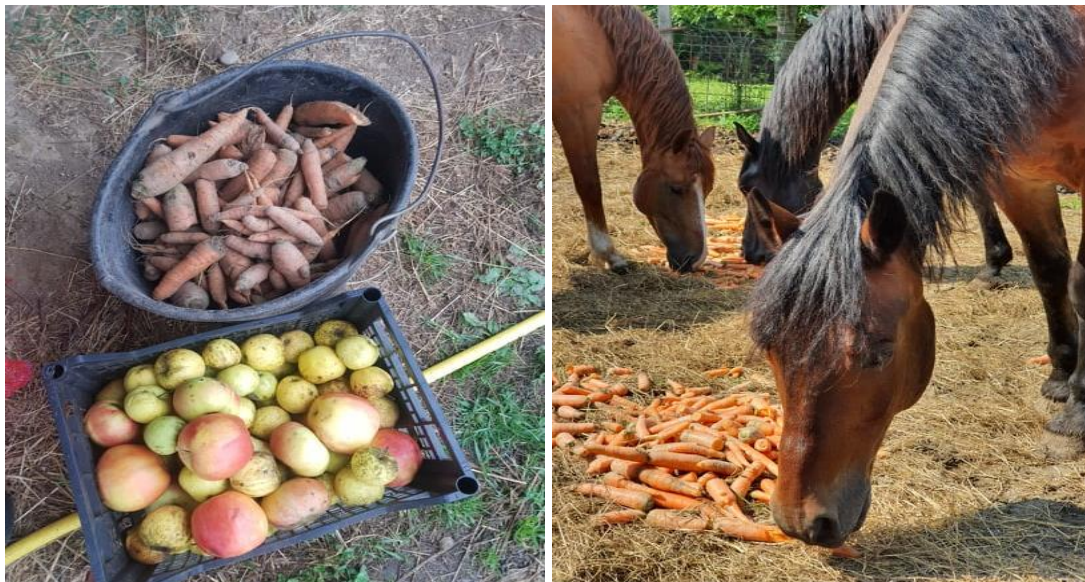
Slika 11. Stočna mrkva i jabuke (Izvor: Mesarić,2020.) Slika 12. Stočna mrkva (Izvor: Mesarić,2020.)

Konji dok su na pašnjacima imaju ponudu ispaše veću od moguće konzumacije i stoga je konzumacija po grlu nešto veća, kao i mogućnosti biranja. Po zimi kad nisu na ispaši daje im se oko 2.5 % od tjelesne mase dnevni obrok koji uključuje sjeno lucerne i koncentrirana krmiva (zob ili kukuruz). Ždrjebadi i dojnim kobilama daje se nešto više krme (oko 3% tjelesne mase). Kroz vegetacijski period konji su na ispaši te se ne prihranjuju koncentriranim krmivima i sjenom. Ako uzmemo da svako grlo ima 400 kg to znači da 12 grla ima ukupnu masu 4800 kg. Ako uzmemo dnevnu ponudu krmiva od 3% to je dnevna ponuda 144 kg što godišnje iznosi 47 t suhe tvari. U prosjeku se proizvede na gospodarstvu oko 47 tona suhe tvari raznih krmiva. Manjak kroz zimski i jesenski period nadoknađuje se većinom mrkvom, voćem (slika 11.i 12.) te ostalim krmivima.