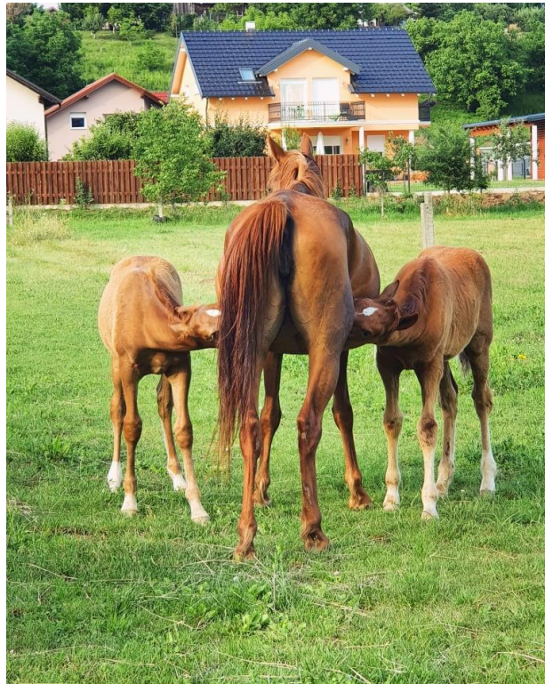
Slika 14. Prikaz sisanja ždrebadi

Prosječan dnevni prirast ždrebadi na sisi (slika 7.) kreće se od 1, 2 do 2,7 kg dnevno. Ždrijebe kad se oždrijebi ima 10% težine odraslog konja, nakon šest mjeseci ima 46% težine odraslog konja. Na istraživanom gospodarstvu, u prosjeku se kobile ždrijebe jedan put u 2 godine. Konji se koriste za rekreativno jahanje svaki vikend, kada pokazuju dobru sposobnost savladavanja dužih, srednjih i kraćih ruta po manje ili više zahtjevnim terenima i pod lakšim, srednjim i težim jahačima, što sve upućuje na dobru kondiciju konja, koja proizlazi iz prikladne hranidbene prakse i kvalitetnog i redovitog treninga konja. Na terenskim jahanjima konji prosječno prođu oko 15 do 20 km dnevno. Jačina kostiju zavisi primarno od hranidbe, ali trening također ima efekt na rast i jačinu. Svaki trening se provodi tako da se konj na početku zagrije, zatim traje trening u jahalištu ili na terenu, te šetnja da se konj rashladi i opusti mišiće. Većina konja je već niz godina u radu i pogodni su za djecu početnike, uz 4 mlada grla koji su u redovitom treningu ujahivanja. Zaključak je da adekvatna hranidba nije dovoljna bez pravilnog treninga.