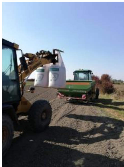
Slika 2. Rasipač mineralnog gnojiva