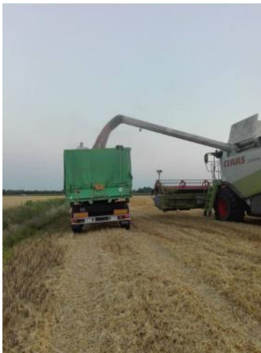
Slika 5. Žetva pšenice i pretovar zrna (Majić, N.)

U vegetacijskoj sezoni 2018./2019. na proizvodnju pšenice iznimno je utjecala sušna jesen. Ostvareni prinos u 2019. godini iznosio je 6,5 t/ha što je i više nego zadovoljavajuće s obzirom na prosjek u Republici Hrvatskoj za tu godinu koji je iznosio 5,4 t/ha ( www.dzs.hr ).