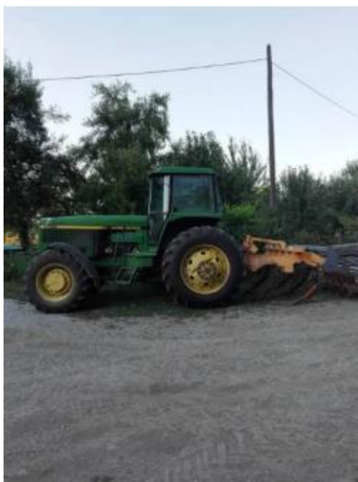
Slika 1. Multitiller

Neizostavan dio svakog OPG-a je i poljoprivredna mehanizacija koja se koristi pri obradi i pripremi tla za sjetvu te prilikom njege usjeva. OPG jedino nema vlastiti kombajn već uvijek u vrijeme žetve unajmljuje stroj od drugih poljoprivrednih gospodarstava. Od mehanizacije treba istaknut kako OPG ima čak 5 traktora različite starosti i radne snage. U tablici 3. je prikazana mehanizacija obiteljskog poljoprivrednog gospodarstva koja se koristi u proizvodnji.