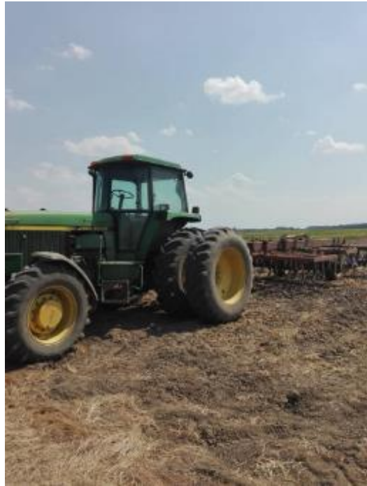
Slika 3. Podrivanje tla (Majić, N.)

količini od 150 kg/ha. U vegetacijskoj godini 2018./2019. prihrana je obavljena tijekom vegetacije u fazi busanja sa KAN-om u količini od 150 kg. KAN predstavlja jednostavno mineralno gnojivo koje sadrži 27% dušika koje je pogodno za prihranu i sadrži pola dušika u amonijskom, a pola u nitratnom obliku, pa djeluje brzo i nešto produženo. Druga prihrana je obavljena u fazi početka vlatanja u količini od 150 kg/ha KAN-a.