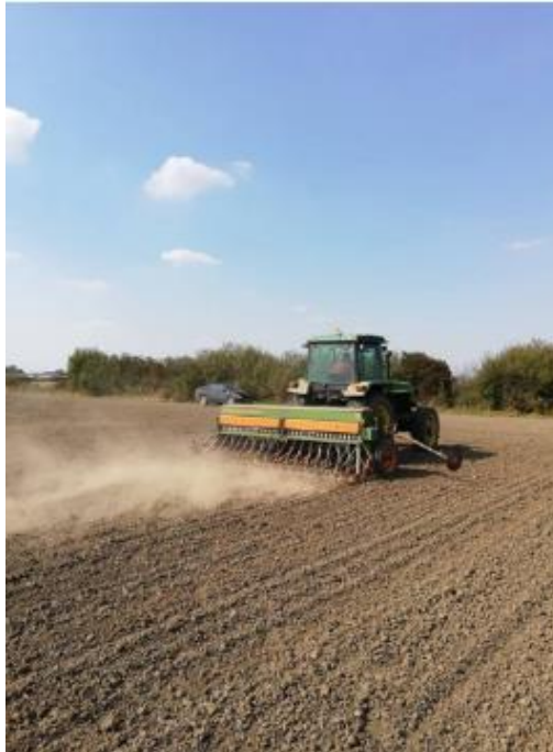
Slika 4. Sijačica u sjetvi (Majić, N.)

poboljšivača što znači da postiže relativno visoke sadržaje proteina. Dubina sjetve je iznosila oko 4 cm, a po hektaru je bilo potrebno oko 300 kg.