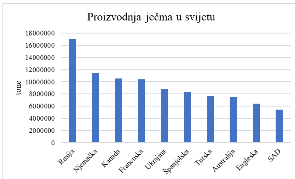
Grafikon 2. Najveći proizvođači ječma u svijetu u 2018. godini

Prema FAOSTAT-u u Republici Hrvatskoj ječam se 2018. godine uzgajao na oko 50 988 ha uz ostvaren prinos od 4,46 t/ha i proizvodnju od 227 520 tona.