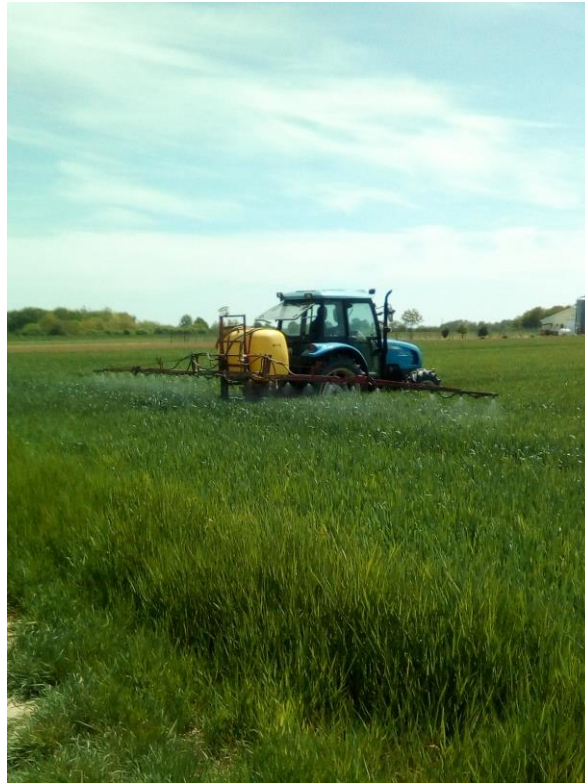
Slika 12. Tretiranje pšenice protiv bolesti