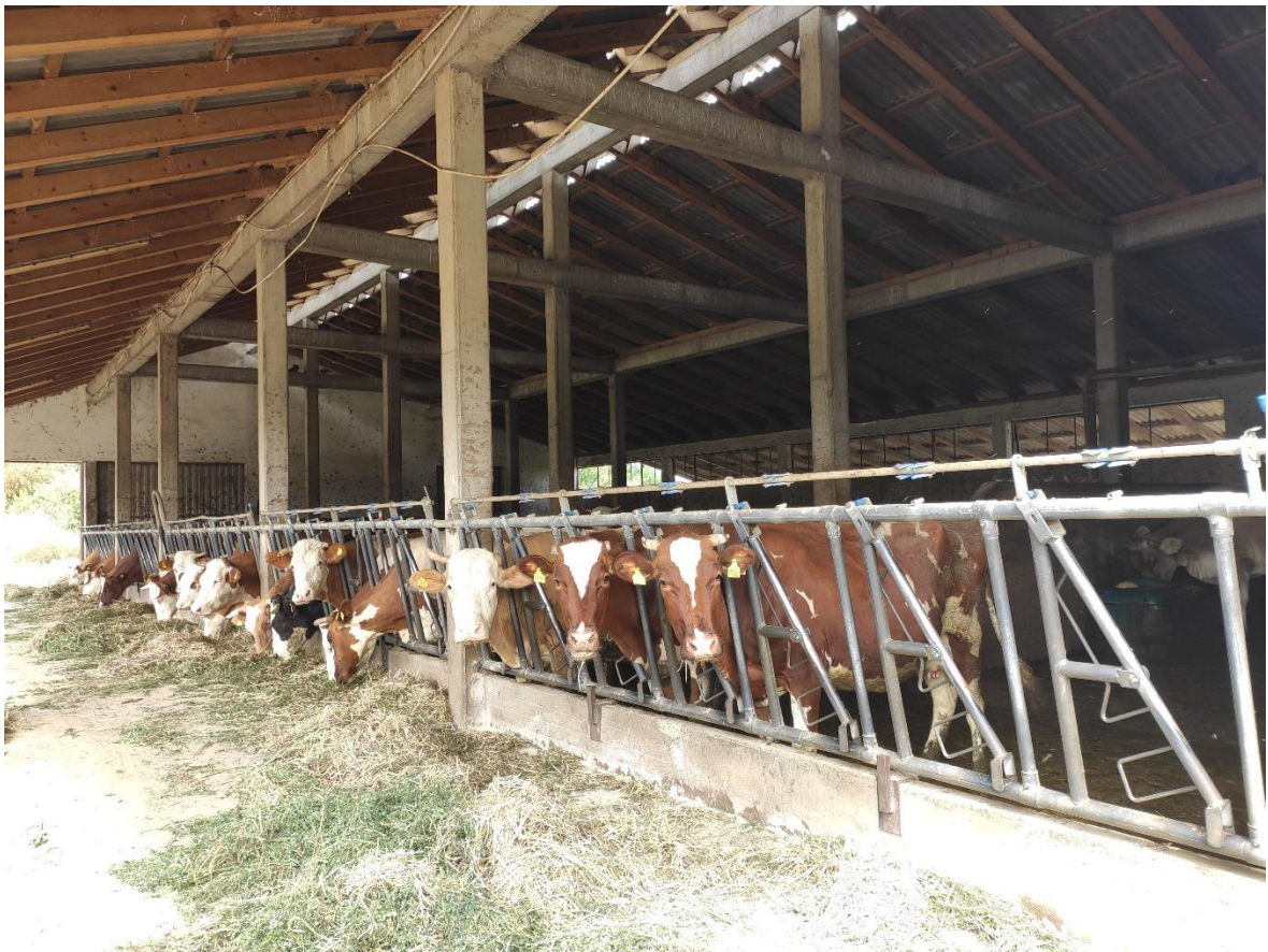
Slika 9. Staja na obiteljskom gospodarstvu

Primarna djelatnost gospodarstva je stočarstvo, odnosno proizvodnja mlijeka te uzgoj nesilica i svinja za vlastite potrebe. Sekundarna djelatnost je ratarstvo, kulture koje uzgajaju su za potrebe ishrane stoke.