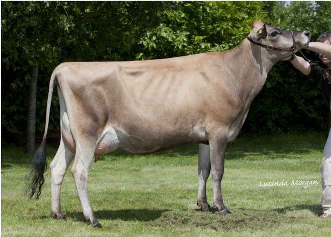
Slika 6. Elitna krava jersey pasmine

Kralik i sur. (2011.) navode da je Jersey pasmina goveda plemenita, kasno zrela, profinjene konstitucije i malog okvira. Odrasla krava je prosječne tjelesne mase oko 450 kg. Nadalje, proizvodni kapacitet iznosi 4 000 do 4 500 kg s 5 - 6 % mliječnih masti te oko 3,8 % proteina. Proizvodnja mesa je izrazito slaba. Jersey pasmina se upotrebljava za križanje s drugim pasminama u cilju popravljivanja sadržaja masti u mlijeku (Kralik i sur., 2011.).