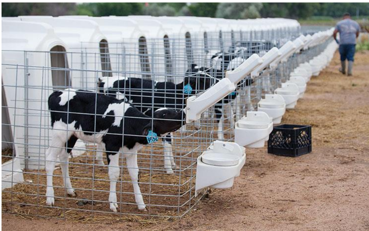
Slika 2. Prikaz hranidbe teladi

Cijela govedarska proizvodnja ovisi o uzgoju teladi. Tele nakon teljenja treba očistiti, dati kravi da ga oliže i nahraniti ga kako bi unio kolostrum u organizam. Kolostrum je prvo mlijeko koje krava proizvede nakon zasušivanja, ono sadrži veći postotak suhe tvari s visokim sadržajem proteina i imunoglobina kako bi se stvorio pasivni imunitet kod teladi. Vrlo važno je poznavati fiziologiju probave teladi. Telad nakon rođenja treba hraniti s tekućom hranom, također je bitno i uvođenje krute hrane. Rađaju se kao nepreživači s jako razvijenim sirištem i vrlo je bitno da krutom hranom što prije potaknemo razvoj predželudca.