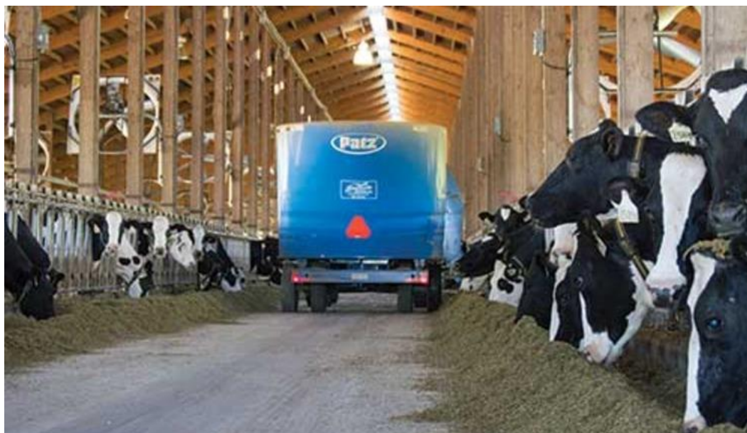
Slika 1. Prikaz hranidbe na mliječnoj farmi

Koncentriranim krmivima nadopunjuje se potreba za proteinima i energijom. Koncentrirana krmiva predstavljaju osnovu za visoku proizvodnju mlijeka. Udjel koncentriranih krmiva u suhoj tvari obroka iznosi od 60 do 70%. Ugljikohidratna krmiva koja koristimo u ishrani dolaze od kukuruza, ječma, zobi, pšenice i ostalih žitarica, te protein koje dobivaju od sojina zrna i sačme, suncokretovog zrna, stočnog graška i drugih kultura. U ishranu mogu se dodavati još i industrijski nusproizvodi poput melase, repinih rezanaca, repine pogače, pivskog tropa koji su vrlo ukusni i zdravi, te povećavaju dnevnu proizvodnju mlijeka kao i udio mliječnih masti.