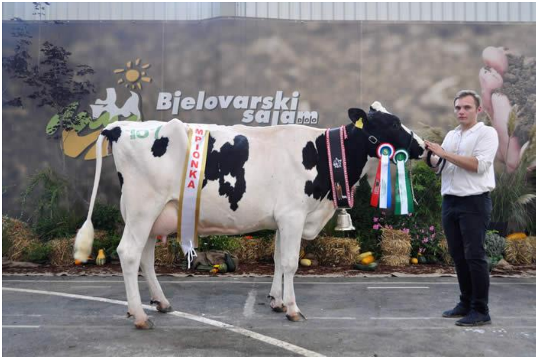
Slika 4. Krava holstein pasmine na Bjelovarskom sajmu