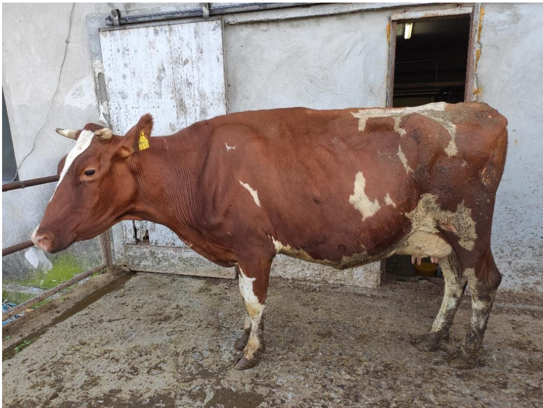
Slika 5. Krava pasmine crveni holstein na obiteljskom gospodarstvu