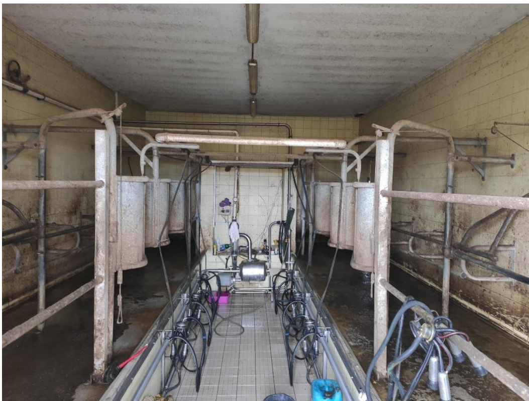
Slika 11. Izmuzište na obiteljskom gospodarstvu

Mlijeko se svakoga mjeseca provjerava od strane Hrvatske poljoprivredne agencije. Uzorkovanje se obavlja dva puta mjesečno kada nadležna osoba dolazi na posjed te uzima mlijeko iz laktofriza od svih krava i skladišti u sterilnu bočicu s čepom. U skupnom uzorkovanju prikazuje se broj somatskih stanica, broj mikroorganizama, mliječne masti, ureu u mlijeku, i drugo. Postoje i pojedinačni uzorci kada se uzorak uzima od svake krave pojedinačno. Kod pojedinačnog uzorkovanja bilježi se vrijeme muže i količina pomuženog mlijeka. Na taj način utvrđuje se kvaliteta mlijeka, kao i cijena koja ovisi o grupi kojoj mlijeko pripada.