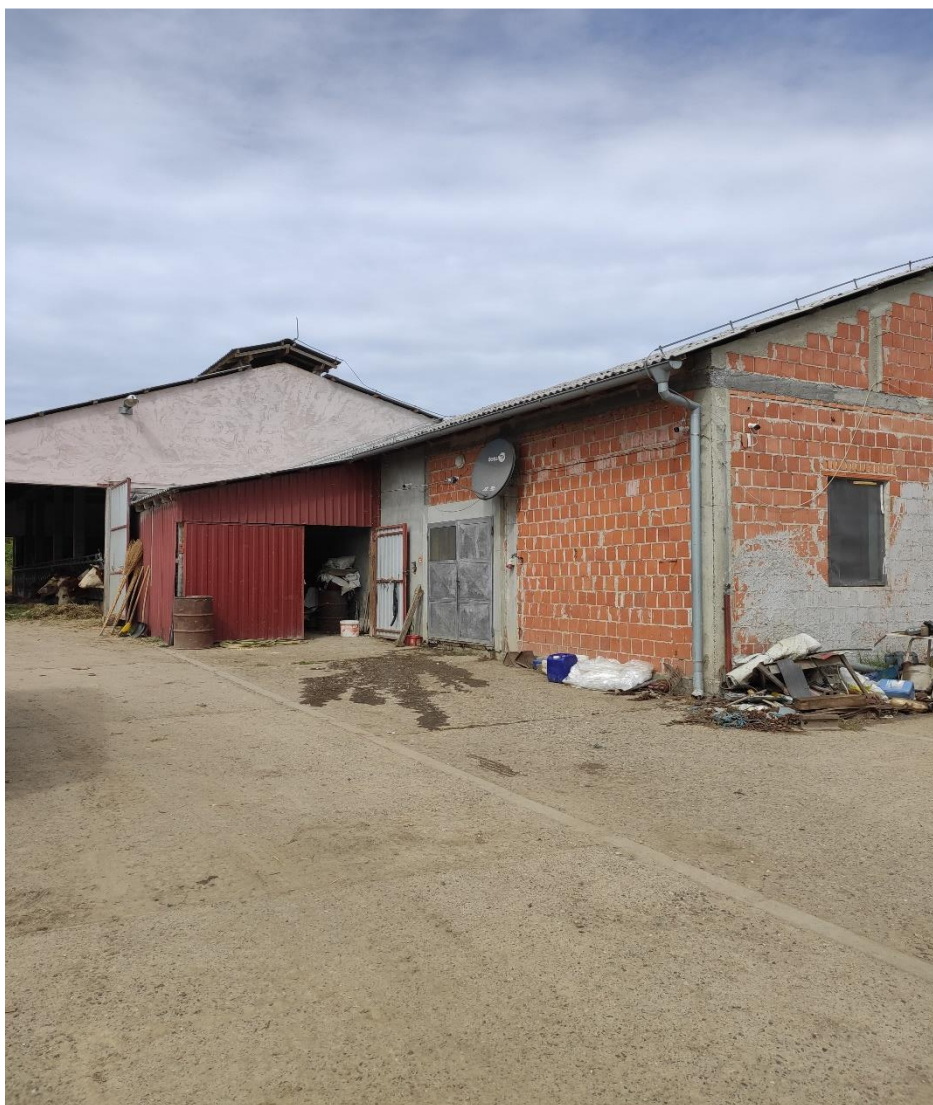
Slika 8. Obiteljsko poljoprivredno gospodarstvo - farma Segedi

Poljoprivredno gospodarstvo je samostalna gospodarska i socijalna jedinica, a čine ju svi punoljetni članovi kućanstva. Nositelj gospodarstva je fizička osoba koja se bavi poljoprivrednim djelatnostima te posjeduje potrebne vještine i znanje. Nositelj je punoljetna osoba koja radi stalno ili povremeno na gospodarstvu i odgovorna je za njegovo poslovanje.