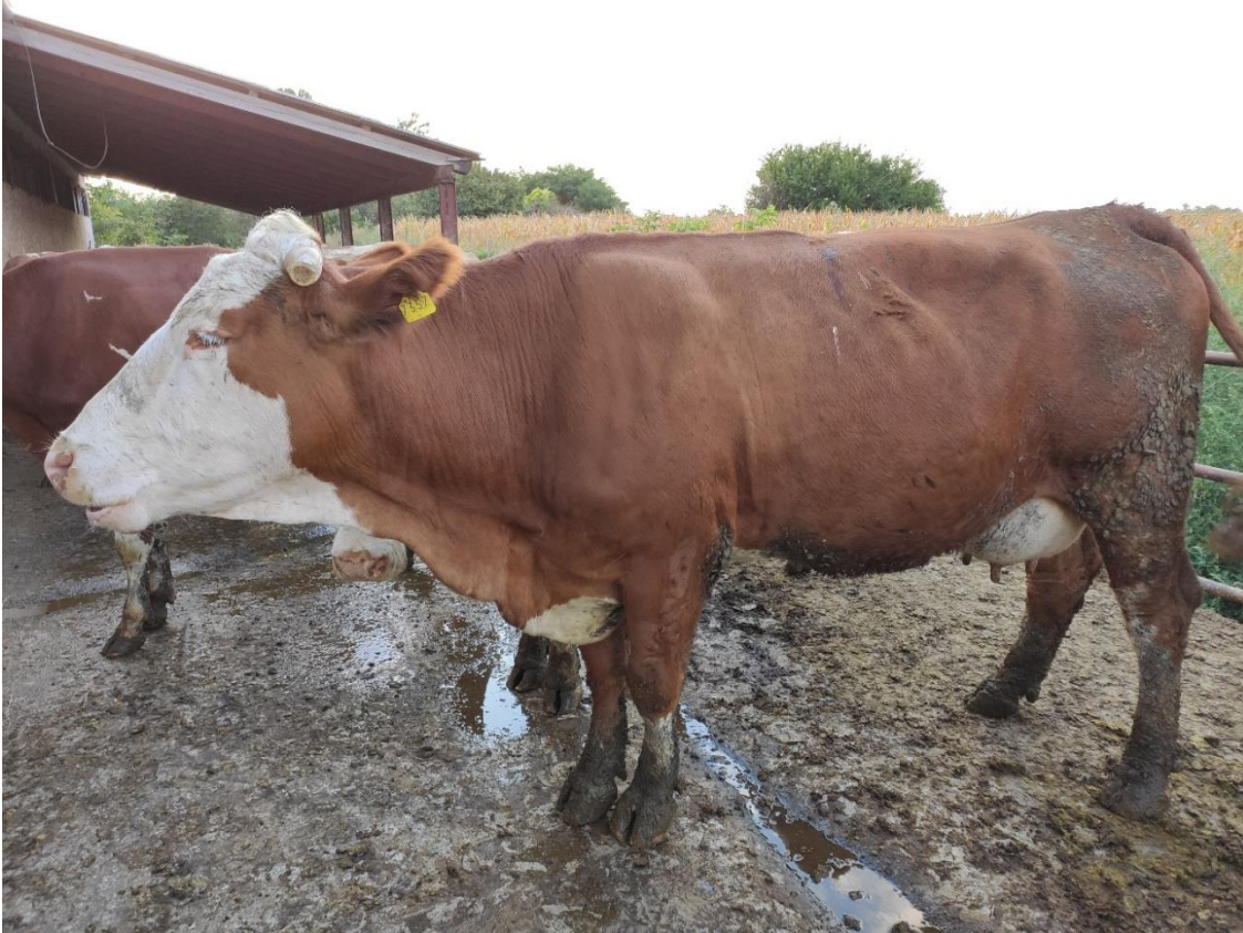
Slika 7. Krava simentalke pasmine na obiteljskom gospodarstvu

Laktacija traje 305 dana te proizvede 4 618 kg s 4,0 % mliječne mast i 3,35% proteina. Prosječna godišnja proizvodnja po kravi iznosi 4 000 do 5 000 kg, s 3,9 do 4,0 % mliječne mast i 3,6 do 3,7% proteina (Uremović, 2004.).