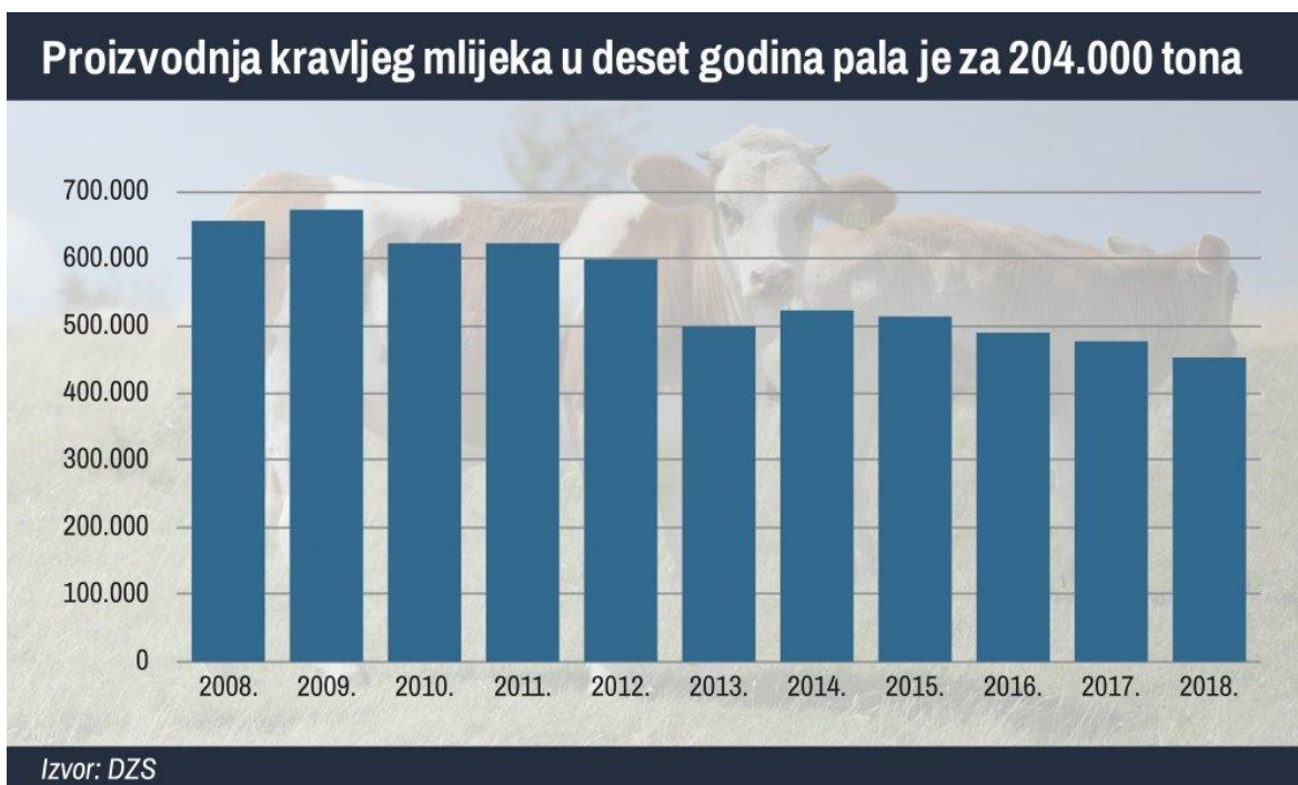
Grafikon 2. Prikaz proizvodnje kravljeg mlijeka u Hrvatskoj u periodu od 2008. – 2018. godine (Sušac, 2019.)

Mliječno govedarstvo podrazumijeva maksimalno iskorištavanje kapaciteta krave za proizvodnju mlijeka. Visokoproizvodna grla, dnevna proizvodnja do 50 kg mlijeka, izuzetno su opterećena, te sklonija obolijevanju i bolesti. Ovako visoka proizvodnja zahtijeva izvrsno izbalansiran obrok (najkvalitetnija voluminozna krma uz dodatak koncentrata) te kvalitetnu njegu i smještaj. Proizvodni vijek visokomliječnih goveda je relativno kratak (3 do 4 godine). Kratak proizvodni vijek posljedica je frekventnijeg izlučivanja grla iz stada uslijed reproduktivnih poremećaja, neplodnosti, smanjene proizvodnje, mastitisa te drugih oboljenja. S obzirom na kratak proizvodni život, remont stada je visok, 25 do 40 % godišnje, pa se gotovo sva zdrava ženska grla ostavljaju za rasplod (Kralik i sur., 2011.)