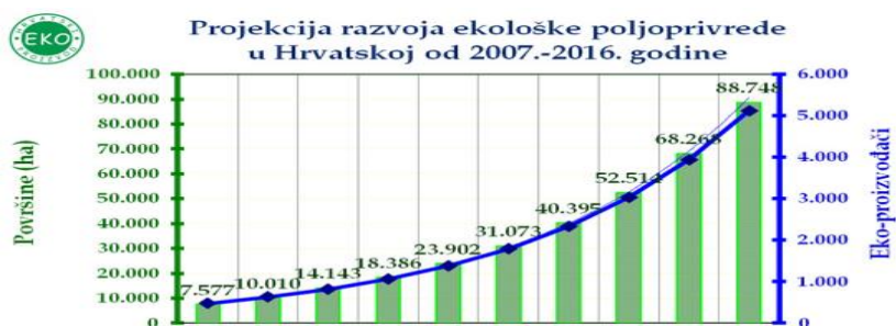
Slika 5. Projekcija razvoja ekološke poljoprivrede u Hrvatskoj od 2007. - 2016. godine

Zajedničkom poljoprivrednom politikom (ZPP) je utvrđen opći okvir za razvoj poljoprivrede u EU za razdoblje 2014. – 2020. Cilj je novih odredaba uspostaviti održivu konkurentnost kako bi se postigao gospodarski održiv sektor proizvodnje hrane te održivo gospodarenje prirodnim resursima EU u kojemu je ekološka proizvodnja prepoznata kao ključan element. U ovom se programskom razdoblju pridaje još veći značaj okolišu i utjecaju poljoprivrede na okoliš. Ekološka poljoprivreda je izdvojena iz mjere agro-okoliš kao zasebna mjera čime se dodatno naglasio njezin povoljni utjecaj na okoliš. U sklopu Programa ruralnog razvoja potpora se daje ekološkim proizvođačima koji tek ulaze u sustav ekološke proizvodnje kao i onima koji nastavljaju ovaj vid proizvodnje (ruralnirazvoj.hr, 2020).