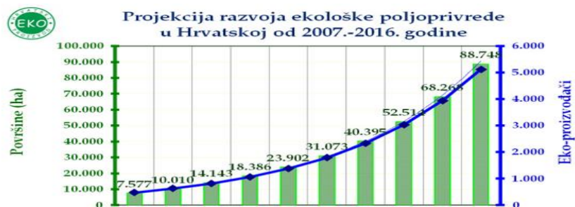
Slika 5. Projekcija razvoja ekološke poljoprivrede u Hrvatskoj od 2007. - 2016. godine

Zajedničkom poljoprivrednom politikom (ZPP) je utvrđen opći okvir za razvoj poljoprivrede u EU za razdoblje 2014. – 2020. Cilj je novih odredaba uspostaviti održivu konkurentnost kako bi se postigao gospodarski održiv sektor proizvodnje hrane te održivo gospodarenje prirodnim resursima EU u kojemu je ekološka proizvodnja prepoznata kao ključan element. U ovom se programskom razdoblju pridaje još veći značaj okolišu i utjecaju poljoprivrede na okoliš. Ekološka poljoprivreda je izdvojena iz mjere agro-okoliš kao zasebna mjera čime se dodatno naglasio njezin povoljni utjecaj na okoliš. U sklopu Programa ruralnog razvoja potpora se daje ekološkim proizvođačima koji tek ulaze u sustav ekološke proizvodnje kao i onima koji nastavljaju ovaj vid proizvodnje (ruralnirazvoj.hr, 2020).