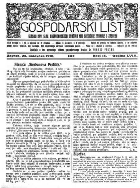
Slika 1. Gospodarski list iz 1943. godine

U 19. stoljeću poljoprivredna proizvodnja Hrvatske prisutna je na međunarodnom tržištu, a sva zbivanja na tržištu imala su i posljedice na našu proizvodnju. Prva agrarna kriza javlja se oko 1830. godine u trgovini žitom, a uzrok je bio u sve većoj konkurenciji jeftinijeg ruskog žita. Mnogo veću važnost imala je velika europska agrarna kriza u zadnjoj četvrtini 19. stoljeća. Uzrok je bila konkurencija jeftinog američkog žita koje je u sve većim količinama dolazilo na tržište. To je dovelo do pada cijene žitarica, a zatim do velikog smanjenja prihoda seljaka. Druga velika kriza počela je 1926. te dolazi do pada cijene žita, a između 1925. i 1930. cijene agrarnih proizvoda padaju za 50 % što opet najjače pogađa male seljake. U Hrvatskoj poljoprivredi 19. stoljeća prevladava sitno gospodarstvo (Defilippis, 2005.).