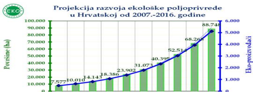
Slika 5. Projekcija razvoja ekološke poljoprivrede u Hrvatskoj od 2007. - 2016. godine Izvor: ruralnirazvoj.hr, 2020.

Zajedničkom poljoprivrednom politikom (ZPP) je utvrđen opći okvir za razvoj poljoprivrede u EU za razdoblje 2014. – 2020. Cilj je novih odredaba uspostaviti održivu konkurentnost kako bi se postigao gospodarski održiv sektor proizvodnje hrane te održivo gospodarenje prirodnim resursima EU u kojemu je ekološka proizvodnja prepoznata kao ključan element. U ovom se programskom razdoblju pridaje još veći značaj okolišu i utjecaju poljoprivrede na okoliš. Ekološka poljoprivreda je izdvojena iz mjere agro-okoliš kao zasebna mjera čime se dodatno naglasio njezin povoljni utjecaj na okoliš. U sklopu Programa ruralnog razvoja potpora se daje ekološkim proizvođačima koji tek ulaze u sustav ekološke proizvodnje kao i onima koji nastavljaju ovaj vid proizvodnje (ruralnirazvoj.hr, 2020).