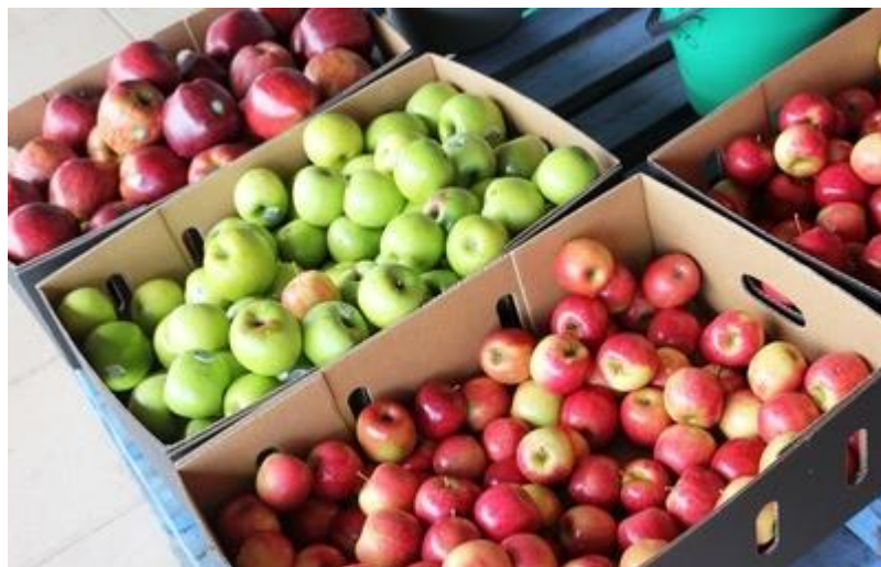
Slika 2. Metoda čuvanja u kutiji

Nakon branja zrelog ploda, kako bi proizvod očuvao kvalitetu u što dužem vremenskom razdoblju, treba ga korektno uskladištiti. Pri optimalnoj temperaturi i vlažnosti u skladištu esencijalan je sadržaj kalcija, a u slučaju nedostatka kalcija proizvod i pri zadovoljenim skladišnim uvjetima propada. Kako bismo to spriječili plodove trebamo potopiti u kalcijem bogatu otopinu koja uklanja tvari koje uzrokuju kvarenje jabuke (vinogradarstvo.com, 2020.).