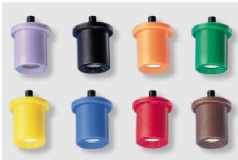
Slika 7. Mlaznice ( www.unikomerc-uvoz.hr )