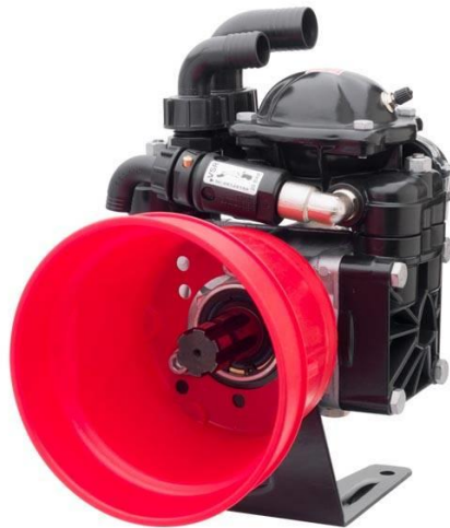
Slika 4. Klipno membranska crpka

Klipno membranska crpka, kao najvažniji dio svakog raspršivača, služi za postizanje potrebnog tlaka škropiva koji je prijeko potreban kako bi stroj mogao raditi. Ta crpka uzima tekućinu iz spremnika i raspodjeljuje je u dva toka. U primarnom toku škropivo se vodovima kreće iz spremnika prema regulatoru i tamo se dijeli u dva sustava. Prvi, primarni, sustav dovodi škropivo do mlaznica, a drugi, sekundarni, sustav vraća škropivo u spremnik te prilikom toga miješa tekućinu u spremniku (miješa vodu i zaštitno sredstvo u spremniku kako bi uvijek bile ujednačene koncentracije škropiva). Prilikom korištenja raspršivača potrebno je izvršavati redovnu kontrolu crpke te redovno kontrolirati razinu ulja i prema potrebi ga nadodati. Također, potrebno je kontrolirati tlak zraka u zračnoj komori crpke (koji mora iznositi 1/10 radnog tlaka) u protivnom će vodeni mlaz biti neravnomjerno raspoređen. Crpka bi izvana treba biti čista i suha, tj. svi tragovi ulja ili tekućine upućuju na loše brtvljenje određenih dijelova ili spojnih cijevi te je potrebno zabrtviti određeni dio ili zamijeniti cijev. Crpka ima tihi rad (gotovo da se ne čuje), stoga svaki bučan rad upućuje ili na nedostatak ulja ili na kvar crpke. Ako se u škropivu prilikom rada raspršivača nađu tragovi ulja potrebna je hitna zamjena membrana crpke zbog napuknuća ili oštećenja iste (Mikulić, 2016.).