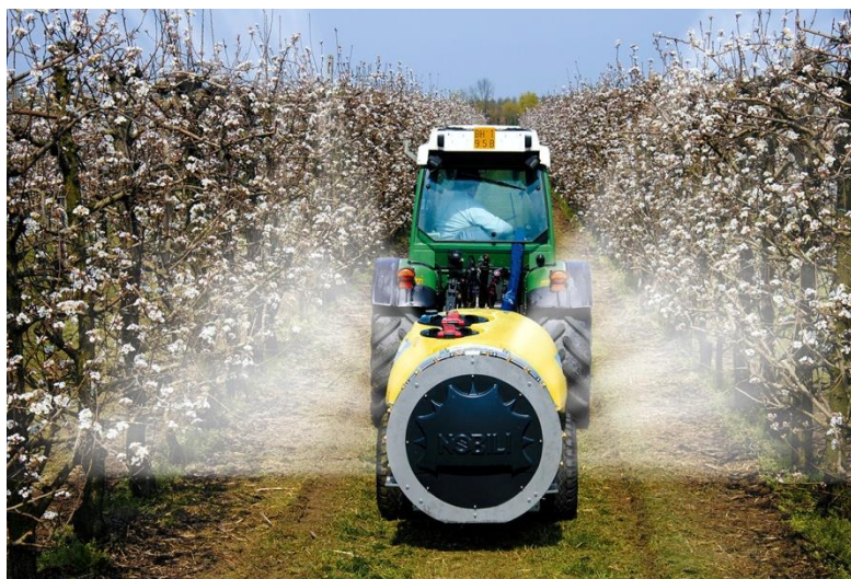
Slika 8. Pravilna aplikacija zaštitnog sredstva raspršivača.

Tijekom eksploatacije raspršivača moraju se poštovati temeljni tehnički čimbenici raspršivanja jer navedeni determiniraju kvalitetu zaštite bilja. Prema tome, pri zaštiti bilja mora se osigurati optimalnost zračne struje ventilatora, kvalitete mlaza, brzine rada stroja, količine tekućine za prskanje te kvalitetna mlaznica i ostalo. Uz navedene tehničke čimbenike raspršivanja, pri izvođenju aplikacije, moraju se poštovati vremenski uvjeti te rukovatelj stroja mora posjedovati osnovna znanja za rukovanje. Također, vrlo važan faktor utjecaja na kvalitetu zaštite bilja ima morfologija krošnje kulture u kojoj se obavlja zaštita. Dakle, istraživanja u prvom desetljeću ovoga stoljeća tendiraju prema stanovištu da se pravilnim podešavanjem tehničkih čimbenika raspršivanja postiže bolji učinak zaštite bilja. Kemijsko sredstvo dolazi na zadnje mjesto ispunjavanja uvjeta zaštite bilja. Korištenjem tehnički ispravnog stroja, povećavanjem pokrivenosti površine te poštivanjem vremenskih uvjeta uvelike se smanjila količina kemijskog sredstva po tretiranoj površini uz isti biološki učinak (McFadden - Smith, W., 2003.).