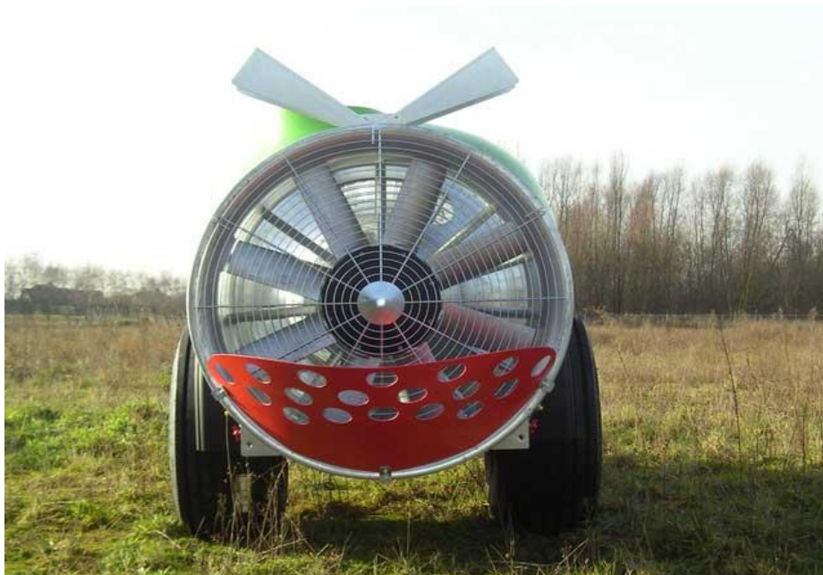
Slika 1. Aksijalni ventilator ( http://pinova.hr/hr_HR/ )

Aksijalni ventilator ostvaruje usmjeren mlaz u pravcu vratila, a koji je potrebno preusmjeriti u radijalnom pravcu. Takvi ventilatori često se nazivaju i „propelerni ventilatori“. Lopatice na rotoru, u pravilu, čvrsto su postavljene, a kod nekih izvedbi moguće je njihovo zakretanje te ukošavanje. Oko rotora je postavljen limeni usmjerivač koji usmjeruje struju zraka prema mlaznicama, a na prednjoj strani postavljena je zaštitna mreža. Na taj se način ostvaruje oblik mlaza u obliku zgusnute lepeze i to ukoliko izlazi iz ovalnog otvora ili tvori oblik dvaju segmenata lepeze, dakle pri izlazu iz lijevog i desnog otvora za ispuhavanje. Takvi ventilatori proizvode razmjerno velike količine zraka kod niskog tlaka, imaju plosnato karakterističnu krivulju pa su zbog toga vrlo osjetljivi na svaku promjenu protočnih otpora (Brčić i sur., 1966.).