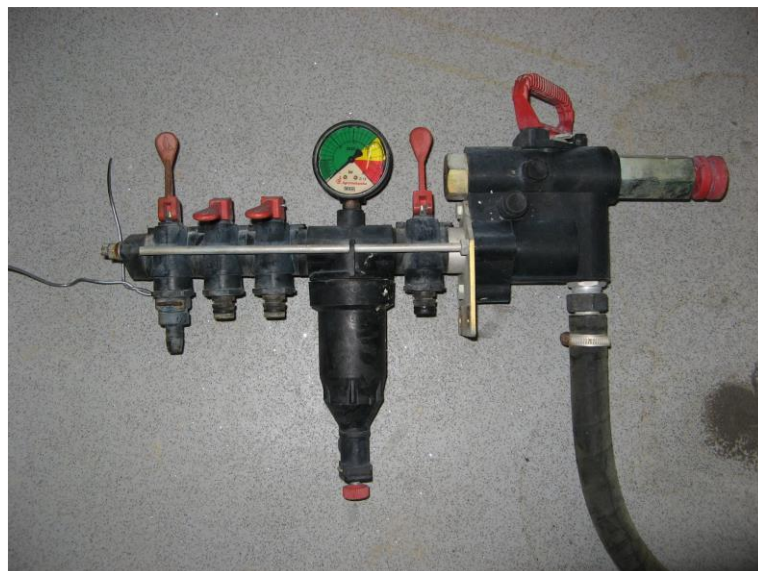
Slika 5. Regulator tlaka

Uređaj za regulaciju nalazi se iznad crpke, u ravnini ruku osobe koja s njim upravlja. Okretanjem regulatora u smjeru kazaljke na satu povećava se tlak u sustavu i obrnuto. Tlak se regulira čim se uključi pogon te se tako postigne određeni broj okretaja pogonskog vratila, a koji će se koristiti u radu. Nakon toga uključuju se mješači tekućine. Tlak se očitava sa manometra te se podešava prema karakteristikama mlaznica i nasadu u kojem se radi te trenutnim vremenskim uvjetima. Elektromembranski ventili služe za otvaranje, odnosno zatvaranje, lijevog i desnog razvodnog sustava, a električnim vodom povezani su na kontrolnu kutiju s prekidačima. Kontrolna kutija se nalazi unutar kabine traktora (Mikulić, 2016.) te se na njoj se nalaze dva prekidača (po jedan za svaki razvodni sustav) i dva svjetlosna indikatora uključenosti. Tlačni filter služi za konačno čišćenje tekućine i sprječava začepljenje mlaznica – čisti se nakon svake primjene, a po potrebi i češće (uglavnom kod upotrebe praškastih sredstava koja se teže otapaju u vodi). Povratni vod višak tekućine vraća u spremnik raspršivača. Dodatni priključak može poslužiti za ručno prskanje ili za vanjsko pranje raspršivača.