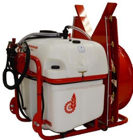
Slika 3. Spremnik škropiva

Spremnik je gotovo uvijek izrađen od plastičnih materijala. Može biti zapremine od 100 litara pa sve do nekoliko tisuća litara. Uvijek na mjestu za ulijevanje mora postojati mrežasti pročistač kako ne bi došlo do ulaska većih nečistoća i predmeta u sami spremnik, a samim time i do začepljenja cijelog sistema. Veći raspršivači, osim glavnog spremnika za škropivo, imaju i spremnik za čistu vodu, spremnik za pranje ruku te spremnik za zaštitno sredstvo. Spremnik za čistu vodu služi za pranje glavnog spremnika te čitavog sustava nakon korištenja. Ukoliko dođe do oštećenja bilo kojeg spremnika potrebno ga je zamijeniti kako ne bi došlo do bespotrebnog gubitka škropiva i zagađenja okoliša.