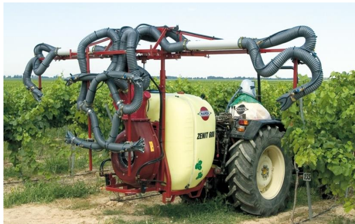
Slika 2. Radijalni ventilator( https://hardi-international.com/ )

Kod radijalnog ventilatora postiže se, ovisno o obliku izlaznog otvora, mlaz valjkastog oblika ili oblika lepeze. Budući da potiskuje manje količine zraka, ali uz znatno 16 viši tlak, nije toliko osjetljiv na promjenu otpora te omogućuje da se protok zraka preusmjerava i vodi kroz savitljive cijevi i tako bolje prilagođava oblicima biljaka. Tangencijalni ventilatori su novijeg datuma i konstruktivno su izvedeni u valjkastom obliku. Uvijek dolaze u paru, dva, odnosno četiri komada. Ventilator s poprečnim strujanjem usmjerava – ispuhuje zrak kroz dugi pravokutni otvor, tako da mal ima vrlo pravilan i homogen oblik. Dužina rotora zbog toga mora biti prilagođena visini biljke, a za rad s obje strane biljke raspršivač mora posjedovati po jedan ventilator za svaku stranu (Brčić i sur., 1966.).