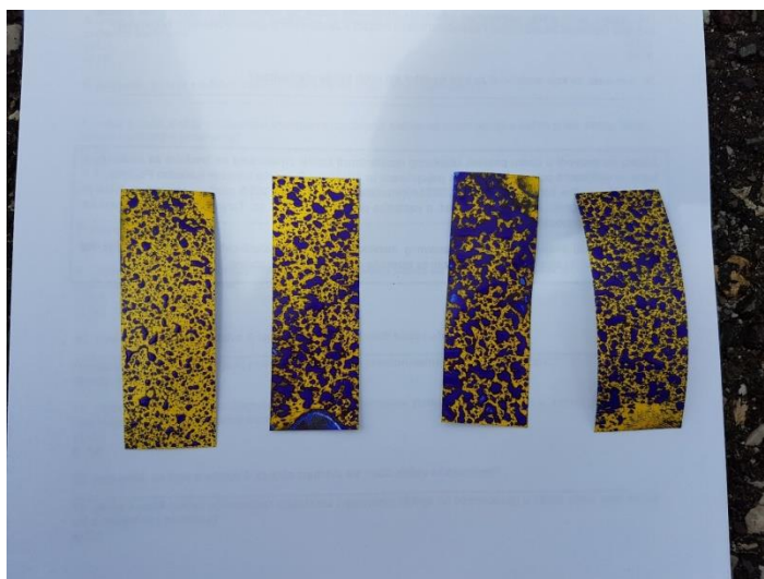
Slika 9. Pokrivenost površine određenih mlaznica

Male kapljice osjetljive su na zanošenje (drift) iz nasada te treba voditi računa o granici njihovog smanjenja, a da bi pri tome ostao dobar biološki učinak. Intenzitet zanošenja se mjeri sa VOP-a koji se postavljaju na različite udaljenosti od cilja prskanja (Ozkan, 2004.; Knežević i sur., 2007.). Iz navedenog se zaključuje da je veličina kapljica glavni čimbenik aplikacije pesticida s kojim se manipulira da bi se ostvarili željeni rezultati zaštite bilja, tj. optimizacija između veličine kapljica, radnog tlaka i tipa mlaznice (William i sur., 1999.). Ozkan (2004.) navodi da su kapljice manje od 200 \mu\text{m} najosjetljivije na zanošenje, tj. odnošenje izvan nasada ili isparavanje.