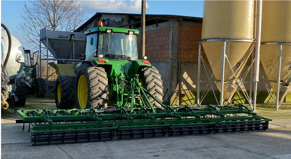
Slika 18. Sjetvospremač