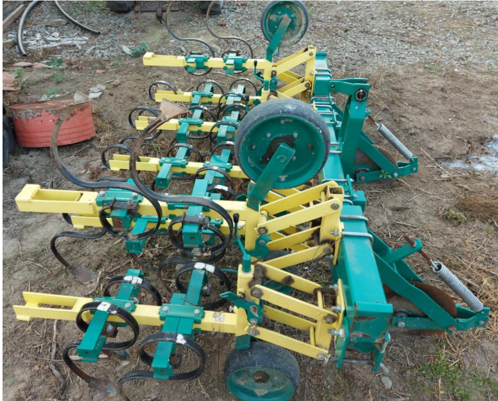
Slika 13. Međuredni kultivator marke Agromerkur