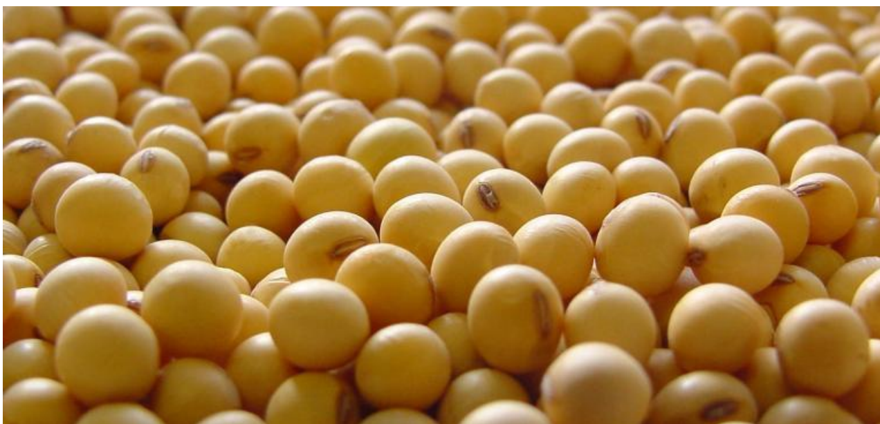
Slika 1. Zrno soje

krupnoća zrna varira , ovisno o sorti i agroekološkim činiteljima (Vrtarić i Sudarić,2008.). Boja sjemene lupine opne može biti žuta, crna, crvenkasta, zeleno smeđa ili čak pomiješane boje, a najpoželjnije je svijetlo žute boje ako se koristi za preradu. Sjeme također nije uvijek uobičajenog okruglog oblika nego može biti i spljoštenog (Slika 1.). Zrno soje je vrlo cijenjeno zbog svog sastava. Ima 35-50% bjelančevina,34% ugljikohidrata, 18-24% ulja i oko 5 % mineralnih tvari ovisno o sorti, također zrno soje je cijenjeno zbog vitamina A, B, D, E i K (Lersten i Carlson, 2004.). Važnost i značaj soje je velik upravo zbog kakvoće sojinog zrna. Bjelančevine koje nalazimo u zrnu imaju esencijalne aminokiseline od kojih se izdvaja lizin i metionin. Bjelančevine iz zrne soje su najbližnje onima životinjskog podrijetla zbog kojih su tako i cijenjenje te imaju značajnu biološku vrijednost ( Vrtarić i Sudarić, 2007.).