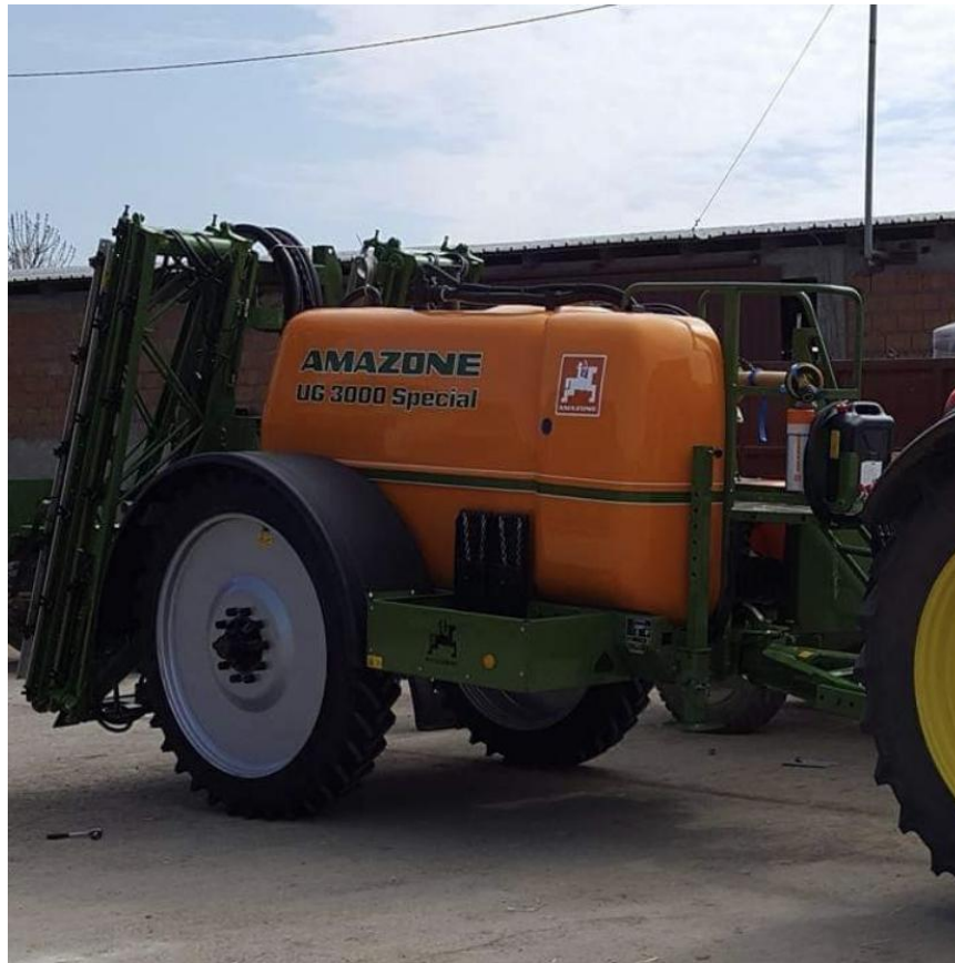
Slika 20. Prskalica Amazone