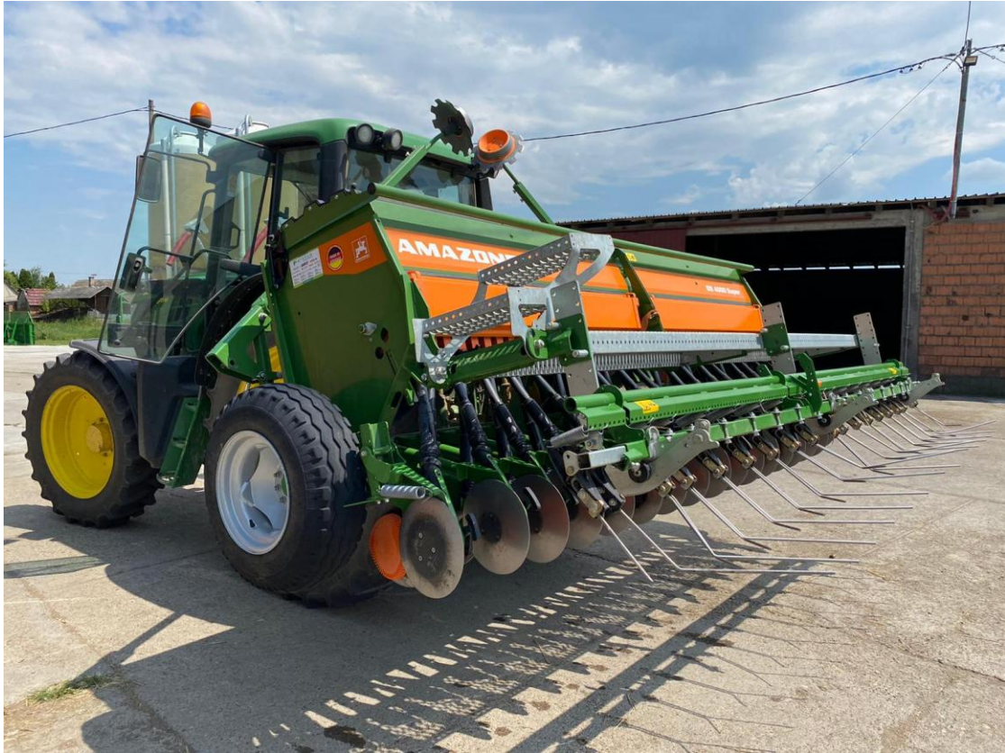
Slika 19. Sijačica Amazon