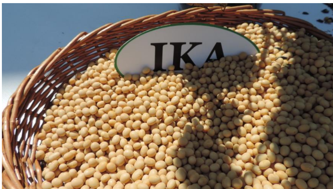
Slika 10. Sorta soje IKA

Sjetva se obavlja pneumatskom sijačicom marke Kuhn Planter 3 (Slika 11.), a međuredni razmak je 50 cm, dok je razmak između reda 2.5 cm. Datum sjetve je 20. travnja, a dubina sjetve je 5 cm. Količina sjemena za sjetve je bila 140 kg zbog toga što je nečistoća bilo 1 % i klijavost 96 % te je namjerno osiguran veći sklop zbog kasnije obrade. Od velike važnosti je da se soja sije u tlo u kojemu je sačuvana zimska vlaga, te postignute dovoljne temperature kako bi što brže izniknula tako da joj korovi ne budu konkurencija, ali i da se može ići sa mjerom mehaničkog uništavanjem korova.