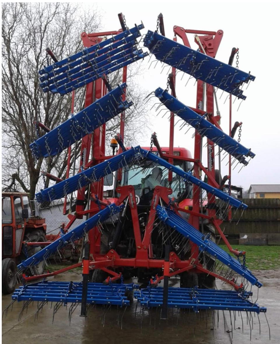
Slika 12. Česljasta drljača