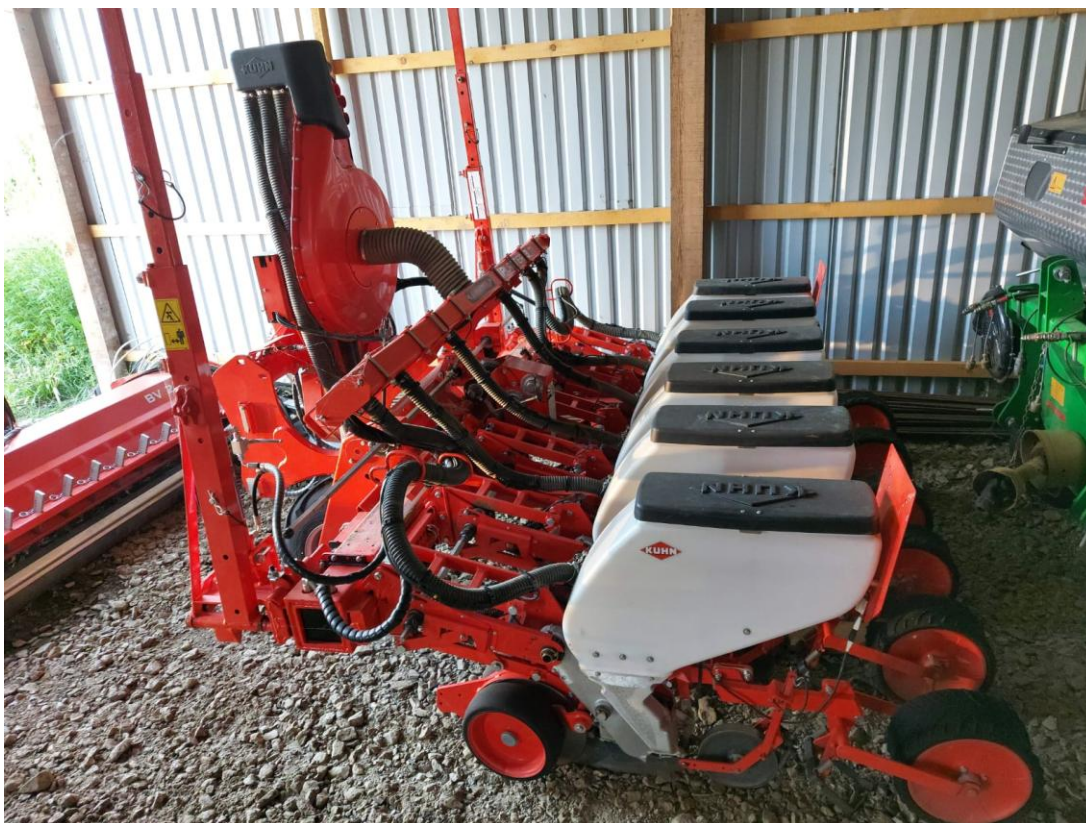
Slika 11. Pneumatska sijačica Kuhn Planter 3