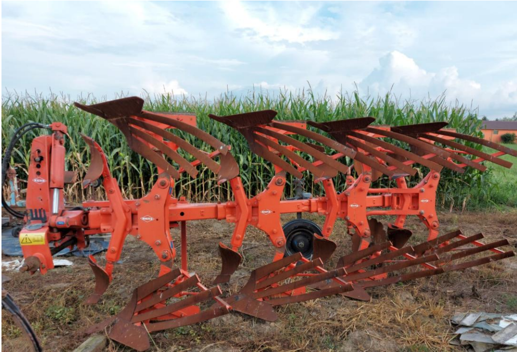
Slika 8. Plug marke Kuhn