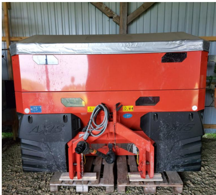
Slika 6. Rasipač Kuhn Axis

Predkultura soje je bila pir, nakon toga 1.kolovoza je sijana rauola za zelenu gnojidbu. Na ovom gospodarstvu se zelena gnojidba ubacuje kada god je to moguće zbog izrazito skupog ekološkog gnojiva. U osnovnoj gnojidbi koristimo gnojivo Feripollina (kokošje gnojivo) koje se raspodjeljuje rasipačem marke Kuhn Axis( slika 6.). To je ekološko gnojivo i koristimo ga 700 kg/ha ( NPK 4:3:3). Dopunska gnojidba ako se obavlja koristi se folijarno gnojivo Biofartin koji je u obliku praška koji se otapa ili Aminogren (folijarno sredstvo). Folijarna prihana se obavlja prskalicom Bagram širine krile 18 metara.(slika 7.)