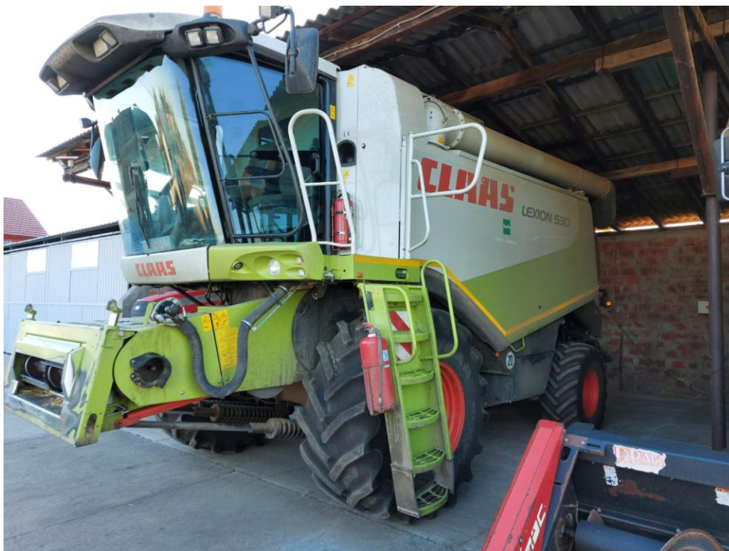
Slika 14. Žitni kombajn