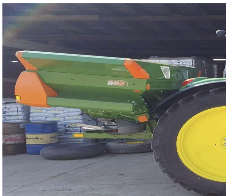
Slika 16. Rasipač Amazone