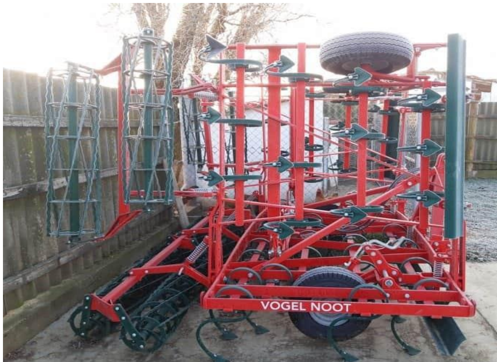
Slika 9. Sjetvospremač marke Vogel Noot