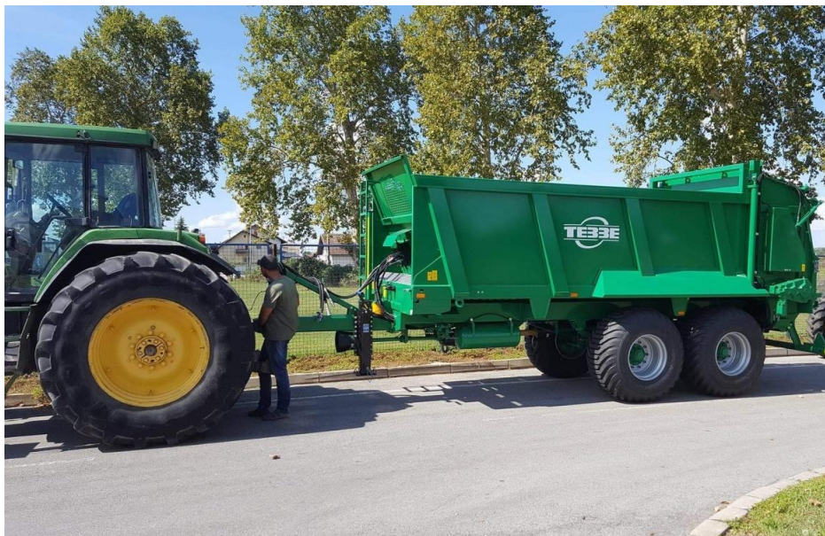
Slika 15. Prikolica za razbacivanje stajnjaka

(0:20:30) u količini od 150 kg/ha. U predstjetvenoj pripremi koristi se dušično gnojivo urea u količini od 120 kg/ha.