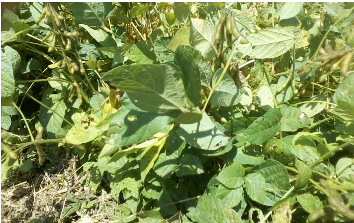
Slika 3. Listovi soje

u sjemenci i dobro su razvijeni kada klijanac izbije na površinu, ti listovi su jednostavni, imaju dugu peteljku od jedan do dva centimetra i položeni su nasuprot jedan drugom na stabljici. Svi drugi listovi su troliske i poredani su na stabljici naizmjenično. Na soji obično nalazimo između 15 -20 listova po biljci , a maksimalno ih može biti 100 ovisno o sorti( Vratarić i Sudarić 2008.).