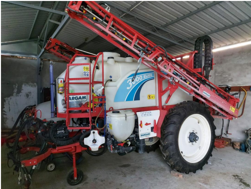
Slika 7. Prskalica Bagram