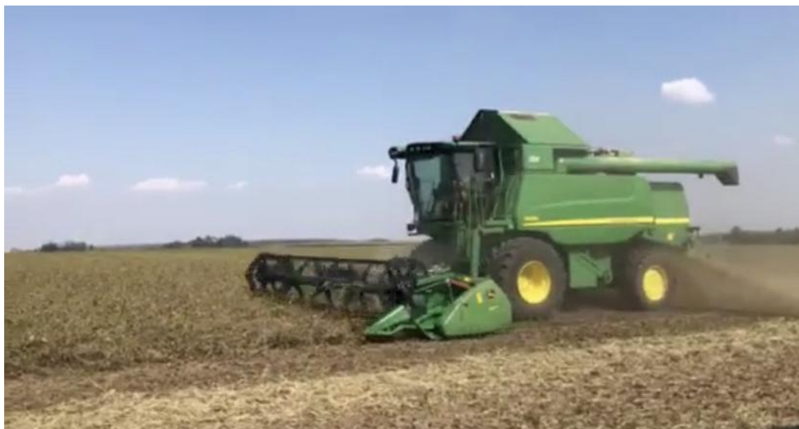
Slika 21. Žetva soje žitnim kombajnom