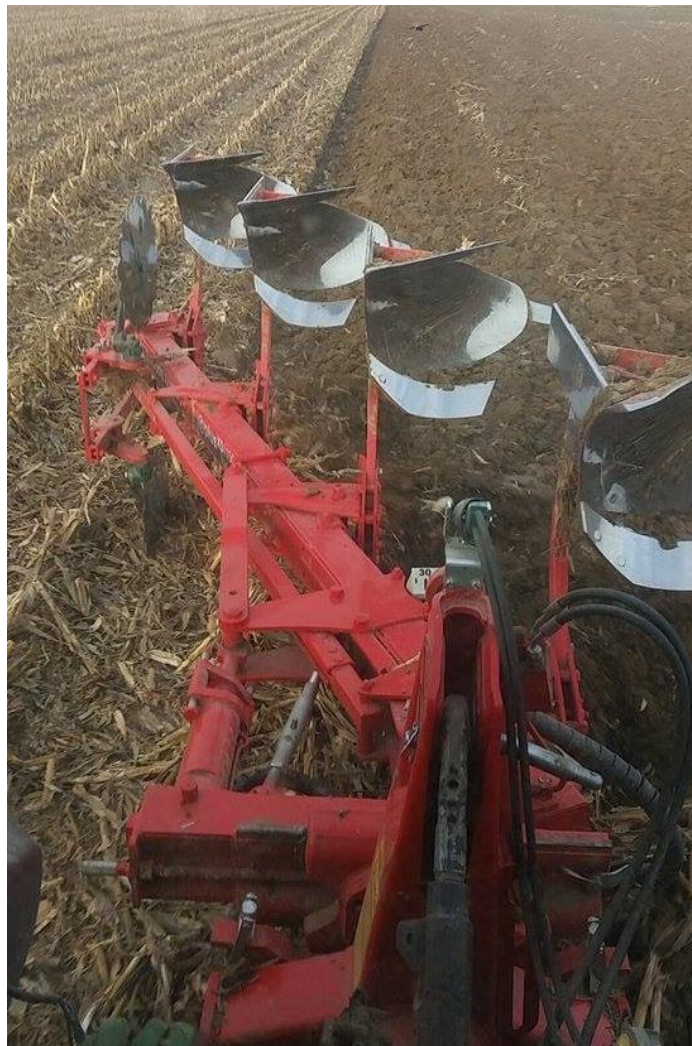
Slika 17. Zimsko oranje plugom Vogel Noot

U osnovnoj obradi tla izvodi se zimsko oranje na dubini od 30 cm (Slika 17.). Predsjetvena priprema tla kreće u proljeće i tada se zatvara zimska brazda odnosno zimska brazda se poravnava teškim drljačama kako bih se spriječio gubitak vlage iz tla. Pripremljeno zemljište se ostavlja u stanju mirovanja kako bi većina korova izniknula te bila uništena 20.travnja sjetvospremačem (slika 18.) Nakon zatvaranje zimske brazde i prije sjetve tlo se dodatno obrađuje u jednom ili dva prohoda kako bih se osigurao što bolji sjetveni sloj. Sjetvospremač koji se koristi na ovom gospodarstvu ima radno tijelo oblika pačje noge koje prati dva reda valjaka koji ravnavaju i usitnjavaju zemlju. Tlo treba dobro obraditi i usitniti, poravnati sjetvospremačem kako bih pri žetvi kombajn pokupio i one najniže mahune.