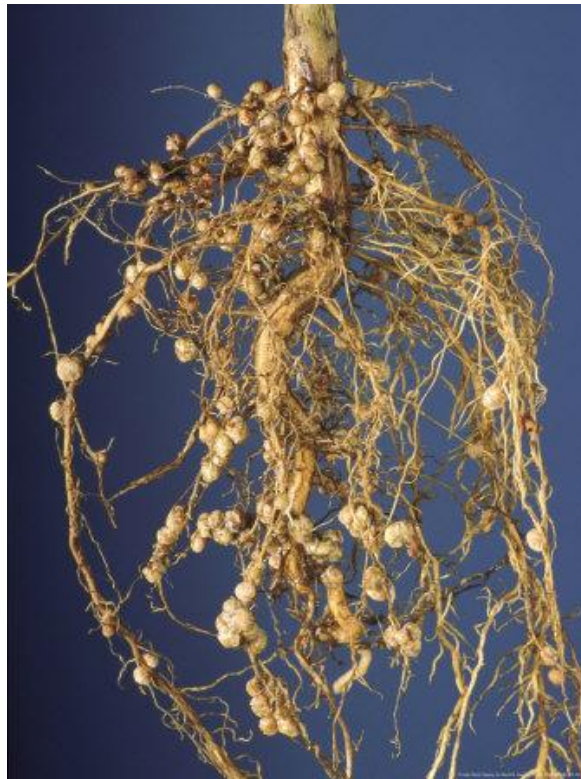
Slika 2. Korijen soje

Korijen soje je dobro razvijen i ima dobre apsorpcijske sposobnosti. Korijen kod soje je građen od jakog glavnog vretenastog korijena i puno sekundarnog korijenja. Sojina biljka razlikuje se u površini korijenskog sustava i njegovoj masi suhe tvari, kod pojedinih sorata a od velikog utjecaja su i vanjski čimbenici ( Carlson 1993., Kaspar 1985.). Kako će se korijen razviti ovisi o dostupnost vode i količina hranjivih tvari u tlu i sastavu tla ( Vrtarić i Sudarić, 2008.). Na korijenu soje nalazimo kvržice u kojima žive kvržične bakterije Bradyrhizobium japonicum ( Slika 2.). Bakterije žive unutar tih kvržica u mutualističkom simbiotskom odnosu s biljkom, te one vežu dušik iz zraka (bakterije uzimaju potrebne ugljikohidrate, a daju biljci dušik) (Duraković 1996.). Kvržice su odličan izvor dušika. Bakterije pretvaraju anorganski dušik u oblik koji je pristupačan biljci a to je amonijski i nitratni ( Mitchell i Russel, 1971.).