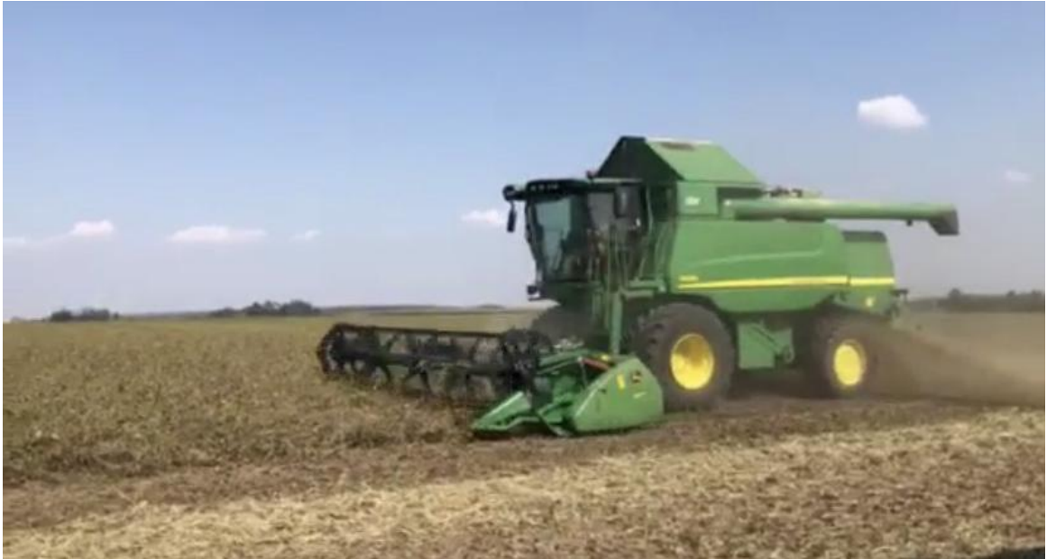
Slika 21. Žetva soje žitnim kombajnom