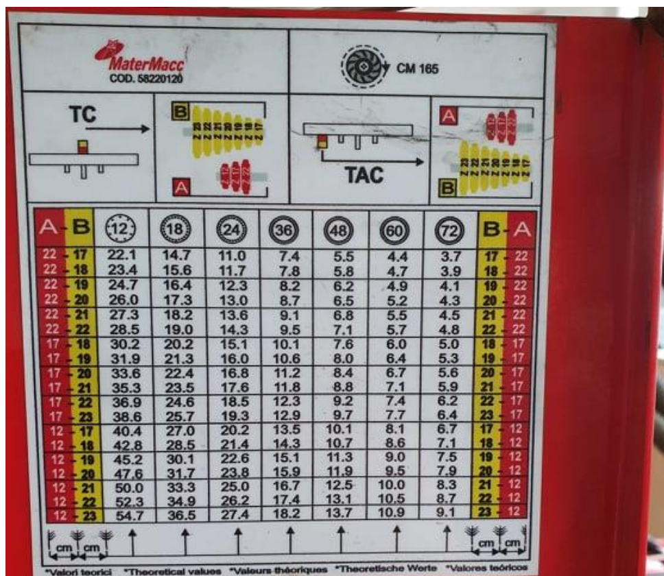
Slika 6. Sjetvena tablica izbor lančanog prijenosa kod sijačice MaterMacc Twin Row - 2