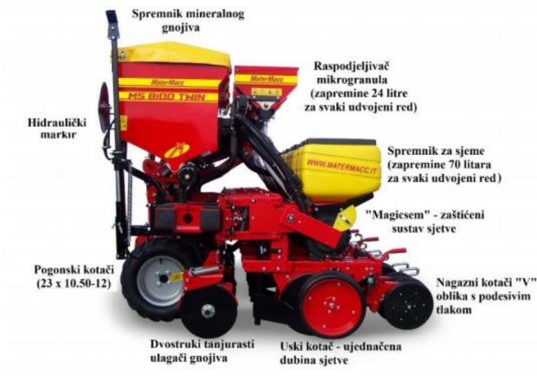
Slika 3. Glavni sustavi sijačice MaterMacc Twin Row - 2