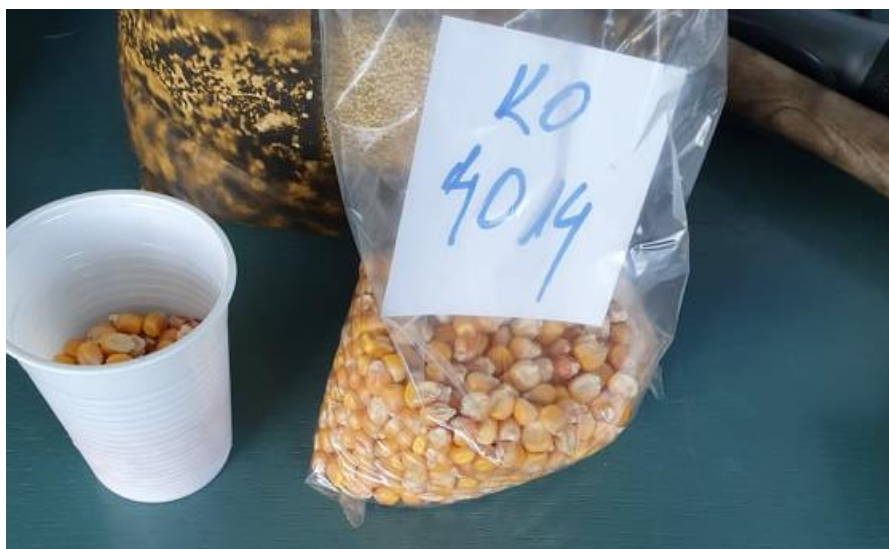
Slika 9. Sjeme krupno okrugle (KO) frakcije hibrida Os 4014

U sjemenu hibrida Os 4014 bile su izdvojene frakcije: KO (krupno okruglo), KP (krupno plosnato), SO (sitno okruglo), SP (sitno okruglo) (Slika 10., 11., 12. i 13.). Navedene frakcije sjemena ispitivane su u simulaciji sjetve pri radnim brzinama od 4, 6 i 8 km h -1 uz korištenje svetvene ploče s – otvora promjera – mm.