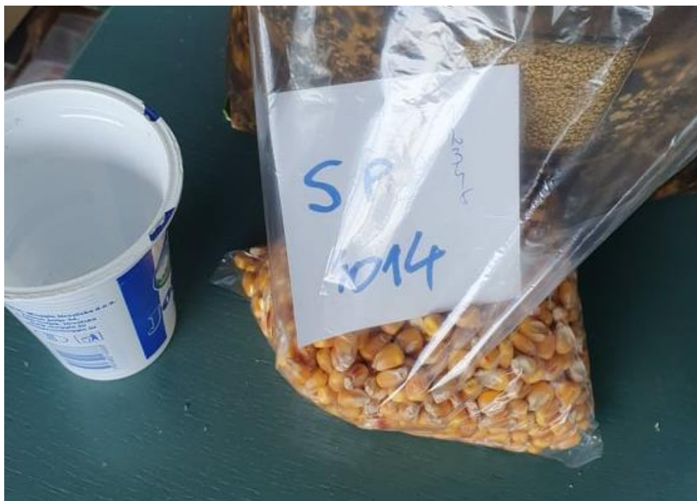
Slika 12. Sjeme sitno plosnate (SP) frakcije hibrida Os 4014