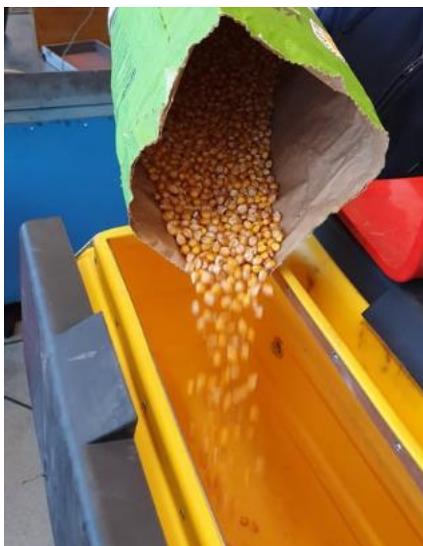
Slika 8. Sjeme osječkog hibrida Os 4014

Dobar je za sve namjene proizvodnje (zrno, klip, silaža). Stabljika mu je srednje visine, robusna s bujnim listovima i visoke tolerantnosti na polijeganje. Ima dubok i razgranat korijen jake upojne moći te visoku energija klijanja i klijavost (izražen vigor zrna). Klip mu je krupniji, cilindričan i srednje visoko nasaden. Sadrži 16-18 redi zrna u tipu pravog zubana. Izraženo mu je svojstvo gubitka vode u zriobi što rezultira manjom vlagom pri berbi.