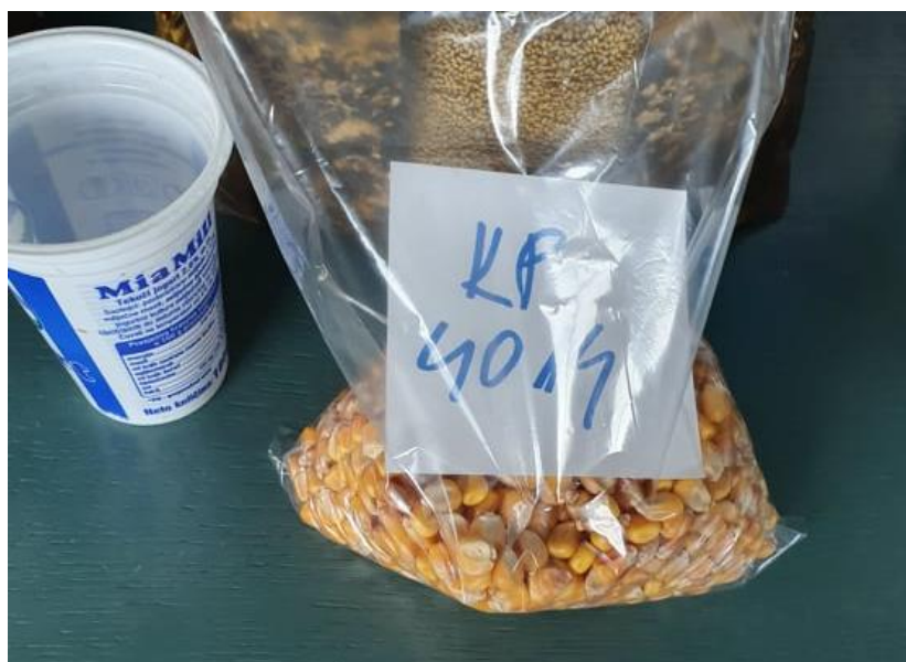
Slika 10. Sjeme kratko plosnate (KP) frakcije hibrida Os 4014