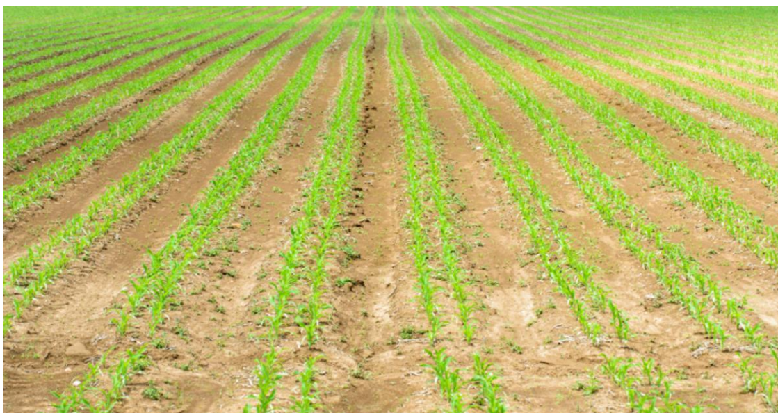
Slika 1. Kukuruz zasijan Twin Row sjetvom

Sijačica MaterMacc Twin Row - 2 obavlja Twin Row sjetvu odnosno sjetvu u udvojene redove (Slika 1.). Ovim načinom sjetve ostvaruju se prednosti prednosti kao što je veći broj biljaka po hektaru, bolji raspored unutar reda te je manja konkurencija za vodom, hranjivima i svjetlosti.