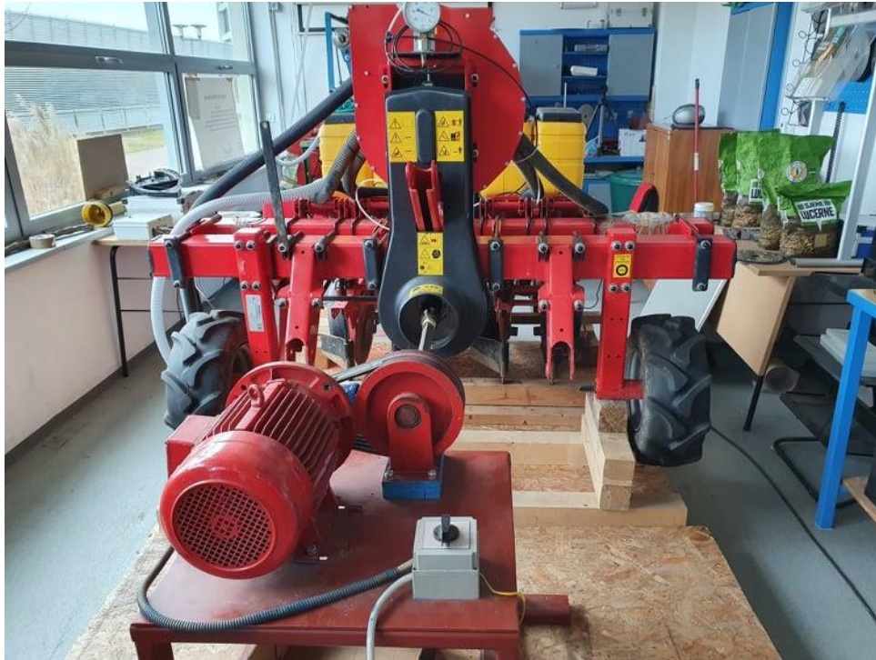
Slika 2. MaterMacc Twin Row - 2 sijačica

Sijačica MaterMacc Twin Row - 2 (Slika 2.) ima dvostruke redove, sa dvostrukim ulagačkim diskom što omogućava sjetvu dvostrukih redova po "cik-cak" tehnici, kako bi biljka što bolje i brže rasla i razvijala se.