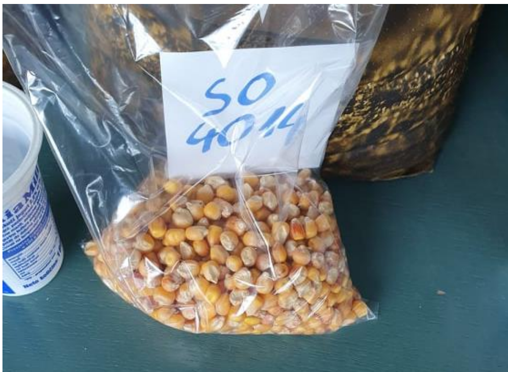
Slika 11. Sjeme sitno okrugle (SO) frakcije hibrida Os 4014