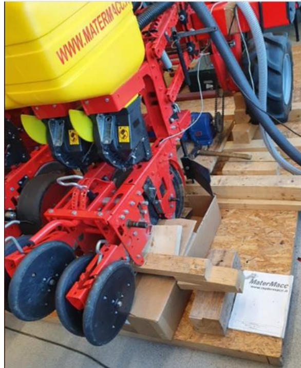
Slika 5. Sjetvene sekcije sijačice MaterMacc Twin Row - 2

Ulađač sjemena sjetvene sekcije diskosne je izvedbe s dva tanjura \varnothing 390 mm, dok se željena dubina sjetve osigurava pomoću duplih metalnih kotača s gumenom oblogom postavljenih s bočne strane ulagača (Banaj, A. 2020). Izgled sjetvene sekcije može se vidjeti na Slici 5.