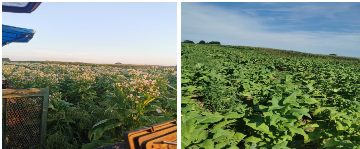
Slika 12. lijevo - Duhan prije zalamanja cvati i zaperaka i desno - duhan poslije zalamanja cvati i zaperaka

Zalamanje cvati se na OPG «Dikšić» provodi se redovito (Slika 12. lijevo i desno). Vrlo je bitno da se nakon zalamanja cvati biljke tretira fiziotropima (Slika 13.).