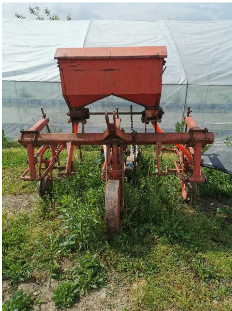
Slika 11. Kultivator

Osim kultivacije, suzbijanje korova obavljeno je i herbicidom KALIF 480 EC u propisanoj količini od 0,5 l/ha. Obavljeno je jedno ručno okopavanje motikom, a po potrebi ide se i više puta.