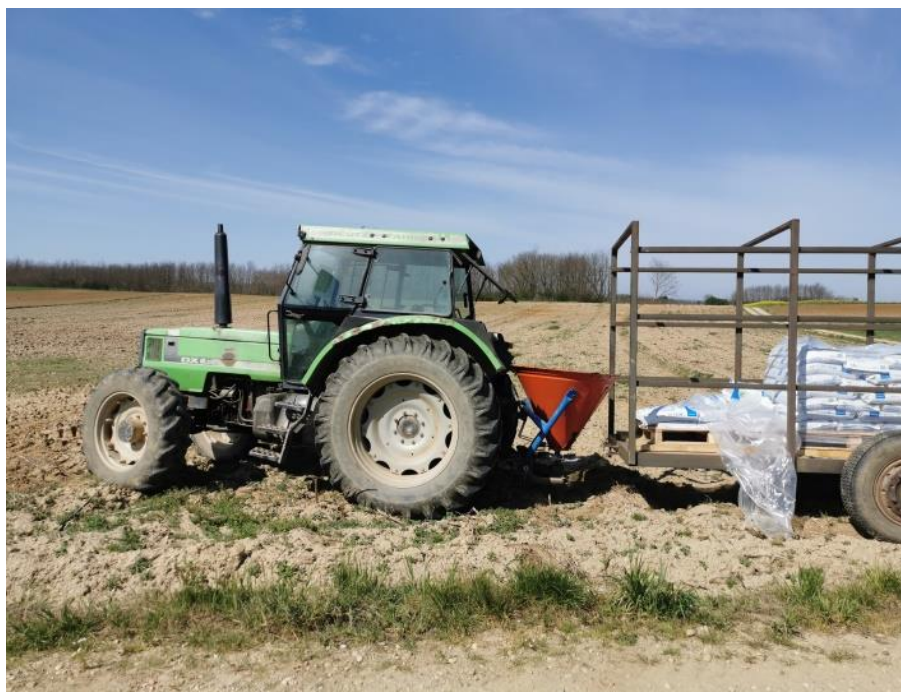
Slika 8. Gnojidba duhana

dušika može izazvat odgađane zriobe i pojavu smeđe pjegavosti, a kod nedostatka dušika list postane sivkast, hrapav i blijed. Dušik je biljci potreban tijekom ranih faza rasta i povećava sadržaj nikotina u listu, a upotrebljava se u amonijskom 1,2% i nitratnom 13,8% obliku. Veća količina amonijskog dušika loše utječe na rast i razvoj lista duhana, a kod veće primjene povećava se prinos i kvaliteta lista. Veće količine dušika iz tla duhan uzima 4. do 7. tjedna nakon sadnje.