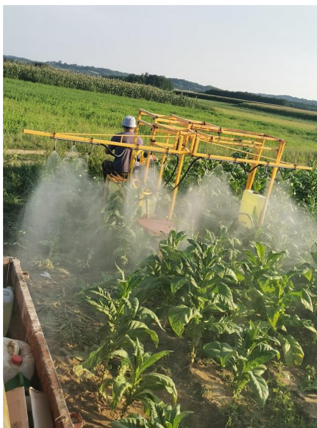
Slika 13. Prskanje duhana poslije zalamanje cvata i zaperaka