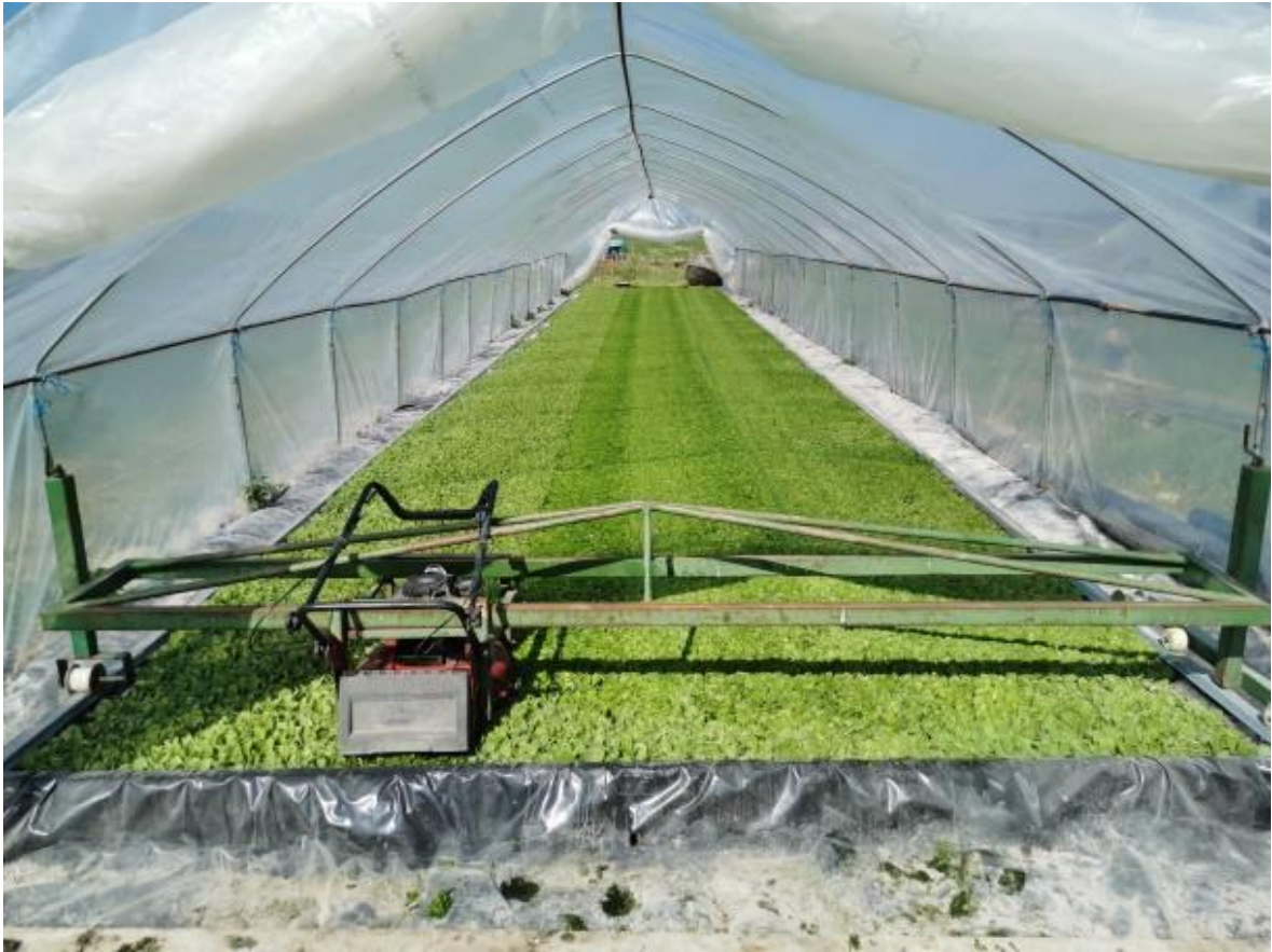
Slika 6. Pokošeni rasad duhana

Drugo i treće šišanje obavljalo se u istim razmacima tri dana nakon prvog šišanja. Svakim se šišanjem visina biljke smanjila za oko 1,5 cm. Šišanjem se zaustavlja rast naprednijih biljaka, a omogućuje razvoj slabijih. Samim time povećava se broj kvalitetnih presadnica, čvrstoća, elastičnost i debljina biljke (Slika 7.).