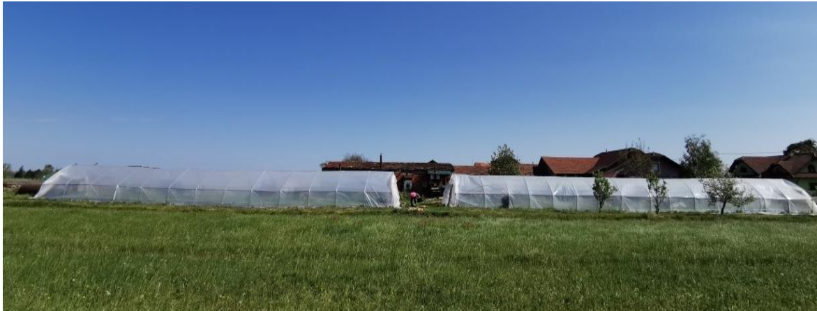
Slika 3. Postavljeni plastenici

U mjesecu ožujku prave se bazeni minimalne dubine 20 cm najčešće od jelovih dasaka, puni se vodom do visine od 15 cm. Bazen ostaje zatvoren nekoliko dana zbog zagrijavanja vode, zato se i stavlja crna folija zbog bržeg zagrijavanja. Za napunit jedan bazen potrebno je 12 000 – 13 000 litara vode, a temperatura vode treba bi iznositi iznad 7 °C. Vrlo je važno kakvom se vodom bazen puni, treba izbjegavati punjenje bazena vodom iz kanala, jezera ili sl. Voda u bazenu (Slika 4.) mora biti iz gradskog vodovoda ili iskopanog dubinskog bunara, treba imati slabu kiselinu do neutralnu reakciju. Prije stavljanja plitica u bazen obavlja se startna gnojidba s NPK gnojivima 20:10:2 u količini od 750 g/m 3 vode i KAN-om u količini od 150 g/m 3 vode.