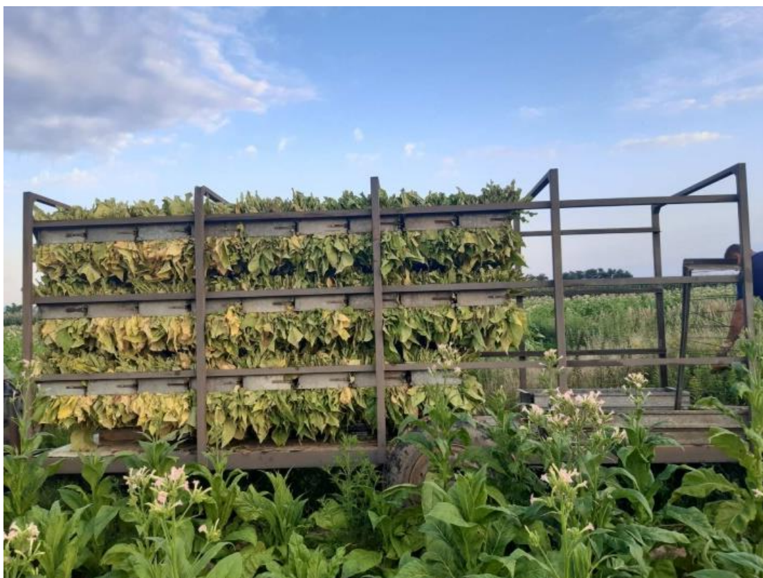
Slika 16. Slaganje duhana

Nakon berbe listovi duhana se slažu i odvoze na sušenje (Slika 16.).