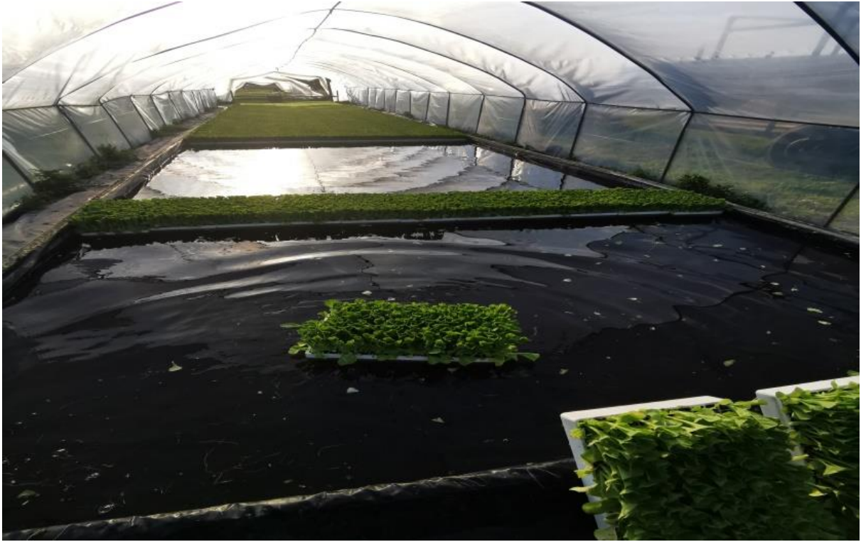
Slika 4. Plastenik ispunjen vodom

U hranjivu otopinu preventivno je dodan fungicid Merpan 80 WDG u koncentraciji od 0,3 % odnosno 300 g sredstva u 1000 litara vode.