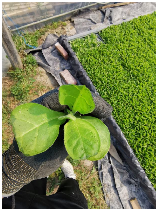
Slika 5. Duhan iz plitice

Dok prođe opasnost od mrazeva plastenik se svakodevno prozračuje bilo sunčano ili oblačno vrijeme, prozračivanje utječe na prosušivanje lista i smanjenja pojave bolesti i algi u otopinama. Proizvodnja u hidroponima traje od 50 do 55 dana.