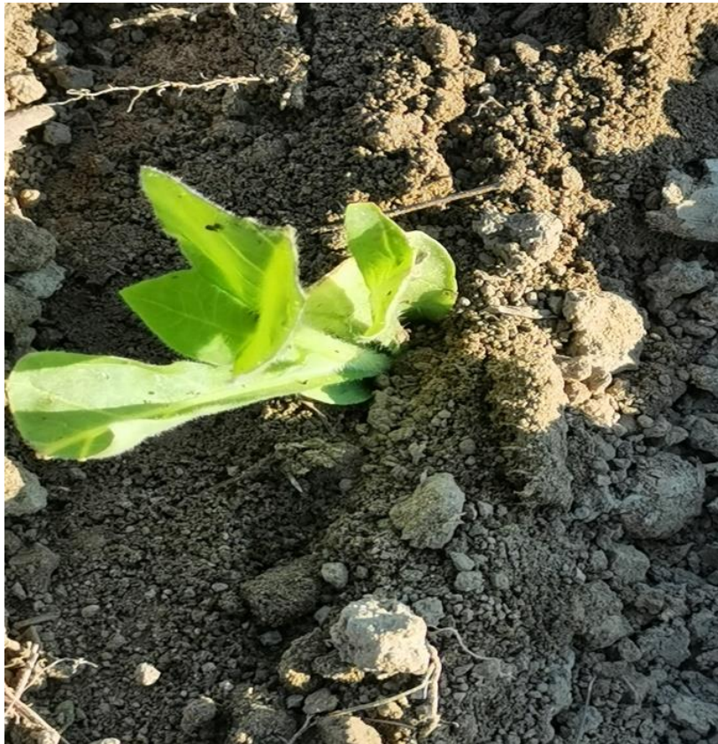
Slika 10. Presadena duhanska presadnica