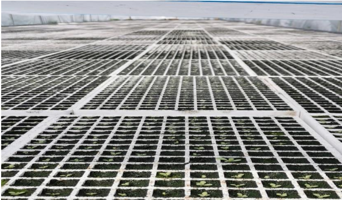
Slika 1. Duhan u hidroponskom uzgoju

Duhanske presadnice nekada su se u Hrvatskoj uzgajale u gredicama natkrivenim polietilenskom folijom (lijevama). Nedostatak proizvodnje u gredicama jest potreba za velikom površinom gredica, velika potreba ljudskog rada, neujednačenost presadnica i oštećenja na korijenu, što dovodi do nižih prinosa i loše kvalitete lista (Butorac, 2009.).