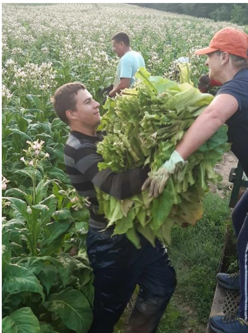
Slika 15. Berba duhana

Berba duhana (Slika 15.) na OPG-u «Dikšić» započela je 16. srpnja 2019. godine i obavljala se 3 puta tjedno. Utorkom se brala sušara kapaciteta 108 ramova, četvrtkom sušara kapaciteta 105 ramova i petkom susašara kapaciteta 99 ramova. U berbi je sudjelovalo 10 berača, 2 nosača i 3 osobe koje slažu listove duhana u spremnike. Berba se odvijala po insercijama od podbira, nadpodbir, srednje lišće, podvršak i vršak. Berba je trajala mnogo kraće no prijašnjih godina zbog pojave čestih ledotuča. Prosječni prinos osušenog lista bio je oko 1,6 t/ha.