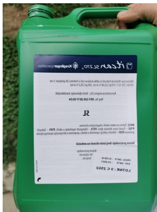
Slika 14. Fiziotrop Antak i Itcan