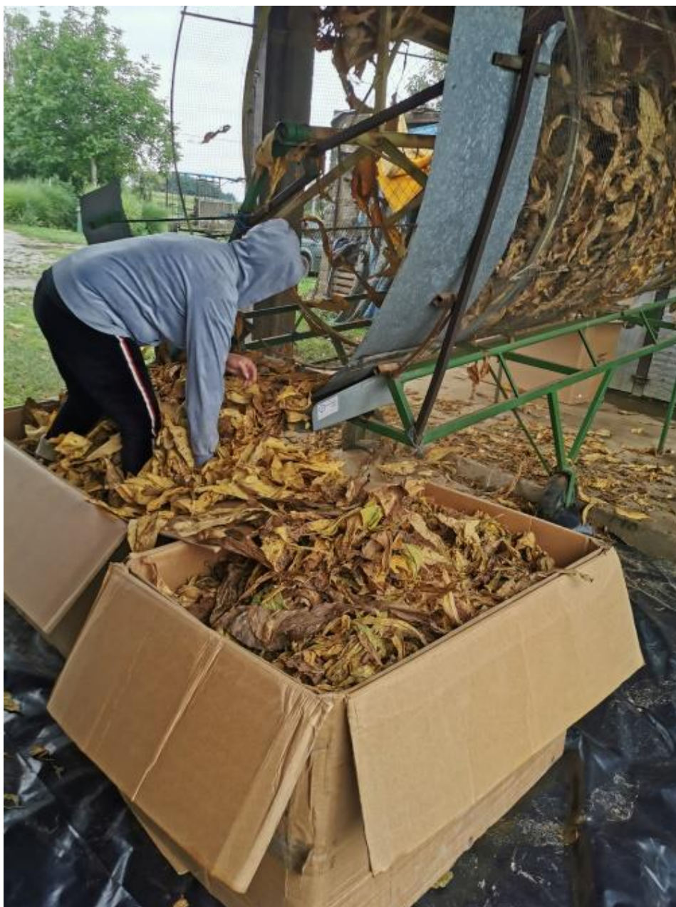
Slika 18. Pakiranje suhog duhana