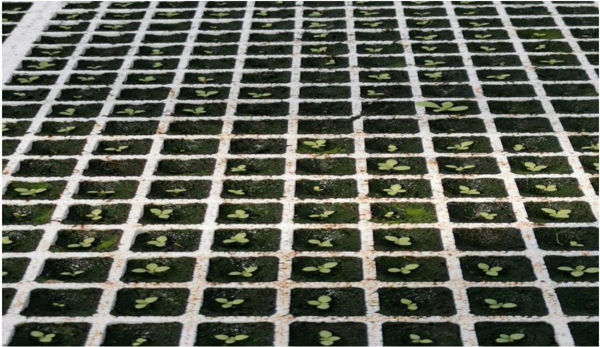
Slika 2. Plitica duhana

Fungicidi se preventivno dodaju kako bi zaštitili mladu biljku od plamenjače duhana ( Peronospora tabacina Adam), sive plijesni ( Botritis Cinerea Pers.) i uzročnika polijeganja presadnica ( Fusarium spp. Link., Pythium debaryanum Hesse i Rhizoctonia solani Kühn.) (Pospišil, 2013.).