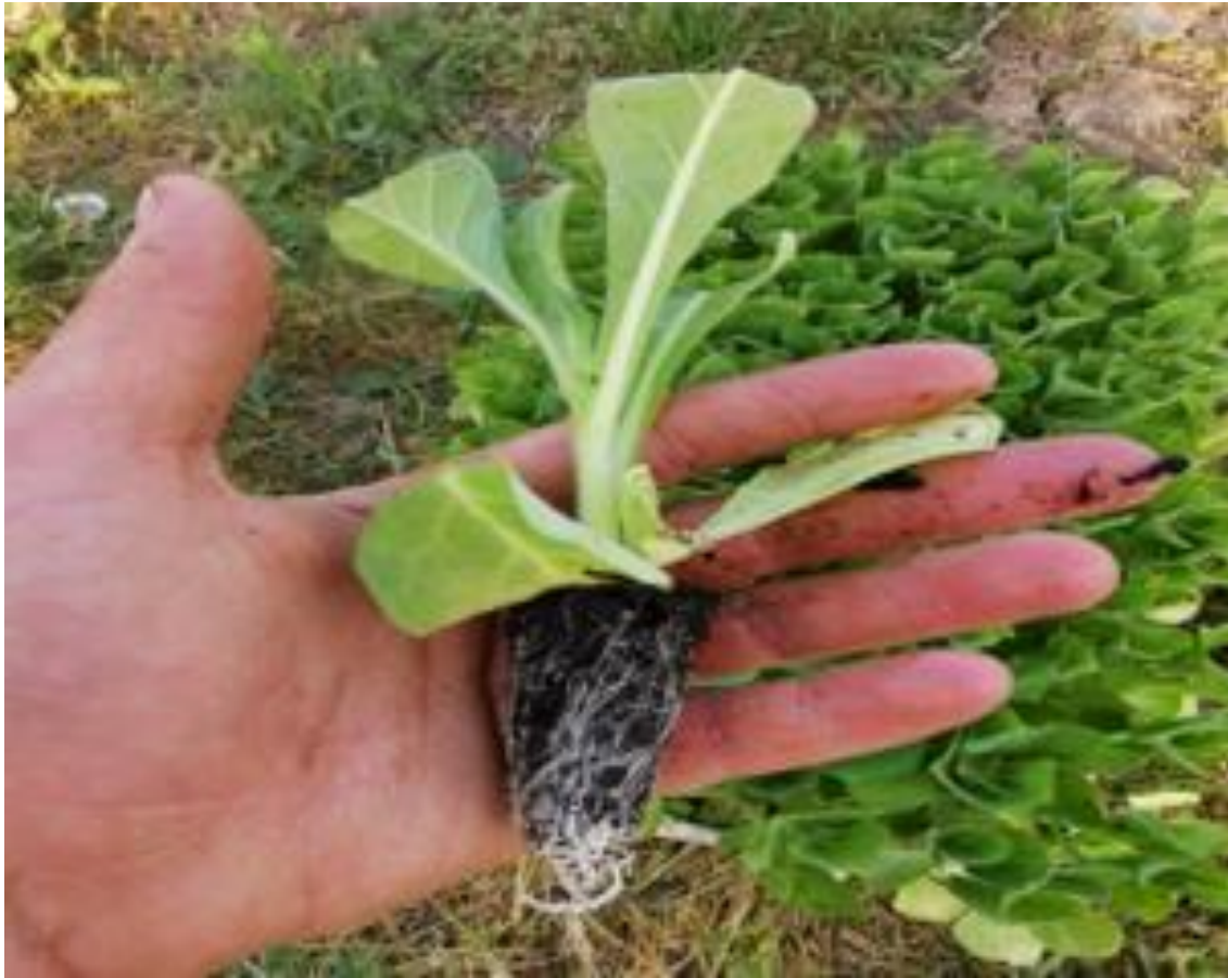
Slika 7. Dobro uzgojena presadnica duhana