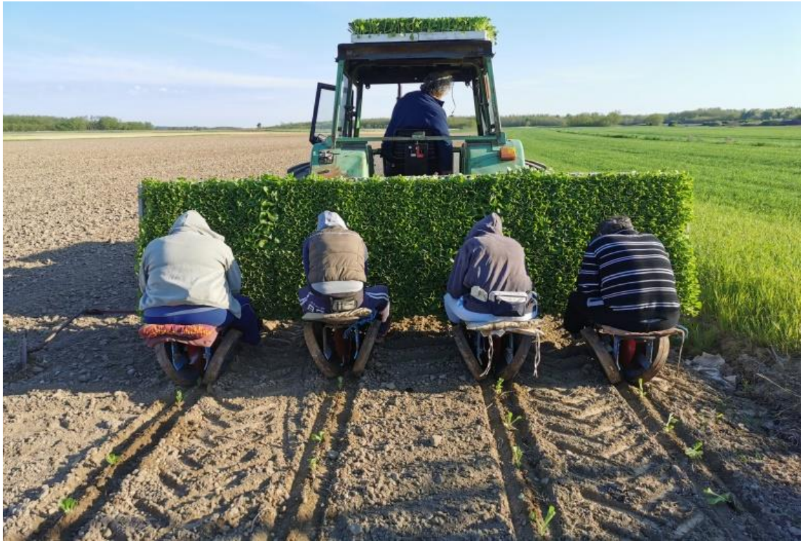
Slika 9. Sadnja duhana