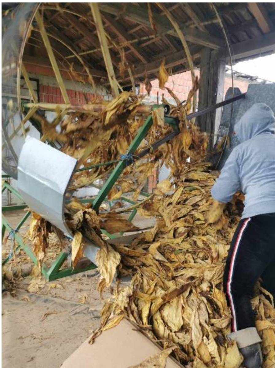
Slika 17. Suhi duhan koji se čisti od primjesa

Obiteljsko poljoprivredno gospodarstvo «Dikšić» raspolaže s tri sušare od 108, 105 i 99 ramova. Nakon sušenja duhan se pakira u kutije, u koju stane od 12 – 14 ramova (Slika 17.).