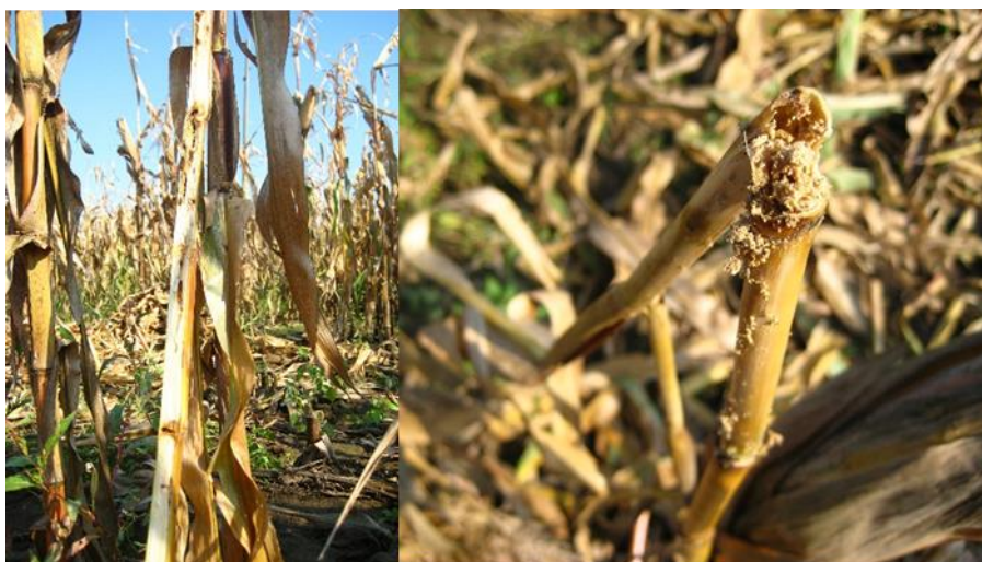
Slika 3. Oštećenja kukuruza od kukuruznog moljca