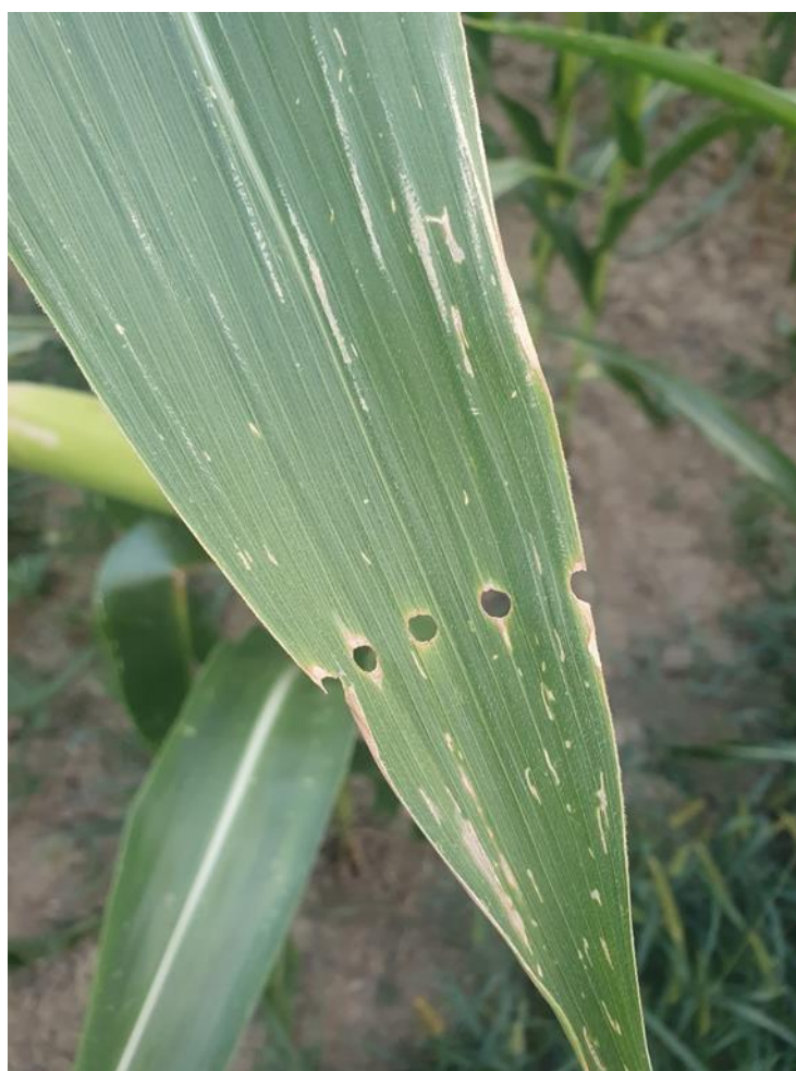
Slika 13. Simptomi napada gusjenice kukuruznog moljca

Od početka istraživanja (26. lipnja 2020. godine) utvrđeni su simptomi napada moljca na kukuruзу. U lipnju se počinju javljati prva oštećenja na listu u obliku rupica u redu na vršnom dijelu lista, ta su oštećenja od prve generacije kukuruznog moljca (Slika 13). Na početku istraživanja dana 03.srpnja.2020, godine prikupljeno je 85 gusjenica kukuruznog moljca koji su počeli napadati začetak metlice kukuruza. Pregledano je 150 biljaka od kojih je su na 42 pronađene gusjenice kukuruznog moljca, što rezultira napadom od 28 % pregledanih biljaka. Oštećenja su se kasnije vidno povećala i zaraženost je bila velika. Krajem srpnja, pojavom druge generacije kukuruznog moljca, pojavila su se oštećenja u klipu. Pri pregledu biljaka 14. srpnja. 2020. godine pronađena je jedna skupina jaja kukuruznog moljca na naličju lista kukuruza.