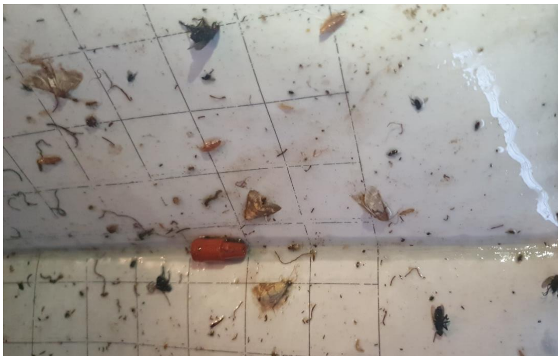
Slika 12. Ulov kukuruznog moljca na feromonskom mamcu

Unatoč tome što je pravilno postavljen feromonski mamac i redovno očitavan, nije utvrđena masovna pojava odraslih stadija kukuruznog moljca (leptira). S obzirom da je moljac stalan štetnik i utvrđeni su simptomi napada u ovom istraživanju, vjerojatno su leptiri kukuruznog moljca bili u znatno brojnijoj populaciji nego je utvrđeno ovim istraživanjem. Pretpostavljamo da mamac nije bio učinkovit. Zadnjega dana praćenja leta leptira (01. rujna 2020.) na mamcu su uhvaćena 4 leptira kukuruznog moljca (Slika 12).