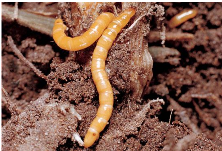
Slika 7. Žičnjak iz roda Agriotes

Imago je taman i izduženog tijela, duljine 8 – 20 mm, a nazivaju se klisnjaci. Ličinke su duljine 20 – 30 mm i žute su boje (Slika 7). Jedna generacija se razvija godinama ovisno o vrsti, ženka odloži 3 – 20 grupa sa po 70 do 200 jaja. Napada kukuruz, šećernu repu, pšenicu, ječam, soju, lucernu i druge ratarske i povrtlarske kulture. Na napad žičnjaka upućuje prorjeđivanje biljnog sklopa. Ličinke se ubušuju u stabljiku i hrane se podzemnim organima. Kao mjera suzbijanja koristi se duboka obrada tla i primjena kemijskih insekticida. (Ivezić, 2008.).