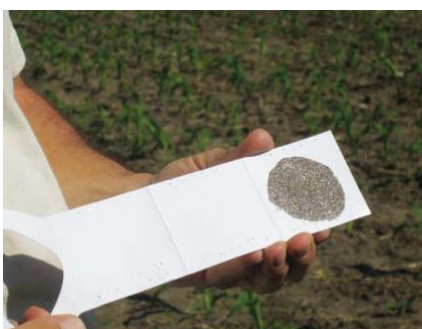
Slika 9. Osica Trichogramma spp. Slika 10. Kartica s osicama koja se postavlja u polje