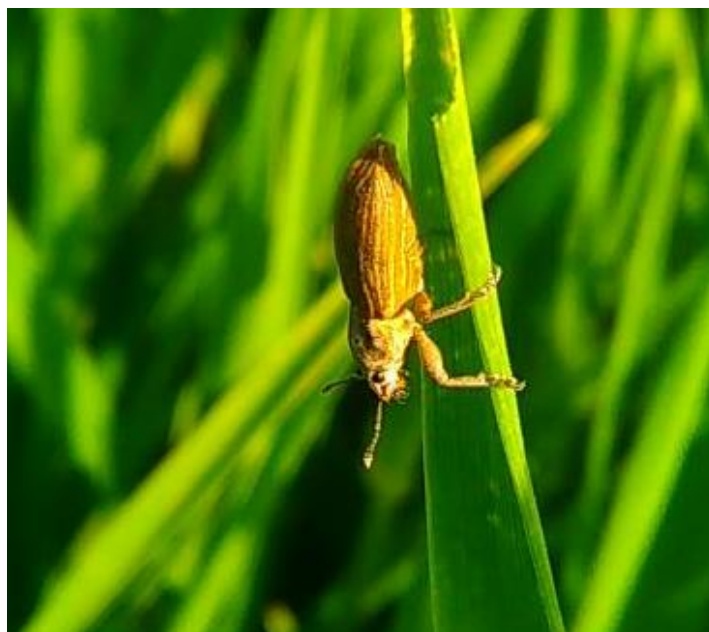
Slika 5. Kukuruzna pipa, Tanymecus dilaticollis Gyll.

Imago je sivkaste boje duljine 5 – 8 mm (Slika 5). Tijelo je izduženog ovalnog oblika, a glava mu je izdužena i na vrhu se nalazi rilo. Ličinke su bez nogu bijele boje, dužine 5 – 6 mm. Prezimljuje u tlu u stadiju imaga. Iz tla izlazi kada se površinski sloj zagrije na 5 – 10 °C. Pare se nekoliko dana nakon izlaska. Ženka odloži oko 300 jaja. Primarni je štetnik kukuruza, a može se javiti na suncokretu, duhanu i šećernoj repi. Na mladim biljkama uočavamo izgriženo lišće. (Ivezić, 2008.) U Hrvatskoj nema niti jedno registrirano sredstvo za suzbijanje kukuruzne pipe.