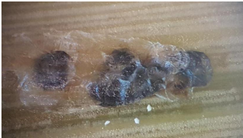
Slika 14. Parazitirana jaja kukuruznog moljca

Jaja kukuruznog moljca su prikupljena i spremljena u plastičnu posudicu te čuvana na sobnoj temperaturi. Jajna skupina sastojala se od 16 jaja, od čega je 7 jaja bilo parazitirano (Slika 14). Jaja su bila crne boje, što je naznaka parazitiranosti s osicama iz roda Trichogramma .