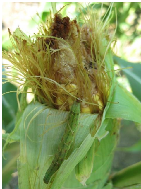
Slika 6. Kukuruzna soвица, Helicoverpa armigera Hübner

Ženka je svjetlosmeđe boje sa smeđim prednjim krilima. Mužjak je svjetložute boje s maslinastim prednjim krilima. Tijelo ličinke (gusjenice) (Slika 6) može biti crvene, zelene i crne boje s uzdužnim i bočnim prugama koje mogu biti svjetlije ili tamnije. Imaju od 5 do 7 stadija razvoja. Rasprostranjeni su u južnoj Europi, cijeloj Americi, Africi, Aziji i Australiji. Imaju 2 – 3 generacije godišnje, a leptir svake generacije može odložiti oko 4000 jaja. Napadaju oko 250 biljnih vrsta, a najveće štete čine na kukuruzu, duhanu, zobu, lucerni i mrkvi. Prezimljuju u obliku kukuljice. Prva generacija se javlja krajem svibnja i u lipnju, druga u srpnju i treća u kolovozu. Druga i treća generacija se hrani zrnom klipa i generativnim organima biljaka. Kao mjere suzbijanja se koristi uništavanje korova koji mogu biti domaćini i kemijsko tretiranje insekticidima (Ivezić, 2008.)