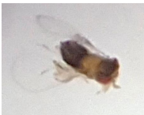
Slika 15. Osica Trichogramma izašla iz jaja kukuruznog moljca

Svakodnevno praćenje razvoja jaja rezultiralo je uočavanjem šest parazitskih osica iz roda Trichogramma (Slika 15). S obzirom da su osice parazitirale 44 % jaja iz položene jajne skupine, možemo zaključiti da su sposobne značajno smanjiti populaciju kukuruznog moljca.