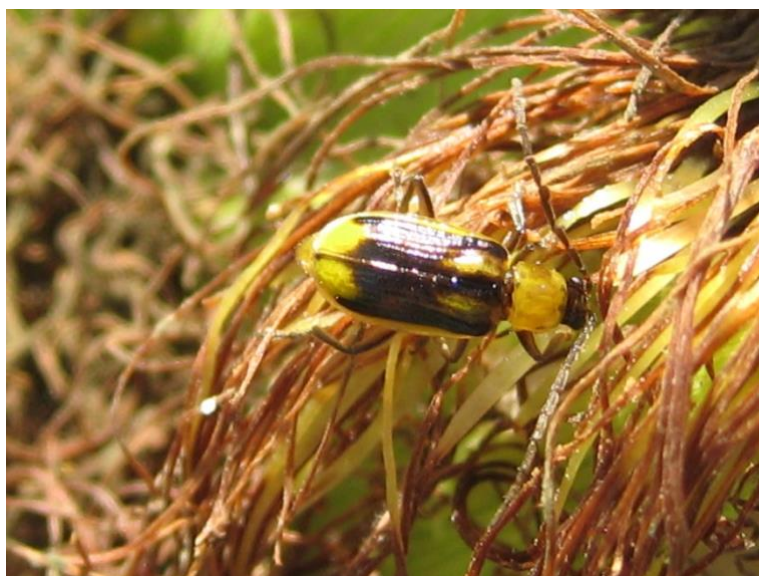
Slika 4. Diabrotica virgifera virgifera LeConte

Imago je žuto smeđe boje (Slika 4) duljine 7 – 8 mm. Ženke imaju tri tamne pruge na pokrilju. Ličinke su bijele boje duljine 13 mm. Godine 1995., ova vrsta je prvi puta zabilježena u Hrvatskoj u selu Bošnjaci (Istočna Hrvatska), u kojem se provodi i ovo istraživanje. Kukuruzna zlatica je invazivna vrsta, s obzirom da je prvi puta u Europi uočena 1992. u Beogradu, u blizini aerodroma, pretpostavlja se da je iz SAD-a unijeta u Srbiju avionom. Prezimljuje u stadiju jajeta. Imago se javlja u lipnju. Pare se od srpnja do rujna. Ženke odlažu jaja u tlo. Imaju jednu generaciju godišnje. Javlja se na kukuruзу i nekoliko vrsta trava. Ličinke izgrizaju korijen, što za posljedicu ima polijeganje biljaka i pojavu gušćjeg vrata. Može smanjiti prinos 10 – 30 %. Kao mjera suzbijanja koristi se plodored 3 – 4 godine, uzgoj otpornih hibrida, biološki insekticidi i kemijski insekticidi (Ivezić, 2008.). U Hrvatskoj je dozvoljeno 8 insekticida: Force 1,5 G, Mospilan 20 SG, Decis 100 EC, Poleci Plus, Scatto, Rotor Super, Ampligo i Demetrina 25 EC ( https://fis.mps.hr/trazilicaszb/ ).