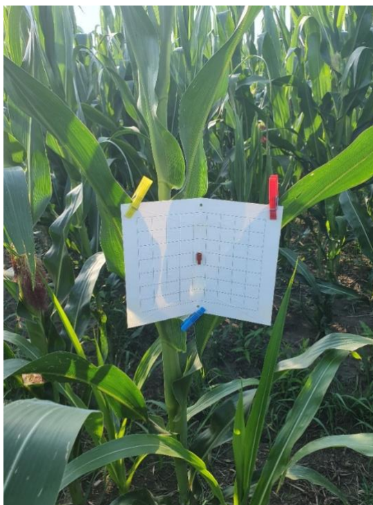
Slika 11. Feromonski mamac postavljen na kukuruзу

Feromonski mamac ( Pherocon insect Monitoring Kit ) je postavljen na stabljiku kukuruza u visini klipa (Slika 11) oko 120 cm iznad tla, na parceli kukuruza površine 29,85 ha u periodu od 20. lipnja 2020. do 01. rujna 2020. Mamac je pregledavan svaka 4 dana, a feromoni su mijenjani svakih 16 dana.