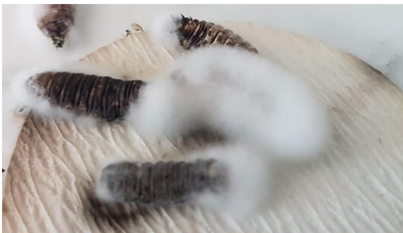
Slika 8. Micelij entomopatogene gljive Beauveria bassiana na gusjenicama voskovog moljca

Osim štetnih organizama u poljoprivrednoj proizvodnji postoje i korisni organizmi. U korisne organizme ubrajaju se entomopatogene nematode (najčešće iz porodica Mermithidae Heterorhabditidae i Steinernematidae), entomopatogene gljive (najčešće iz rodova Beauveria (Slika 8), Hirsutella i Metarhizium ), bakterije (najpoznatija je Bacillus thuringiensis ), virusi (najčešći su CPV, NPV i EPV), te mnogobrojni korisni člankonošci iz različitih redova kukaca i paučnjaka (Ivezić, 2008.; Majić i sur, 2019). Entomopatogene nematode Stenernema kraussei i Steinernema felitae uspješno smanjuju populaciju gusjenica i kukuljica kukuruznog moljca. Virus AcMNPV i RoMNPV pokazuju smanjenje populacije gusjenica kukuruznog moljca za čak 50 % (Kelemen, 2019.).