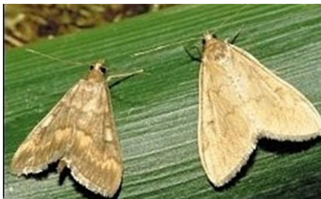
Slika 1. Kukuruzni moljac ( Ostrinia nubilalis ) – mužjak i ženka

Ženke kukuruznog moljca su veće od mužjaka (Slika 1), blijedožute su boje. Mužjaci su tamniji i manji. Gusjenice su blijedožute do ružičaste boje duljine do 25 mm. Rasprostranjena je u sjevernoj Africi, južnoj Aziji, cijeloj Europi, Kanadi i SAD- u. Prezimljuje u stadiju ličinke (gusjenice) u biljnim ostacima. Imago se pojavljuje krajem svibnja. U našim uvjetima ima dvije generacije godišnje (Ivezić, 2008).