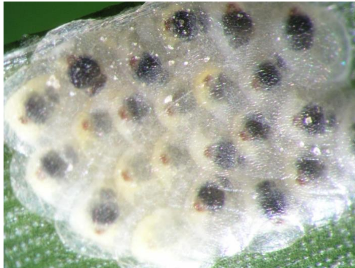
Slika 2. Skupina jaja kukuruznog moljca – faza „blackhead“, pred izlazak gusjenica

Polažu od 2 do 70 jaja u skupini, poslaganih i slijepljenih poput crijepa na krovu na naličju lista kukuruza (Slika 2). Ovipozicija prve generacije počinje krajem svibnja, odnosno u lipnju, a jaja druge generacije mogu se naći u polju od kraja srpnja do rujna. Ličinke prvog stadija se izlegu otprilike nakon 10 dana.