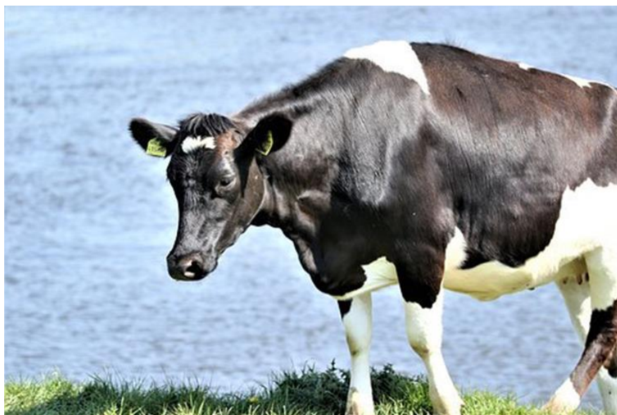
Slika 7. Belgijsko plavo govedo