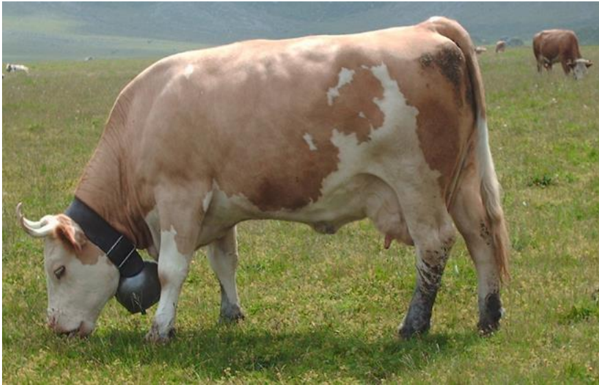
Slika 6. Simantalsko govedo