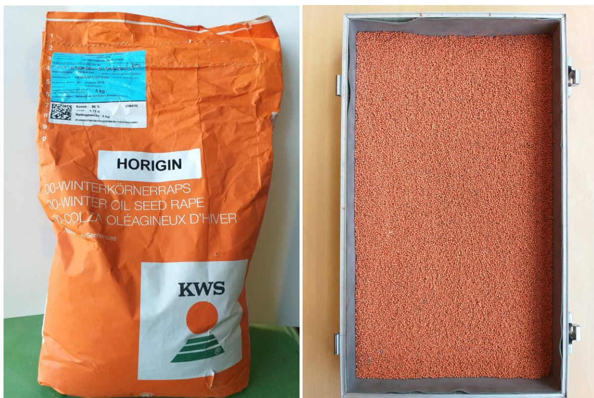
Slika 4. Sjeme KWS hibrida HORIZIN

pogodan za sjetvu u svim rokovima. Tolerantan je na pucanje komuške. Zbog visokog i stabilnog prinosa kroz dugi niz godina jedan je od najperspektivnijih KWS hibrida.