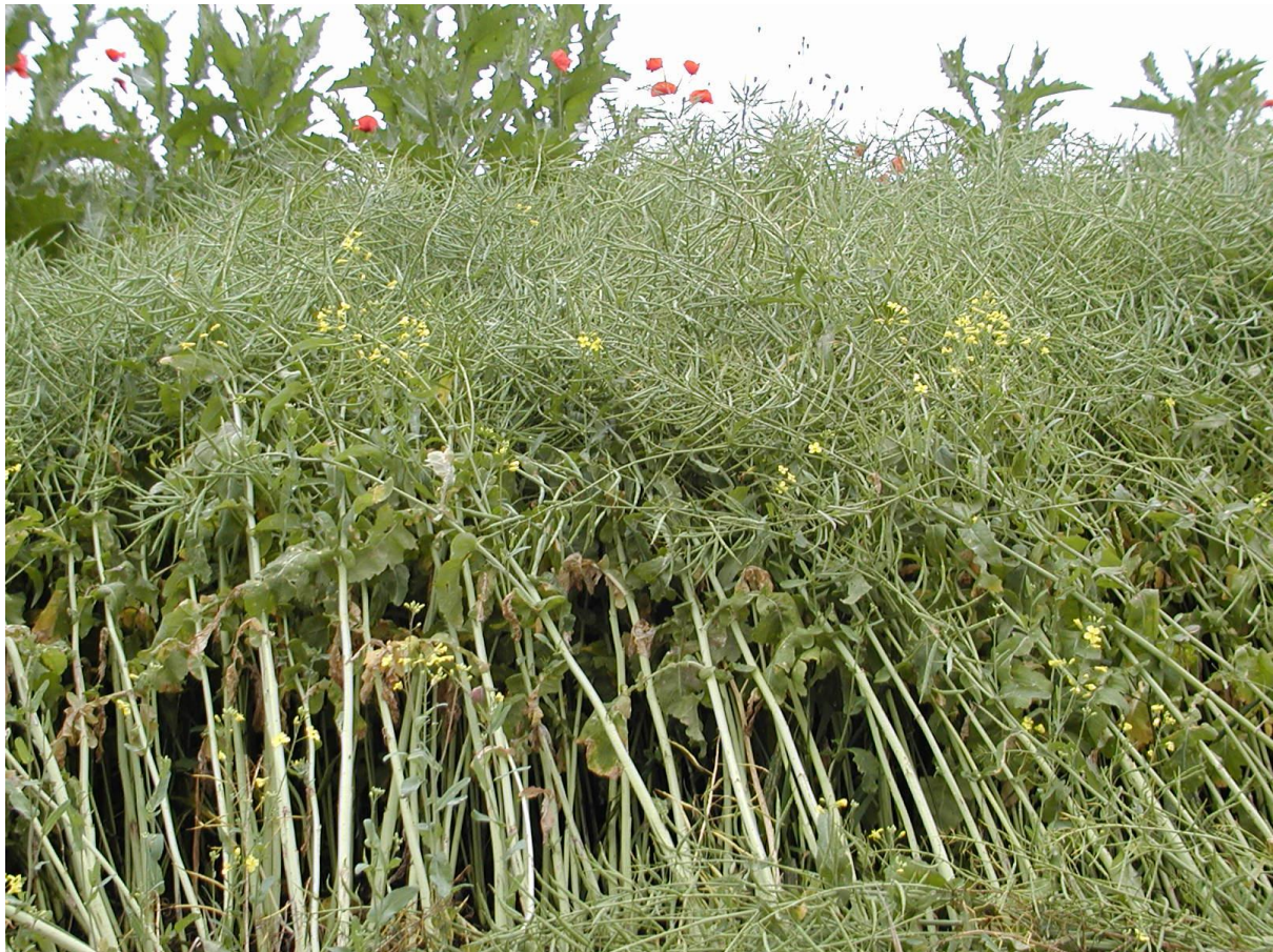
Slika 2. Stabljika i plod uljane repice