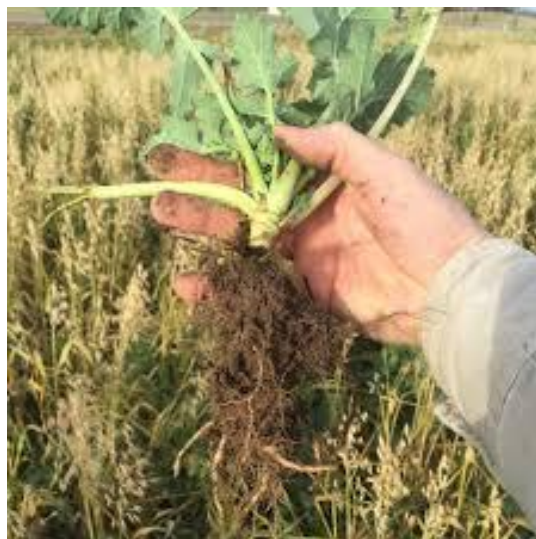
Slika 1. Korijen uljane repice

Uljana repica ima vretenast korijen s izraženim glavnim korijenom iz kojega u gornjem dijelu izbija veliki broj kratkih postranih korjenčića (Slika 1.). Ispod njih izbija nekoliko snažnih dugačkih korjenova. Promatrajući uljanu repicu možemo zaključiti da je u odnosu na nadzemnu masu korijen slabo razvijen.