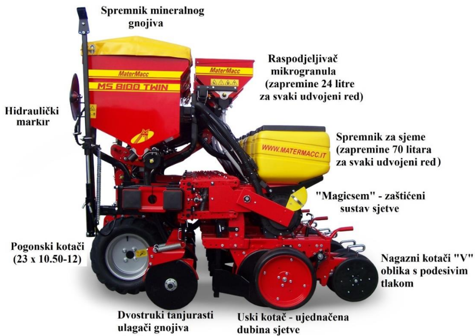
Slika 5. Glavni sustavi sijačice MaterMacc Twin Row – 2