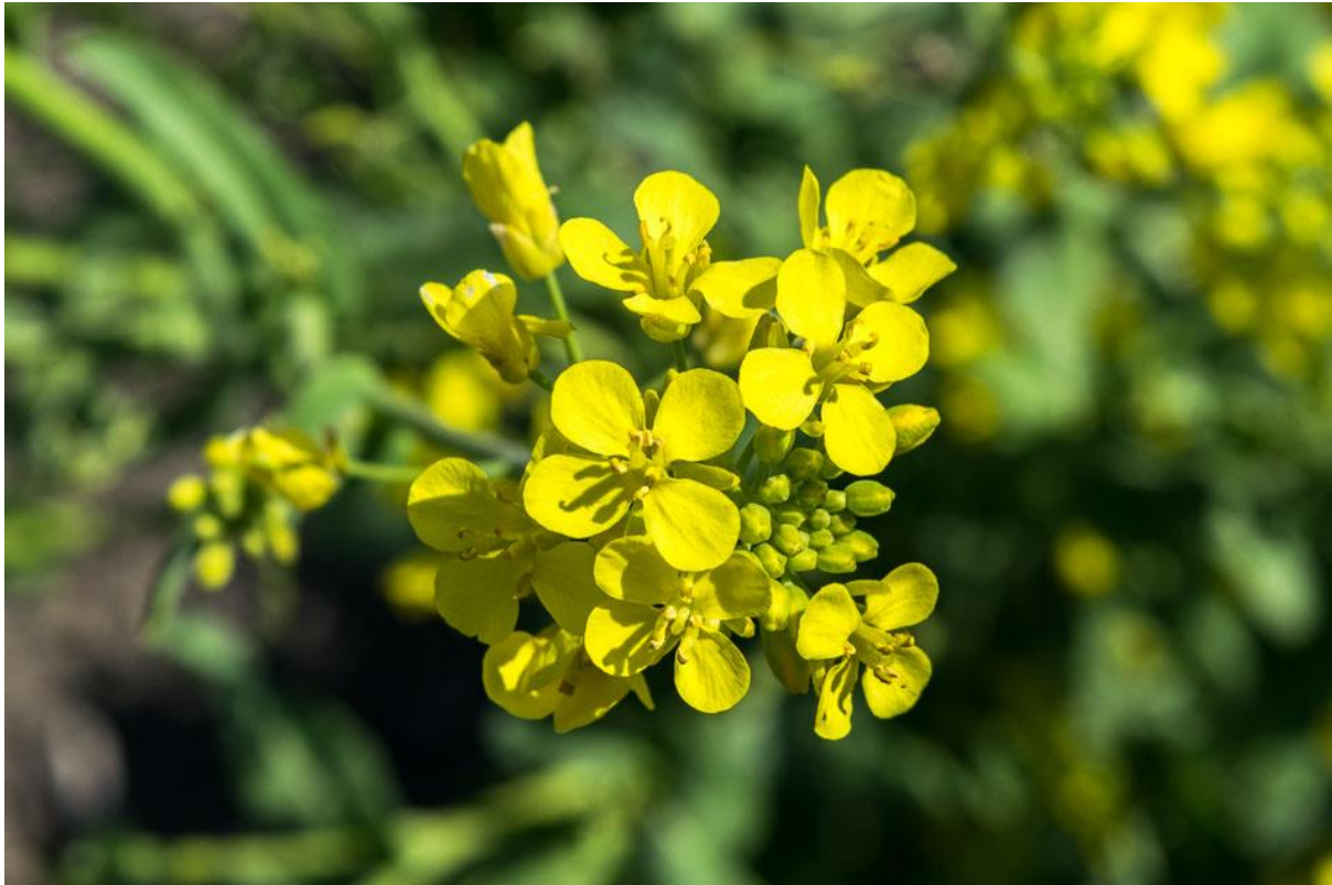
Slika 3. Cvijet uljane repice