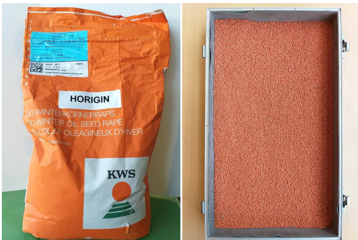
Slika 4. Sjeme KWS hibrida HORIZIN

pogodan za sjetvu u svim rokovima. Tolerantan je na pucanje komuške. Zbog visokog i stabilnog prinosa kroz dugi niz godina jedan je od najperspektivnijih KWS hibrida.