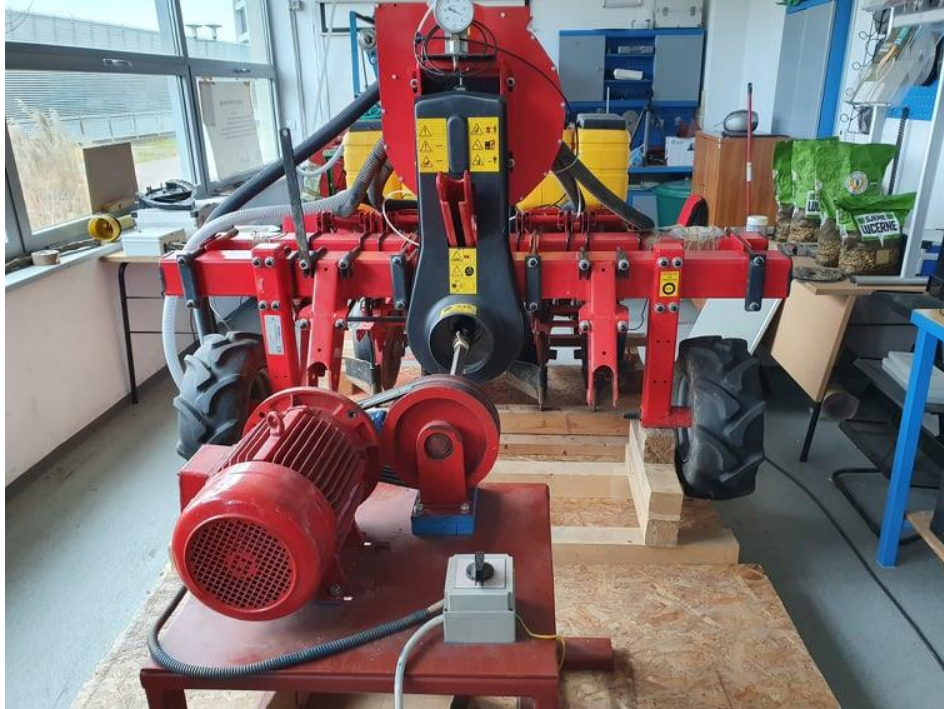
Slika 7. MaterMacc Twin Row-2 sijačica