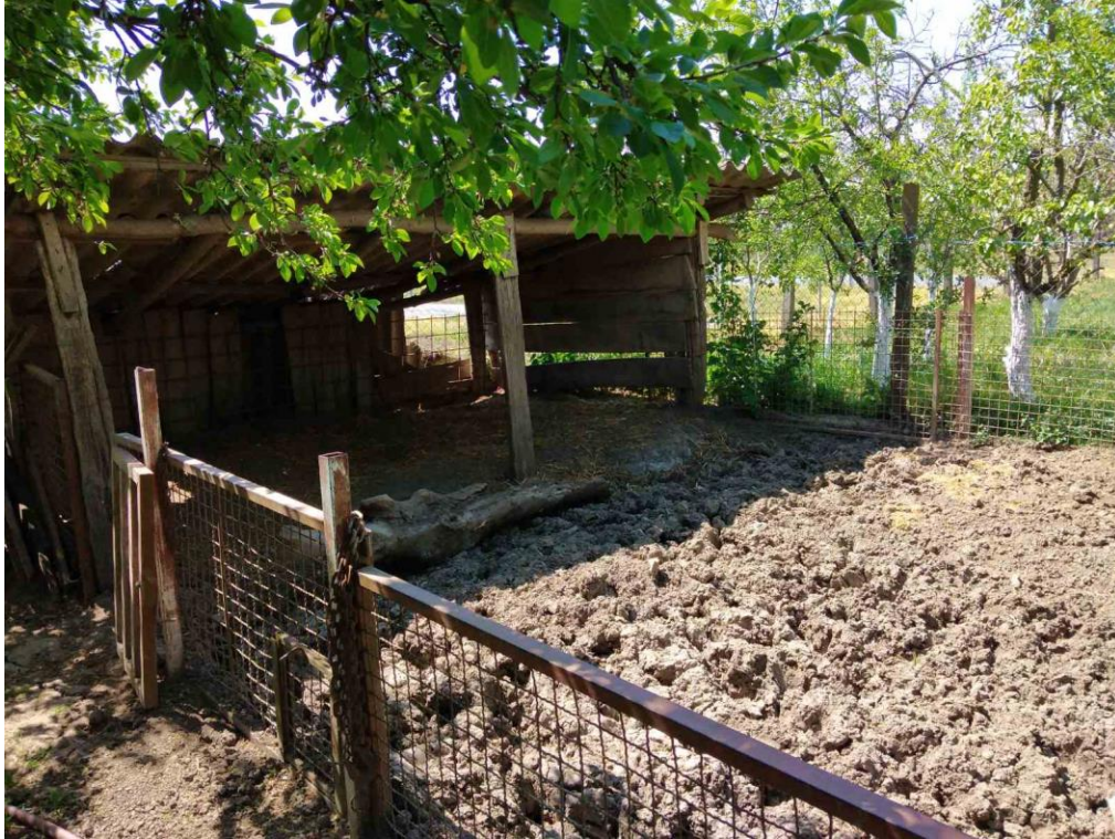
Slika 1. Vanjski ispustna OPG-u Snežana Nešković

Obrok prasadi i odraslih kategorija u tovu mora sadržavati zelenu krmu (lucerna, bundeva, stočna repa, kopriva i sl.), zrno i prekrupu žitarica i leguminoza kao što su kukuruza, ječma i soja. Svježa lucerna se daje kada je u razdoblju pune vegetacije. Obrok krmača, nazmadi i tovljenika sastoji se od 60% kukuruza, 20% ječma i 20% stočnog graška. Obrok za neraste sastoji se od 50% kukuruza, 20% stočnog graška, 20% zobi i 10% ječma. Obrok za prasad sastoji se od 50% kukuruza, 30% stočnog graška i 20% ječma.