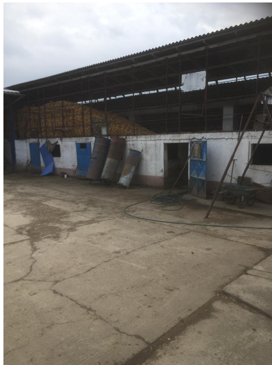
Slika 11. Dvorište OPG Milan Mišanović

opremu, te zbog toga često dolazi do udaranja štapom, lopatom ili drugim alatom od strane farmera što dovodi do ozljeda, krvarenja, straha i još veće agresije kod svinja. Takve situacije mogu dovesti do toga da je svaki idući susret sa farmerom sve stresniji i agresivniji. Farmer prisiljen da drži veći broj tovljenika nego što njegovi objekti mogu prihvatiti, te zbog puno posla i puno tovljenika, ne može udovoljiti svakoj životinji pojedinačno, te ovdje dolazi do frustracija i agresivnog ponašanja prema farmeru i ostalim tovljenicima u boksu.