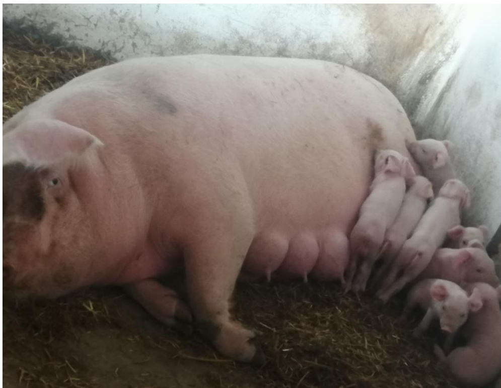
Slika 2. Prasad s krmačom nekoliko dana nakon prasenjana OPG-u Snežana Nešković