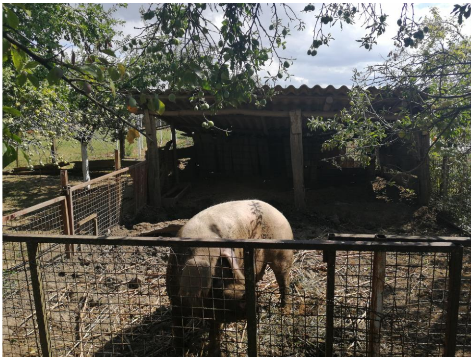
Slika 5. Bređa krmača u vanjskom ispustu na OPG-u Snežana Nešković