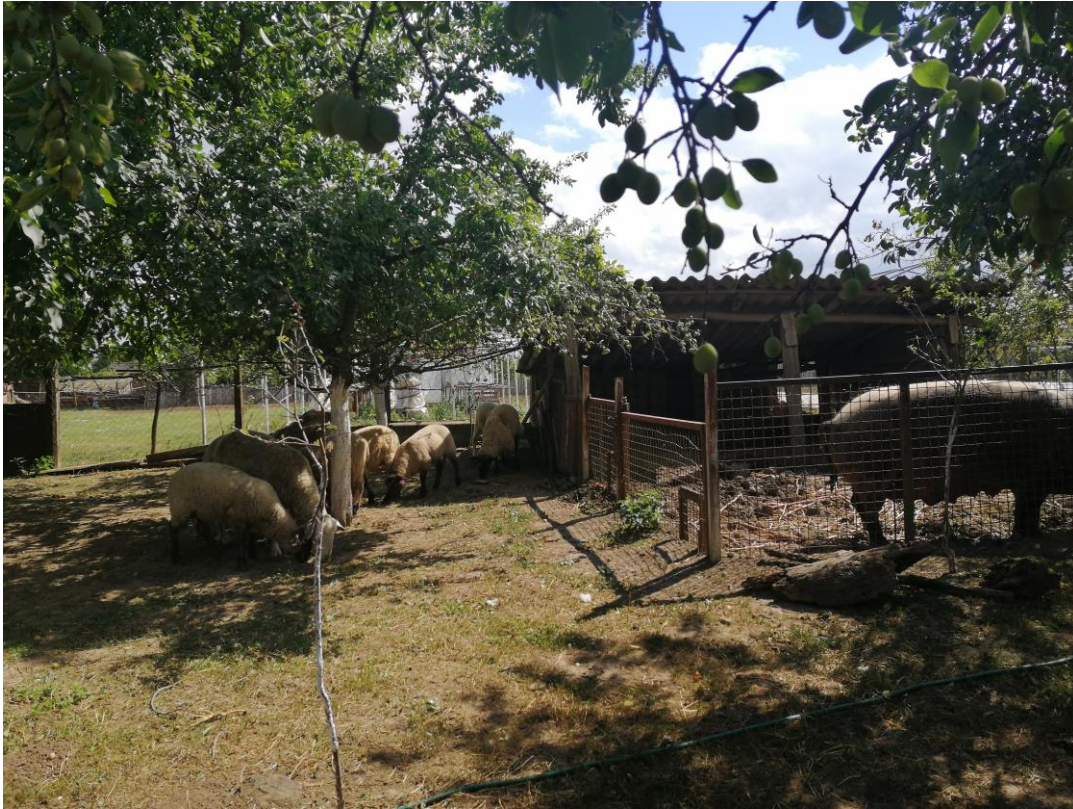
Slika 6: Simbioza s drugim životinjama na OPG-u Snežana Nešković