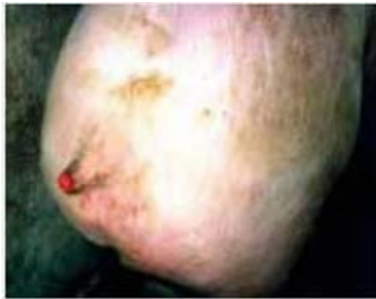
Slika 13. Griženje repova kod svinja