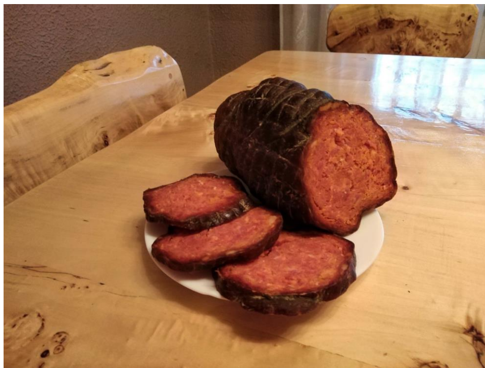
Slika 9. Suhomesnati proizvod od svinja uzgojenih na OPG-u Snežana Nešković