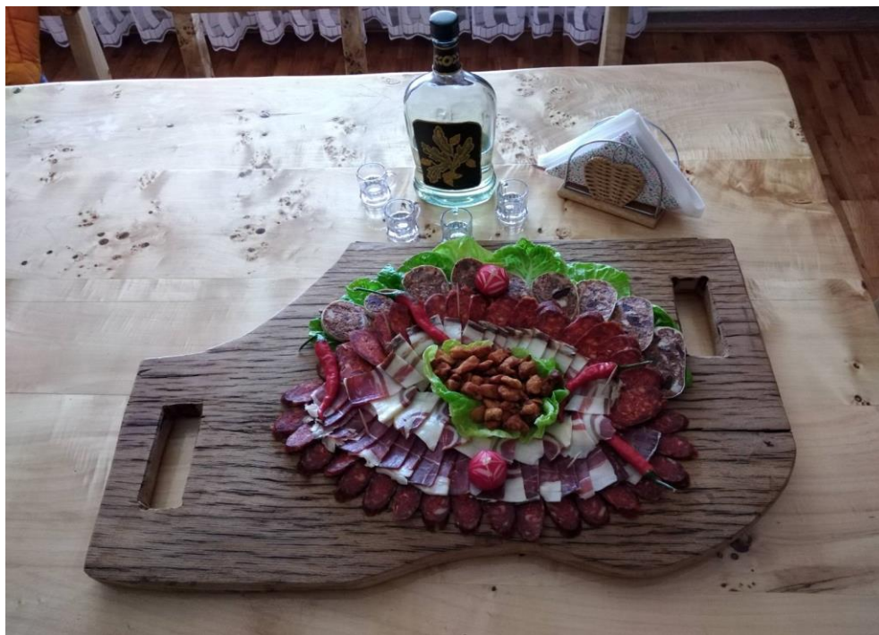
Slika 7. Suhomesnati proizvodi od svinja uzgojenih na OPG-u Snežana Nešković