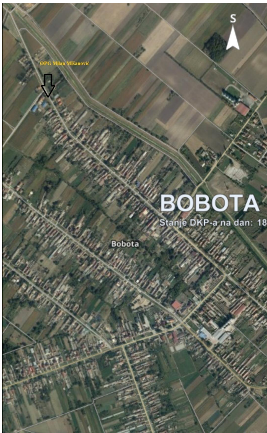
Slika 4. Geografski prikaz mjesta Bobota