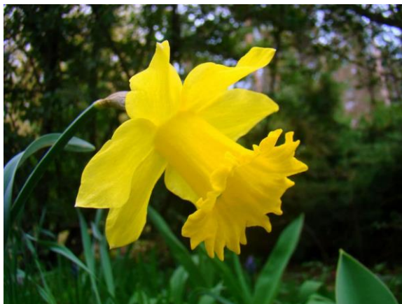
Slika 8. Narcis ( Narcissus pseudonarcissum )

Britanska ili je davno donesena ondje i naturalizirana. U Europi raste na nadmorskoj visini od razine mora do najmanje 1500m, a kod nas ga pronalazimo u divljini u šumama, livadama i travnjacima. U većini umjerenih regija parkove i vrtove krasi mnogi kultivari i hibridi narcisa.