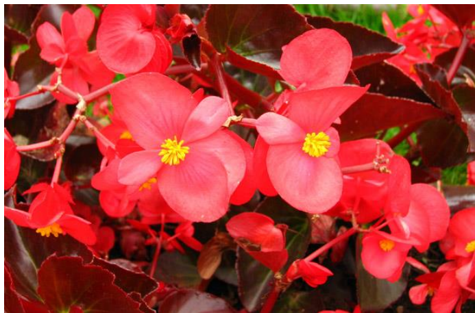
Slika 14. Begonija ( Begonia semperflorens )

Prirodno je rasprostranjena na području Južne Amerike (Brazil, Argentina, Paragvaj, Urugvaj, Peru). Ponegdje u svijetu (Havaji u Sjevernoj Americi, otok La Reunion u južnoj Africi) smatra se invazivnom vrstom i udomaćenom. Prirodni ambijent su joj vlažne tropske šume do 1000 m.n.v. Uzgaja se kao ukrasna biljka u vrtovima i parkovima, te za uzgoj u ukrasnim teglama na balkonima i terasama. Razmnožava se sjemenom i reznicama. Otporna je na vrućine i suha ljeta, no ne podnosi temperature niže od 12 °C te tada umire, premda u proljeće ponovno nikne. Potrebno joj je omogućiti dobro dreniranu zemlju, ne podnosi kada joj se voda zadržava kod korijena. Traži puno sunca ili polusjenu ( https://homeguides.sfgate.com/growing-tips-begonias-67367.html ).