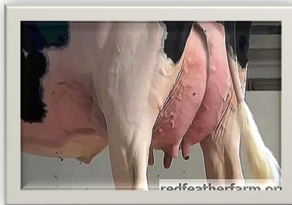
Slika 17. Upala vimena ili mastitis

U liječenju kataralnog i fibroznog mastitisa, nanošenja gline na vimenu krave, dobro se odgajaju odrezci trbušnjaka i stolisnika. Masaža nije potrebna. Obloge s glinom obično se pripremaju preko noći, pažljivo omatanjem vime toplom krpom i toplom tkaninom, stvarajući izolaciju. To oslobađa nekoliko oteklina i ublažava bol. A ujutro se mliječne žlijezde ispiru izvađenim biljem s antibakterijskim učinkom.