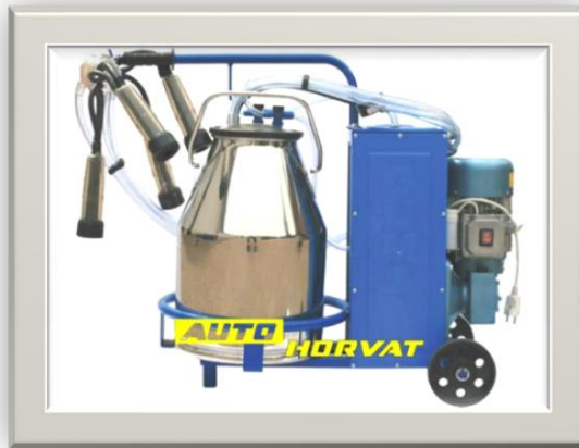
Slika 8. Muzilica za mužnju

https://www.njuskalo.hr/image-bigger/stocarstvo/muzilica-muznju-krava-gumil-93-elketromotorom-slika-62149193.jpg