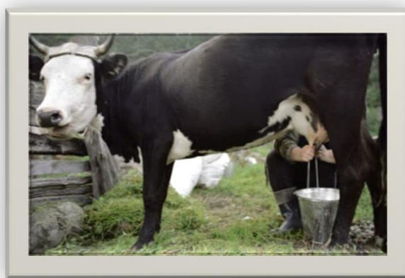
Slika 7. Ručna mužnja

Osim strojne mužnje na manjim gospodarstvima mužnja se može obavljati i ručno. Nedostatak ovoakve mužnje je veći udio ljudske radne snage i veći vremenski period za obavljanje mužnje.