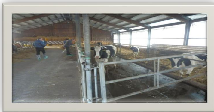
Slika 13. Smještaj junica

Odgoj junica podrazumijeva razdoblje od 6 mjeseci uzrasta jedinke, u izuzetnim slučajevima do prvog teljenja, a u zavisnosti od mogućnosti na poljoprivrednom gospodarstvu. Ova kategorija životinja je u suštini neproizvodna, ukoliko ne računamo na proizvodnju stajnjaka. Kad je u pitanju tehnologija odgoja junica, treba voditi računa o sljedećem: na prvom mjestu je neprestana briga i praćenje ponašanja životinja, ukoliko se radi o većim stadima i stajskom uzgoju, na vrijeme treba izvršiti grupiranje životinja (već sa 250 kg mase tijela), veličina grupa u uzgoju junica u stajama sa slobodnim sistemom držanja treba se kretati od 10 – 30 grla, u cilju smanjenja stresa poželjno je ne mijenja već formirane grupe junica, npr. ubacivanjem novih grla, prilikom odgoja junica na pašnjacima one se mogu grupirati u stada 100 –120 grla.