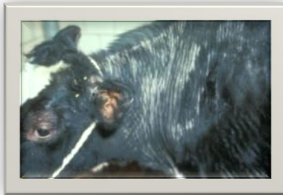
Slika 15. Šuga

https://bestuserschoice.com/img/1707758/kak-i-chem-lechit-chesotku-u-korov-3.jpg