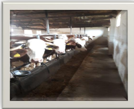
Slika 3. Simentalska pasmina na OPG-u Cerančević (Rohaček, 2019.)

Na OPG-u Cerančević pasmina Simentalac proizvede od 16-20 l mlijeka dnevno ili oko 5000 l godišnje.