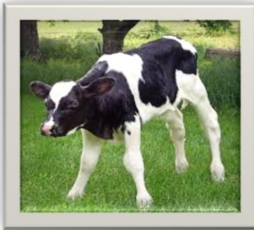
Slika 2. Tele Holstein pasmine (Rohaček, 2019.)

Na Obiteljskom poljoprivrednom gospodratsvu Cerančević, Holstein u prosjeku daje od 7000-8000 l mlijek godišnje.