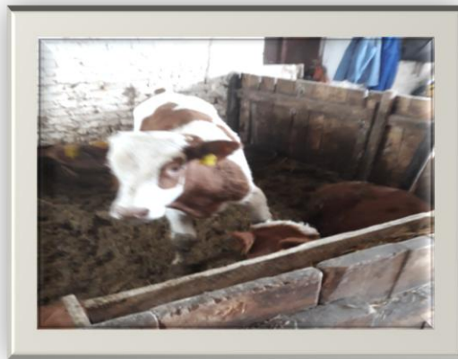
Slika 6. Tele na OPG-u Cerančević (Rohaček, 2019.)

Druga faza - predstavlja aktivno izguravanje teleta kroz matericu i često ne traje dugo. Kontrakcije postaju jače, učestale i veoma uočljive. Dolazi do pucanja vodenjaka i ubrzo i do izlaska nogu teleta. Normalno telenje će progresivno napredovati i biće završeno za 1-4 sata. Ova faza završava samim rođenjem teleta.