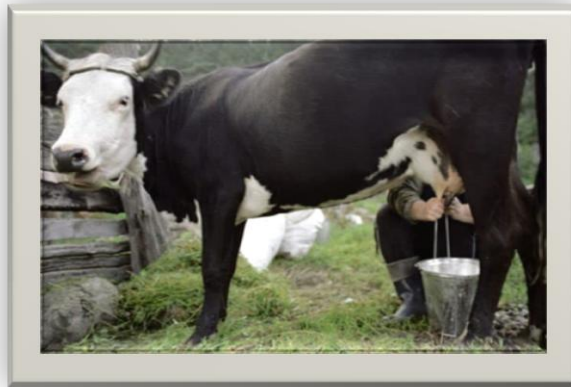
Slika 7. Ručna mužnja

Osim strojne mužnje na manjim gospodarstvima mužnja se može obavljati i ručno. Nedostatak ovoakve mužnje je veći udio ljudske radne snage i veći vremenski period za obavljanje mužnje.