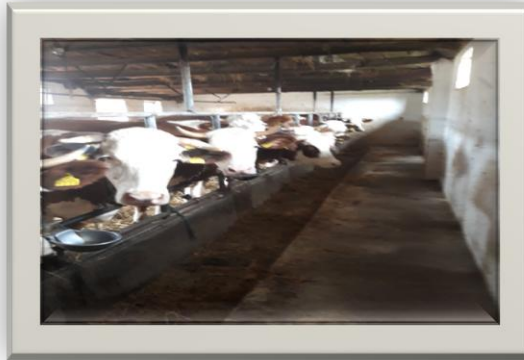
Slika 14. Smještaj muznih krava na OPG-u Cerančević (Rohaček, 2019.)

Na OPG-u Cerančević smještaj se sastoji od dvije štale sa po 10 krava.