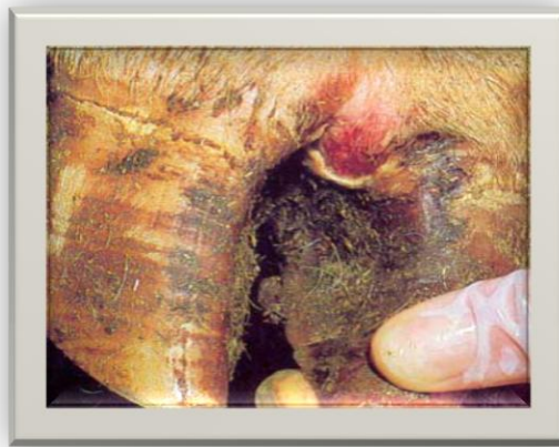
Slika 16. Slinavka i šap

Bolest se manifestira visokom temperaturom te pojavom mjehura po sluznicama usne šupljine, vimenu, vulvi, međupupčanom prostoru, krunskom rubu i oštećenjima sluznice probavnog trakta. Zbog pojave mjehura po ustima, životinja obilno slini, pa otuda i naziv tog oboljenja. Nakon jednog do tri dana mjehuri pucaju i na njihovu mjestu zaostaju rane koje se lako mogu inficirati. Štete koje nastaju ogromne su, ne samo zbog uginuća životinja, već upravo zbog sekundarnih infekcija koje produže vrijeme oporavka životinja, smanjenja mliječnosti i upala vimena, pobačaja i sterilnosti krava.