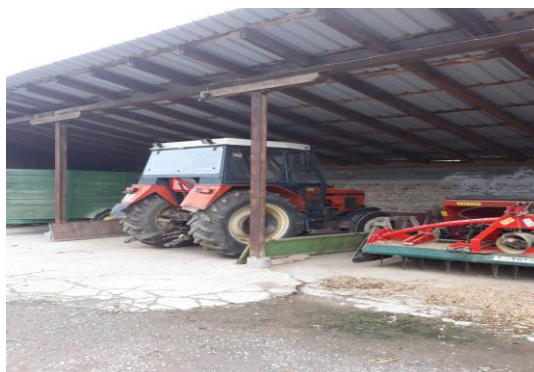
Slika 1. Traktor Zetor na OPG-a (Rohaček, 2019.)

Osnovna djelatnost kojom se obitelj bavi je stočarstvo. Obiteljsko gospodarstvo Cerančević na svom imanju posjeduje 20 goveda. Pasminsku strukturu čine holstein – frizijsko i simentalno govedo. Obitelj posjeduje i obrađuje 43 hektara zemljišta, a sve zasađene površine koriste za stočarstvo te u budućnosti nastoje i proširiti svoju proizvodnju. Od gospodarskih objekata na imanju posjeduju prostor za traktor i strojeve, prostor za skladištenje slame, kukuruza i ostalih žitarice, te smještajni prostor za mliječne krave i junice.