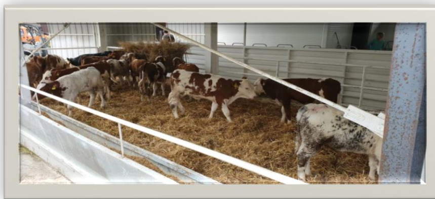
Slika 2. Tov teladi

https://www.njuskalo.hr/image-w920x690/govedarstvo/telad-prodaju-tov-slika-101116708.jpg