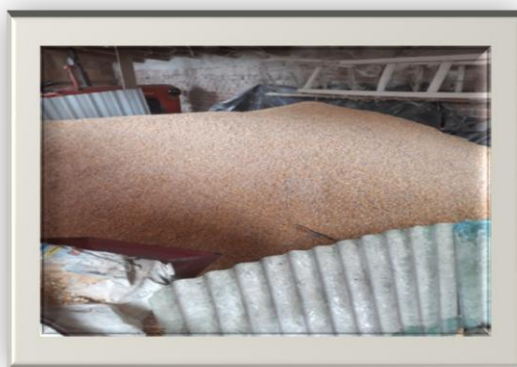
Slika 5. Kukuruz (Rohaček, 2019.)

sačme 0,90 kg, zelena voluminozna krmiva 0,15 kg, koncentracije 0,87 kg. Hranidba krava na OPG-u Cerančević odvija se na način podrazumijeva upotrebu kukuruza, ječma, tritikale i još neki premiksa. Hranidba se odvija 2x dnevno, ujutro i navečer. Zimska hranidba je jednaka s tim da se još dodaje i silaža i to u periodu od 1.10-3. mjeseca. Tako si je vlasnik kombinirao da bih imao dovoljno hrane.