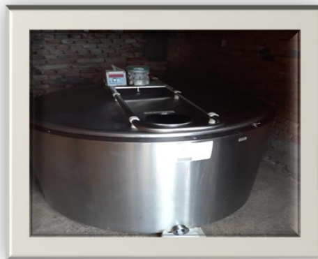
Slika 9. Laktofriz

https://www.njuskalo.hr/image-bigger/stocarstvo/muzilica-muznju-krava-gumil-93-elketromotorom-slika-62149193.jpg