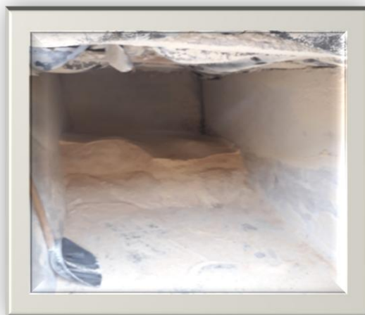
Slika 4. Komponenta u hranidbi (Rohaček, 2019.)

Pravila i intenzivna proizvodnja mlijeka zahtijeva da obroci osim količinski budu i kvalitetno uravnoteženi glede svih energetski, hranjivih i biološko djelatnih tvari. Prema tome, ovo podrazumijeva prethodno normiranje obroka ovisno o reprodukciojskom ciklusu u kojem se krava trenutno nalazi ( suhostaj, puerperij, uvod u mliječnost ili razdoblje pune laktacije). Hranidbom krava na kvalitetnoj paši mogu se zadovoljiti potrebe i osigurati proizvodnja približno 10 kg mlijeka. Bilo bi poželjno da krava ima kvalitetnu i raznovrsnu hranidbu kako bi dobila sve neophodne sastojke u obroku. Potrebe krava za vodom kreću se od 50 do 100 l dnevno, a kod visoko mliječnih krava i do 150 l.