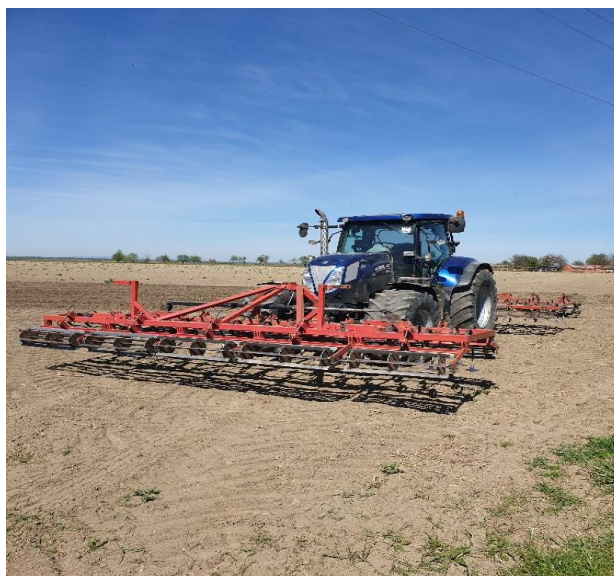
Slika 12. Sjetvospremač

Početak ožujka zatvara se brazda s sjetvospremačem (Slika 12.) te prije same sadnje prolazi se rotodrljačom na dubinu oko 20 cm. Obrada tla rotodrljačom je jako bitna jer je cilj što više usitniti zemlju da nam pri vađenju nema busa na kombajnu.