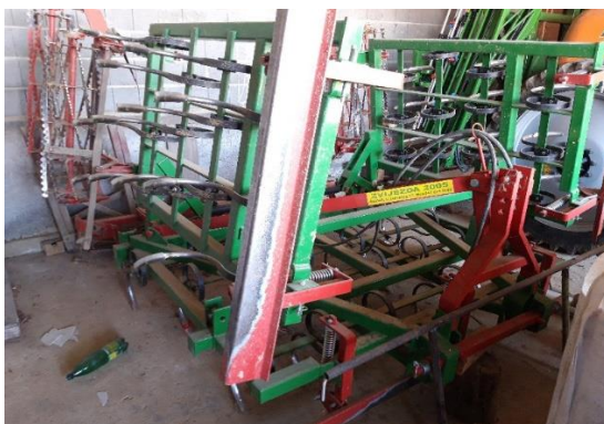
Slika 9. Sjetvospremač „Zvijezda 2005“

Sjetvospremač „Zvijezda 2005“, slika 9., je nošeni sjetvospremač radnog zahvata 5 metara. Zbog mogućnosti lakšeg transporta sjetvospremač ima hidraulički sustav pomoću kojeg se sklapa te omogućuje sigurno gibanje na prometnicama. Stroj se sastoji od četiri reda nepomičnih zubaca koji se nalaze na okviru. Na stražnjem kraju stroja se nalaze dva šuplja nazubljena valjka smješteni jedan iza drugoga. Sjetvospremač se koristi za dopunsku obradu i pripremu tla za sjetvu kada je to potrebno. Na gospodarstvu se nalazi od 2018. godine.