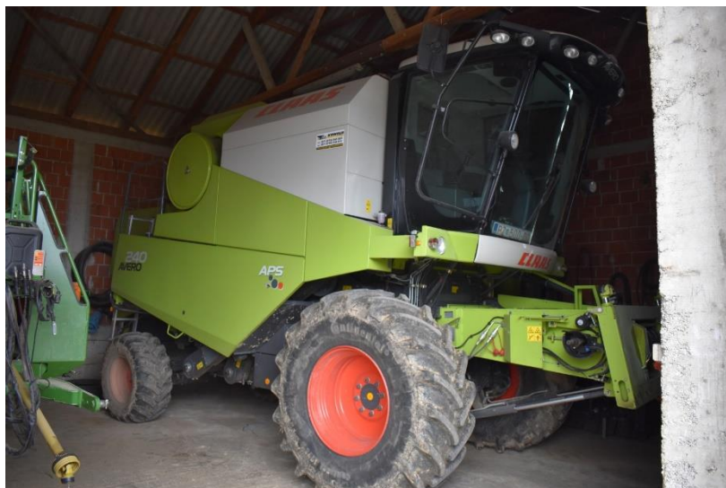
Slika 17. Garažiranje kombajna na „P.P. Marić“

Strojevi se na „P.P. Marić“ garažiraju u zatvorenom i poluzatvorenom prostoru. U zatvorenom prostoru su garažirani traktori, kombajn, žitni heder i kukuruzni adapter.