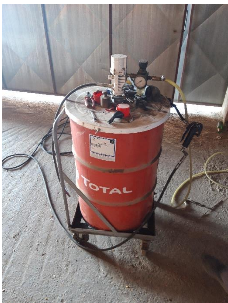
Slika 2. Pneumatski podmazivač