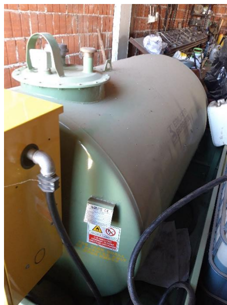
Slika 3. Cisterna za gorivo