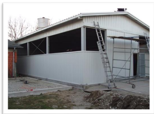
Slika 2. Otvoreni tip tova