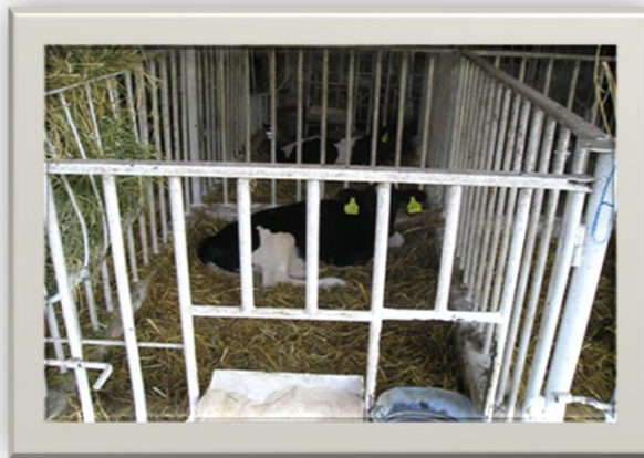
Slika 1. Boks za telad

slučaju ne smije propustiti. U pravilu, telad nakon poroda treba smjestiti u posebnu prostoriju odvojeno od majke. Stelja se u boksovima teladi mijenja svaki dan. U telićnjaku je poželjna temperatura 10 - 15 °C, a relativna vlaga 70 - 80%. Hladne i vlažne staje s propuhom stalna su opasnost po zdravlje teladi. Lakši inzulti, kao prehlade ili poremećaji probavnih organa, smanjuju njihovu otpornost. Oni predstavljaju početni udar na koji se često u lančanom nizu nadovezuje raznorazna patologija. U pravilu, suha hladnoća ne škodi, ali vlažna predstavlja veliku opasnost. Prema tome hladnoća se može do izvjesne mjere tolerirati, ali nikako ne i vlaga. Mnoge bolesti koje prate telad u prvoj fazi života izložena su infekcijama. One su posljedica nedovoljne higijene, loših uvjeta smještaja i prehrane. Točnije rečeno, posljedica su nemara onih koji su dužni voditi brigu o teladi. U suvremenoj hranidbi teladi sve se više upotrebljavaju razni mliječni nadomjesci. Uspješno služe ako im je kvaliteta bez prigovora po sastavu i svježini. Kako je volumen sirišta malen (1 - 1,5 l), obroci moraju biti količinski izmjereni. Prvi tjedan telad se češće hrani, ali u manjim količinama, kasnije se broj obroka smanjuje, a količina povećava (4 - 6. tjedna 3 puta dnevno po 3 - 4 ili 5).