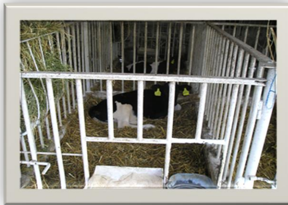
Slika 1. Boks za telad

slučaju ne smije propustiti. U pravilu, telad nakon poroda treba smjestiti u posebnu prostoriju odvojeno od majke. Stelja se u boksovima teladi mijenja svaki dan. U telićnjaku je poželjna temperatura 10 - 15 °C, a relativna vlaga 70 - 80%. Hladne i vlažne staje s propuhom stalna su opasnost po zdravlje teladi. Lakši inzulti, kao prehlade ili poremećaji probavnih organa, smanjuju njihovu otpornost. Oni predstavljaju početni udar na koji se često u lančanom nizu nadovezuje raznorazna patologija. U pravilu, suha hladnoća ne škodi, ali vlažna predstavlja veliku opasnost. Prema tome hladnoća se može do izvjesne mjere tolerirati, ali nikako ne i vlaga. Mnoge bolesti koje prate telad u prvoj fazi života izložena su infekcijama. One su posljedica nedovoljne higijene, loših uvjeta smještaja i prehrane. Točnije rečeno, posljedica su nemara onih koji su dužni voditi brigu o teladi. U suvremenoj hranidbi teladi sve se više upotrebljavaju razni mliječni nadomjesci. Uspješno služe ako im je kvaliteta bez prigovora po sastavu i svježini. Kako je volumen sirišta malen (1 - 1,5 l), obroci moraju biti količinski izmjereni. Prvi tjedan telad se češće hrani, ali u manjim količinama, kasnije se broj obroka smanjuje, a količina povećava (4 - 6. tjedna 3 puta dnevno po 3 - 4 ili 5).