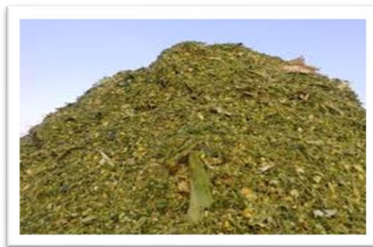
Slika 4. Silaža

Treba uzeti u obzir mehaničke, fizičko-kemijske i biološke karakteristike hrane. U mehaničke faktore ubrajamo preobilno hranjenje, proždrljivost i strana tijela. Do preobilnog hranjenja često dolazi kod teladi, ali i kod starijih grla. Posljedice su smetnje u probavi, poremećaji koji traju kraće ili duže vrijeme. Takvi slučajevi nastupaju ako se životinje neredovito hrane ili pri prijelazu s jedne na drugu vrstu hrane. Do sličnih poremećaja dolazi kada je jednolična hrana učestala, pa se naglo prijeđe na krmiva bogata ugljikohidratima ili bjelančevinama. U hrani se često nađu razni predmeti (žica, drvo, pijesak i sl.), što je posljedica lošeg održavanja na polju ili u skladištu. Od fizikalno-kemijskih faktora značajni su temperatura, deficit u mineralima i vitaminima, štetnost pojedinih krmiva i otrovno bilje.