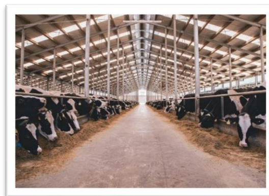
Slika 3. Zatvoreni tip tova

Ventilacija ima izuzetno značenje u higijeni smještaja. Tokom dana u staji se nakupljaju velike količine plinova (ugljični dioksid, amonijak, sumporovodik i dr.) i pored postojećih uređaja i održavanja čistoće. U toku dana također nastaju znatne promjene i fizički odnosi u stajskom zraku, a to dolazi do izražaja u vlazi i temperaturi. Povoljni uvjeti i svježina zraka se održavaju redovnim čišćenjem i ventilacijom staje. Ventilacija je uvelike povezana s potrebama životinja u toku dana i obujmom prostora koji otpada na jedno grlo (15- 20 m 3 ).