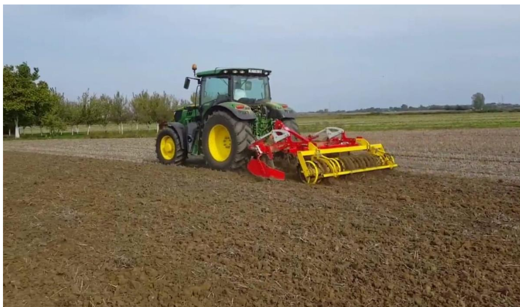
Slika 6. Osnovna obrada tla

Osnovna obrada tla je obavljena nakon žetve soje rahljenjem zemljišta traktorskim agregatom za rahljenje „Pottinger Synkro 3020“ priključenim na traktor „John Deere 613R“ snage 99 kW (Slika 6.). Obrada je izvršena na dubinu od 25 cm u dva prohoda. Konstrukcija samoga agregata omogućuje kvalitetnu obradu tla u kojoj se žetveni ostaci miješaju s tlom. Osnovno oruđe za obradu tla ovoga agregata su noževi postavljeni na sedam vertikalnih nosača te valjak koji se sastoji od obruča u obliku slova „V“, što omogućuje mrvljenje tla te ravnanje obrađene površine.