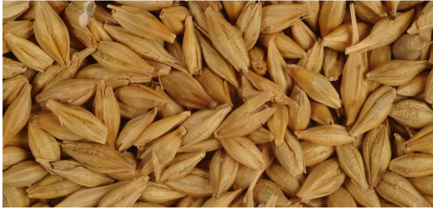
Slika 4. Zrno ječma