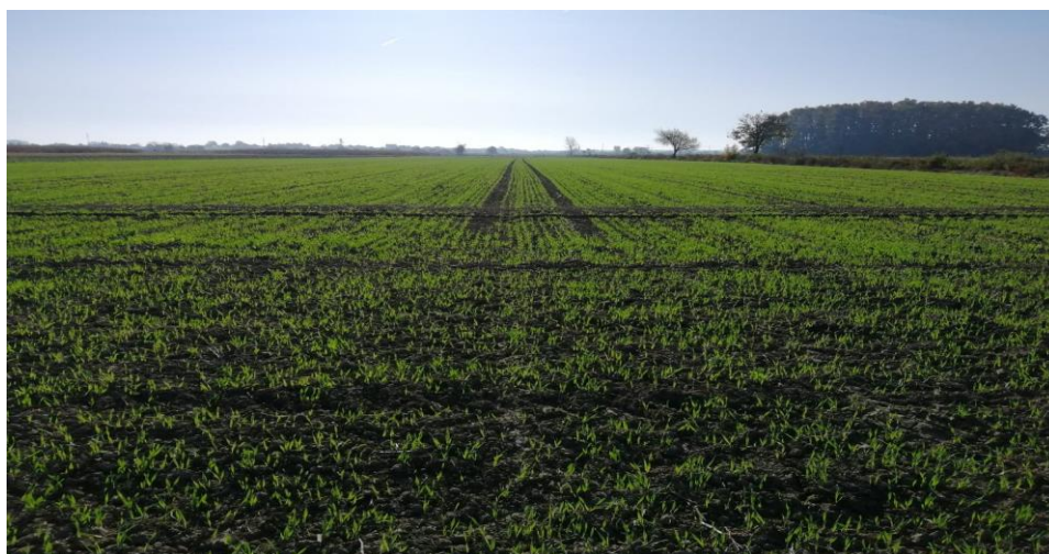
Slika 5. Polje ječma u fenološkoj fazi nicanja

Gospodarstvo u planu ima povećanje površina zasijanih ječmom u nadolazećim godinama zbog relativno malih ulaganja i dosta visokih prinosa. Na slici 5. prikazano je polje ječma na obiteljskom poljoprivrednom gospodarstvu „Marija Kovač“ iz Cerne.