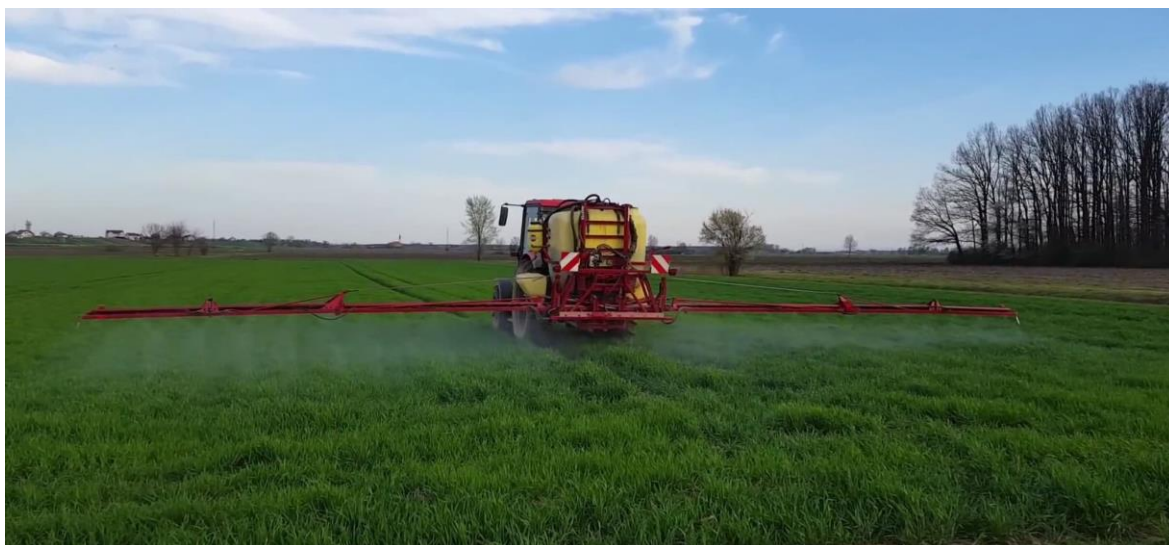
Slika 7. Zaštita ječma od bolesti

Zaštita ječma od bolesti na površinama OPG-a „Kovač Marija“ vrši se preventivno primjenom sredstva „Priaxor EC“ (Slika 7.). Sredstvo se primjenjuje u razdoblju kada su povoljni uvjeti za razvoj bolesti, od sredine busanja do kraja cvatnje u količini 1 L/ha uz utrošak od 100-300L vode. Dozvoljene su dvije primjene tijekom vegetacije ovim sredstvom s razmakom tretiranja od 21 dan. Prva zaštita izvršena je tijekom busanja 18. ožujka, a druga pred klasanje usjeva 09. travnja u količini 1 L/ha uz utrošak 200 L vode. Ovaj način tretiranja i primjene sredstva za zaštitu pokazao se učinkovit, te daljnjim praćenjem usjeva nije ustanovljena pojava bolesti.