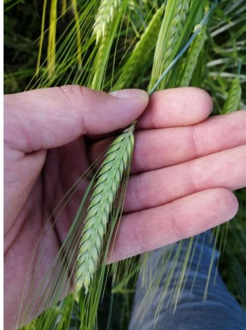
Slika 3. Klas ječma

cvijeta tzv. bazalnu četkicu, koja je pokrivena gustim ili rijetkim, dužim ili kraćim dlačicama i služi kao jedna od važnih osobina za raspoznavanje zrna dvorednog i višerednog ječma kao i za raspoznavanje sorti. Tučak je ženski spolni organ, a sastoji se od plodnice i dvopere njuške. Rasperjana njuška tučka omogućava bolji prihvat peludnih zrna. Prašnici su muški spolni organi, a ječam ih ima tri.