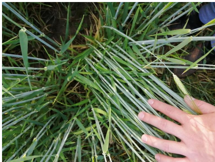
Slika 2. Stabljike ječma

Stabljika – je šuplja, člankovita i cilindrična (Slika 2.). Razvija 5-6 članaka. Boja koljenaca je do sazrijevanja zelena ili ljubičasta, a poslije slamnato-žuta. Boja stabljike je zelena ili ljubičasto-zelena od antocijana. U punoj zriobi dobije slamnato-žutu boju. U odnosu na stabljike drugih žitarica stabljika ječma je manje otporna na polijeganje (osim patuljastih sorti).