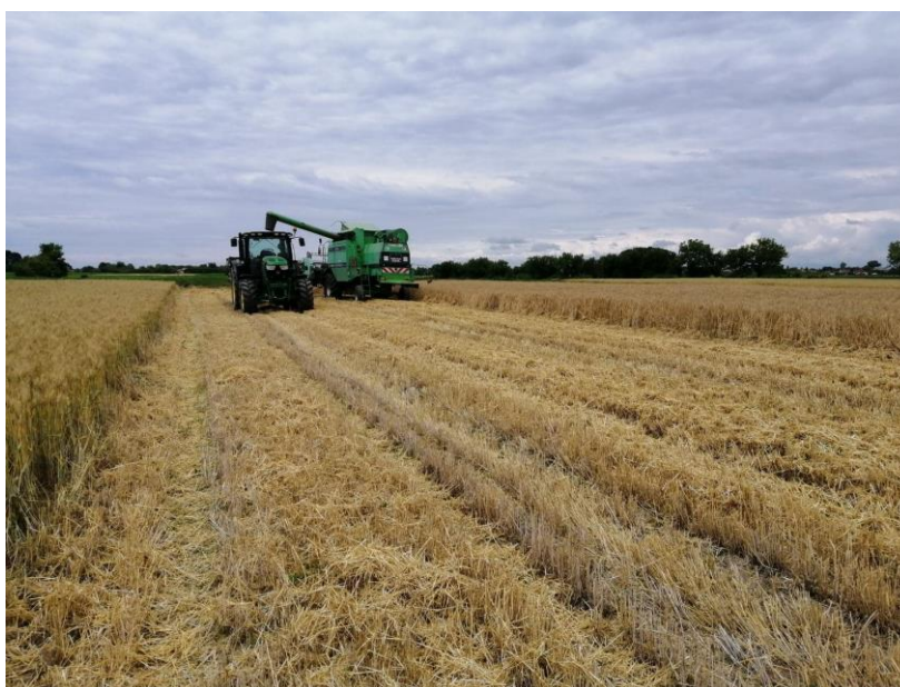
Slika 8. Žetva ječma

Žetva ječma je izvršena 19. i 20. lipnja, jednofazno žitnim kombajnom „Deutz fahr M3580“ (Slika 8.). Sav urod zrna odvezen je kod partnera „PIK Vinkovci d.o.o.“ u mjestu Retkovci. Za odvoz korišten je traktor „John Deere 6135R“ s prikolicom nosivosti 15 t, te traktor „Zetor 9540“ s prikolicom nosivosti 8 t. Ovakvim načinom organizacije odvoza nije dolazilo do zastoja u žetvi. Ukupan urod zrna s 11 ha iznosio je 72,6 t, dok je prosječan prinos ječma iznosio 6,6 t/ha uz vlagu zrna 13,4-13,8 %. Lalić i sur. (2009.) ispituju 14 sorti ozimog ječma (uključujući sortu „Barun“) i nalaze njihov prosječan prinos zrna od 6,80 t/ha (prosjek za sortu „Barun“ iznosi 7,34 t/ha), što je nešto više nego u ovom istraživanju. Gotovo dvostruko niže prinose zrna (u prosjeku tri godine) od 3,74 t/ha u istočnoj Hrvatskoj bilježe Iljkić i sur. (2010.). Isto tako, nešto niže prinose od postignutih na ovom gospodarstvu nalaze Rapčan i sur. (2012.) od 5,5 t/ha.