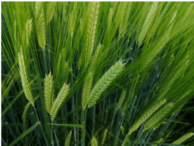
Slika 1. Ječam

Ječam ( Hordeum vulgare L.) je žitarica iz porodice trava ( Poaceae ) te zauzima peto mjesto u svjetskoj proizvodnji žitarica (Gagro, 1997.) (Slika 1.).