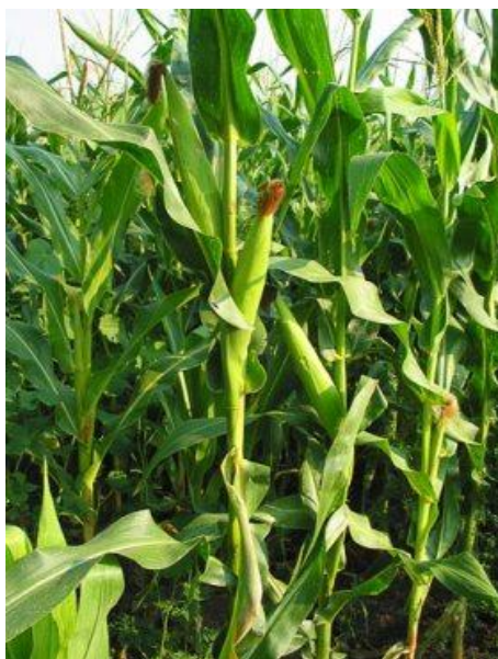
Slika 2. Stabljika kukuruza

Listovi – razlikuju se klicini listići, pravi listovi ili listovi stabljike te listovi omotača klipa ili listovi "komušine". Klicini listovi imaju svoje začetke u klici sjemena. Ima ih 5-7, a potpuno se razviju u prvih 10-15 dana nakon nicanja kukuruza. Pravi listovi nalaze se na stabljici. Na svakom koljencu nalazi se po jedan list, pa njihov broj varira kao i broj koljenaca. Srednje kasni hibridi formiraju 18-21 listova. Listovi omotača klipa ili listovi "komušine" imaju zaštitnu ulogu, jer štite klip i zrna na njemu.