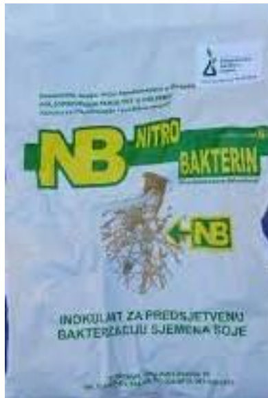
Slika 2. Komercijalno pakiranje nitrobakterina