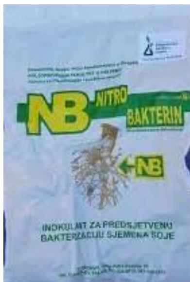
Slika 2. Komercijalno pakiranje nitrobakterina