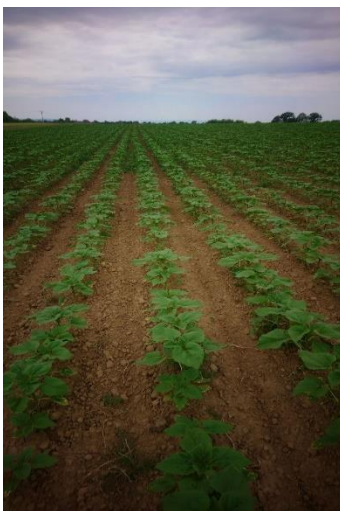
Slika 6. Usjev suncokreta u drugoj polovini svibnja

Suncokret vuče korijene iz Sjeverne Amerike, ondje je njegovan prije kukuruza i uzgajan tisućama godina. U Europu dolazi s šireg područja Novog Meksika i to u Španjolsku početkom 16. st. U Rusiji su izgrađene prve tvornice za dobivanje ulja iz suncokreta i nedugo nakon toga počele su se proširivati poljoprivredna zemljišta zasijana upravo tom ratarskom kulturom i tada je počelo prvo oplemenjivanje. Osim uzgajanja suncokreta u Europi i Sjevernoj Americi, uzgoj se proširio u Aziju, Južnu Ameriku i Australiju, te je danas postao jedna od najznačajnijih kultura u svjetskoj proizvodnji ulja. Proizvodnja suncokreta u Hrvatskoj je započela u dvadesetom stoljeću, izgradnjom dvaju tvornica ulja u Zagrebu 1916. godine i u Čepinu 1934. godine.