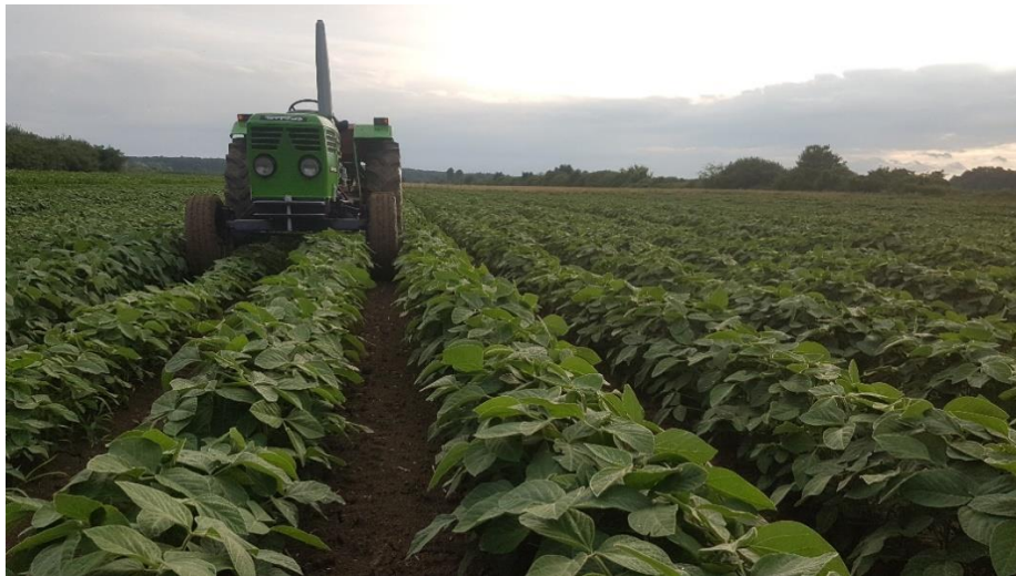
Slika 4. Međuredna kultivacija soje

Međuredna kultivacija (Slika 4.) primjenjuje se u širokorednim usjevima soje (međuredni razmak 50 cm) najčešće višekratno, ovisno o stanju usjeva i tipu tla. U Hrvatskoj se najčešće provode dvije kultivacije. Prva kultivacija obavlja se od faze prve troliske pa do faze zatvaranja redova. Druga kultivacija obavlja se kada stabljika soje dostigne visinu od oko 30 cm i izvodi se pliče u odnosu na prvu kultivaciju. Kultivacija se obavlja kultivatorima s dozatorima za kruta dušična gnojiva pa se tako kultivacijom obavlja prihrana soje, mehanički se uništavaju korovi te se razbija pokorica i poboljšava se vodozračni režim tla.