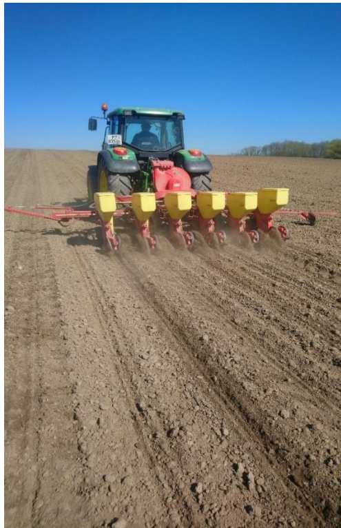
Slika 7. Sjetva suncokreta

Prije početka sjetve suncokreta bitno je odabrati hibrid koji će zadovoljiti uvjete proizvodnog područja, to bi podrazumjevalo da ima veliki potencijal rodnosti s vrlo visokim udjelom ulja u sjemenu suncokreta, maksimalnu otpornost na bolesti koje napadaju biljku, sušu i štetnike. U Slavoniji se najčešće siju srednje rani i srednje kasni hibridi. Gospodarstva s većim poljoprivrednim površinama savjetuje se sjetva dva ili više hibrida različite duljine vegetacije. (Pospišil, 2013.). Najranija sjetva može se obavljati već početkom travnja, kada sjetveni sloj dosegne 8 °C. Posljedice ranije sjetve su dulje klijanje i nicanje i uz to prorijeđeni sklop. Sjetva suncokreta obavlja se na međuredni razmak 70 cm, a razmak u redu je uobičajeno od 25 do 30 cm, dok je dubina sjetve od 4 do 6 cm (Slika 7.).