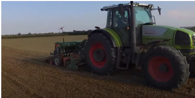
Slika 9. Sjetva uljane repice

Kod rane sjetve se prilikom jesenjeg porasta razvije prebujan usjev i takve biljke su slabije otporne na zimske neprilike. Kod prekasnog roka sjetve je još negativniji utjecaj jer biljke ulaze u zimski period nedovoljno razvijene s malo rezervne tvari u stabljici i korijenu (Todorčić i Gračan, 1990.). Pošto imamo i hibride i sorte, broj biljaka u sjetvi za hibride iznosi 30 – 50 biljaka/m 2 , a kod sorata 50 – 70 biljaka/m 2 (Pospišil, 2013.).