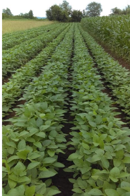
Slika 1. Usjev soje sredinom lipnja

Soja ( Glycine max (L). Merr.) je stara ratarska kultura koja se uzgaja više od četiri tisuće godina, a danas je vodeća uljna i bjelančevinasta kultura čije se zrno koristi kao izvor ulja i bjelančevina za ishranu ljudi i stoke te za razne industrijske svrhe (Slika 1.). Soja pripada redu Fabales , porodici Leguminosae , podporodici Papilionatae i rodu Glycine . Sama vrsta Glycine max obuhvaća veliki broj podvrsta koje su se razvile u različitim arealima, odnosno u različitim klimatskim uvjetima i na različitim vrstama tala (Vratarić i Sudarić, 2008.).