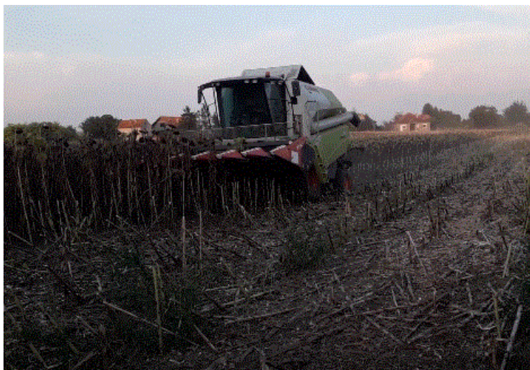
Slika 8. Žetva suncokreta početkom rujna

Krajem kolovoza, početkom rujna obavlja se žetva suncokreta (Slika 8.), odnosno za vrijeme tehnološke zriobe sjemena. Žetva počinje kada je vlaga u sjemenu od 11 do 12%, ako pri mjerenju vlage postotak bude veći od 8% potrebno je provesti dodatno sušenje, koje ukoliko nema vlastite sušare daje dodatne troškove. Nakon žetve sjeme se čisti, po potrebi suši i skladišti. Prinos sjemena suncokreta je obično 2,3-3,1 t/ha (Pospišil, 2013.). Žetva se obavlja žitnim kombajnom uz promjenu adaptacije te podešavanje razmaka podbubnja i bubnja, brzinu okretanja bubnja te vjetar (Gagro, 1998.). Suncokret se može koristiti i za zelenu masu te silažu, a žetva ili košnja izvodi se silokombajnom. Za zelenu masu suncokret se kosi neposredno pred cvatnju, a za silažu u cvatnji (Pospišil, 2013.).