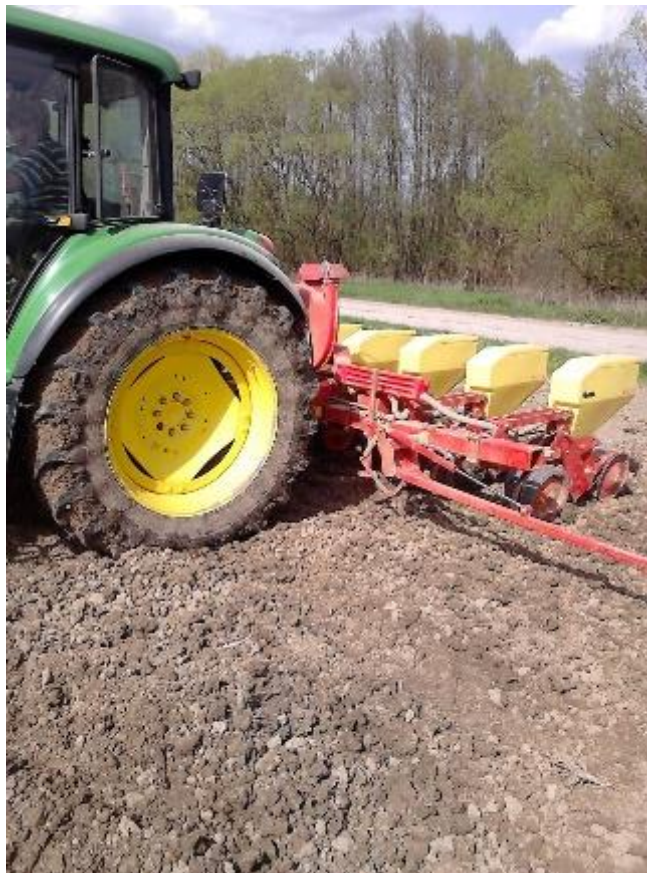
Slika 3. Sjetva soje pneumatskom sijačicom

Sjetva (Slika 3.) se najčešće obavlja pneumatskim sijačicama na međuredni razmak od 45 ili 50 cm. U Hrvatskoj su najzastupljenije OLT PSK sijačice koje se lako podešavaju i prikladne su za manje i veće posjede.