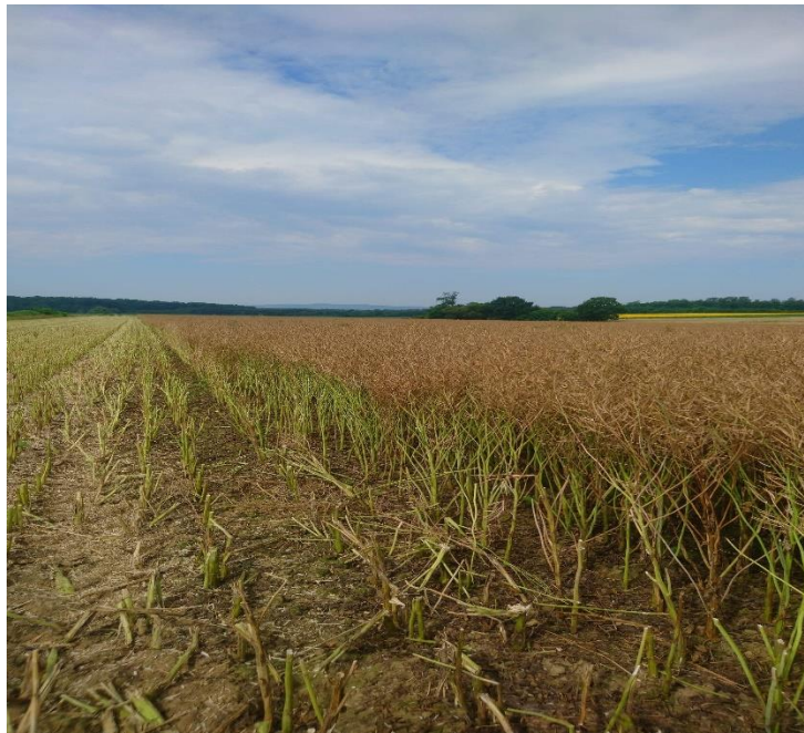
Slika 10. Usjev uljane repice tijekom žetve

Uljana repica najčešće dozrijeva u drugoj polovini lipnja (Slika 10.). Žetva se obavlja u fazi tehnološke zriobe, odnosno kada vlaga sjemena uljane repice padne ispod 12%. Tijekom žetve dolazi i do problema, jer uljana repica ne dozrijeva jednako, zrele komuške lako pucaju i sjeme se osipa. Početak žetve trebao bi početi kada se lišće osuši, stabljika postane žućkasta i komuške poprime žuto-smeđu boju i krenu pucati. Nakon izvršene žetve sjeme uljane repice uvijek ima više vode, pa ga je stoga potrebno osušiti kako bi imalo manje od 8% vode i da se kao takvo može očuvati. Prinosi uljane repice se kreću između 2 – 3 t/ha, međutim, dobrom agrotehnikom se prinos može povećati na 3 – 4 t/ha (Gagro, 1998.). Žetva se obavlja žitnim kombajnom, koji se prije same žetve treba pripremiti. Priprema kombajna se obavlja tako da se na žitni adapter montira stol za uljanu repicu s bočnim kosama, smanji se broj okretaja vitla te se podesi broj okretaja bubnja.