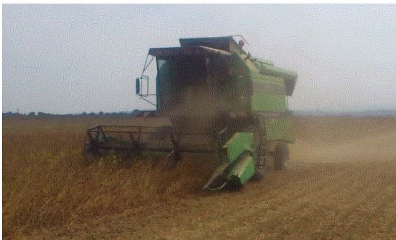
Slika 5. Žetva soje

Žetva soje (Slika 5.) obavlja se kada vlaga zrna dosegne 14-16%. Žetva se obavlja žitnim kombajnima koji se podešava tako da gubici zrna budu što manji, a kvaliteta ovršenog zrna što veća. U Hrvatskoj se žetva soje obavlja od sredine rujna pa sve do početka studenoga ovisno o sortama soje i grupama zriobe.