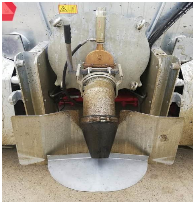
Slika 10. Mlaznica na cisterni Peecon Euroline