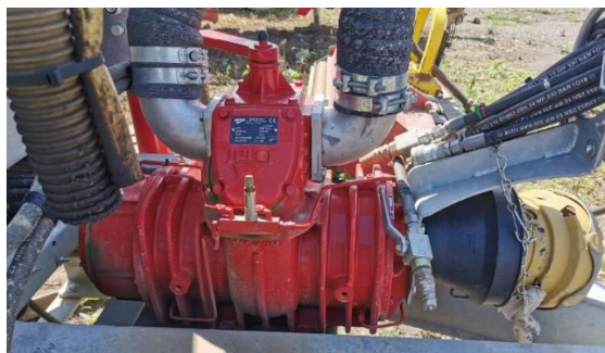
Slika 7. Crpka cisterne Peecon Euroline

Model vakuumske crpke koja se nalazi na cisterni Peecon Euroline je Jurop PN58 . Maksimalna brzina crpke je 1300 okr/min, a maksimalan podtlak je 92 %. Maksimalan tlak koji crpka stvara u cisterni je 1,5 bar. Nadalje, crpka pri 1000 okr/min i maksimalno može ostvariti protok od 6 200 l gnojovke u minuti (Link 6.).