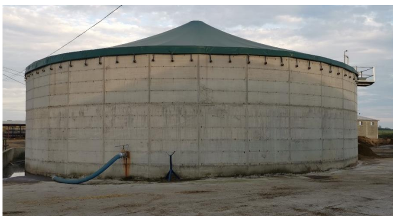
Slika 3. Nadzemni dio lagune na gospodarstvu Grube d.o.o.

Gospodarstvo Grube d.o.o. osnovano je 2001. godine u mjestu Potnjani koje se nalazi u blizini grada Đakova (Slika 4.). Gospodarstvo je osnovao gospodin Branko Kolak, koji uz sebe ima još zaposlenih 14 radnika. Od 14 radnika koje firma broji, 2 radnika su sa VSS, a ostalih 12 su sa SSS, vidljivo u tablici 1. Gospodarstvo Grube d.o.o. raspolaže sa 347 ha zemljišne klase oranica na kojima se uzgajaju razne poljoprivredne kulture i to većinom one koje su potrebne za prehranu stoke u farmi, vidljivo u tablici 2. Mehanizacijom kojom raspolaže gospodarstvo je u zadnjih 3 godine uveliko obnovljena, ponajprije zahvaljujući europskim fondovima i uz nešto investiranja vlastitog novca, vidljivo u tablici 3. Poljoprivredno gospodarstvo posjeduje 250 muznih krava, 120 junica, 350 bikova i oko 100 teladi, a nalazi se na istoj površini gdje i samo sjedište gospodarstva.