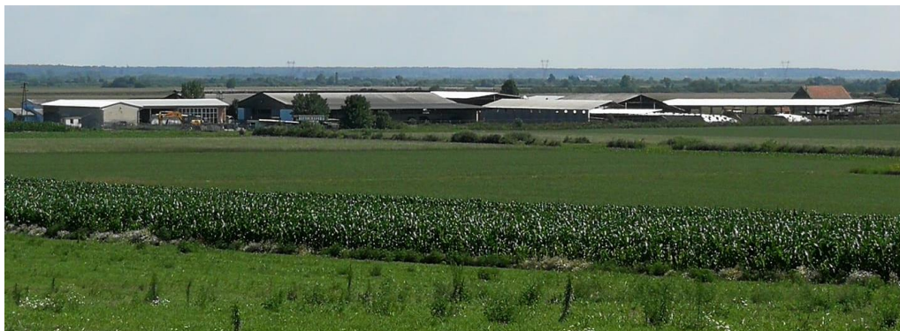
Slika 4. Poljoprivredno gospodarstvo Grube d.o.o.