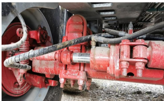
Slika 15. Prateća osovina na cisterni Peecon Euroline

Zbog velike nosivosti cisterne u dodatnoj opremi se nalazi prateća osovina koja smanjuje opterećenje na pneumaticima. Također prateća osovina olakšava manipuliranje sa cisternom prilikom izbacivanja gnojovke. Prateća osovina uključuje se na način da se u traktoru ručica za hidrauliku stavi u plutajući položaj prilikom kretanja cisterne unaprijed, a prije kretanja unazad hidraulika se zablokira. Na zadnjoj osovini se nalaze hidraulični klipovi koji omogućavaju da se pneumatici zakreću u željenom smjeru.