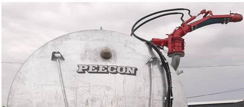
Slika 11. Top mlaznica u radnom položaju

Top mlaznica se nalazi na stražnjem dijelu cisterne i povezana je sa cijevi koja je spojena na dodatnu crpku i stvara veliki tlak, kako bi mlaznica mogla raspodijeliti gnojovku u daljinu. Top se može usmjeravati u bilo kojem smjeru putem računala koje se nalazi u kabini traktora. Računalo upravlja hidraulikom koja je povezana sa crijevima od traktora do topa. Udaljenost koju top može ostvariti je do 50 m.