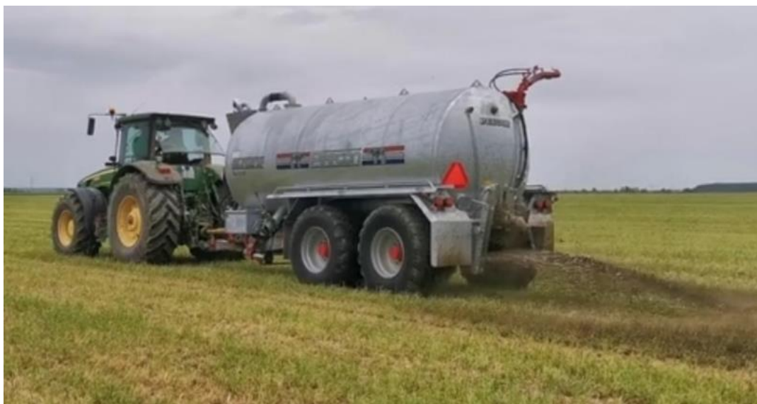
Slika 6. Prikaz cisterne Peecon Euroline u radu

Od suvremenih strojeva za gnojidbu, pa tako i cisterni, zahtijeva se izvoz gnojivke sa farme na poljoprivredne površine. Cisterna pogon dobiva od traktora, tj. agregata, s kojim je povezana priključnim vratilom. Crpka, koja stvara podtlak u cisterni potreban za povlačenje gnojivke u istu, pali se u istom trenutku kada se pokrene priključno vratilo. Nadalje, potrebno je spojiti lagunu i cisternu sa crijevom i otvoriti ventil kako bi gnojivka mogla ulaziti u cisternu. Nakon toga, potrebno je ručicu na crpki staviti u određeni položaj kako bi se pokrenulo uvlačenje gnojivke iz lagune. Stvaranjem podtlaka u cisterni pokreće se uvlačenje gnojivke iz lagune u cisternu. Uvlačenje gnojivke traje 5-6 minuta, a razina gnojivke u cisterni prati se pomoću staklene cijevi koja se nalazi na prednjoj strani cisterne. Kada dosegne maksimalan kapacitet svog obujma potrebno je ugasiti priključno vratilo kako se ne bi stvarao podtlak u cisterni i zatvoriti ventil kako gnojivka ne bi istjecala iz cisterne (Link 5.). Nadalje, potrebno je okrenuti ručicu na crpki u položaj kojim se omogućuje stvaranje tlaka u cisterni, a kasnije i izbacivanje gnojivke na poljoprivrednu površinu. Dolaskom na parcelu priključno vratilo se ponovno pali koje je potrebno za stvaranje tlaka u cisterni i otvara ventil koji se nalazi na stražnjoj strani cisterne. Mlaznica koja je priključena na spomenuti ventil na stražnjoj strani cisterne, ili top s vrha cisterne omogućavaju ravnomjerno raspršivanje gnojivke po tlu.