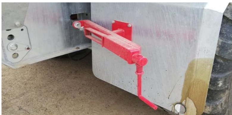
Slika 14. Ručna kočnica na cisterni Peecon Euroline

Ručna kočnica se primjenjuje prilikom otkaçivanja cisterne od traktora kako bi se pneumatici zakočili i ne bi došlo do pomicanja cisterne. Ručna kočnica se aktivira zakretanjem poluge (Slika 14.) te se pritom zateže sajla koja pakne pritisne uz čeljust i na taj način onemogućí pomicanje kotača.