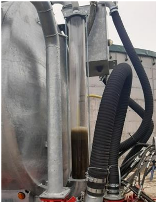
Slika 9. Staklena cijev na cisterni Peecon Euroline

Staklena cijev nalazi se na prednjoj strani cisterne i pomoću nje može se vidjeti, odnosno pratiti količina gnojovke unutar spremnika. Cijev se taktički nalazi na ovoj strani cisterne kako bi se mogla pratiti razina gnojovke u radu dok se osoba nalazi u traktoru. Na gornjoj i donjoj strani staklene cijevi nalaze se brtve koje su međusobno povezane šipkama beskonačnog navoja.