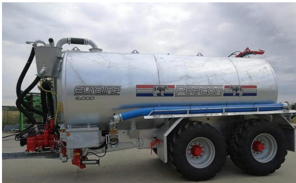
Slika 5. Cisterna za gnoj Peecon Euroline

Peecon Euroline cisterne za gnojnicu dostupne su s obujmom između 7 500 i 20 000 l. Ovi spremnici osiguravaju minimalni tlak po \text{cm}^2 jer, u pravilu, imaju četiri pneumatika 600/65R38. Zahvaljujući velikoj nosivosti ovih pneumatika, spremnici su idealni za gnojidbu travnjaka. Kotači i osovine mogu se horizontalno okretati, što pruža dodatnu udobnost, sigurnost i stabilnost spremnika. Peecon Euroline cisterne za tekući stajski gnoj s višestrukim kotačima imaju samonosivu konstrukciju s integriranom šasijom te su iz tog razloga izdržljive, kompaktne i lagane. Spremnici su debljine 6 mm te su pocinčani, iznutra i izvana. Peecon Euroline cisterna ima vezu od 15,24 cm s brzom spojnicom na prednjoj lijevoj strani i dodatnom slijepom prirubnicom na prednjoj desnoj, stražnjoj lijevoj i stražnjoj desnoj strani. Spremnik straga ima hidraulički ventil od 15,24 cm, a pripremljen je za opremu za dizanje u 4 točke. Svi spremnici, standardno, imaju hidraulički ovješene vučne šipke. Peecon Euroline cisterna (Slika 5.) ima obujam od 16 000 l, ukupno je duga 7,25 m, a duljina samog spremnika je 5,58 m. Visoka je 3,7 m, a prazna ima masu od 6000 kg (Link 4.).