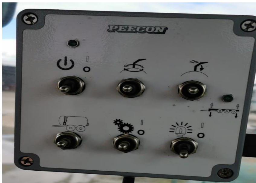
Slika 12. Računalo koje upravlja top – mlaznicom