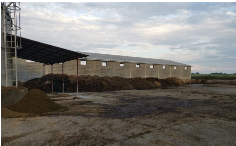
Slika 2. Kruti ostaci gnojovke