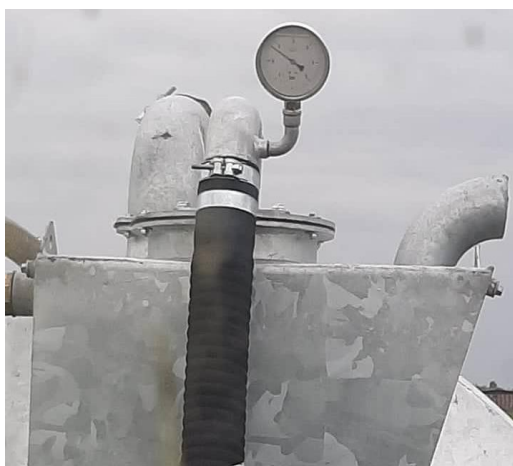
Slika 17. Tlakomjer u radu na cisterni Peecon Euroline

Tlakomjer se nalazi na prednjoj strani cisterne s ciljem kako bi uočljiv osobi iz traktora. Kada se gnojovka izbacuje iz cisterne tlak varira od 1,2 bara do 1.8 bara. Prilikom uvlačenja gnojovke u cisternu tlakomjer mjeri podtlak -0.4 bara do -1 bara.