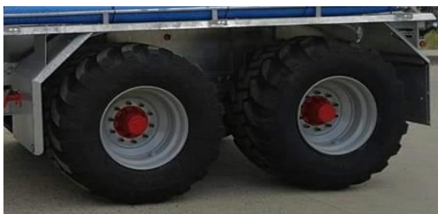
Slika 16. Pneumatici na cisterni Peecon Euroline

Pneumatici dolaze u raznim dimenzijama, različitih su izbočina i drugačijih kvaliteta gume. Kod strojeva kao što je cisterna pneumatici imaju veliku ulogu zbog toga što na sebi prenose veliki teret i pritom je bitno da što manje sabijaju tlo. Pneumatici koji se nalaze na cisterni Peecon Euroline su Alliance 650/55R26.5 . Maksimalna brzina koja je preporučena zbog sigurnosti iznosi 70 km/h, a tlak u pneumaticima je preporučan 4 bara (Link 7.).