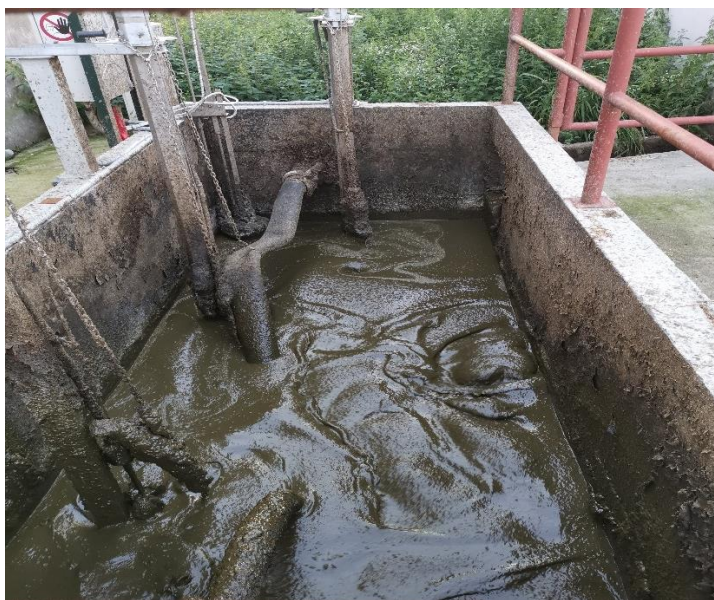
Slika 1. Miješanje gnojovke na gospodarstvu Grube d.o.o.

Na gospodarstvu Grube d.o.o. stajski gnoj se zbrinjava na adekvatan način tj. po zakonu koje je propisalo Ministarstvo poljoprivrede. Na laguni je postavljen separator koji odvaja kruti dio gnoja od tekućeg (Slika 1. i Slika 2.). Tekući gnoj se skladišti u lagunu dok se kruti gnoj skladišti na pistu pored lagune gdje i sazrijeva. Laguna je kapacitetom predviđena da se gnojovka može sakupljati tokom 6 mjeseci. Obujam lagune iznosi 2 600 m 3 , odnosno 21 m promjera, 2.5 m ukopana u tlu i visine 5 m. Lagune ili spremnici se izgrađuju od vodonepropusnog materijala, kako ne bi dolazilo otjecanja gnojovke i do zagađenja podzemnih voda. Krov od lagune je izrađen od najlona tj. cerade kako se ne bi širio neugodan miris i kako ne bi dolazilo do punjenja lagune oborinskim vodama. Na laguni se nalazi otvor gdje se cisterna spaja crijevom kroz koje se gnojovka ispušta iz lagune (Slika 3.).