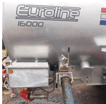
Slika 8. Ventil na cisterni Peecon Euroline i priključno crijevo

Priključno crijevo je dugačko 6 m sa pocinčanim dijelovima na kraju crijeva te se pomoću njega gnojovka iz lagune pretače u cisternu. Crijevo se spaja na brzu spojku koja se nalazi na cisterni te se potom ručno otvara ili zatvara sigurnosni ventil ovisno o tome što se u tome trenutku radi. Ventil osigurava da gnojovka ne istječe iz cisterne u trenucima kada nije crijevom spojena na lagunu.