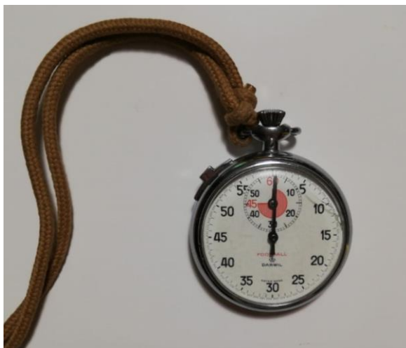
Slika 18. Analogna štoperica Darwil

Kronometriranje je obavljeno analognom štopericom preciznosti 0,1 s (Slika 18.).